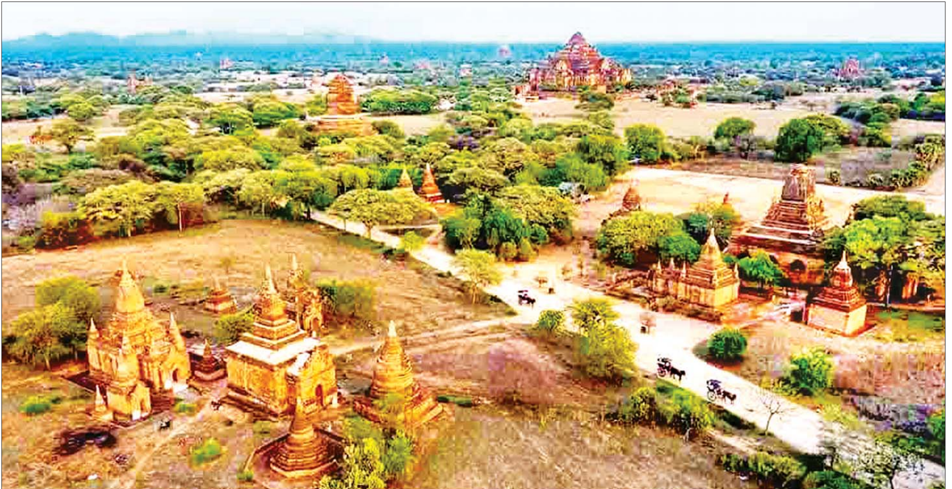
ကိုဗစ်-၁၉ ရောဂါ ကာကွယ်ရေးစည်းကမ်းချက်များနှင့်အညီ ပြန်လည်ဖွင့်လှစ်လိုက်သည့် ပုဂံညောင်ဦး ရှေးဟောင်းယဉ်ကျေးမှုနယ်မြေရှိ ဘုရားစေတီ၊ ပုထိုးများကို တွေ့ရစဉ်။

ရန်ကုန် ဖေဖော်ဝါရီ ၈ မြန်မာနိုင်ငံ၏ အထင်ကရ စေတီတော် မြတ်ကြီးဖြစ်သော ရန်ကုန်မြို့ရှိ ရွှေတိဂုံစေတီတော်မြတ်ကြီးကို ကိုဗစ်-၁၉ ကပ်ရောဂါကြောင့် အများပြည်သူဖွင့်ခွင့် ယာယီပိတ်ထားရာမှ ယနေ့နံနက်ပိုင်းတွင် ကျန်းမာရေးနှင့် အားကစားဝန်ကြီးဌာနက ချမှတ်ထားသော စည်းကမ်းချက်များနှင့်အညီ ပြန်လည်ဖွင့်လှစ်ရာ ကနဦးပထမဆုံးနေ့တွင် ခွင့်ပြုထားသည့် ရဟန်း၊ သံဃာနှင့် သီလရှင် စုစုပေါင်း ၃၈၄ ပါး လာရောက်ဖူးမြော်ကြကြောင်း ရွှေတိဂုံစေတီတော်ဘဏ္ဍာတော်ထိန်းဂေါပကအဖွဲ့ရုံးမှ သိရသည်။ ယင်းသို့ ရွှေတိဂုံစေတီမြတ်ကြီးအား စတင်ဖွင့်ခွင့်ပြုရာတွင် အချိန်ကန့်သတ်မှုဖြင့် ပိုင်းခြားသတ်မှတ်ခဲ့ရာ နံနက် ၆ နာရီမှ ၇ နာရီ၊ နံနက် ၈ နာရီမှ ၉ နာရီနှင့် နံနက် ၁၀ နာရီမှ ၁၁ နာရီ အချိန်များတွင် ကိုဗစ်-၁၉ ရောဂါ ကန့်သတ်ချက်များနှင့်အညီ ဖွင့်ခွင့်ပြုခဲ့ပြီး နေ့လယ်ပိုင်းတွင် မွန်းလွဲ ၁ နာရီမှ ၂ နာရီအထိ၊ မွန်းလွဲ ၃ နာရီမှ ညနေ ၄ နာရီအထိနှင့် ညနေပိုင်းတွင် ညနေ ၅ နာရီမှ ၆ နာရီအထိ အချိန်ပိုင်းခြားဖွင့်ခွင့်ပြုထား၍ ဘုရားရင်ပြင်သို့ တက်ရောက် ဖူးမြော်ခွင့်ကိုလည်း အရေအတွက်အားဖြင့် ကန့်သတ်စေလွှတ်ကြောင်း သိရသည်။ စေတီတော်ကြီး စတင်ဖွင့်လှစ်သည့် ဖေဖော်ဝါရီ ၈ ရက်နှင့် ၉ ရက်တို့တွင် ရဟန်း၊ သံဃာနှင့် စာမျက်နှာ ၁၇ ကော်လံ ၁၂