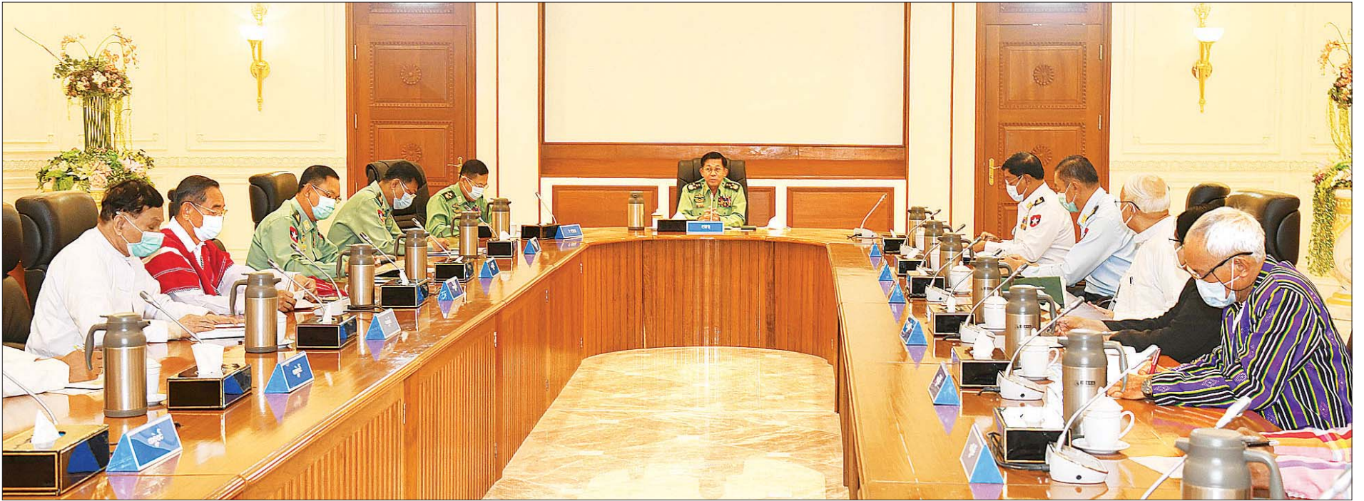
နိုင်ငံတော်စီမံအုပ်ချုပ်ရေးကောင်စီဥက္ကဋ္ဌ၊ တပ်မတော်ကာကွယ်ရေးဦးစီးချုပ် ဗိုလ်ချုပ်မှူးကြီး မင်းအောင်လှိုင် နိုင်ငံတော်စီမံအုပ်ချုပ်ရေးကောင်စီအဖွဲ့ဝင်များအား တွေ့ဆုံပြီး နိုင်ငံရေး၊ စီးပွားရေး၊ လူမှုရေး၊ အုပ်ချုပ်ရေး၊ ငြိမ်းချမ်းရေး၊ တရားဥပဒေစိုးမိုးရေးတို့နှင့် စပ်လျဉ်း၍ ရှင်းလင်းပြောကြားစဉ်။