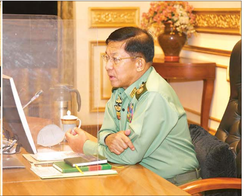
နိုင်ငံတော်စီမံအုပ်ချုပ်ရေးကောင်စီဥက္ကဋ္ဌ၊ တပ်မတော်ကာကွယ်ရေးဦးစီးချုပ် ဗိုလ်ချုပ်မှူးကြီးမင်းအောင်လှိုင် စီမံခန့်ခွဲရေးအစည်းအဝေးတွင် အမှာစကားပြောကြားစဉ်။