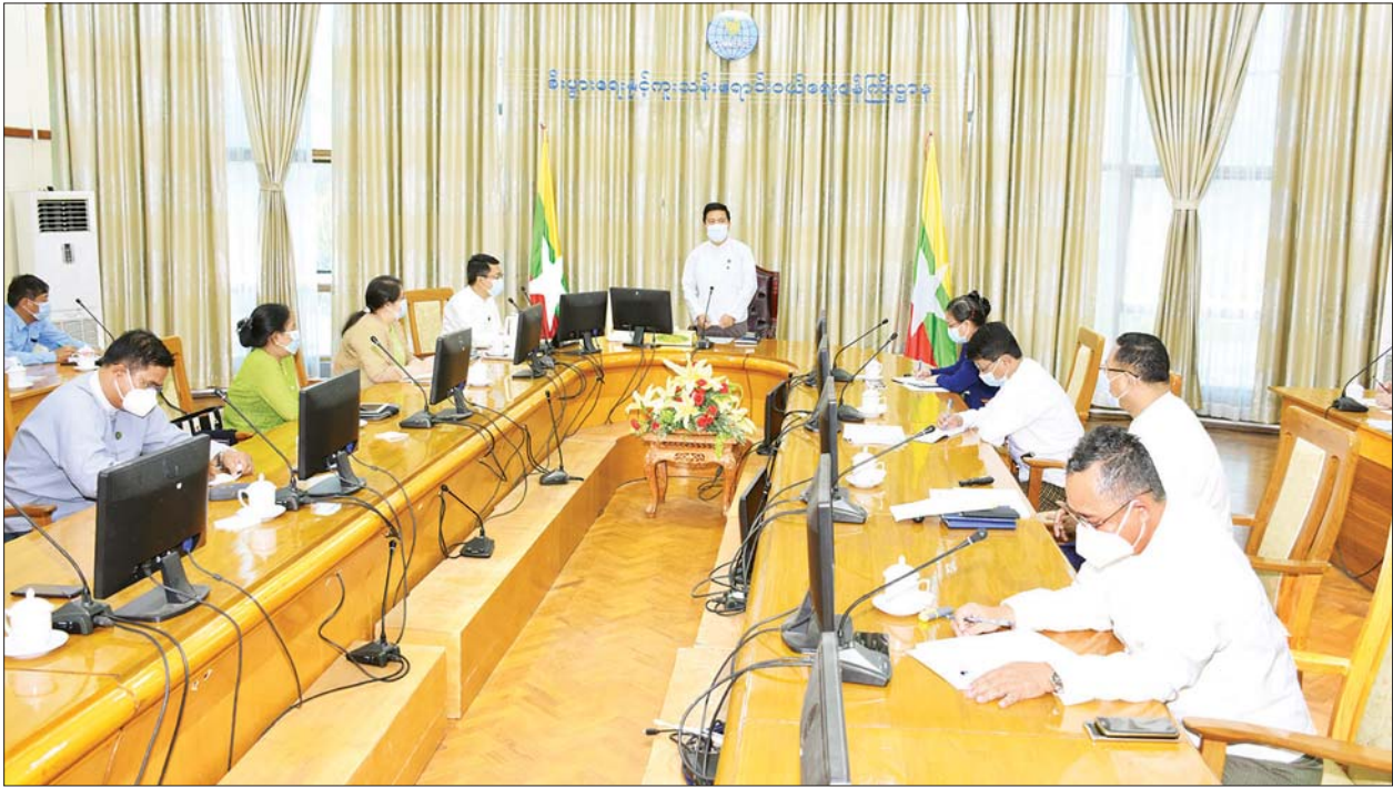
အဆိုပါအခမ်းအနားသို့ စီးပွားရေးနှင့် ကူးသန်းရောင်းဝယ်ရေးဝန်ကြီး ဌာနမှ အမြဲတမ်းအတွင်းဝန်၊ ညွှန်ကြားရေးမှူးချုပ်များ၊ ဒုတိယအမြဲတမ်း အတွင်းဝန်၊ ဒုတိယညွှန်ကြားရေးမှူးချုပ်များနှင့် ညွှန်ကြားရေးမှူးများ တက်ရောက်ခဲ့ကြကြောင်း သတင်းရရှိသည်။ သတင်းစဉ်

နေပြည်တော် ဖေဖော်ဝါရီ ၈ ကုန်သွယ်ရေးဦးစီးဌာန၏ လုပ်ငန်းအကောင်အထည်ဖော်ဆောင်ရွက်မှု အခြေအနေများနှင့် စပ်လျဉ်း၍ ရှင်းလင်းတင်ပြသည့် အခမ်းအနားကို ယနေ့ မွန်းလွဲ ၂ နာရီတွင် စီးပွားရေးနှင့် ကူးသန်းရောင်းဝယ်ရေးဝန်ကြီးဌာန ခန်းမ(၁) ၌ ကျင်းပရာ စီးပွားရေးနှင့် ကူးသန်းရောင်းဝယ်ရေးဝန်ကြီးဌာန ပြည်ထောင်စု ဝန်ကြီး ဒေါက်တာပွင့်ဆန်း တက်ရောက်အမှာစကားပြောကြားသည်။(ယာပုံ) ပြည်ထောင်စုဝန်ကြီးက မိမိတို့ဝန်ကြီးဌာနအနေဖြင့် နိုင်ငံ၏ စီးပွားရေး၊ ကုန်သွယ်မှုကဏ္ဍများ အရှိန်အဟုန်ဖြင့် ဖွံ့ဖြိုးတိုးတက်ရေးအတွက် တာဝန်ယူ ဆောင်ရွက်ရမည်ဖြစ်ပါကြောင်း၊ ပြည်ပနိုင်ငံရှိ စီးပွားရေးသမားများအနေဖြင့် လည်း မြန်မာ့ပို့ကုန်များ နိုင်ငံတကာသို့ ပို့မိတင်ပို့နိုင်ရေးအတွက် ပြုစုများ၊ ဈေးကွက်ရှာဖွေချိတ်ဆက်ခြင်းများကို ပိုမို တွန်းအားပေးဆောင်ရွက်သွားရမည် ဖြစ်ပါကြောင်း၊ ကိုဗစ်-၁၉ ကပ်ရောဂါကာလအတွင်း ကြုံတွေ့ခဲ့သည့်အခက်အခဲ များကြောင့် e-Commerce လုပ်ငန်းများပိုမိုဖွံ့ဖြိုးတိုးတက်လာရေးကိုလည်း အားပေးဆောင်ရွက်သွားရမည်ဖြစ်ပါကြောင်း၊ တစ်ဖက်တွင် နိုင်ငံ၏စီးပွားရေး ကဏ္ဍတိုးတက်အောင် ဆောင်ရွက်ရမည်ဖြစ်သကဲ့သို့ မိမိတို့ဝန်ကြီးဌာနရှိ ဝန်ထမ်းများ၏ သက်သာချောင်ချိရေး၊ ကျန်းမာရေးစသည့်ကဏ္ဍများကို ပံ့ပိုး ဆောင်ရွက်သွားရန် လိုအပ်ပါကြောင်းပြောကြားသည်။ ဆက်လက်၍ ကုန်သွယ်ရေးဦးစီးဌာန၊ ဒုတိယညွှန်ကြားရေးမှူးချုပ် ဦးမြင့် သူရက လုပ်ငန်းအကောင်အထည်ဖော်ဆောင်ရွက်မှုအခြေအနေများနှင့် ရှေ့ဆက် ဆောင်ရွက်ရမည့်လုပ်ငန်းစဉ်များကို အသေးစိတ်ရှင်းလင်းတင်ပြပြီး အမြဲတမ်း အတွင်းဝန် ဦးမင်းမင်းက ထပ်မံဖြည့်စွက် ရှင်းလင်းတင်ပြရာ ပြည်ထောင်စု ဝန်ကြီးက ရှင်းလင်းတင်ပြချက်များအပေါ် လိုအပ်သည်များ ဖြည့်စွက်လမ်းညွှန် မှာကြားသည်။