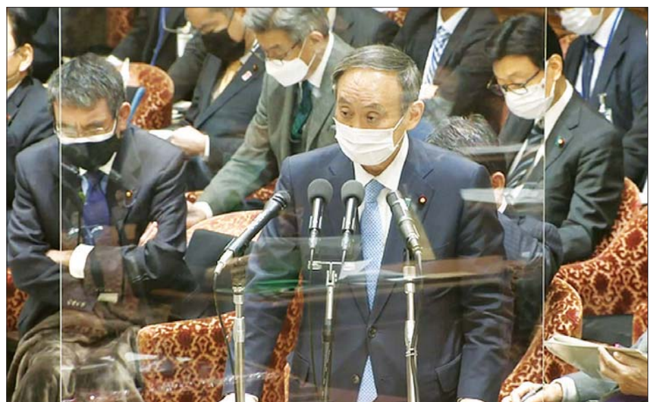
ဂျပန်ဝန်ကြီးချုပ် ဆူဂါ ယိုရှိဟိဒဲ မိန့်ခွန်းပြောကြားနေစဉ်။