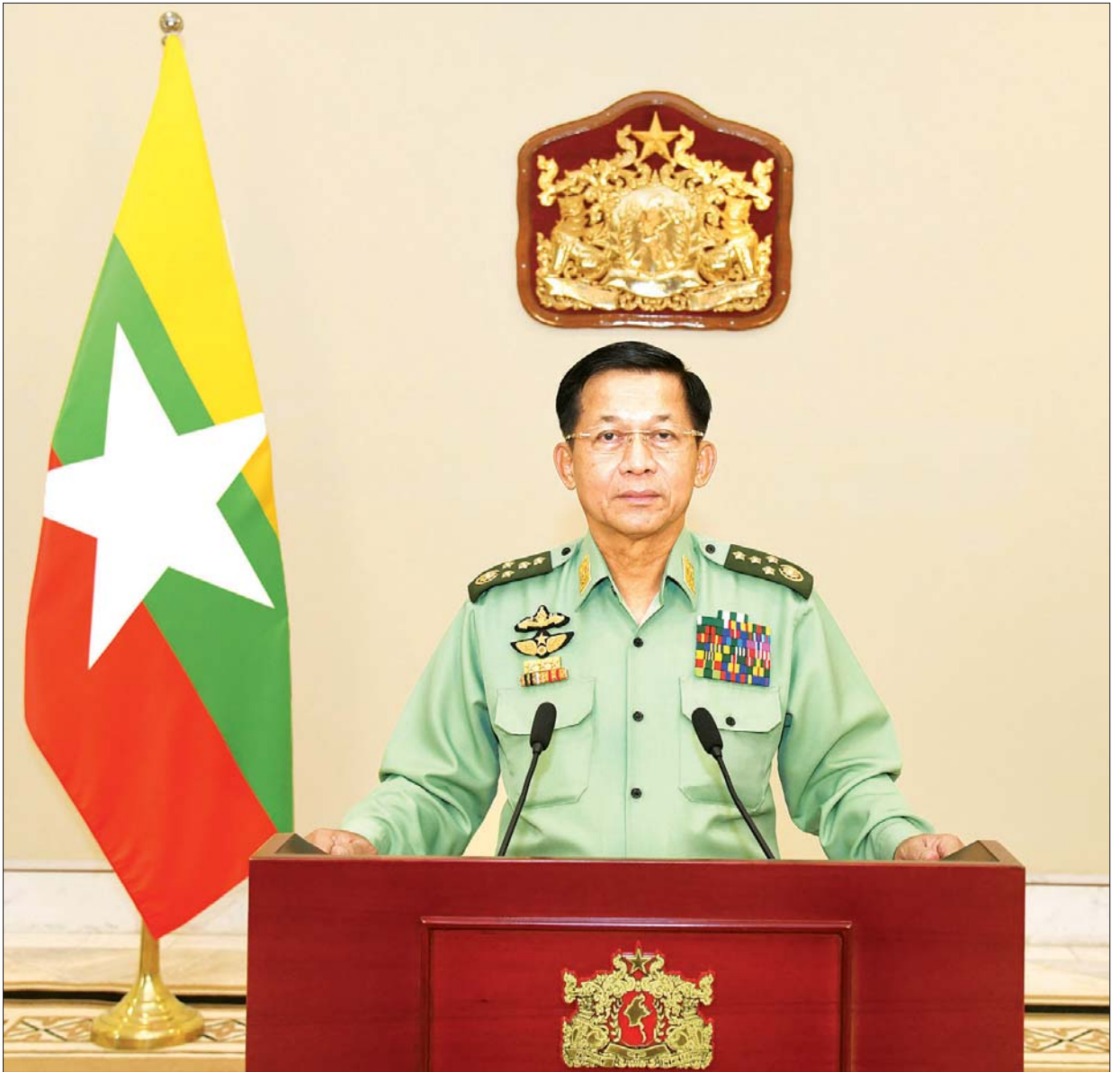
ပြည်ထောင်စုသမ္မတမြန်မာနိုင်ငံတော်၊ နိုင်ငံတော်စီမံအုပ်ချုပ်ရေးကောင်စီ ဥက္ကဋ္ဌ ဗိုလ်ချုပ်မှူးကြီး မင်းအောင်လှိုင် နိုင်ငံတော်၏ အခြေအနေအရပ်ရပ်အား ပြည်သူလူထုသို့ မိန့်ခွန်းပြောကြားစဉ်။ သတင်းစဉ်

ပြည်ထောင်စုဖွား တိုင်းရင်းသား ပြည်သူများခင်ဗျာ တပ်မတော်ဟာ ခေတ်အဆက်ဆက် ပြည်သူ့နဲ့ ပတ်သက်လာလျှင် “ပြည်သူသာအဓိ၊ ပြည်သူသာအဖ” ဆိုတဲ့ ဆောင်ပုဒ်ကို ဦးထိပ်ထား ဆောင်ရွက်ခဲ့တဲ့ အဖွဲ့အစည်းလည်းဖြစ်ပါတယ်။ နိုင်ငံတော်ရဲ့ အမျိုးသား နိုင်ငံရေး ဦးဆောင်မှုအခန်းကဏ္ဍကိုလည်း မဖောက်မပြန် နိုင်နိုင်မာမာ ရပ်တည်နေတဲ့ အဖွဲ့အစည်းလည်းဖြစ်ပါတယ်။ ၂၀၀၈ ခုနှစ် ဖွဲ့စည်းပုံအခြေခံ ဥပဒေပါပြဋ္ဌာန်းချက်များကို လေးစားလိုက်နာလျက်ရှိတဲ့ အဖွဲ့အစည်းတစ်ခု လည်းဖြစ်ပါတယ်။ တပ်မတော်အနေဖြင့် ခေတ်အဆက်ဆက်ကပင် ပြည်သူ တို့လိုလားတောင်းဆိုတဲ့ “ပါတီစုံဒီမိုကရေစီစနစ်” ကို ဆွေးနွေးညှိနှိုင်းခြင်း နည်းလမ်းများ၊ ဥပဒေ၊ လုပ်ထုံးလုပ်နည်းများအရ ဆောင်ရွက်ခြင်း နည်းလမ်း စတဲ့နိုင်ငံရေးယဉ်ကျေးမှုများဖြင့် တည်ငြိမ်အေးချမ်းစွာ အသွင် ကူးပြောင်းပေးခဲ့ကြောင်း ဦးစွာပြောကြားလိုပါတယ်။ ပါတီစုံဒီမိုကရေစီစနစ်မှာ တရားမျှတပြီး လွတ်လပ်တဲ့ ရွေးကောက်ပွဲ များဟာ ဒီမိုကရေစီစနစ် ရေရှည်တည်တံ့ခိုင်မာစေရေးအတွက် အဓိက လိုအပ်ချက်ပဲဖြစ်ပါတယ်။ ဒါ့ကြောင့် ကျွန်တော့်အနေနဲ့ တစ်တိုင်းပြည်လုံး သို့ပြောကြားခဲ့တဲ့ ၂၀၂၀ ပြည့်နှစ် နှစ်သစ်ကူးမိန့်ခွန်းမှာ “၂၀၂၀ ပြည့်နှစ်ဟာ နိုင်ငံအတွက် အရေးကြီးတဲ့နှစ်ဖြစ်ကြောင်း၊ ရွေးကောက်ပွဲပြုလုပ်မယ့် နှစ်ဖြစ်လို့ ပါတီစုံဒီမိုကရေစီစနစ် ခိုင်မာစေဖို့ အရေးကြီးကြောင်း” ထည့်သွင်း ပြောကြားခဲ့ပါတယ်။ လွတ်လပ်ပြီး တရားမျှတတဲ့ ရွေးကောက်ပွဲများ ဖြစ်စေရေး၊ စာမျက်နှာ ၃ ကော်လံ ၁ ၀