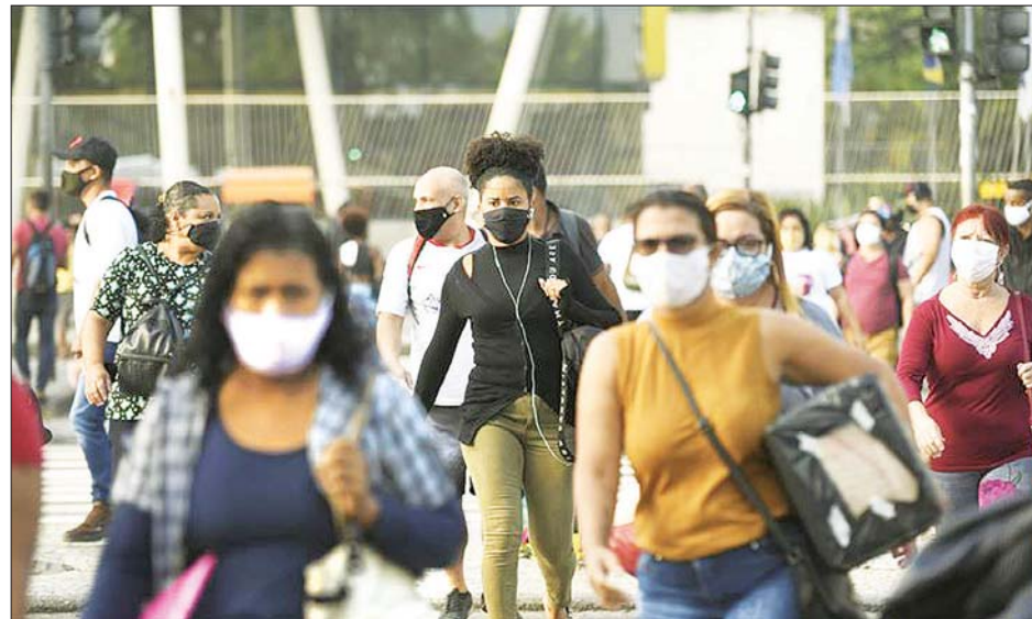
ဘရာဇီးနိုင်ငံတွင် ပြည်သူများသွားလာလှုပ်ရှားနေကြသည်ကို တွေ့ရစဉ်။

ရှိလာပြီဟု ကျန်းမာရေးဝန်ကြီးဌာနက ပြောကြား ဖေဖော်ဝါရီ ၇ ရက်တွင် ပြောကြား ခဲ့သည်။ ထိုစဉ် ကိုဗစ် -၁၉ နှင့်ဆက်စပ် ပြီး သေဆုံးသူ ၅၂၂ ဦးရှိသည့်အတွက် တစ်နိုင်ငံလုံးအနှံ့ သေဆုံးသူစုစုပေါင်း