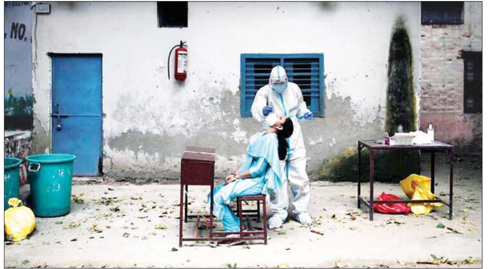
အိန္ဒိယနိုင်ငံတွင် ကိုဗစ် -၁၉ ဆေးစစ်မှု ဆောင်ရွက်နေစဉ်။