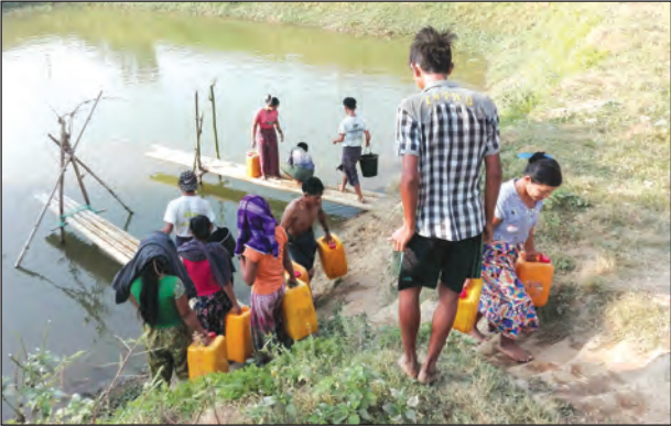
ရွာအပြင်ဘက်ရှိကန်မှရေကို လာရောက်ခပ်ယူနေသော ပြည်သူများ

ညောင်လေးပင် ဧပြီ ၄ ပဲခူးတိုင်းဒေသကြီး၊ ညောင်လေးပင်မြို့နယ် ပြန်တန်ဆာမြို့အနီးရှိ ချောင်းရင်းကျေးရွာအုပ်စု ငါးကြီးအိုင်ကျေးရွာ တောင်ပိုင်းနှင့် မြောက်ပိုင်း၊ ဗန်းမော်တောကျေးရွာနှင့် ဝက်လုံးအိုင်ကျေးရွာတို့ရှိ အိမ်ထောင်စု ၇၄၇ စုမှ လူဦးရေ ၃၀၀၀ ခန့်အနေဖြင့် ယခုနေရာသီအချိန်တွင် သောက်သုံးရေအခက်အခဲများကို စတင် ရင်ဆိုင်ကြုံတွေ့လာရပြီဖြစ်ကြောင်း သိရသည်။