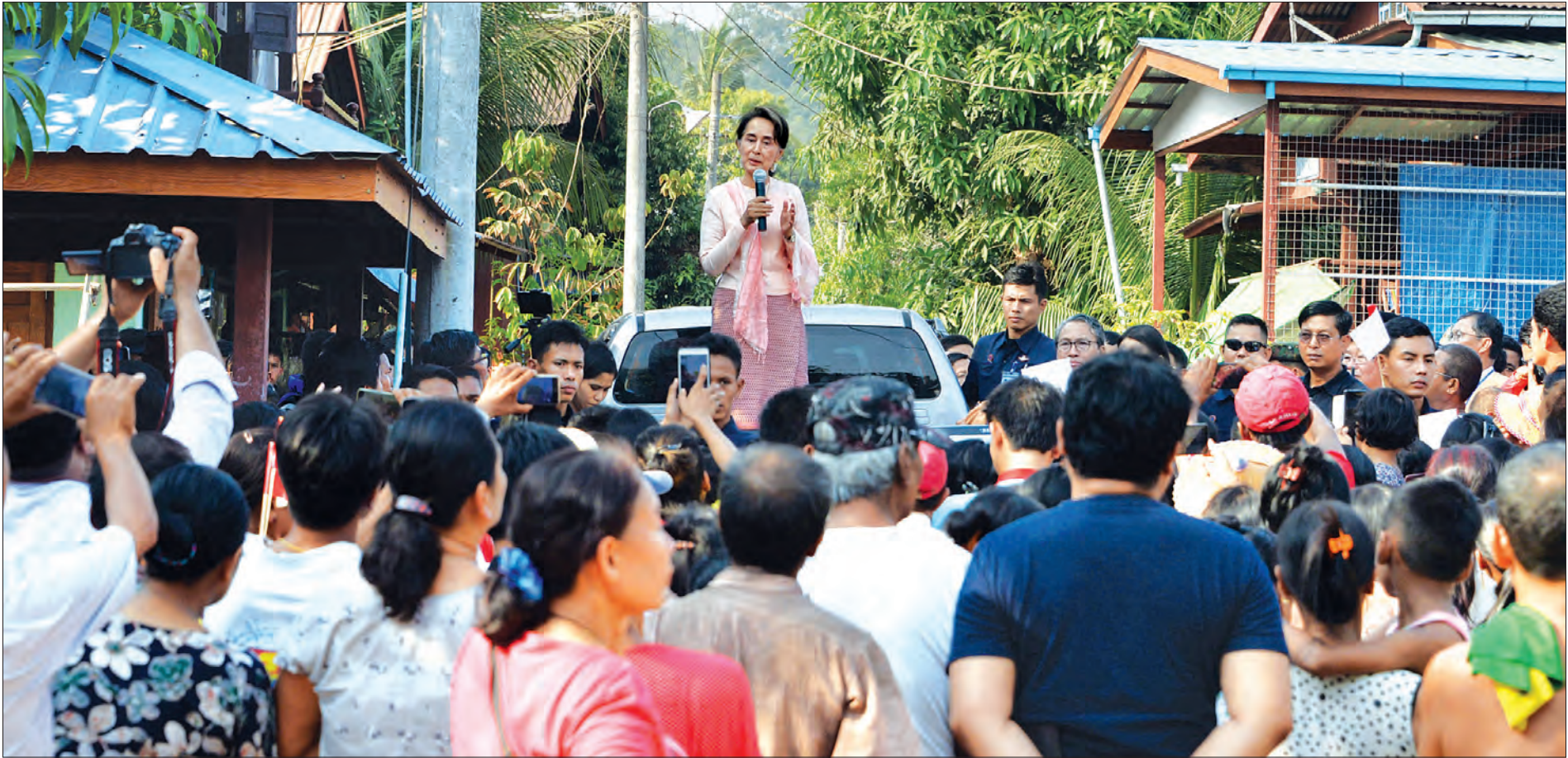
နိုင်ငံတော်၏ အတိုင်ပင်ခံပုဂ္ဂိုလ် ဒေါ်အောင်ဆန်းစုကြည် ချောင်းဆုံမြို့နယ် ရွာလွတ်ကျေးရွာမှ ဒေသခံပြည်သူများအား တွေ့ဆုံအမှာစကားပြောကြားစဉ်။ သတင်းစဉ်

ထို့ကြောင့် မိမိတို့နိုင်ငံတိုးတက်ရာတွင် ညီညီမျှမျှ ဖွံ့ဖြိုးတိုးတက်စေချင်ပါကြောင်း၊ ချမ်းသာမှုနှင့် ဆင်းရဲမှု ကွာခြားလေလေ နိုင်ငံ၏ တည်ငြိမ်မှုနည်းလေဖြစ်ပါကြောင်း၊ ထို့ကြောင့် တစ်နိုင်ငံလုံး ဟန်ချက်ညီညီ ဖွံ့ဖြိုးတိုးတက်စေလိုပါကြောင်း၊ သို့သော် မလွယ်ကူပါကြောင်း၊ တိုင်းဒေသကြီး၊ ပြည်နယ်များသည် ဖွံ့ဖြိုးတိုးတက်မှုမှာ မတူညီပါကြောင်း အချို့တိုင်းဒေသကြီး၊ ပြည်နယ်များတွင် ဖွံ့ဖြိုးတိုးတက်မှုသည် မြန်ဆန်မှုရှိသော်လည်း အချို့တွင် နှေးကွေးနေပါကြောင်း၊ ဖွံ့ဖြိုးတိုးတက်မှုကို ဆောင်ရွက်ရာတွင် မိမိတို့နိုင်ငံသည် ပြည်ထောင်စုနိုင်ငံဖြစ်သည့်အတွက် စီးပွားရေးအတွက်သာမက နိုင်ငံရေးအတွက်လည်း ကြည့်ရပါကြောင်း၊ အချို့ဒေသများတွင် စီးပွားရေးအရ အကျိုးအမြတ် မရှိသော်လည်း လူမှုရေးအရ ပိုမိုအထောက်အကူပြုရန် လိုအပ်သည့်အတွက် ဆောင်ရွက်ရခြင်း ဖြစ်ပါကြောင်း၊ စီးပွားရေးအရ အကျိုးအမြတ်ရှိရေးအတွက်သာ လုပ်ဆောင်၍ မရပါကြောင်း။