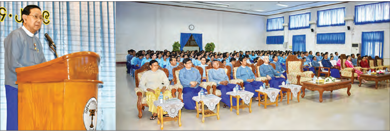
ပြည်ထောင်စုရာထူးဝန်အဖွဲ့ဥက္ကဋ္ဌ ဒေါက်တာဝင်းသိမ်း ပြည်ထောင်စုရာထူးဝန်အဖွဲ့၏ (၈၂) နှစ်မြောက် အဖွဲ့စတင်ဖွဲ့စည်းတည်ထောင်သောနေ့ အထိမ်းအမှတ် အခမ်းအနားတွင် အမှာစကားပြောကြားစဉ်။