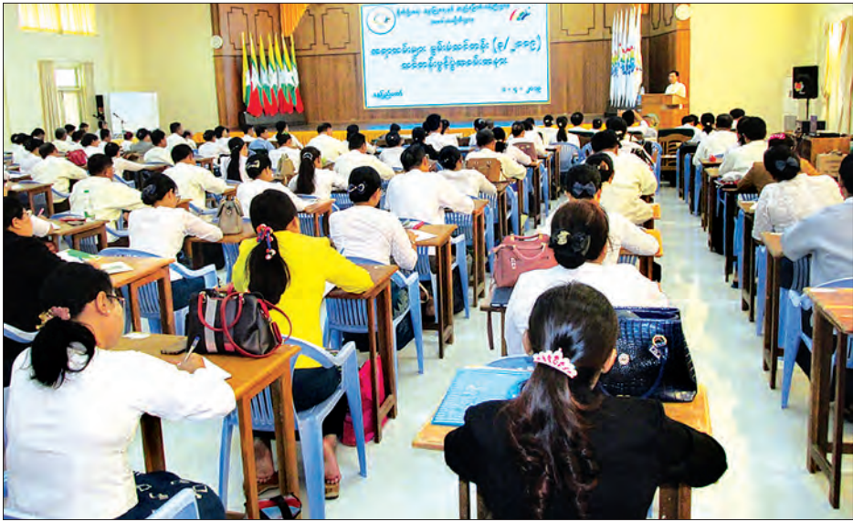
သမဝါယမဦးစီးဌာန၏ လုပ်ငန်းညှိနှိုင်းအစည်းအဝေးကျင်းပစဉ်။