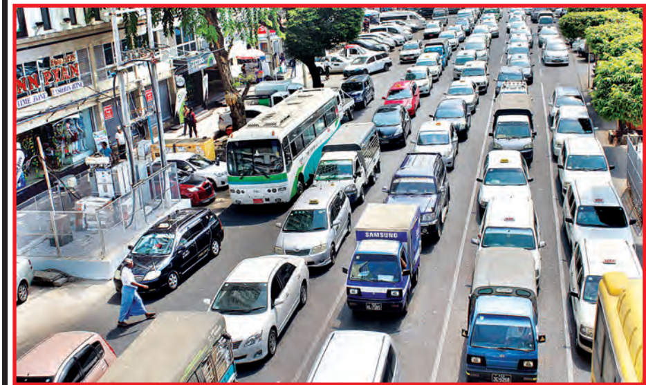
မြို့တွင်း ယာဉ်ကြောကျပ်တည်းမှု မြင်ကွင်းတစ်ခု။

ရန်ကုန်တိုင်းဒေသကြီးအတွင်း ယာဉ်လမ်းအန္တရာယ် လျော့နည်းကျဆင်းရေးအတွက် ၂၀၁၉ ခုနှစ် ဧပြီ ၂ ရက်မှ ၆ ရက်အထိ ယာဉ်လမ်းအန္တရာယ်ကင်းရှင်းရေးလှုပ်ရှားမှုကို ရန်ကုန်တိုင်းဒေသကြီးအစိုးရအဖွဲ့၏ ကြီးကြပ်လမ်းညွှန်မှု၊ မြန်မာနိုင်ငံဆိုင်ရာ ဂျပန်သံရုံး၊ JICA မြန်မာရုံးတို့၏ အထူးကူညီပံ့ပိုးမှုဖြင့် မြန်မာနိုင်ငံ ယာဉ်လမ်းအန္တရာယ်ကင်းရှင်းရေး အဖွဲ့က ဦးစီး၍ ဆောင်ရွက်လျက်ရှိသည်။ ယင်းလှုပ်ရှားမှုကာလအတွင်း ဧပြီ ၃ ရက်က မြင်တွေ့ရသည့် ရန်ကုန်မြို့တွင်း မြင်ကွင်း အချို့တို့ကို မှတ်တမ်းတင် ဖော်ပြလိုက်ပါသည်။