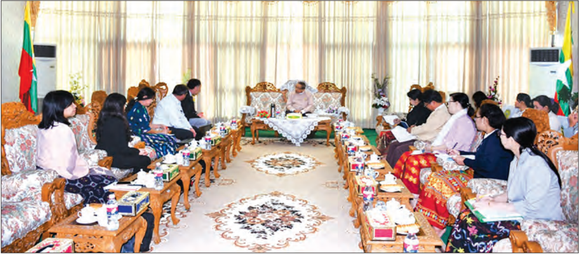
ပြည်ထောင်စုစာရင်းစစ်ချုပ်နှင့် World Bank Mission အဖွဲ့တို့ တွေ့ဆုံဆွေးနွေးစဉ်။

“စစ်ဆေးတွေ့ရှိချက် အစီရင်ခံစာမှာ ဘဏ္ဍာ ရေးဆိုင်ရာ စာရင်းတွေ စစ်ဆေးခြင်းက တွေ့ရှိရတဲ့ စစ်ဆေးတွေ့ရှိချက်တွေအပြင် အသုံးစရိတ်တွေကို