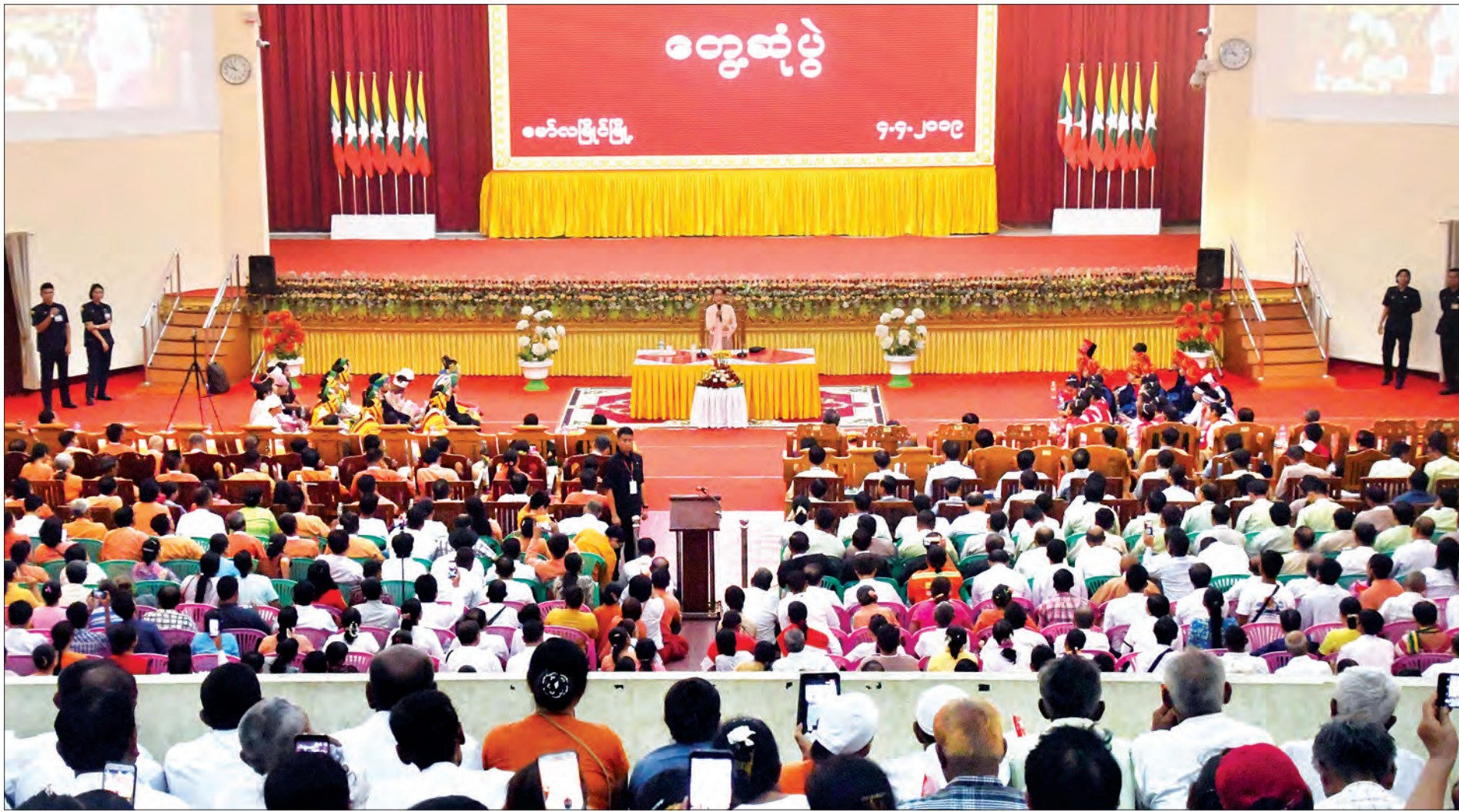
နိုင်ငံတော်၏အတိုင်ပင်ခံပုဂ္ဂိုလ် ဒေါ်အောင်ဆန်းစုကြည် မွန်ပြည်နယ် မော်လမြိုင်မြို့၊ ပြည်နယ်ခန်းမ၌ ဒေသခံပြည်သူများအား တွေ့ဆုံအမှာစကားပြောကြားစဉ်။