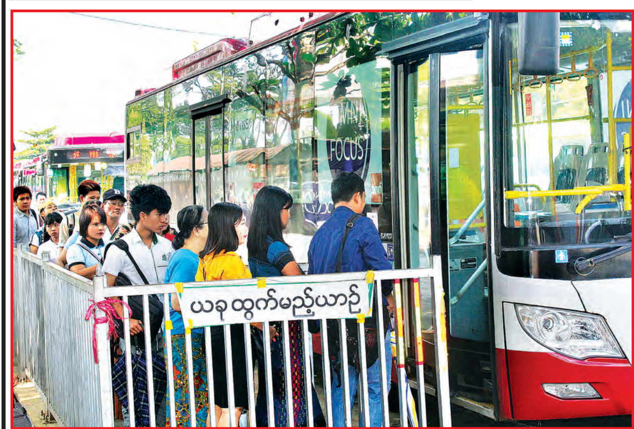
စည်းကမ်းတကျ ရပ်တန့်သောယာဉ်နှင့် စည်းကမ်းတကျ ခရီးသွားလာကြသူများ။