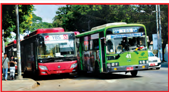
အောက်ကြည့်မြင်တိုင်လမ်းမပေါ် ယာဉ်ကြောနှစ်ထပ် ရပ်တန့်နေမှု။