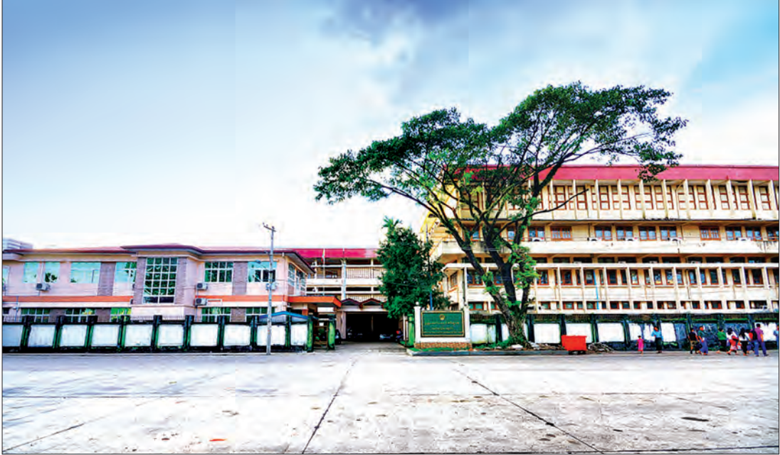
စာရင်းစစ်ချုပ်ရုံး သင်တန်းကျောင်း(ရန်ကုန်)နှင့် ပြည်ထောင်စုစာရင်းစစ်ချုပ်ရုံး သင်တန်းကျောင်းတို့ကို တွေ့ရစဉ်။

မှုအတွက် အထောက်အကူပြုနိုင်ခဲ့သည်။ ပြည်ထောင်စု စာရင်းစစ်ချုပ်ရုံးသည် လုပ်ငန်းဆောင်ရွက်မှုများ ပိုမိုတိုးတက်ကောင်းမွန်ရန်၊ ပွင့်လင်းမြင်သာမှု ပိုမိုရှိလာရန်၊ တာဝန်ခံ/တာဝန်ယူဆောင်ရွက်မှု သေချာစွာရရှိရန်၊ အဂတိလိုက်စားမှုတိုက်ဖျက်ရန်၊ အများပြည်သူ၏ ယုံကြည်ကိုးစားမှု တိုးမြှင့်ရရှိနိုင်ရန်၊ နိုင်ငံသားများ၏ တန်ဖိုးထားမှုနှင့် အကျိုးစီးပွားအတွက် ပြည်သူ့ဘဏ္ဍာ အရင်းအမြစ်များကို စွမ်းဆောင်ရည်ပြည့်ဝပြီး ထိရောက်စွာ ရယူသုံးစွဲခြင်းကို မြှင့်တင်ရန်အတွက် နိုင်ငံတကာစံနှုန်းနှင့်အညီ ဆောင်ရွက်နိုင်သည့် အရည်အသွေးပြည့်ဝသော ဝန်ထမ်းများဖြင့် နိုင်ငံတော်အစိုးရကို အကူအညီပေးနိုင်ရန် ရည်ရွယ်၍ “ပြည်သူ့ဘဏ္ဍာစီမံခန့်ခွဲမှုတိုးတက်ကောင်းမွန်စေရေး ထိန်းကျောင်းရေး” ဆောင်ပုဒ်နှင့်အညီ ကြိုးပမ်းဆောင်ရွက်လျက် ရှိသည်။ ပြည်ထောင်စုစာရင်းစစ်ချုပ်ရုံးနှင့် ဒေသစာရင်းစစ်ရုံးအဆင့်ဆင့်တို့သည် ပြည်ထောင်စုစာရင်းစစ်ချုပ်ဥပဒေပါ အုပ်နှံင်းထားသော တာဝန်များနှင့်အညီ နိုင်ငံနှင့် ပြည်သူလူထု၏ အကျိုးကို အစဉ်ဦးထိပ်ပန်ဆင်ပြီး ပြည်သူ့အကျိုးစီးပွား ဖွံ့ဖြိုးတိုးတက်ရေးကို ရှေးရှု၍ စစ်ဆေးရေးလုပ်ငန်းများကို စွမ်းစွမ်းတမ်း ကြိုးပမ်းစစ်ဆေးဖော်ထုတ်ပြီး ပြည်သူသို့ အစီရင်ခံ ရှင်းလင်းတင်ပြသွားမည်ဖြစ်ကြောင်း ရေးသားတင်ပြလိုက်ရပါသည်။ ။