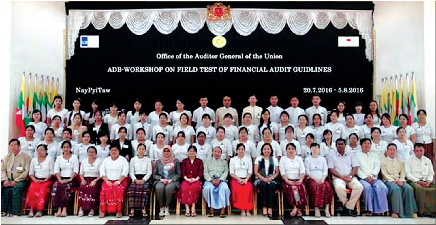
နေပြည်တော်၌ အာရှဖွံ့ဖြိုးရေးဘဏ်က ဖွင့်လှစ်ခဲ့သည့် ဘဏ္ဍာရေးစာရင်းစစ်ဆေးခြင်းအလုပ်ရုံဆွေးနွေးပွဲတွင် ပြည်ထောင်စုစာရင်းစစ်ချုပ်နှင့် စုပေါင်းမှတ်တမ်းတင်ဓာတ်ပုံရိုက်စဉ်။

“မြန်မာနိုင်ငံ စာရင်းကောင်စီသည် ပုဂ္ဂလိက စာရင်းကဏ္ဍနှင့် စာရင်းပညာရှင်များကို ကြီးကြပ်ထိန်းကျောင်းသည့် အဖွဲ့အစည်းတစ်ခု အနေဖြင့် ခေတ်ကာလနှင့် လျော်ညီသည့် ပြုပြင်ပြောင်းလဲတိုးတက်မှုများကို အရှိန်အဟုန်ဖြင့် ဆောင်ရွက်မှုများသည် မြန်မာ့စီးပွားရေးနယ်ပယ်တွင် နိုင်ငံတကာနှင့်အညီ စာရင်းပညာ၊ အခွန်နှင့် ဘဏ္ဍာရေးဆိုင်ရာ စီမံအုပ်ချုပ်မှုများ ဖြစ်ထွန်း ပေါ်ပေါက်မှုအတွက် အထောက်အကူပြုနိုင်”