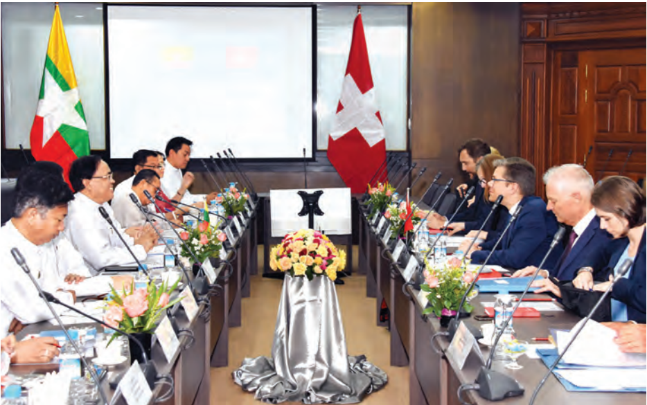
တတိယအကြိမ် မြန်မာ-ဆွစ်ဇာလန် နှစ်နိုင်ငံ နိုင်ငံခြားရေးဝန်ကြီးဌာနများအကြား ဆွေးနွေးပွဲကျင်းပစဉ်။

နေပြည်တော် ဧပြီ ၄ တတိယအကြိမ် မြန်မာ-ဆွစ်ဇာလန် နှစ်နိုင်ငံ နိုင်ငံခြားရေးဝန်ကြီးဌာနများအကြား ဆွေးနွေးပွဲကို နေပြည်တော်ရှိ နိုင်ငံခြားရေးဝန်ကြီးဌာန၌ ယနေ့နံနက်ပိုင်းတွင် ကျင်းပသည်။ အဆိုပါဆွေးနွေးပွဲကို အပြည်ပြည်ဆိုင်ရာ ပူးပေါင်းဆောင်ရွက်ရေးဝန်ကြီးဌာန ပြည်ထောင်စုဝန်ကြီးဦးကျော်တင်နှင့် ဆွစ်ဇာလန်နိုင်ငံခြားရေးဝန်ကြီးဌာန၊ အာရှ-ပစိဖိတ် ဒေသဆိုင်ရာဌာနအကြီးအကဲ H.E. Ambassador Raphael Nageli တို့က ဦးဆောင်ကျင်းပခဲ့ကြသည်။ အမြင်ချင်းဖလှယ် ဆွေးနွေးပွဲတွင် နှစ်နိုင်ငံဆက်ဆံရေး တိုးမြှင့်ရေး၊ ဆွစ်ဇာလန်နိုင်ငံ၏ မြန်မာနိုင်ငံဆိုင်ရာ ပူးပေါင်းဆောင်ရွက်မှုမဟာဗျူဟာ(၂၀၁၉- ၂၀၂၃) အသစ်အောက်မှ စိုက်ပျိုးရေး၊ ကျန်းမာရေး၊ ပညာရေး၊ ကျေးလက်ဒေသဖွံ့ဖြိုးတိုးတက်ရေးလုပ်ငန်းများ၊ ယဉ်ကျေးမှု၊ ခရီးသွားလာရေး၊ ကုန်သွယ်ရေး၊ ရင်းနှီးမြှုပ်နှံမှုနှင့် အသက်မွေးဝမ်းကျောင်းကျွမ်းကျင်မှု မြှင့်တင်ရေးကဏ္ဍတို့တွင် ပူးပေါင်းဆောင်ရွက်မှုများ ပိုမိုမြှင့်တင်သွားရေးကို ဆွေးနွေးအမြင်ချင်းဖလှယ်ခဲ့ကြသည်။ ပူးပေါင်းဆောင်ရွက်ရေးကိစ္စရပ်များ ယင်းနောက် ပြည်ထောင်စုဝန်ကြီးက နိုင်ငံတော်အစိုးရမှ ဦးစားပေးဆောင်ရွက်လျက်ရှိသည့် ကဏ္ဍများ၊ ငြိမ်းချမ်းရေးနှင့် အမျိုးသားပြန်လည်သင့်မြတ်ရေးအတွက် အစိုးရ၏ ကြိုးပမ်းဆောင်ရွက်မှုများနှင့် ရခိုင်ပြည်နယ်တွင် ဖြစ်ပေါ်တိုးတက်မှုတို့ကိုလည်း ရှင်းလင်းအသိပေးခဲ့သည်။ ထို့ပြင် အာဆီယံအပါအဝင် ဒေသတွင်းနှင့် နိုင်ငံတကာမျက်နှာစာ၌ အကျိုးတူပူးပေါင်းဆောင်ရွက်ရေးကိစ္စရပ်များနှင့်စပ်လျဉ်း၍လည်း အမြင်ချင်းဖလှယ်ခဲ့ကြသည်။ တည်ခင်းဧည့်ခံ မွန်းလွဲပိုင်းတွင် ပြည်ထောင်စုဝန်ကြီးသည် ဆွစ်ဇာလန် ကိုယ်စားလှယ်အဖွဲ့အား နေပြည်တော်ရှိ M Gallery ဟိုတယ်၌ အလုပ်သဘော နေ့လယ်စာဖြင့် တည်ခင်းဧည့်ခံခဲ့ကြောင်း သိရသည်။ သတင်းစဉ်