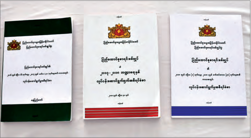
ပြည်ထောင်စု စာရင်းစစ်ချုပ်၏ လုပ်ငန်း ဆောင်ရွက်မှု အစီရင်ခံစာများ