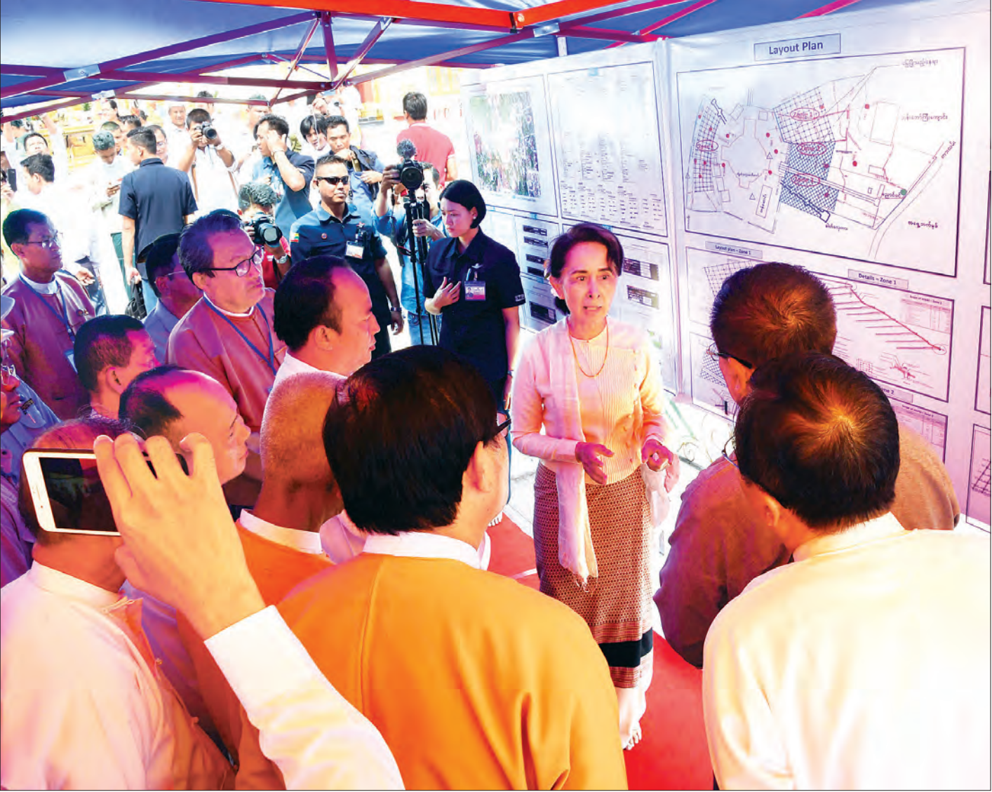
နိုင်ငံတော်၏အတိုင်ပင်ခံပုဂ္ဂိုလ် ဒေါ်အောင်ဆန်းစုကြည် ကျိုက်သလွံ့စေတီတော်မြတ်ကြီး၏ ကုန်းတော် ရေရှည်တည်တံ့ခိုင်မြဲရေးအတွက် ပျက်စီးမှုများအား ပြန်လည်ပြုပြင်ဆောင်ရွက်နေမှု အခြေအနေနှင့်စပ်လျဉ်း၍ တာဝန်ရှိသူများအား လမ်းညွှန်မှာကြားစဉ်။

ပြန်လည်ပြုပြင်တည်ဆောက်ပြီးသည့်အခါတွင် ထိန်းသိမ်းရေးသည် အင်မတန်အရေးကြီးပါကြောင်း၊ ထိန်းသိမ်းရေး လုပ်သည့်အခါတွင် မစမ်းသပ်ဘဲ၊ ကျွမ်းကျင်သည့် ပုဂ္ဂိုလ်များနှင့် မညှိနှိုင်းဘဲ လုပ်ဆောင်၍ မရနိုင်ပါကြောင်း၊ ကျွမ်းကျင်သည့်