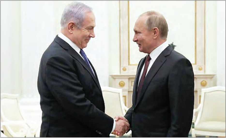
ကရင်မလင်နန်းတော်၌ အစ္စရေးဝန်ကြီးချုပ် နေတန်ယာဟု (ဝဲ)နှင့် ရုရှားသမ္မတ ဗလာဒီမာပူတင် (ယာ) တို့ တွေ့ဆုံစဉ်။

သေဆုံးသွားသည့် အစ္စရေးတပ်ဖွဲ့ဝင်အနေဖြင့် ၎င်း၏အမိမြေပေါ်တွင်