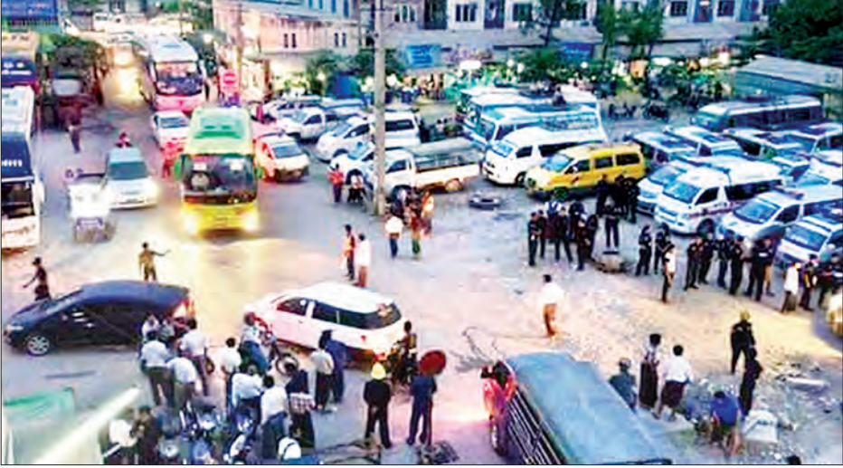
မန္တလေးမြို့ရှိ ကျွဲဆည်ကန် အဝေးပြေးကားဝင်းကို တွေ့ရစဉ်။

မန္တလေး ဧပြီ ၄ မန္တလေးမြို့တွင် အခြေပြု၍ ရန်ကုန်-မန္တလေးသို့ ပြေးဆွဲပေးနေသည့် အဝေးပြေးယာဉ်လိုင်းများမှ ခရီးသွားပြည်သူများ အဆင်ပြေစေရန် သင်္ကြန်ကာလအတွင်း ယာဉ်လိုင်းများ ဆက်လက် ပြေးဆွဲပေးသွားမည် ဖြစ်ကြောင်း မန္တလေးတိုင်းဒေသကြီး ယာဉ်လုပ်ငန်းများ ကြီးကြပ်ရေးကော်မတီဥက္ကဋ္ဌ ဦးအောင်ကျော်လင်းက ပြောကြားသည်။ “အဝေးပြေးယာဉ်လိုင်းတွေ အားလုံးကို သင်္ကြန်အကြိုနေ့အထိ နောက်ဆုံးထား ပြေးဆွဲပေးသွားမှာ ဖြစ်ပေမယ့် ရန်ကုန်-မန္တလေး ယာဉ်လိုင်းတွေကိုတော့ ရပ်နားခြင်းမရှိဘဲ ခရီးသွားတွေ အဆင်ပြေစေဖို့ သင်္ကြန်ကာလအတွင်းမှာလည်း ပြေးဆွဲပေးသွားမှာ ဖြစ်ပါတယ်။ ကားအစီးရေ လျော့သွားပေမယ့် လက်မှတ်ခနွန်းထားတွေကတော့ ပုံမှန်ဈေးနှုန်းပေါ်ရောင်းပြီး ပုံမှန်အချိန်အတိုင်းပဲ ပြေးပေးသွားမှာပါ။ ဂိတ်အိန်ဝန်းကျင်က လက်မှတ်မှောင်ခိုရောင်းသူတွေကြောင့် ယာဉ်