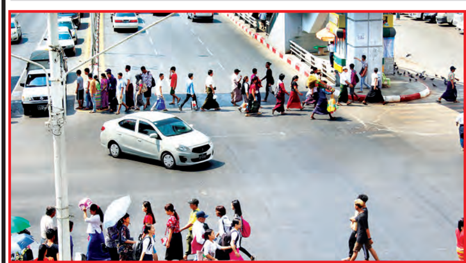
လူကူးခုံးကျော်တံတားများ တည်ဆောက်ပေးထားသော်လည်း ဤသို့စည်းကမ်းမဲ့ လမ်းကူးနေကြသူများကို နေ့စဉ် တွေ့နေရ ဆဲပင်...။