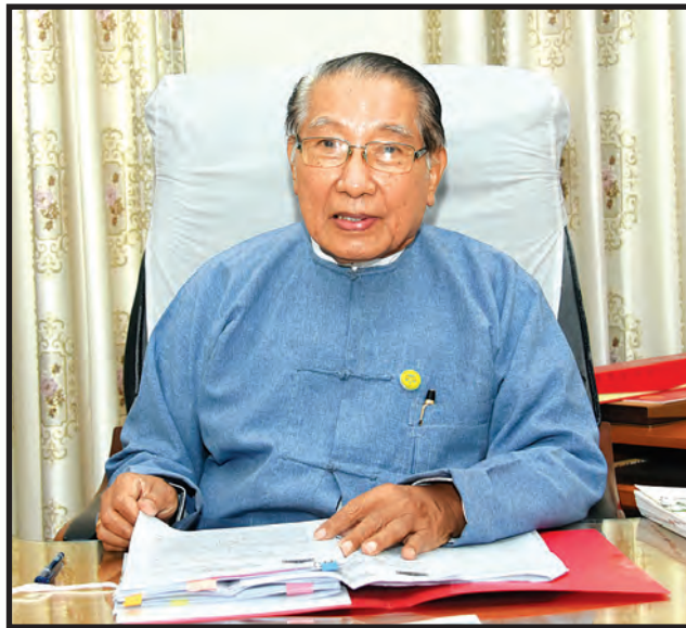
ပြည်ထောင်စုစာရင်းစစ်ချုပ် ဦးမော်သန်း

ခြေပါ ရငွေများကို ပြည့်ဝစွာရရှိစေရန်၊ သုံးစွဲခွင့်ပြုထားသည့် ငွေကြေးများကို ထိရောက်စွာအသုံးပြုမှု ရှိ/မရှိ စစ်ဆေးရန်၊ အစိုးရဌာနနှင့် အဖွဲ့အစည်းများ၏ ဖွဲ့စည်းပုံနှင့် ဖွဲ့စည်းပုံအင်အားတို့သည် ထမ်းဆောင်သည့် လုပ်ငန်းတာဝန်နှင့် လျော်ကန်မှုတူမှု ရှိ/မရှိ၊ ဝန်ထမ်းများ ခန့်ထားဆောင်ရွက်ခြင်းသည် ခွင့်ပြုအင်အားအတွင်း ရှိ/မရှိ ဖွဲ့စည်းပုံနှင့် လုပ်ငန်းအကောင်အထည်ဖော် ဆောင်ရွက်မှု အခြေအနေသည် မူလရည်ရွယ်ချက် သို့မဟုတ် ရည်မှန်းချက်ဖြစ်မြောက်စေမည့် အခြေအနေမျိုး ရှိ/မရှိ စစ်ဆေးရန်၊ အစိုးရဌာန၊ အဖွဲ့အစည်းများတွင် တည်ဆဲဘဏ္ဍာရေးစည်းမျဉ်းအရ သတ်မှတ်ထားသည့် စာရင်းထားသိုပုံနည်းစနစ်နှင့်အညီ ကျင့်သုံးခြင်း ရှိ/မရှိနှင့် ယင်းတို့၏ စီမံကိန်းနှင့် လုပ်ငန်းအကောင်အထည်ဖော် ဆောင်ရွက်မှုများသည် ပြည်သူတို့အတွက် အမှန်တကယ် အကျိုးသက်ရောက်မှု ရှိ/မရှိ စစ်ဆေးရန်၊ ပစ္စည်းများကို ရယူထိန်းသိမ်းအသုံးပြုရာတွင် တိကျမှန်ကန်မှု စနစ်တကျ ထိန်းသိမ်းစောင့်ရှောက်မှုနှင့် ထိရောက်စွာအသုံးပြုမှု ရှိ/မရှိ၊ ပိုင်ရှင်မဲ့ပစ္စည်း၊ ဖမ်းဆီးသိမ်းယူထားသောပစ္စည်း၊ ပြည်သူပိုင် အဖြစ်ကြေညာ၍ သိမ်းယူထားသည့်ပစ္စည်းများ ပိုင်ရှင်က တရားဝင်စွန့်လွှတ်ထားသည့် ပစ္စည်းများကို ပြည်သူပိုင်ပစ္စည်းများအဖြစ် တရားဝင်စာရင်း