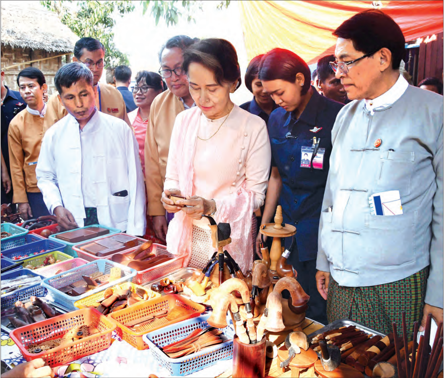
နိုင်ငံတော်၏ အတိုင်ပင်ခံပုဂ္ဂိုလ် ဒေါ်အောင်ဆန်းစုကြည် ချောင်းဆုံမြို့နယ် ရွာလွတ်ကျေးရွာ လက်မှုပညာထုတ်ကုန်အရောင်းဆိုင်၌ သစ်သားဖြင့်ပြုလုပ်ထားသော အသုံးအဆောင်ပစ္စည်းများအား ကြည့်ရှုလေ့လာစဉ်။

ဆက်လက်၍ ချောင်းဆုံပြည်သူ့ဆေးရုံသို့ ရောက်ရှိပြီး