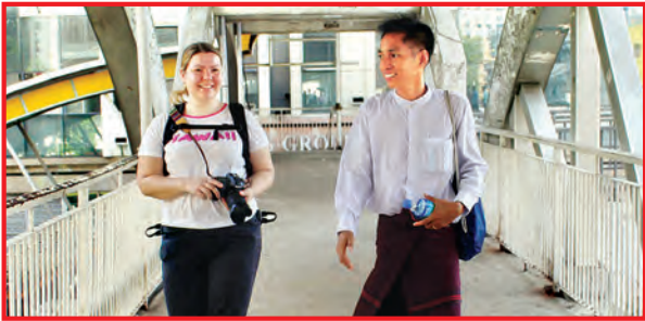
စည်းကမ်းနှင့်အညီ တံတားပေါ်မှ လမ်းကူးလာသူနှစ်ဦးကို တွေ့ရပုံ။

“သင့်ကြောင့် ယာဉ်အန္တရာယ် မဖြစ်ပါစေနှင့်”