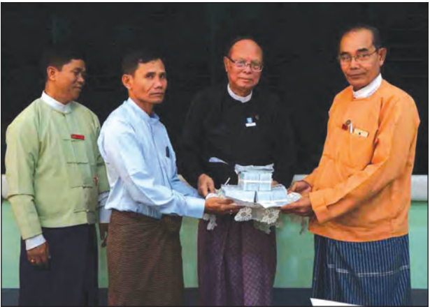
တောင်သူတစ်ဦးအား တိုင်းဒေသကြီးဝန်ကြီးက နှစ်နာကြေးပေးလျှော်နေစဉ်။

ပဲခူး ဧပြီ ၄ ဟံသာဝတီအပြည်ပြည်ဆိုင်ရာလေဆိပ်ပတ်လမ်း ပေ ၁၀၀ အတွင်း ပါဝင်သွားသည့် နှစ်ရှည်ပင်များအတွက် ဒေသခံတောင်သူများထံသို့ နှစ်နာကြေးများကို ပဲခူးတိုင်းဒေသကြီးအစိုးရအဖွဲ့ရုံး အစည်းအဝေးခန်းမ၌ ဧပြီ ၃ ရက်က ပေးအပ်ခဲ့သည်။ နှစ်နာကြေးပေးအပ်ရာတွင် ပဲခူးတိုင်းဒေသကြီး စီမံကိန်းနှင့် ဘဏ္ဍာရေးဝန်ကြီးဦးညွန့်ရွှေက ဟံသာဝတီအပြည်ပြည်ဆိုင်ရာလေဆိပ် စီမံကိန်းသည် နိုင်ငံတော်အဆင့် စီမံကိန်းတစ်ခုဖြစ်ကြောင်း၊ သီးနှံနှစ်နာကြေး ပေးလျှော်နိုင်ရန်အတွက် ခြံပိုင်ရှင်များနှင့်အတူ ရော်ဘာစိုက်ပျိုးထုတ်လုပ်သူများအသင်းမှ ပညာရှင်များ၊ ဌာနဆိုင်ရာတာဝန်ရှိသူများ၊ ကျေးရွာအုပ်ချုပ်ရေးမှူးများက တစ်ပင်ချင်း ကွင်းဆင်းတိုင်းတာခြင်း၊ သက်တမ်းသတ်မှတ်ခြင်း၊ တန်ဖိုးသတ်မှတ်ခြင်းများ ဆောင်ရွက်ခဲ့ပြီးဖြစ်၍ ယခု နှစ်နာကြေးပေးလျှော်ခြင်းဖြစ်ကြောင်း၊ ဟံသာဝတီအပြည်ပြည်ဆိုင်ရာလေဆိပ် ဖြစ်မြောက်ရေးအတွက် တောင်သူများက တစ်ဖက်တစ်လမ်းမှ ပါဝင်ကူညီခြင်းဖြစ်၍ ကျေးဇူးတင်ရှိကြောင်း ပြောကြားသည်။ ထို့နောက် တိုင်းဒေသကြီးဥပဒေချုပ် ဦးအုန်းမြင့်က နှစ်ရှည်သီးနှံပင်များအတွက် နှစ်နာကြေးပေးလျှော်ခြင်းကို စာချုပ်စာတမ်းများနှင့် ဆောင်ရွက်မည်ဖြစ်ကြောင်းနှင့် စာချုပ်ပါ စည်းကမ်းချက်များကို ရှင်းလင်းပြောကြားခဲ့ပြီး တောင်သူများအား စာချုပ်စာတမ်းတွင် လက်မှတ်ရေးထိုးလျှောက် နှစ်နာကြေးများ ပေးလျှော်ခဲ့သည်။