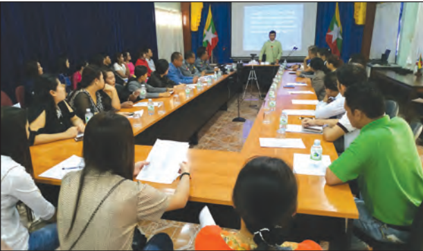
တားမြစ်ဆေးဝါးများ မရောင်းချရန် ဆေးဆိုင်ရှင်များအား အသိပေးပြောကြားစဉ်။