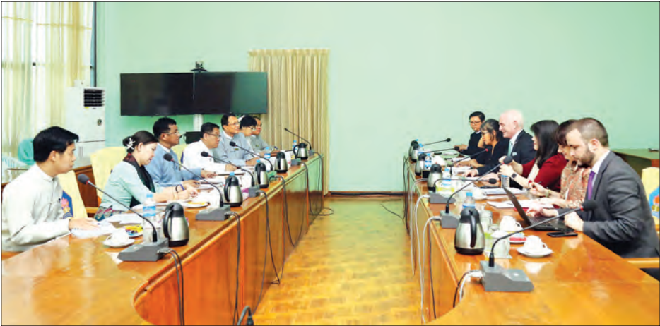
အပြည်ပြည်ဆိုင်ရာ မိုင်းအန္တရာယ် အသိပညာပေးရေးနှင့် မိုင်းလုပ်ငန်းဆိုင်ရာ အကူအညီပေးရေးနေ့ အခမ်းအနား ကျင်းပစဉ်။ သတင်းစဉ်

လုပ်ငန်းများ ဆောင်ရွက်ရာတွင် ဒေသခံပြည်သူများ ပူးပေါင်းဆောင်ရွက်ခြင်းဖြင့် မိုင်းကြောင့် ထိခိုက်ခံစားရသူများ လျော့နည်းသွားမည်ဖြစ်ပြီး အသက်မွေးဝမ်းကျောင်း လုပ်ငန်းများဖြစ်သော စိုက်ပျိုးရေးနှင့် မွေးမြူရေးလုပ်ငန်းများကို ပြန်လည်လုပ်ကိုင်နိုင်မည်ဖြစ်ကြောင်း၊ ဝန်ကြီးဌာနအနေဖြင့် ဒေသတွင်းနှင့် နိုင်ငံတကာမိုင်းလုပ်ငန်းဆိုင်ရာ အဖွဲ့အစည်းဖြစ်သော ASEAN Regional Mine Action Center(ARMAC) အဖွဲ့၏ ပုံမှန်အစည်းအဝေးများ၊ Anti-personal Mine Ban Convention, Geneva GICHD Workshop တို့တွင်တက်ကြွစွာ ပူးပေါင်းပါဝင်ဆောင်ရွက်လျက်ရှိကြောင်း၊ မိုင်းလုပ်ငန်းဆိုင်ရာ လုပ်ငန်းများမှ အကူအညီပေးဆောင်ရွက်နေကြသော ပြည်တွင်း/ပြည်ပ အဖွဲ့အစည်းများနှင့် ဒေသခံပြည်သူများက ပူးပေါင်းဆောင်ရွက်ပေးကြရန် လိုကြောင်း တိုက်တွန်းပြောကြားသည်။