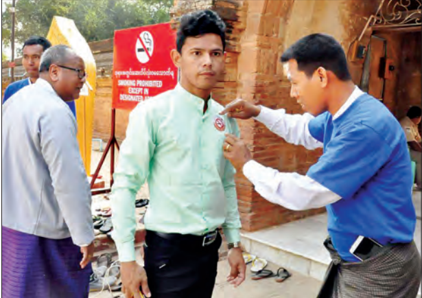
ပုဂံ၌ ဆေးရွက်ကြီးထွက်နှုန်းများထိန်းချုပ်ရေးလူထုလှုပ်ရှားမှု ဆောင်ရွက်စဉ်။