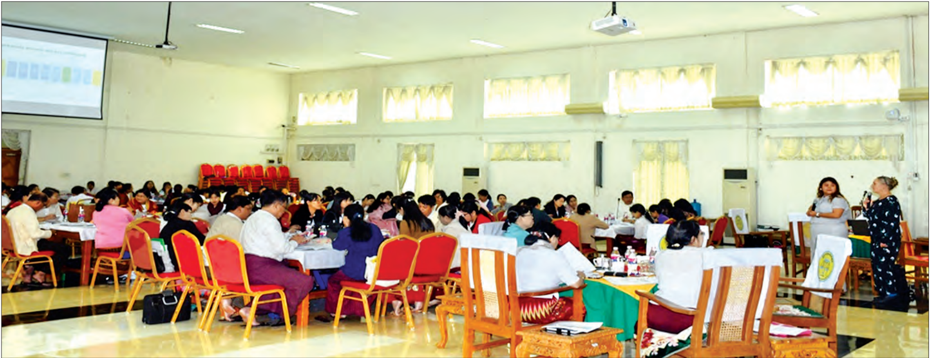
လုပ်ငန်းဆောင်ရွက်မှုစစ်ဆေးခြင်း အလုပ်ရုံဆွေးနွေးပွဲ ကျင်းပစဉ်။

အချုပ်ပိုင်(၇)မှ နိုင်ငံတကာ စာရင်းစစ်ချုပ်ရုံးများအဖွဲ့ (INTOSAI)၊ အာရှတိုက်ဆိုင်ရာ စာရင်းစစ်ချုပ်ရုံးများအဖွဲ့ (ASOSAI) နှင့် အာဆီယံစာရင်းစစ်ချုပ်ရုံးများအဖွဲ့ (ASEANSAI) စသည့်အဖွဲ့များနှင့် အခြား နိုင်ငံတကာအဖွဲ့အစည်းများ၏ ကမ်းလှမ်းမှုများအရ အိန္ဒိယနိုင်ငံသို့ ပြည်ပသင်တန်းတက်ရောက်ရန် ဝန်ထမ်း ၁၁၀ ဦး၊ နိုင်ငံ(၈)ခုသို့ အလုပ်ရုံဆွေးနွေးပွဲ တက်ရောက်ရန် ဝန်ထမ်း ၄၀ ဦး နှစ်ခုသို့ အစည်းအဝေးတက်ရောက်ရန် ဝန်ထမ်း ၇၀ ဦး၊ နိုင်ငံ နှစ်ခုသို့ ညီလာခံတက်ရောက်ရန် ဝန်ထမ်း သုံးဦးနှင့် လေ့လာရေးခရီးစဉ်အဖြစ် ကိုရီးယားသမ္မတနိုင်ငံသို့ ဝန်ထမ်းတစ်ဦး စေလွှတ်နိုင်ခဲ့သဖြင့် စစ်ဆေးရေးလုပ်ငန်းများ ဆောင်ရွက်ရာတွင် အသုံးပြုနိုင်မည့် ခေတ်မီစာရင်းကိုင်နှင့် စစ်ဆေးရေးနည်းပညာများ နိုင်ငံတကာရှိ စာရင်းစစ်ချုပ်ရုံးများ၏ အခန်းကဏ္ဍများကို လေ့လာခွင့်ရသကဲ့သို့ ပြည်ပအတွေ့အကြုံများလည်း ရရှိခဲ့ကြသည်။