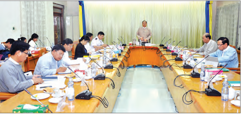
ခွင့်ပြုချက်ရယူရန် ကိစ္စရပ်များတို့ကို ဝန်ကြီးက လိုအပ်သည်များ ညှိနှိုင်းသွားနိုင်ရေးအတွက် ဖြည့်စွက်မှာကြားဆွေးနွေးတင်ပြခြင်းအပေါ် ပြည်ထောင်စုဆုံးဖြတ်၍ အောင်မြင်စွာ ဆောင်ရွက်ခဲ့ကြောင်း သတင်းစဉ်

ဆက်လက်တင်ပြ ယင်းနောက် အစည်းအဝေးတက်ရောက်လာသည့် မြန်မာနိုင်ငံပိုင် ဂြိုဟ်တုစနစ်တည်ထောင်ရေးလုပ်ငန်းကော်မတီဝင်များ၊ မြန်မာနိုင်ငံ ဂြိုဟ်တုထရန်စပွန်ဒါငှားရမ်းရေးဆပ်ကော်မတီ၊ မြန်မာနိုင်ငံ ဂြိုဟ်တုစနစ်ဆိုင်ရာ ဥပဒေရေးရာနှင့် လုပ်ထုံးလုပ်နည်းဆပ်ကော်မတီ၊ မြန်မာနိုင်ငံ ဂြိုဟ်တုဆိုင်ရာနည်းပညာဆပ်ကော်မတီ၊ မြန်မာနိုင်ငံပိုင် အနိမ့်ပျံဂြိုဟ်တုလွှတ်တင်ရေးဆပ်ကော်မတီဝင်များက ဆောင်ရွက်ထားရှိမှုအခြေအနေ၊ အကောင်အထည်ဖော်ရန် ညှိနှိုင်းဆောင်ရွက်ပေးရန်များ၊ ဦးဆောင်ကော်မတီသို့ ဆက်လက်တင်ပြ