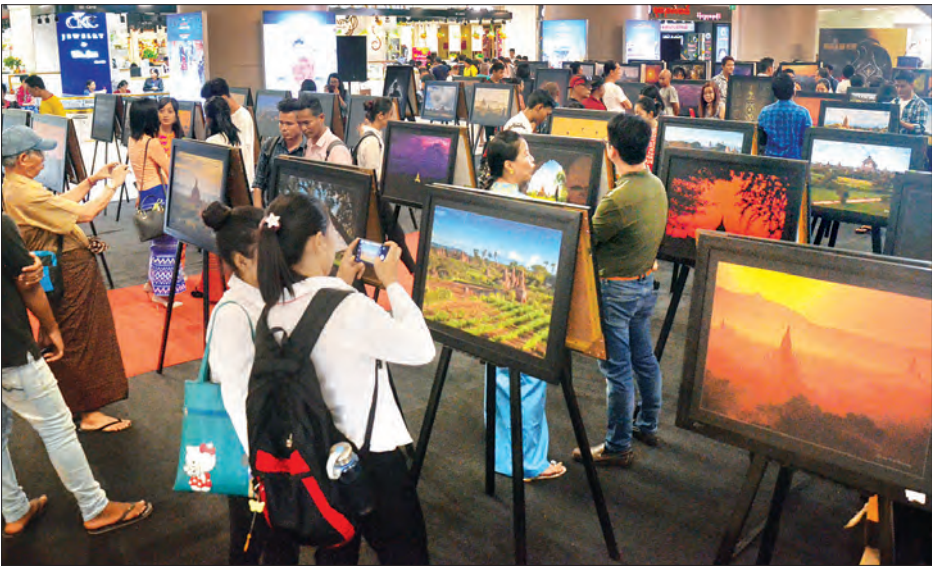
နှလုံးသားထဲက ပုဂံဓာတ်ပုံပြပွဲသို့ လာရောက်လေ့လာကြည့်ရှုသူများကို တွေ့ရစဉ်။

ရှေးဟောင်းသုတေသနနှင့် အမျိုးသားပြတိုက်ဦးစီးဌာန ဒုတိယညွှန်ကြားရေးမှူးချုပ် ဒေါက်တာသိန်းလွင်က “နှလုံးသားထဲက ပုဂံ လို့ ပြောရလောက်အောင် ပုဂံရိယဉ်ကျေးမှုတွေ ပေါ်လွင်အောင် ပြည်သူတွေကို ပြသခြင်းဖြစ်ပါတယ်။ ပုဂံကို ကမ္ဘာ့အမွေအနှစ် တင်သွင်း