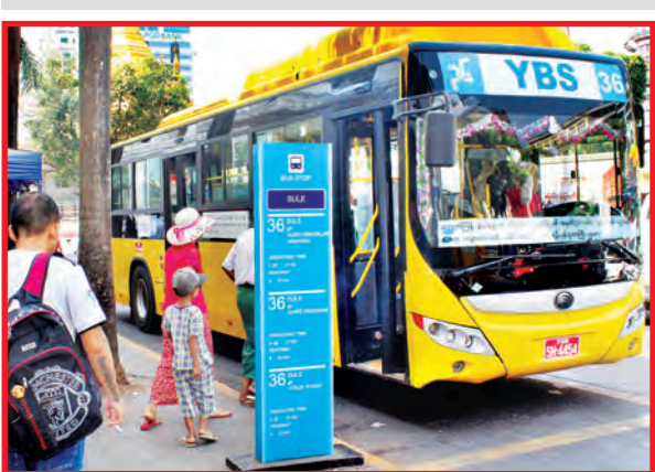
ခရီးသွားများ များပြားစုပုံရာမှတ်တိုင်တို့တွင် YBS စီးသူများ အဆင်ပြေစေရန် လိုင်းအလိုက် မှတ်တိုင်များ ခွဲခြားရပ်တန့်...။