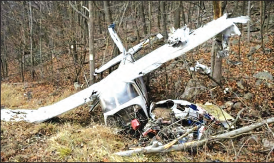
ပျက်ကျလေယာဉ်နှင့် အပျက်အစီးများကို တွေ့ရစဉ်။