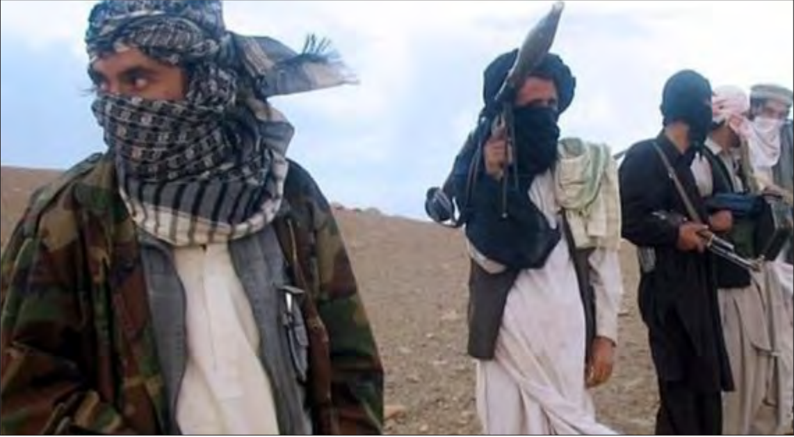
တာလီဘန်စစ်သွေးကြွအဖွဲ့ဝင်အချို့ကို တွေ့ရစဉ်။

တာလီဘန်အဖွဲ့ရဲ့ အကြီးတန်း အာဏာပိုင်တစ်ဦးဖြစ်တဲ့ ရှာဖိုဟာမက် အာဘက်စ်စတာနစ် ဗိုင်ကတော့ အာဖဂန်ကနေ ပြည်ပတပ်ဖွဲ့ဝင်တွေ ဆုတ်ခွာမသွားမချင်း အပစ်အခတ်ရပ်စဲရေးကို သဘောတူလိမ့်မှာ မဟုတ်ဘူးလို့ အင်တာဗျူးတစ်ခုမှာ ဖြေကြား ထားပါတယ်။ ဘယ်လိုပဲဆိုဆို အာဖဂန် ရင်ကြားစေ့ရေးဆိုင်ရာ အမေရိကန်အထူးကိုယ်စားလှယ် ဇယ်လ်မေခါလီဇက်ကတော့ ကာတာမှာ နောက်ထပ်ကျင်းပမယ့် ငြိမ်းချမ်း