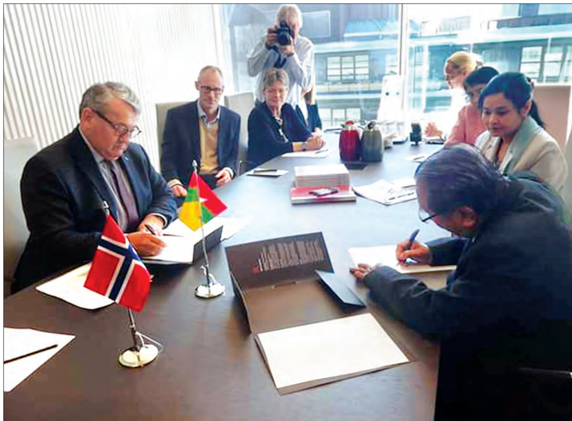
ပြည်ထောင်စုစာရင်းစစ်ချုပ်နှင့် နော်ဝေနိုင်ငံစာရင်းစစ်ချုပ်တို့ နှစ်နိုင်ငံ နားလည်မှုစာချုပ်သွာ (MoU) လက်မှတ်ရေးထိုးစဉ်။

ပြည်သူ့ဘဏ္ဍာ လေလွင့်ပြုန်းတီးမှု၊ ယိုဖိတ်မှု၊ ပျက်စီးမှု၊ နှစ်နာဆုံးရှုံးမှု၊ အလွဲသုံးစားမှုများကို စစ်ဆေးဖော်ထုတ်ပြီး အချိန်နှင့်တစ်ပြေးညီ ထိန်းကျောင်းကြပ်မတ်နိုင်ရန်၊ စစ်ဆေးရေးလုပ်ငန်းများ ဆောင်ရွက်ရာတွင် ပြည်သူများ၏ ပူးပေါင်းဆောင်ရွက်မှုကိုရယူပြီး ပြည်သူ့အကျိုးစီးပွားကို ကာကွယ်စောင့်ရှောက်ရန်နှင့် လုပ်ငန်းအကောင်အထည်ဖော် ဆောင်ရွက်မှုများကို ထိရောက်စွာ စစ်ဆေးနိုင်ရန်အတွက် ပြည်ထောင်စုစာရင်းစစ်ချုပ်ရုံး၏ ကျွမ်းကျင်စာရင်းစစ်ပညာရှင်ဝန်ထမ်းများက စနစ်တကျ စစ်ဆေးနေကြရခြင်းဖြစ်