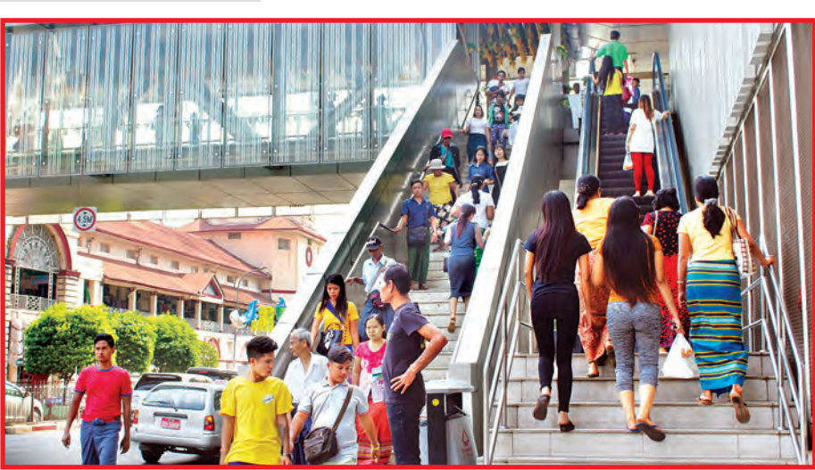
ပိုလ်ချုပ်အောင်ဆန်းဈေးသစ်နှင့် ဈေးဟောင်းကူးသည့်တံတားပေါ်မှ စည်းကမ်းတကျ လမ်းကူးနေကြသူများ။