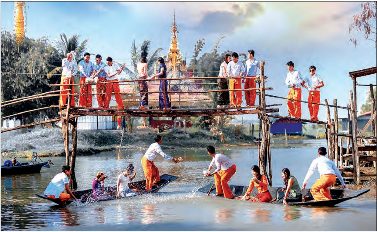
အင်းလေးဒေသ၌ ကျင်းပမည့် အင်းလေးရေပေါ်သင်္ကြန်ပွဲတော် ၂၀၁၉ အကြံမြင်ကွင်း။

ဟိုတယ်နှင့်ခရီးသွားလာရေးဝန်ကြီးဌာန နှင့် ရှမ်းပြည်နယ်အစိုးရအဖွဲ့တို့၏ ကြီးကြပ်မှု၊ Miss Innlay Organization ၏ စီစဉ်မှုဖြင့် ပထမအကြိမ် အင်းလေးရေပေါ်သင်္ကြန်ပွဲတော် ၂၀၁၉ ကို မဟာသင်္ကြန်အကြံဉာဏ် (ဧပြီ ၁၃ ရက်)မှ နှစ်ဆန်းတစ်ရက်နေ့ (ဧပြီ ၁၇ ရက်)အထိ ညောင်ရွှေမြို့နယ် နန်းပန် ကျေးရွာ နန်းပန်ဈေးအနီးရှိ Inle Cultural Heritage Trust Complex ရှေ့ အင်းလေးကန်ရေပြင်၌ စည်ကား သိုက်မြိုက်စွာ ကျင်းပသွားမည်ဖြစ်သည်။ အဆိုပါ ရေပေါ်သင်္ကြန်ပွဲတော်တွင် အင်းလေးကန်ရေပြင်ပေါ်၌ လှေသမ္ဗန် များ၊ ဖောင်များဖြင့် အတာရေစင် ပက်ဖျန်းကြမည့် ပျော်ရွှင်ကြည်နူးဖွယ်ရာ ရေပေါ်သင်္ကြန်ပွဲ၊ တေးသံသမ္ဗန်များဖြင့် ဖျော်ဖြေတင်ဆက်ကြမည့် ရေပေါ် တေးဂီတဖျော်ဖြေပွဲ၊ မြန်မာ့ရိုးရာအတာ သင်္ကြန်ယမ်းအကအလှများနှင့် တိုင်းရင်း သားရိုးရာအကပြိုင်ပွဲ အစီအစဉ်များ၊ အင်းလေးဒေသကိုယ်စားပြု Mister & Miss Innlay 2019 ရွေးချယ်ပွဲ၊ သံဃာအပါး ၁၀၀၀ ကြွရောက်ချီးမြှင့် အလှူခံမည့် နှစ်ဦးရေပေါ်ဆွမ်းလောင်းပွဲ၊