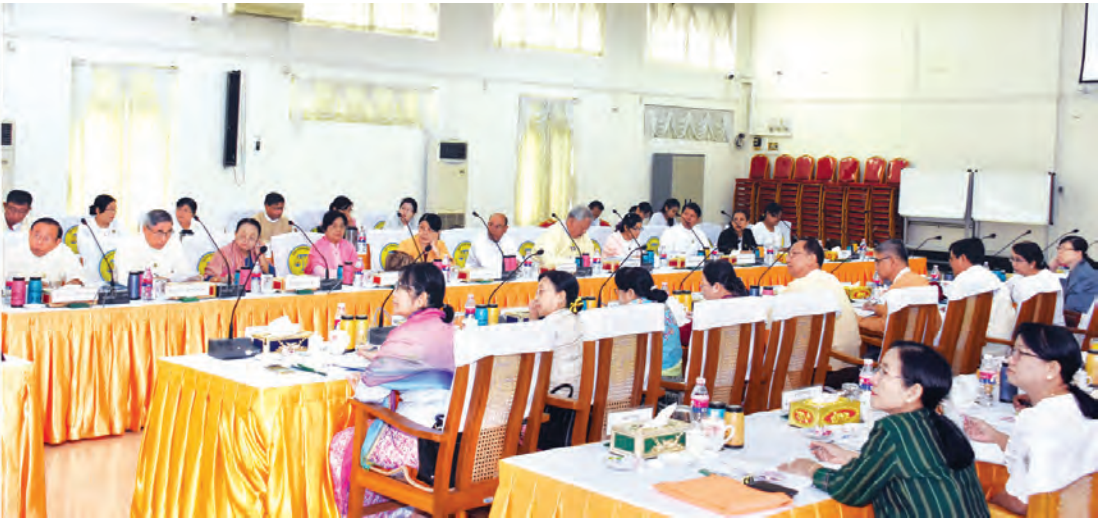
ပြည်ထောင်စုစာရင်းစစ်ချုပ်နှင့် တိုင်းဒေသကြီး၊ ပြည်နယ် စာရင်းစစ်ချုပ်များ လုပ်ငန်းညှိနှိုင်းဆွေးနွေးပွဲ (၂/၂၀၁၈) ကျင်းပစဉ်။

မြူးမြဲချွေတာစွာသုံးစွဲခြင်း၊ စွမ်းဆောင်ရည်ပြည့်ဝ စွာဆောင်ရွက်နိုင်ခြင်း၊ ပြည်သူတွေအတွက် အကျိုးသက်ရောက်မှုရှိခြင်း ရှုထောင့်တွေနဲ့ ပြည်ထောင်စုဘဏ္ဍာငွေ အရအသုံးဆိုင်ရာ ဥပဒေ၊ ပြည်ထောင်စု၏ အခွန်အကောက်ဥပဒေ၊ အမျိုးသားစီမံကိန်းဥပဒေတို့အပေါ် အကောင် အထည်ဖော်နိုင်မှုတို့အပြင် အစိုးရရဲ့ ကြွေးမြီနဲ့ ပြည်ထောင်စုဘဏ္ဍာရန်ပုံငွေနှင့် ဆက်စပ်ဆောင် ရွက်တဲ့ ကြွေးမြီ အပ်ငွေ၊ ယာယီစာရင်းတွေရဲ့ စစ်ဆေးတွေ့ရှိချက်တွေကို ဖော်ပြထားပါတယ်” ဟု ယင်းက ဆက်လက်ပြောကြားသည်။