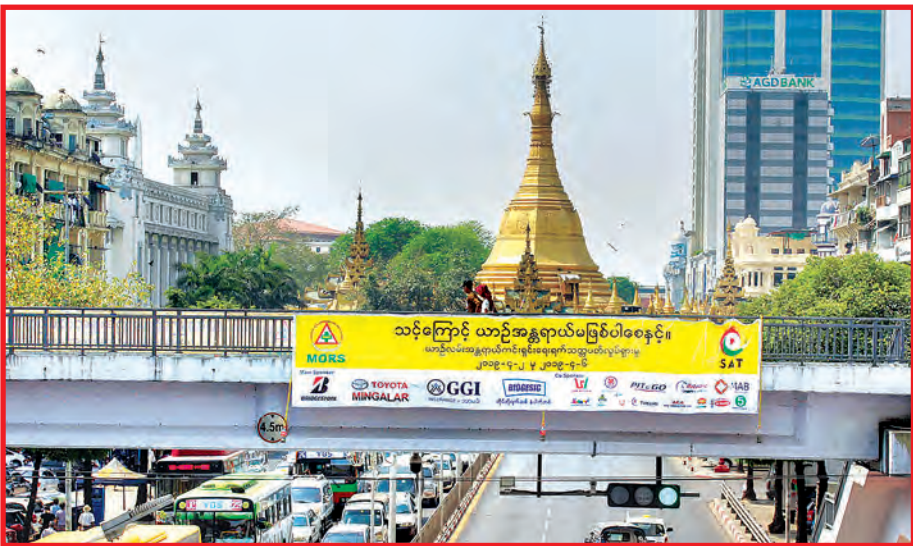
ဆူးလေဘုရားလမ်းနှင့် အနော်ရထာလမ်းပတ်လည် လူကူးတံတားတွင် ချိတ်ဆွဲထားသော “ယာဉ်လမ်းအန္တရာယ်ကင်းရှင်းရေး ရက်သတ္တပတ်လှုပ်ရှားမှု” အသိပေးစီနိုင်းဆိုင်ဘုတ်တစ်ခု။

“သင့်ကြောင့် ယာဉ်အန္တရာယ် မဖြစ်ပါစေနှင့်”