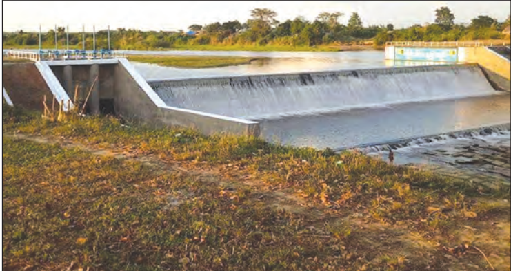
ဘိုင်းဒါးရေလှောင်တမံမှ နွေစပါးစိုက်ပျိုးရေးများ ပေးဝေနေစဉ်။

ကျော် ပိုမိုစိုက်ပျိုးနိုင်ခြင်းဖြစ်ကြောင်း သိရသည်။ ဘိုင်းဒါးဆည် ရေသောက်ရေယာအတွင်းရှိ ဒိုက်ဦးမြို့နယ်မှ ဒီးတန်းကျေးရွာအုပ်စု၊ ဆင်ဇလုပ်ကျေးရွာအုပ်စု၊ သပြေတန်းကျေးရွာအုပ်စု၊ အင်းသဇင်ကျေးရွာအုပ်စုနှင့် ကံကလေးကျေးရွာအုပ်စုတို့ရှိ ဒေသခံတောင်သူများအနေဖြင့် စိုက်ပျိုးရေလုံလောက်စွာရခြင်းကြောင့် ယခင်နှစ်က နွေစပါးဧက ၆၂၀၀ စိုက်ပျိုးနိုင်ခဲ့ရာမှ ယခုနှစ်တွင် ဧက ၉၆၀၀ ကျော်အထိ စိုက်ပျိုးထားနိုင်ပြီး တောင်သူများအနေဖြင့် နွေစပါးကို ပိုမိုတိုးချဲ့စိုက်ပျိုးနိုင်ရန် ကြိုးပမ်းလုပ်ကိုင်လာလျက်ရှိကြောင်း သိရသည်။