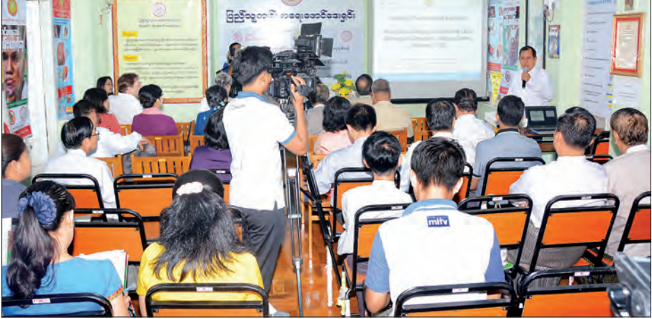
ကွမ်းယာနှင့်ဆေးရွက်ကြီးထွက်ပစ္စည်းများ ထိန်းချုပ်ရေးအတွက် မီဒီယာမှတစ်ဆင့် လူထုလှုံ့ဆော်လှုပ်ရှားမှုများနှင့် စပ်လျဉ်း၍ စာနယ်ဇင်းဆွေးနွေးပွဲ ကျင်းပစဉ်။

ပညာပေးလှုံ့ဆော်မှုများပြုလုပ် အဆိုပါ လူထုလှုပ်ရှားမှုကို ဆိုရှယ်မီဒီယာတွင်လည်း hash tag အမှတ်အသားပါသည့် # Stop Betel Myanmar ဆိုသည့် ဆောင်ပုဒ်ဖြင့် Facebook စာမျက်နှာပေါ်တွင် လူငယ်၊ လူရွယ်များနှင့် လူကြီးများအား ကွမ်းယာ စားသုံးခြင်းကို ရပ်တန့်သွားရန် (သို့မဟုတ်) ထိုအကျင့်ဆိုးကို အသက် ငယ်ငယ်အရွယ်ကစပြီး မလုပ်ဆောင်မိ စေရန် ပညာပေးစည်းရုံးလှုံ့ဆော်မှုများ ပြုလုပ်ခဲ့သည်။ ထိုလေ့လာဆန်းစစ်မှုများ အပေါ်