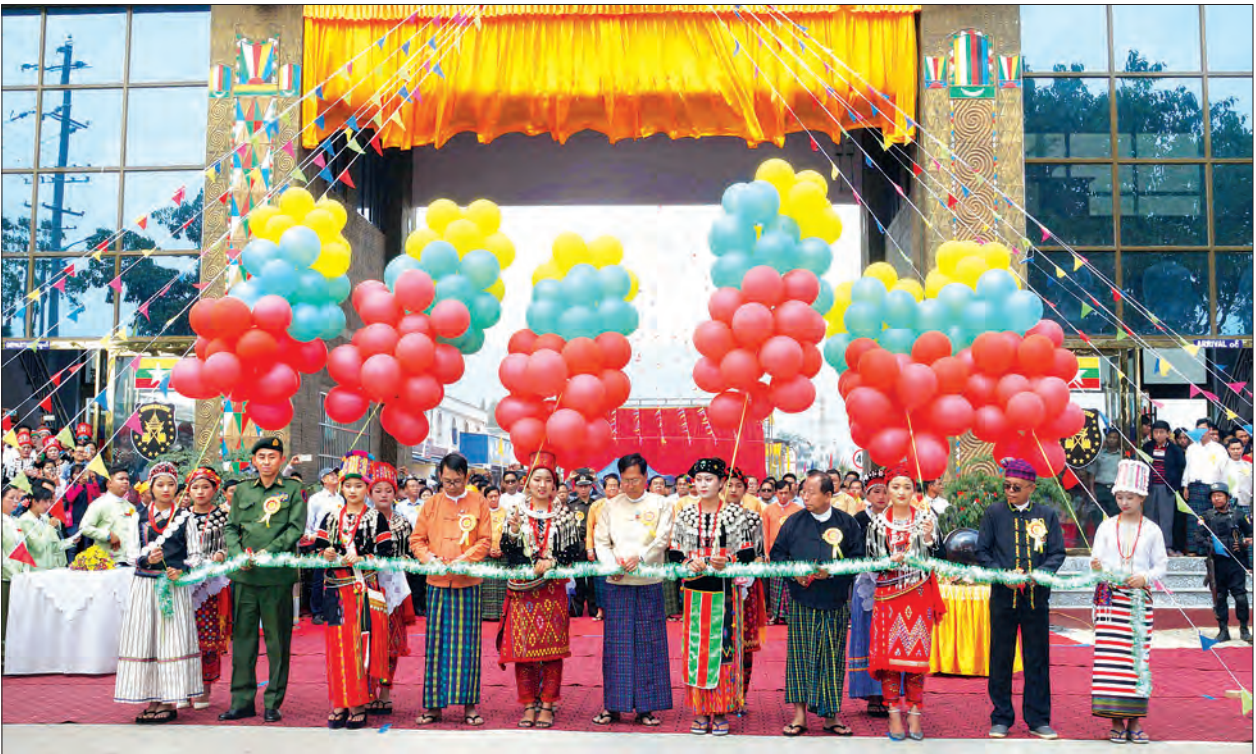
လွယ်ဂျယ်နယ်စပ်ဂိတ် နယ်စပ်ဝင်/ထွက်မှန်ဦးသစ်ကို ပြည်နယ်လွှတ်တော်ဥက္ကဋ္ဌ ဦးထွန်းတင်၊ ပြည်နယ်တရားလွှတ်တော် တရားသူကြီးချုပ် ဦးတူးဂျာနှင့် တာဝန်ရှိသူများက ဖဲကြိုးဖြတ်ဖွင့်လှစ်ပေးစဉ်။

ဝန်ကြီးချုပ်က နယ်စပ်ကုန်သွယ်ရေး စခန်းတွင် အသုံးပြုရန်အတွက် အလျား ၁၈ မီတာ၊ အနံ ၃ မီတာရှိသည့် ကတ္တားကို အလှူရှင်များ၏ လှူဒါန်းမှုလက်ခံရယူပြီး ဂုဏ်ပြုမှတ်တမ်းလွှာ ပြန်လည်ပေးအပ် သည်။ ထိုမှတစ်ဆင့် ပြည်နယ်ဝန်ကြီးချုပ် သည် ပြည်နယ်အစိုးရအဖွဲ့၏ ဘဏ္ဍာ ငွေနှင့် မြို့မိမြို့ဖများပူးပေါင်းဆောင်ရွက် မည့် လွယ်ဂျယ်မြို့အမှတ် ၃၉ လမ်း ဆောင်ရွက်မည့်အခြေအနေကို ကြည့်ရှု စစ်ဆေးပြီး မြို့ပြည်သူ့ဆေးရုံအတွင်း လှည့်လည်ကြည့်ရှုစစ်ဆေးကာ ဆေးဝါး ကုသမှုခံယူနေသော လူနာများကို အားပေးစကားပြောကြားကာ ထောက်ပံ့ ငွေများပေးအပ်ကြသည်။ ယင်းနောက် ဓမ္မရက္ခဘုဒ္ဓဘာသာ ဘုန်းတော်ကြီးကျောင်း၌ ဌာနဆိုင်ရာ များ၊ မြို့နေပြည်သူများနှင့် တွေ့ဆုံပြီး ပြည်နယ်ဝန်ကြီးချုပ်က မိမိတို့အစိုးရအဖွဲ့ အနေဖြင့် ပြည်သူများ၏ အခြေခံလိုအပ် ချက်များကို အတတ်နိုင်ဆုံး ဖြည့်ဆည်း ဆောင်ရွက်သည့်အခါတွင် ဗန်းမော်ခရိုင် နှင့် လွယ်ဂျယ်ဖွံ့ဖြိုးတိုးတက်ဖွံ့ဖြိုးမှု အတွက် နယ်စပ်ကုန်သွယ်ရေးလမ်းကြောင်းဖြစ် သည့်ဦးမောက်- လွယ်ဂျယ်လမ်းကို ပြုပြင် နိုင်ရေး ဆောင်ရွက်လျက်ရှိကြောင်း၊ ပြည်သူများ၏ အခက်အခဲကို အားပေး နှစ်သိမ့်ပေးပြီး ဥပဒေနှင့်ညီပါက