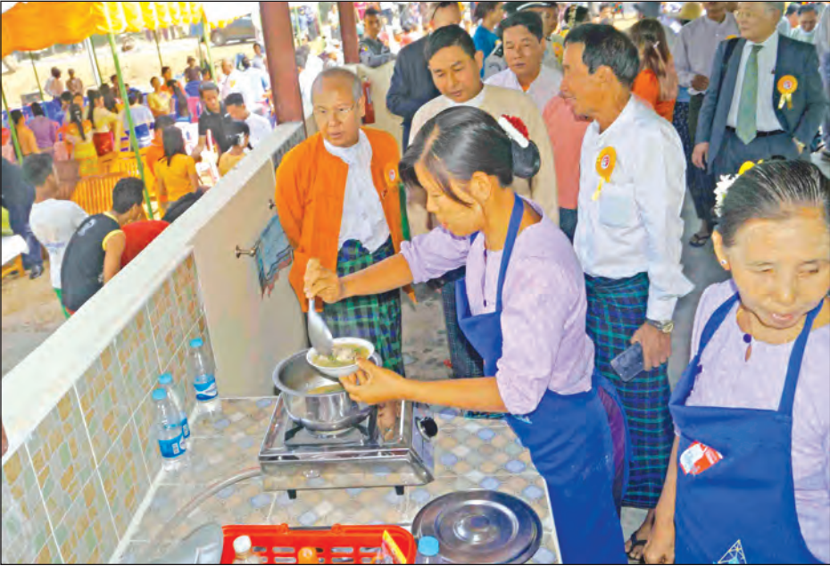
လူထုမီးဖိုဆောင်၌ ဂက်စ်မီးဖိုများဖြင့် ချက်ပြုတ်နေမှုကို မကွေးတိုင်းဒေသကြီးဝန်ကြီးချုပ် လှည့်လည်ကြည့်ရှုစဉ်။

မွန်ဖြူ ဧပြီ ၄ မကွေးတိုင်းဒေသကြီး ပွင့်ဖြူမြို့နယ် လယ်ကိုင်ကျေးရွာ၌ သဘာဝပတ်ဝန်းကျင်ထိန်းသိမ်းရေးအတွက် အထောက်အကူဖြစ်စေရန်နှင့် ဒေသခံပြည်သူများ အချိန်ကုန်သက်သာစွာ လုပ်ပင်ပန်းခြင်း မရှိဘဲ ချက်ပြုတ်နိုင်ရန် ရည်ရွယ်ဆောက်လုပ်ခဲ့သည့် ပါရမီ လူထုမီးဖိုဆောင် အဆောက်အအုံသည် ဖွင့်ပွဲကို ဧပြီ ၂ ရက်က အဆိုပါ လူထုမီးဖိုဆောင်အနီး ယာယီမဏ္ဍပ်၌ ကျင်းပခဲ့သည်။ လူထုမီးဖိုဆောင် ဖွင့်ပွဲတွင် မကွေးတိုင်းဒေသကြီးဝန်ကြီးချုပ် ဒေါက်တာ အောင်မိုးညိုက အမှာစကားပြောကြားပြီးနောက် ကမ္ဘာလုံးဆိုင်ရာ LPG အဖွဲ့၏ Cooking for life မှ Ms.Alison Abbott က စွမ်းအင်သုံးစွဲမှုကို လျော့ချနိုင်ရန်နှင့် သဘာဝပတ်ဝန်းကျင် ထိန်းသိမ်းရေးကို အထောက်အကူပြုနိုင်ရန်အတွက် ဂက်စ်မီးဖိုဆောင်များ အကောင်အထည်ဖော်နေမှုအပေါ် ကမ္ဘာလုံးဆိုင်ရာ အမြင်နှင့်ပတ်သက်၍ ရှင်းလင်းဆွေးနွေးသည်။ ထို့နောက် ပါရမီစွမ်းအင် ကုမ္ပဏီများ အုပ်စု၏ အမှုဆောင်အရာရှိချုပ်ဖြစ်သူ