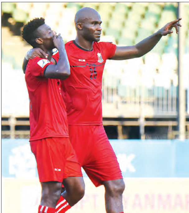
ထိပ်ဆုံးမှ ဦးဆောင်နေသည့် ဟံသာဝတီအသင်းမှ ကစားသမားများအား တွေ့ရ စဉ်။