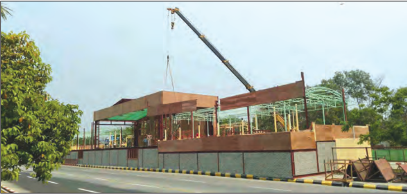
နေပြည်တော်၌ Sky Net မဏ္ဍပ် ဆောက်လုပ်နေစဉ်။

နေပြည်တော် ဧပြီ ၄ ယခုနှစ် နေပြည်တော်သင်္ကြန်ကို ဗဟိုမဏ္ဍပ်၊ ရာဇသင်္ဂဟလမ်းမကြီး ရွှေဧည့်သည်ဟိုတယ်ရှေ့တွင် Sky Net မဏ္ဍပ်၊ ဇေယျာသီရိမြို့နယ် ဇေယျာသီရိကုန်တိုက်အနီး၌ တပ်မတော်ကာကွယ်ရေးဦးစီးချုပ်ရုံးမိသားစုမဏ္ဍပ်၊ ပုဗ္ဗသီရိမြို့နယ် နေပြည်တော်ဘူတာကြီးလမ်းမင်္ဂလာဈေးအနီးတွင် ဧည့်ခံဖျော်ဖြေရေးနှင့် ရေကစားမဏ္ဍပ် စသည့် အဓိက မဏ္ဍပ်ကြီးများဖြင့် စည်ကားသိုက်မြိုက်စွာ ကျင်းပသွားမည်ဖြစ်ကြောင်း သိရသည်။ နေပြည်တော်သင်္ကြန်ဖွင့်ပွဲကို ဧပြီ ၁၃ ရက် သင်္ကြန်အကြိုနေ့ ညနေပိုင်းတွင် နေပြည်တော် စည်ပင်သာယာရေးကော်မတီ မြို့တော်ဝန်မဏ္ဍပ်၌ စည်ကားသိုက်မြိုက်စွာ ကျင်းပသွားမည်ဖြစ်ပြီး ဖွင့်ပွဲတွင် ဌာနဆိုင်ရာနှင့် ကုမ္ပဏီများမှ ယိမ်းအဖွဲ့ ၁၇ ဖွဲ့ဖြင့် ဖျော်ဖြေကာ မြန်မာ့အသံနှင့် ရုပ်မြင်သံကြား၊ အနုပညာဦးစီးဌာနတို့က တေးသံသားများဖြင့် ဖျော်ဖြေတင်ဆက်မည်ဖြစ်ကြောင်း သိရသည်။ ဒုတိယအကြိမ် လမ်းလျှောက်သင်္ကြန်ကိုလည်း ပျဉ်းမနားမြို့နယ် မင်္ဂလာရှမ်းကန်ရှေ့၌ ယခင်နှစ်ထက်