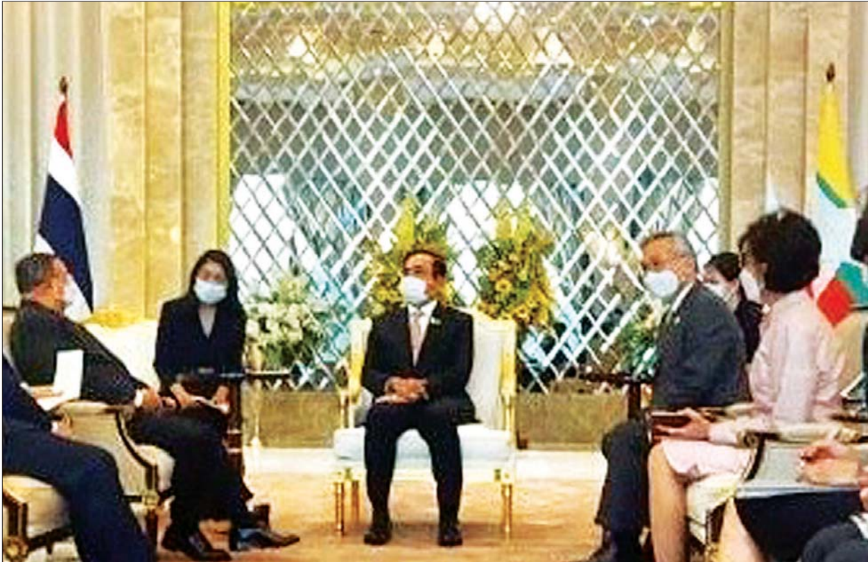
ပြည်ထောင်စုဝန်ကြီး ဦးဝဏ္ဏမောင်လွင်နှင့် ထိုင်းနိုင်ငံဝန်ကြီးချုပ် ဗိုလ်ချုပ်ကြီး ပရာယုဒ် ချန်အိုချာ (ငြိမ်း) တို့ တွေ့ဆုံဆွေးနွေးစဉ်။ သတင်းစဉ်

၁၃၈၂ ခုနှစ်၊ တပို့တွဲလဆန်း ၁၄ ရက် ၂၀၂၁ ခုနှစ်၊ ဖေဖော်ဝါရီ ၂၅ ရက်၊ ကြာသပတေးနေ့ အတွဲ (၆၀)၊ အမှတ် (၁၄၈)