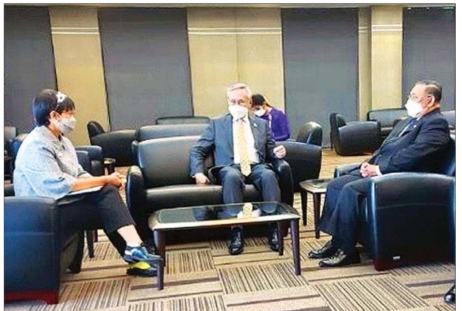
ပြည်ထောင်စုဝန်ကြီး ဦးဝဏ္ဏမောင်လွင်၊ အင်ဒိုနီးရှားနိုင်ငံခြားရေးဝန်ကြီး မစ္စစ် ရတ်နို မာဆူဒီ နှင့် ထိုင်းဒုတိယဝန်ကြီးချုပ်နှင့် နိုင်ငံခြားရေးဝန်ကြီး မစ္စတာ ဒွန်ပရာမွန်းဝီနိုင် တို့ တွေ့ဆုံဆွေးနွေးစဉ်။