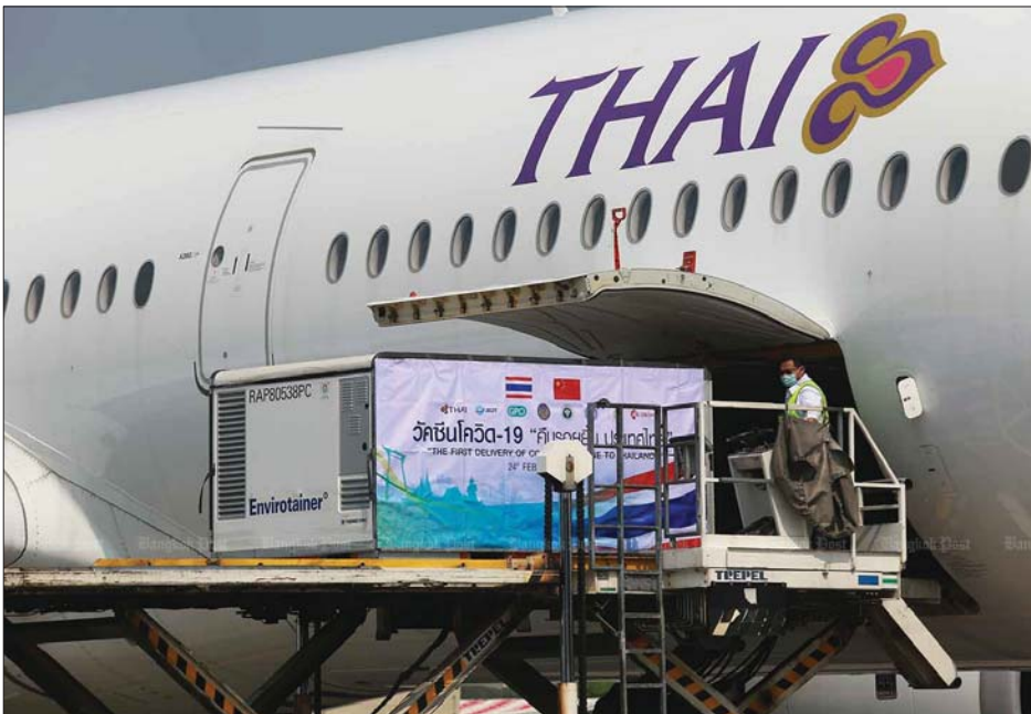
တရုတ်နိုင်ငံမှ ရောက်ရှိလာသော ကိုဗစ်- ၁၉ ပထမအသုတ်ကို တွေ့ရစဉ်။