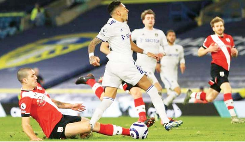
လိဒ်စ်ကစားသမား ရာဖင်ဟာကို ဆောက်သမ်တန်အသင်းမှ ရိုမီယူဖျက်ထုတ် ဟန့်တားစဉ်။

လိဒ်စ်အသင်းသည် ယနေ့ပွဲစဉ်ကို အနိုင်ရရှိရန် ဆင်၊ ကလစ်ချ်၊ ဒါးလပ်စ်၊ ရာဖင်ဟာ၊ ရောဘတ်စ်၊ အတွက် မက်စ်လီယာ၊ လော်ရန်တေး၊ ကူပါ၊ ဟာရစ် ဘမ်းဖွဲ့စည်းသည့်ကစားသမားများဖြင့် ပွဲထွက်လာ