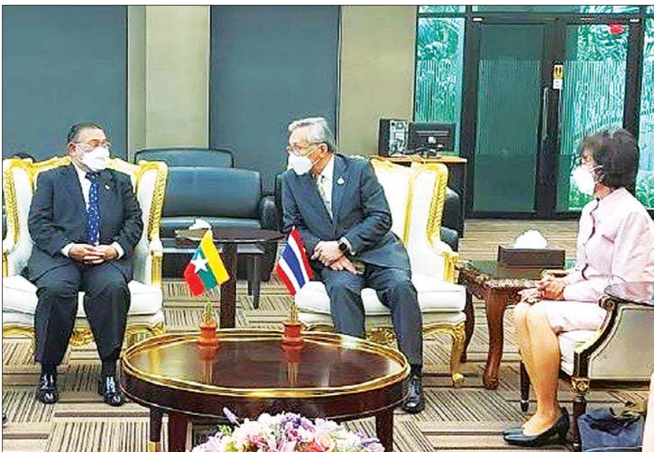
ပြည်ထောင်စုဝန်ကြီး ဦးဝဏ္ဏမောင်လွင်နှင့် ထိုင်းဒုတိယဝန်ကြီးချုပ်နှင့် နိုင်ငံခြားရေးဝန်ကြီး မစ္စတာ ဒွန်ပရာမွန်းဝီနိုင်တို့ တွေ့ဆုံဆွေးနွေးစဉ်။

(ပြည်ထောင်စုသမ္မတမြန်မာနိုင်ငံတော်၊ နိုင်ငံတော်စီမံအုပ်ချုပ်ရေးကောင်စီဥက္ကဋ္ဌ ဗိုလ်ချုပ်မှူးကြီး မင်းအောင်လှိုင် က ၁၁-၂-၂၀၂၁ ရက်နေ့ နိုင်ငံတော်၏အခြေအနေအရပ်ရပ်အား ပြည်သူလူထုသို့ ပြောကြားသည့် မိန့်ခွန်းမှ ကောက်နုတ်ချက်)