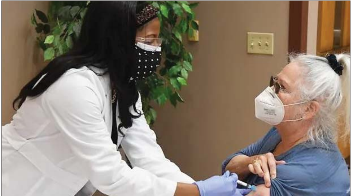
အမေရိကန်တွင် ကိုဗစ်- ၁၉ ကာကွယ်ဆေးထိုးနှံပေးနေသည်ကို တွေ့ရစဉ်။

ကမ္ဘာ့ကပ်ရောဂါ ဖြစ်ပွားနေတဲ့အချိန် ချမ်းသာတဲ့နိုင်ငံတွေဟာ ကျန်းမာရေးနည်းပညာသစ်တွေရဲ့ အကျိုးကျေးဇူးကို ရရှိနေချိန်မှာ ဆင်းရဲတဲ့နိုင်ငံတွေ