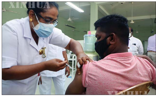
သီရိလင်္ကာနိုင်ငံတွင် ကိုဗစ်-၁၉ ကာကွယ်ဆေးထိုးနှံပေးနေသည်ကို တွေ့ရစဉ်။

ဖေဖော်ဝါရီ ၁၅ ရက်မှစတင်ပြီး သီရိလင်္ကာနိုင်ငံတွင် ပြည်သူများအား ကာကွယ်ဆေးစတင်ထိုးနှံပေးမည်ဟု အစိုးရက ထုတ်ပြန်ကြေညာခဲ့သလို ကပ်ရောဂါအန္တရာယ်များသည့် ဒေသများရှိ ရောဂါကူးစက်ခံရနိုင်ခြေရှိသူများကို ဦးစားပေးထိုးနှံပေးသွားမည်ဖြစ်ကြောင်း သိရသည်။ ဖေဖော်ဝါရီ ၂၂ ရက်အထိ နိုင်ငံအတွင်း လူပေါင်း ၃၃၀၀၀၀ ကျော်ကို ကိုဗစ်- ၁၉ ကာကွယ်ဆေးထိုးနှံပေးခဲ့သည်။ ပြည်သူများအနေဖြင့် ကာကွယ်ဆေးထိုးနှံဆောင်ရွက်ပြီးသည်ဖြစ်စေ၊ မပြီးသည်ဖြစ်စေ ကျန်းမာရေးလမ်းညွှန်ချက်များကို တင်းကြပ်စွာ လိုက်နာသွားရမည် ဖြစ်ကြောင်း ကျန်းမာရေးဝန်ကြီးဌာနက ပြောကြားလိုက်သည်။ သီရိလင်္ကာနိုင်ငံသည် ကနဦးတွင် အိန္ဒိယနိုင်ငံမှ ထုတ်လုပ်သော ကာကွယ်ဆေးထိုးနှံခြင်းကို ဆောင်ရွက်ခဲ့ပြီး ဖေဖော်ဝါရီ ၂၃ ရက်တွင် အိန္ဒိယနှင့် ဗြိတိန်မှ ကာကွယ်ဆေးအလုံးစုံ ၁၀ သန်းကို ဝယ်ယူရန်ခွင့်ပြုပေးခဲ့ကြောင်း ထုတ်ပြန်ကြေညာခဲ့သည်။ သီရိလင်္ကာနိုင်ငံသည် ကမ္ဘာ့ကျန်းမာရေးအဖွဲ့ဦးဆောင်သော ကိုဗစ်အစီအစဉ်မှ ရရှိမည့် ကာကွယ်ဆေးများလည်း မကြာမီ ရောက်ရှိလာတော့မည်ဖြစ်ကြောင်း