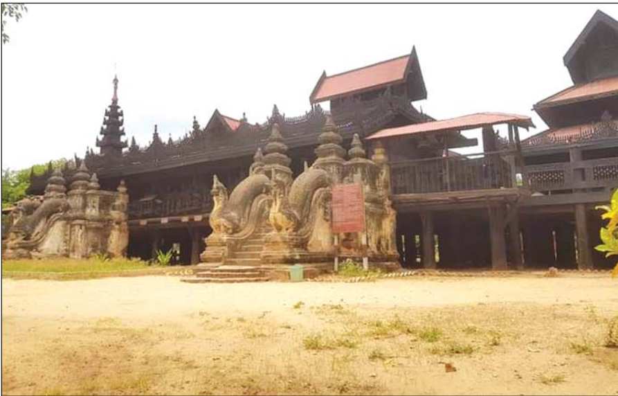
စလေရုပ်စုံကျောင်းတော်ကြီး

ပခန်းကျောင်းတော်ကြီးသည် မြန်မာနိုင်ငံရှိ ရှေးဟောင်းသစ်သားကျောင်းကြီးဖြစ်သည်။ မကွေးတိုင်းဒေသကြီး ရေစကြိုမြို့နယ်တွင် တည်ရှိပါသည်။ ပခန်းသားတို့ ပခန်းကျောင်းတော်ကြီးကို ဝန်မင်းကျောင်းဟုလည်းခေါ်ကြပါသည်။ ပခန်းကျောင်းကြီးကို ကျီဝန်သက်တော်ရှည်၊ မှန်ကင်းဝန်သုံးမည်ရ ဦးဘိုးတုတ်က မိမိ၏ ငယ်ဆရာတော်