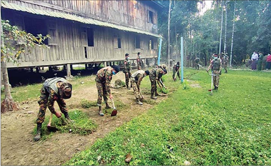
မြောက်ဦးမြို့ အခြေခံပညာ မူလတန်း(လွန်)ကျောင်း (အလယ်ဈေးရပ်ကွက်)၌ စုပေါင်းသန့်ရှင်းရေးဆောင်ရွက်စဉ်။

နေပြည်တော် ဖေဖော်ဝါရီ ၂၄ ကိုဗစ်-၁၉ ရောဂါဖြစ်ပွားမှုကြောင့် စာသင်ကြားမှုများအား ရပ်ဆိုင်းထားရှိရာမှ ပြန်လည်ဖွင့်လှစ်ခွင့်ရရှိပါက ကျောင်းသား ကျောင်းသူများ စိတ်အေးချမ်းသာစွာ ပညာသင်ကြားနိုင်စေရန်နှင့် ကျောင်းပတ်ဝန်းကျင် သန့်ရှင်းသာယာလှပစေရေးအတွက် သက်ဆိုင်ရာ တိုင်းစစ်ဌာနချုပ် အသီးသီးမှ တပ်မတော်သားများက အခြေခံပညာကျောင်းများ၌ စုပေါင်းသန့်ရှင်းရေးလုပ်ငန်းများနှင့် လိုအပ်သည့် ထိန်းသိမ်းစောင့်ရှောက်မှုများကို ဆောင်ရွက်ပေးလျက်ရှိသည်။