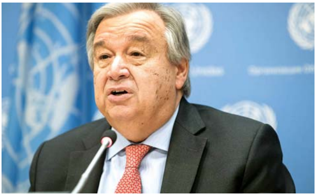
ကုလသမဂ္ဂအတွင်းရေးမှူးချုပ် အန်တိုနီယိုဂူတာရက်စ်

များအားလုံးကို လူ့အခွင့်အရေးအား ဗဟိုပြုကာ ဆောင်ရွက်ရမည် ဖြစ်ကြောင်း ကုလသမဂ္ဂ အထွေထွေညီလာခံဥက္ကဋ္ဌ ဗော်ကန်ဗော့ဇ်က ကာကွယ်ဆေးကို မှတ်ချက်ပြုပြောကြားခဲ့သည်။ ကပ်ရောဂါ၏ ကျန်းမာရေးဆိုင်ရာ အကျိုးသက်ရောက်မှုသည် ပြီးဆုံးရန်လိုသေးကြောင်း၊ ရောဂါစတင်ဖြစ်ပွားစဉ်ကတည်းက စီးပွားရေး၊ လွတ်လပ်မှု၊ လူမှုအဖွဲ့အစည်းနှင့် ပြည်သူများအပေါ် သက်ရောက်မှုရှိခဲ့ကြောင်းနှင့် လူ့အခွင့်အရေးဆိုင်ရာ ကုလသမဂ္ဂမဟာမင်းကြီး မီရှယ်လ် ဘာချက်လီက ပြောခဲ့သည်။ ကမ္ဘာ့နိုင်ငံများ အနေဖြင့် ကိုဗစ်အလွန်ခေတ်တွင် အားလုံးပါဝင်သောစနစ်များ ပိုမိုတည်ဆောက်ရေးများ လုပ်ဆောင်ရန် လိုအပ်ကြောင်း ၎င်းက ဆက်လက်ပြောကြားလိုက်သည်။ ဆင်ယွာ