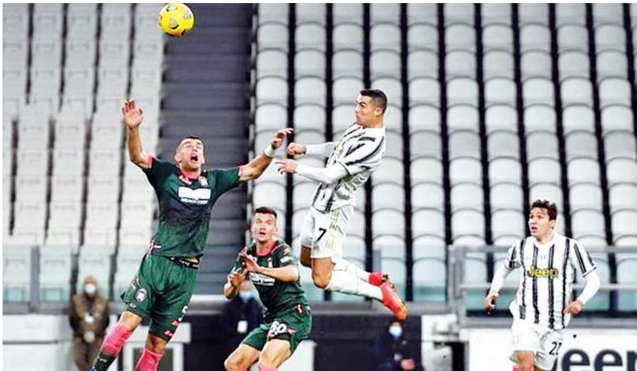
ဂျူဗင်တပ်စ်တိုက်စစ်ကစားသမား စီရော်နယ်ဒို ခရိုတုန်းအသင်းဘက်သို့ ဂိုးသွင်းယူရန် ကြိုးပမ်းစဉ်။