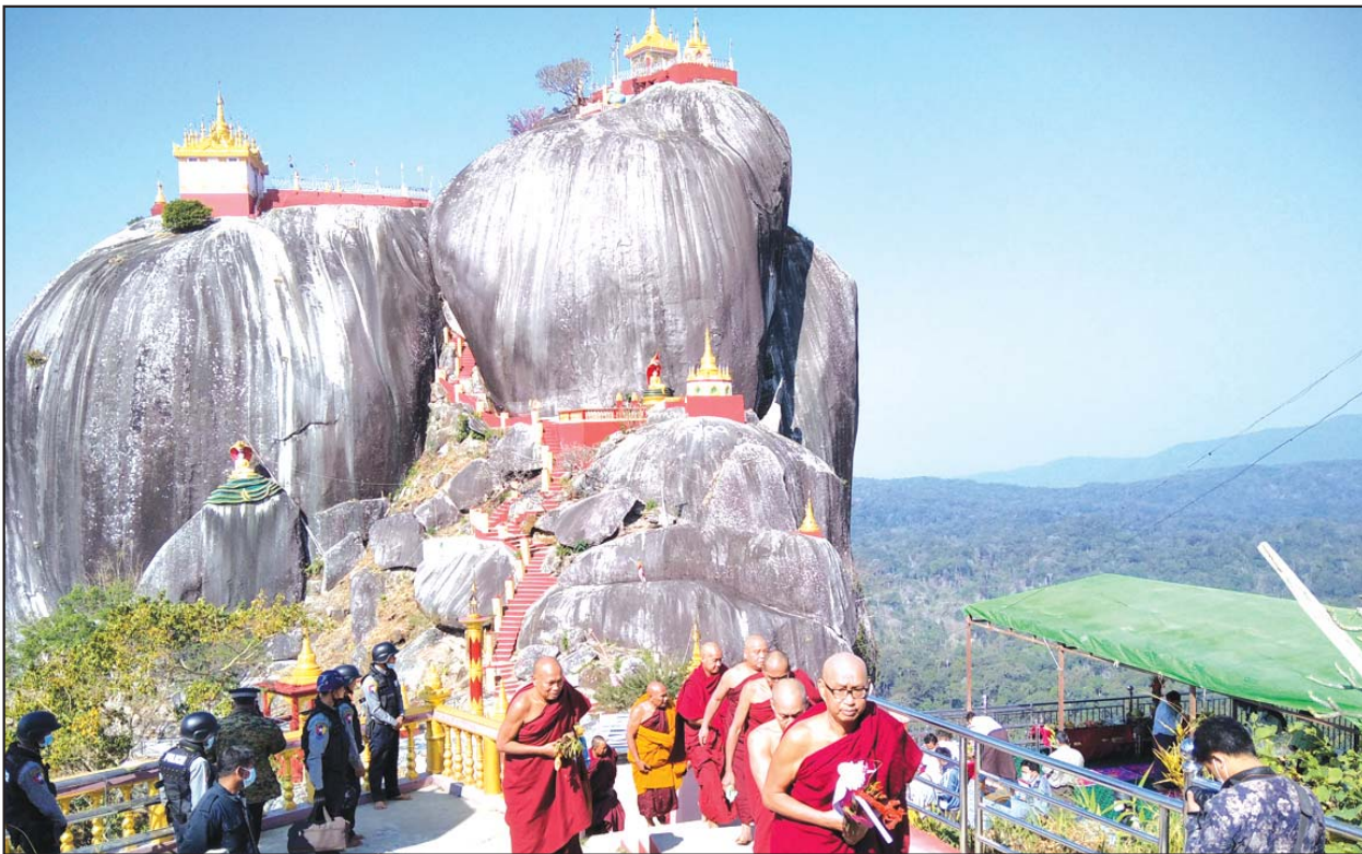
ဇလုံတောင်တော်ကြီး ဖွင့်ပွဲအခမ်းအနား ကျင်းပစဉ်

ယနေ့နံနက်မှ စတင်၍ ကိုဗစ်-၁၉ စည်းကမ်းချက်နှင့်အညီ ဗန်းမောက် မြို့နယ်အတွင်းရှိ ဇလုံတောင်တော် သို့ ဘုရားဖူးလာရောက်နိုင်ပြီဖြစ်ကြောင်း သိရသည်။ လူအောင်(ကသာ)