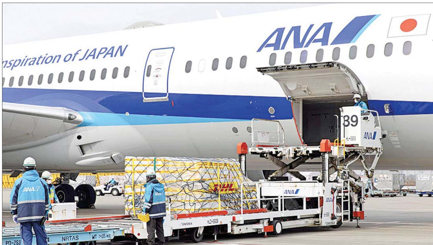
ဂျပန်နိုင်ငံသို့ ရောက်ရှိလာသည့် ကိုဗစ် -၁၉ ကာကွယ်ဆေးများကို တွေ့ရစဉ်။

ဂျပန်နိုင်ငံတွင် ကိုဗစ် -၁၉ ကာကွယ်ဆေး ထုတ်လုပ်ထားခြင်း မရှိသည့်အတွက် ဥရောပ သမဂ္ဂနိုင်ငံများမှ အချိန်မီကာကွယ်ဆေးပေးပို့မည့်အပေါ်တွင် မှီခိုနေရသည်။ ကာကွယ်ဆေးထိုးနှံပေးရေးအစီအစဉ်ကို ကြိုးကြပ်နေသည့်