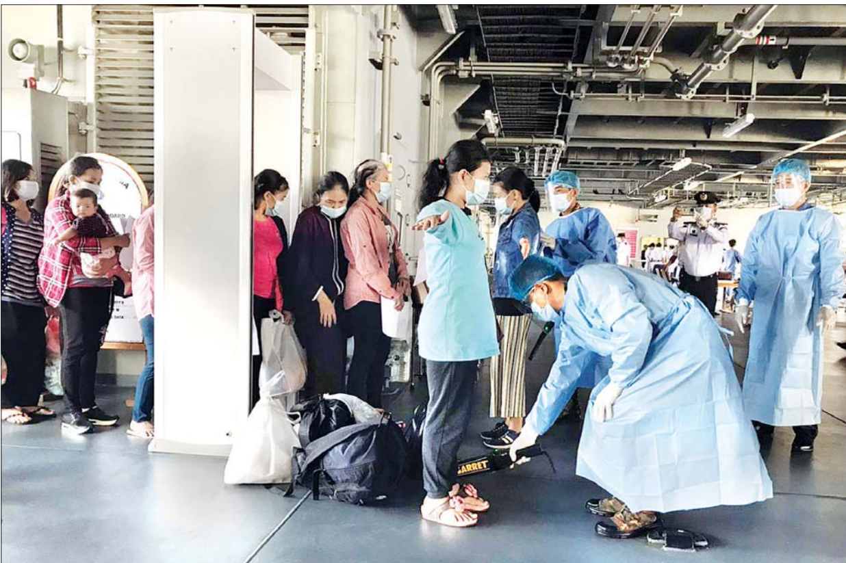
နေရပ်ပြန် မြန်မာနိုင်ငံသားများအား တွေ့ရစဉ်။