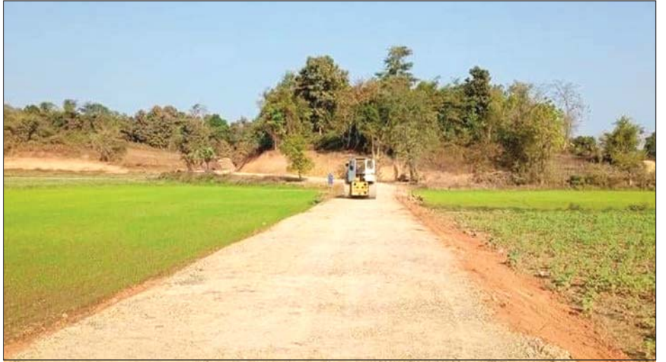
မြိုင်ဇေယျာကျေးရွာ ကုန်ထုတ်လမ်းဖောက်လုပ်နေစဉ်

ယင်းလမ်းလုပ်ငန်းများပြီးစီးပါက ယင်းလမ်းပေါ်ရှိ လိုအပ်နေသော ၁၀ ပေ ကွန်ကရစ်တံတားတစ်စင်း၊ ငါးပေ ပြွန်တံတားနှစ်စင်းနှင့် ရေပြွန်တံတား တစ်စင်းတို့ကို တင်ဒါရယမုံကောင်းကုမ္ပဏီက ဆက်လက်တာဝန်ယူဆောင်ရွက်သွားမည်ဖြစ်ကြောင်းသိရပြီး ယင်းလုပ်ငန်းအားလုံးဆောင်ရွက်ပြီးပါက အိမ်ခြေ ၇၇ အိမ်၊ လူဦးရေ ၃၉၉ ဦးအတွက် အကျိုးပြုမည်ဖြစ်ကြောင်း မြို့နယ်ဦးစီးမှူး ဦးမြတ်မျိုးထွန်းထံမှ သိရသည်။ မွေးကြူဇင်