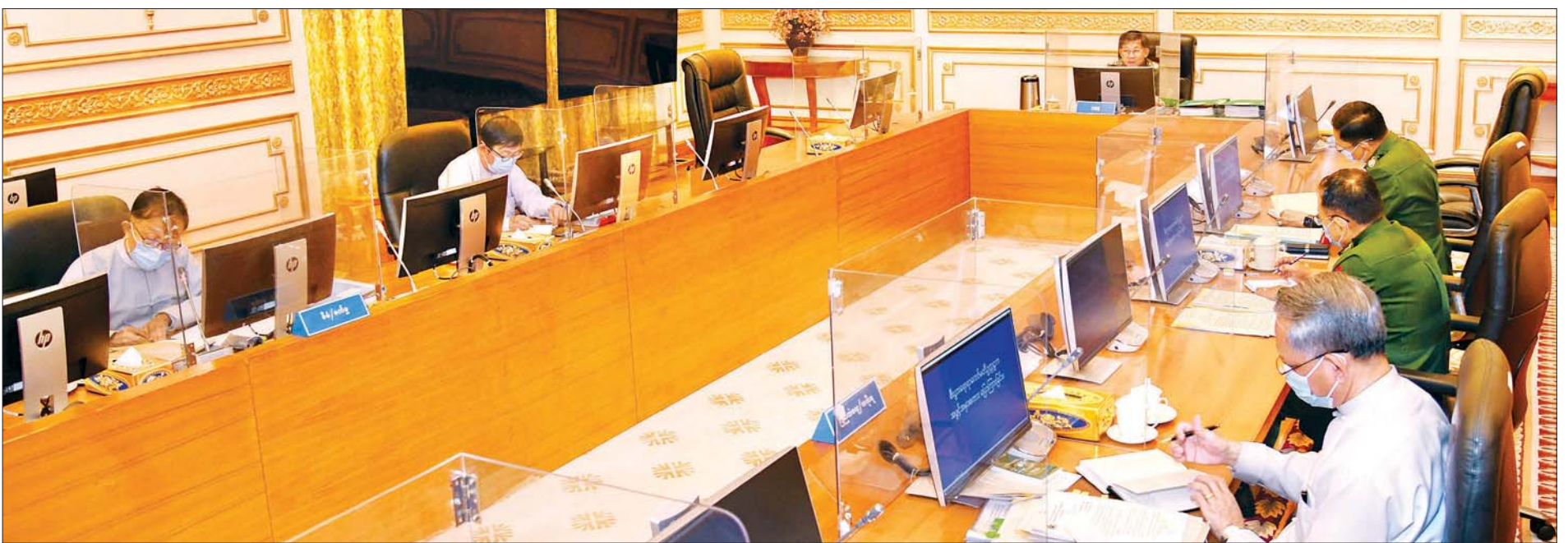
နိုင်ငံတော်စီမံအုပ်ချုပ်ရေးကောင်စီဥက္ကဋ္ဌ၊ တပ်မတော်ကာကွယ်ရေးဦးစီးချုပ် ဗိုလ်ချုပ်မှူးကြီး မင်းအောင်လှိုင် စီးပွားရေးရာကော်မတီအစည်းအဝေးအမှတ်စဉ်(၁/၂၀၂၁)တွင် အမှာစကားပြောကြားစဉ်။