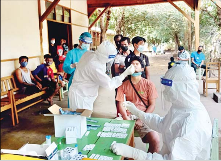
အဖွဲ့များနှင့်ပူးပေါင်း၍ ကိုဗစ်-၁၉ ရောဂါ ခြင်းများကို ဆောင်ရွက်ပေးခဲ့ကြောင်းနှင့်ပတ်သက်၍ နာခေါင်းတို့ဖတ်၊ အာခေါင် သတင်းရရှိသည်။

ထိုသို့ အသွားအလာကန့်သတ် ထားရှိသည့် ပြည်ပမှ ပြန်လည်ဝင်ရောက်လာသူ ၁၁၄ ဦးကို ယနေ့နံနက်ပိုင်းတွင် အရှေ့တောင်တိုင်းစစ်ဌာနချုပ်၊ နယ်မြေခံတပ်မတော်ဆေးရုံမှ ဆရာဝန်များ၊ ပါရဂူများ၊ ဆေးမှူးများနှင့် သူနာပြုများက မြို့နယ်စီမံအုပ်ချုပ်ရေးကောင်စီအဖွဲ့ဝင်များ၊ လူမှုရေးအသင်း