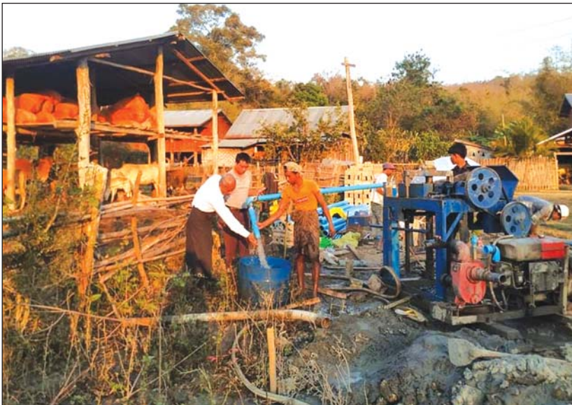
ဝမ်ခိုင်းကျေးရွာ၌ သောက်သုံးရေ တူးဖော်နေစဉ်