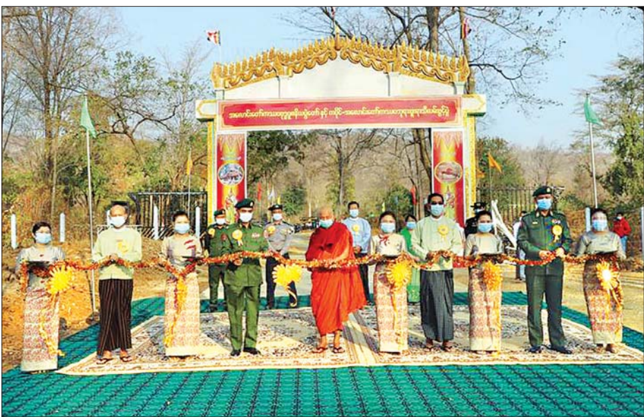
ကြရန် မှာကြားခဲ့သည်။ ဆက်လက်ပြီး အလောင်းတော်ကဿပဘုရား ရင်ပြင်တော် နာယက ကျောင်းဆောင်ရှိ ယင်းမာပင်၊ ဆားလင်းကြီး၊ ပုလဲ၊ ကနီ(၄)မြို့နယ် ဩဝါဒါစရိယ ဆရာတော်ကြီးအား ဖူးမြော်ကြည်ညိုပြီး လှူဖွယ် ဝတ္ထုပစ္စည်းများဆက်ကပ်လှူဒါန်းခြင်းနှင့် နေ့ဆွမ်း များ ဆက်ကပ်လှူဒါန်းခဲ့သည်။ တိုင်းဒေသကြီး (ပြန်/ဆက်)

ကောင်စီဥက္ကဋ္ဌနှင့်အဖွဲ့ဝင်များက ကပိုင်-သပိတ် ဆေး ဘုရားဖူးရာသီ လမ်းဖောက်လုပ်ထားရှိမှု အခြေအနေနှင့် ဘုရားဖူးလာပြည်သူများ လာရောက် မှုအခြေအနေတို့အား ကြည့်ရှုစစ်ဆေးခဲ့ကြပြီး ဘုရားဖူးပြည်သူများအတွက် ဘေးအန္တရာယ် ကင်းရှင်းအောင် တာဝန်ရှိသူများ ပူးပေါင်းဆောင်ရွက် ပေးကြရန် တိုက်တွန်းပြောကြားခဲ့သည်။ ထို့နောက် ဘုရားဖူးခရီးသည်များ အဆင်ပြေ ချောမွေ့အောင် သွားလာလွယ်ကူစေရေးအတွက် အဓိက ဝန်ဆောင်မှုပေးနေသော ဆင်ထိန်းများ အတွက် စားစရာမျိုးစုံတို့နှင့်အတူ ဆင်စာများကို ထောက်ပံ့လှူဒါန်းသည်။ ဆက်လက်၍ ယင်းမာပင် ခရိုင်အတွင်းလေးမြို့နယ်မှ အလောင်းတော်ကဿပ ဘုရား သပိတ်ဆေးချောင်း လူကူးတံတားအရှည် (၁၇၈ပေ၊ ၇လက်မ x ၁၀ပေ) တည်ဆောက်ခြင်း လုပ်ငန်းများ ဆောင်ရွက်နေမှုအခြေအနေတို့ကို ကြည့်ရှုစစ်ဆေးခဲ့ပြီးလိုအပ်သည်များကို တာဝန် ရှိသူများနှင့် ပေါင်းစပ်ဖြည့်ဆည်းဆောင်ရွက်ပေးခဲ့ကာ လုပ်ငန်းများကို သတ်မှတ်စံချိန်စံညွှန်းနှင့်အညီ အချိန်မီပြီးစီးရေးအထူးအလေးထားဆောင်ရွက်သွား