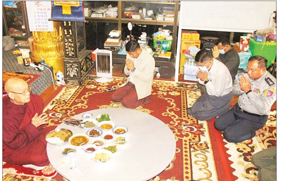
နွယ်ဝင် သီလရှင်များနှင့် ဒေသခံပြည်သူများအား ဆောင်ရွက်ပေးကြကြောင်း သိရသည်။ လိုအပ်သည့် ကျန်းမာရေးစစ်ဆေးပေးခြင်းများ သတင်းစဉ်

ထို့အပြင် ပဲခူးတိုင်းဒေသကြီး ကေတုမတီမြို့သစ် မဟာစည်သာသနာ့ရိပ်သာကျောင်းရှိ သံဃာတော်များနှင့် သာသနာ့နွယ်ဝင် သီလရှင်များအား တောင်ပိုင်းတိုင်းစစ်ဌာနချုပ် နယ်မြေခံဆေးကုသရေးအဖွဲ့၊ က ဆရာတော် သံဃာတော်များ၊ သာသနာ့