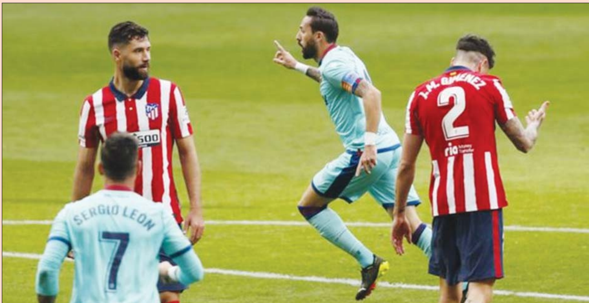
လီဗန်တေးအသင်းမှ အက်သလက်တီကို မက်ဒရစ်အသင်းဘက်သို့ ဂိုးသွင်းယူပြီးနောက် အောင်ပွဲခံနေစဉ်။