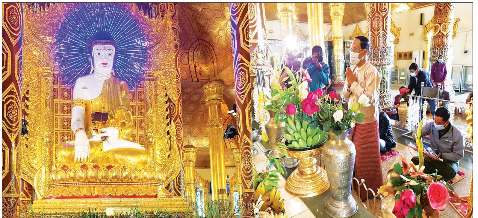
ပြည်ထောင်စုဝန်ကြီး ဦးကိုကို ပြင်ဦးလွင်မြို့ မဟာအံ့ထူးကံသာဆုတောင်းပြည့်ဘုရားကြီးအား ဖူးမြော်ကြည်ညိုပြီး ပန်း၊ ရေချမ်းတို့ဖြင့် ကပ်လှူပူဇော်စဉ်။

ယင်းနောက် ပြည်ထောင်စုဝန်ကြီးနှင့်အဖွဲ့သည် နိုင်ငံတော်ပရိယတ္တိ သာသနာ့တက္ကသိုလ် (မန္တလေး)သို့ရောက်ရှိရာအစည်းအဝေးခန်းမတွင် အမျိုးသားယဉ်ကျေးမှုနှင့် အနုပညာတက္ကသိုလ် (မန္တလေး)မှပါမောက္ခ