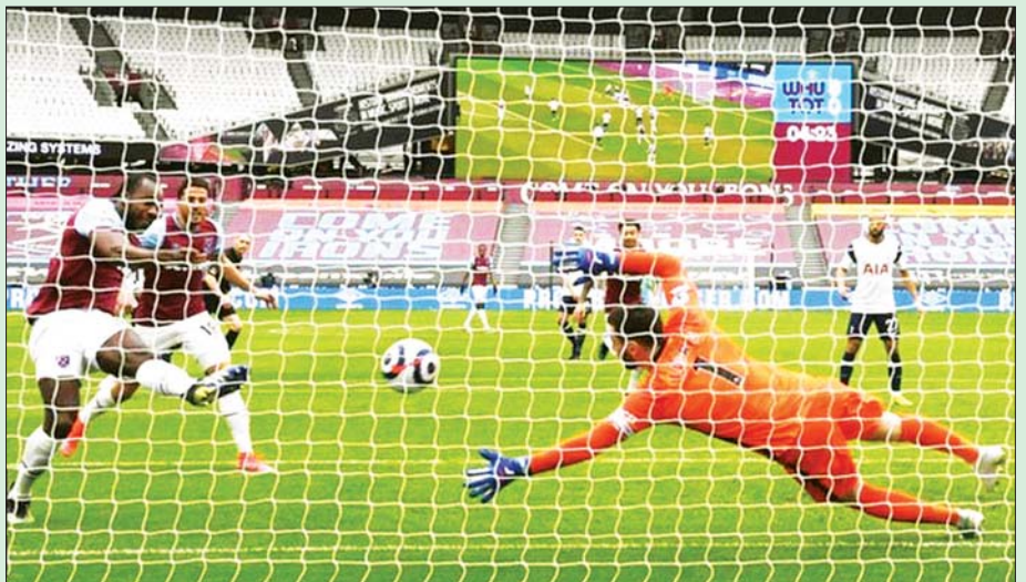
ဝက်စ်ဟမ်းအတွက် အဖွင့်ဂိုးကို တိုက်စစ်မှူး အန်တိုနီယိုက စပါးအသင်းဘက်သို့ ဘောလုံးကန်သွင်းစဉ်။