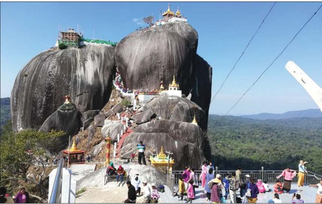
ကိုဗစ်-၁၉ ကြောင့် ဘုရားဖူးခွင့် ယာယီပိတ်ခြင်းမပြုမီက ဇလုံတောင်သို့ လာရောက်ကြသည့် ဘုရားဖူးပြည်သူများ

ဗန်းမောက် ဖေဖော်ဝါရီ ၂၁ စစ်ကိုင်းတိုင်းဒေသကြီး ဗန်းမောက် မြို့နယ်မြောက်ဘက်ရှိတောတောင်ကြီး များထူထပ်သောနေရာတွင် တည်ထား ကိုးကွယ်လျက်ရှိသည့် သမိုင်းဝင် ကုဏ္ဍာသယ ဇလုံတောင်ဘုရားသို့ ယခု အခါ ဘုရားဖူးများလာရောက် ဖူးမြော် ခွင့်ကို ပြန်လည်ခွင့်ပြုထားပြီဖြစ်သလို ကားလမ်းများကို ပြုပြင်ထား၍ လမ်းပန်းဆက်သွယ်ရေး ကောင်းမွန် ချောမွေ့လာခြင်းနှင့် တောင်တက်လမ်း များကို ပြုပြင်ထားခြင်းတို့ကြောင့် အနယ်နယ်အရပ်ရပ်မှ ဘုရားဖူးများ အနေဖြင့် အန္တရာယ်ကင်းရှင်းစွာ လာရောက် ဖူးမြော်နိုင်ပြီဖြစ်ကြောင်း သိရသည်။ နှစ်စဉ်နှစ်တိုင်း ပွင့်လင်းရာသီ ရောက်ပါက ကုဏ္ဍာသယ ဇလုံတောင် တော်ဘုရားသို့ အနယ်နယ်အရပ်ရပ်မှ ဘုရားဖူးများ တစ်နှစ်လျှင် လူဦးရေ လေးသိန်းမှ ငါးသိန်းအထိ လာရောက်ခဲ့ ကြသော်လည်း ၂၀၂၀ ပြည့်နှစ် အတွင်း၌ မူ ကိုဗစ်-၁၉ ကပ်ရောဂါကြောင့် တစ်မြို့နယ်နှင့်တစ်မြို့နယ် ကူးသန်း သွားလာမှုကို ကန့်သတ်ထိန်းချုပ်ထား ခဲ့၍ ဘုရားဖူးလာရောက်မှု နည်းပါးခဲ့ပြီး ဗန်းမောက်မြို့နယ် အတွင်းရှိဒေသခံများ သာ လာရောက်ဘုရားဖူးမှုများ ရှိခဲ့သည်။ "အခုက ပွင့်လင်းရာသီလည်းဖြစ်၊ ကိုဗစ် ကာကွယ်ထိန်းချုပ်မှုကိုလည်း ဖြေလျှော့ပေးလိုက်ပြီဆိုတော့ တစ်နေ့