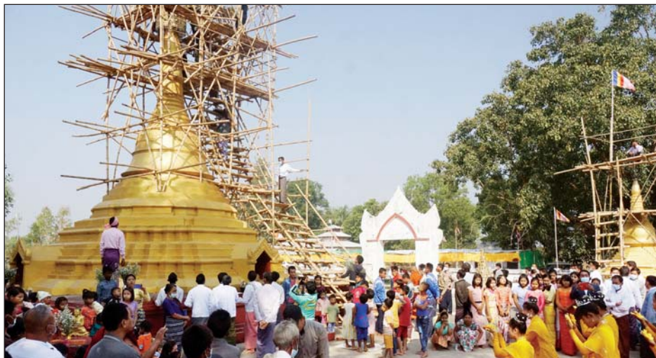
ပူဇော်ပြီးနောက် ရွှေထီးတော် ဘုံအဆင့်များကို ပူဇော်ခဲ့ကြသည်။