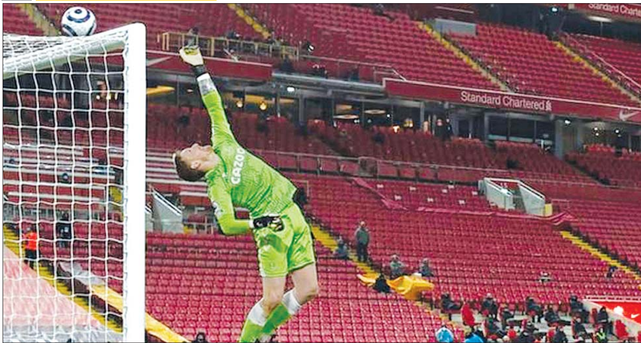
လီဗာပူးအသင်း၏ ဂိုးကန်သွင်းချက်ကို အဲဗာတန်ဂိုးသမား ပစ်ဖို့ဒ်ကာကွယ်နေစဉ်။