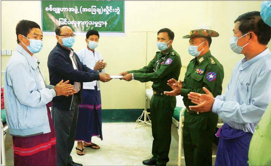
ကရင်ပြည်နယ် စီမံအုပ်ချုပ်ရေးကောင်စီဥက္ကဋ္ဌ ဦးစောမြင့်ဦး စစ်ဗျူဟာအဖွဲ့ (အခြေချ) လှိုင်းဘွဲ့ ပြင်ပလူနာကုသမှုဌာနအတွက် ထောက်ပံ့ငွေများ ပေးအပ်စဉ်။