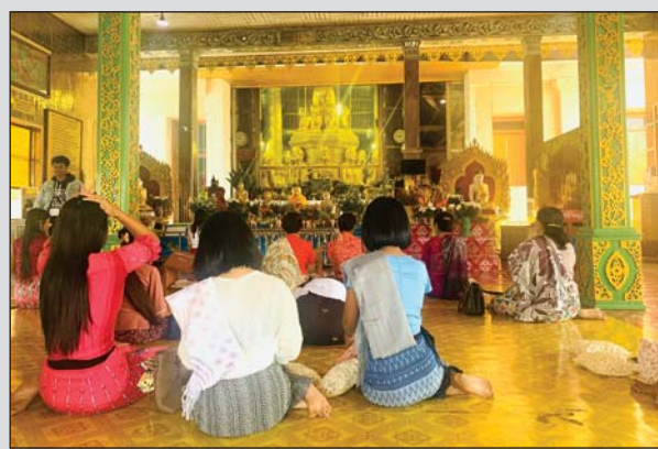
မွန်ပြည်နယ် သံဖြူဇရပ်မြို့နယ်ရှိ ထင်ရှားကျော်ကြားသည့် မျောလေး မျော သမိုင်းဝင် ကျိုက္ခမီရေလယ်ဘုရားကို ကိုဗစ်-၁၉ ကာကွယ်ရေး စည်းကမ်းချက်များနှင့်အညီ ဖွင့်လှစ်၍ ဖူးမြော်ခွင့်ပြုထားပြီဖြစ်ရာ ဖေဖော်ဝါရီ ၂၀ ရက်က လာရောက်ဖူးမြော်နေကြသူများကို တွေ့ရစဉ်။ မောင်ယဉ်ကျေး

က တာဝန်ယူ၍ ဆောင်ရွက်လျက်ရှိသည်။ လုပ်ငန်းဆောင်ရွက်မှုများ အနေဖြင့် ပစ္စည်းများ စုဆောင်းခြင်း၊ ရေပိုက်လိုင်း သွယ်တန်းရန် မြောင်းတူးခြင်း၊ ရေတားတံစ တည်ဆောက်ခြင်း၊ ဂါလန် ၅၀၀၀ ဆံ့ ရေကန် တည်ဆောက်ခြင်းတို့ကို ဆောင်ရွက်သွား ရမည်ဖြစ်ပြီး လက်ရှိအချိန်တွင် ပန်လုံကျေးရွာ ၌ လုပ်ငန်းဆောင်ရွက်မှုများမှာ ၃၀ ရာခိုင်နှုန်း ပြီးစီးပြီဖြစ်ကာ ကောင်းမူးကျေးရွာတွင် ၅၀ ရာခိုင်နှုန်း ဆောင်ရွက်ပြီးစီးနေပြီ ဖြစ်ကြောင်း သိရသည်။ စည်သူမောင်မောင်(ပြန်/ဆက်)