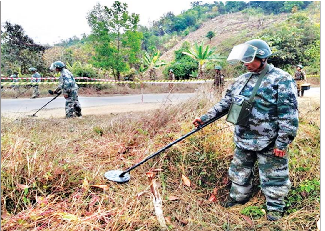
အမ်း-စစ်တွေ ပြည်ထောင်စုကားလမ်းမကြီးတစ်လျှောက် မိုင်းရှင်းလင်းရေးလုပ်ငန်းများ ဆောင်ရွက်နေစဉ်။