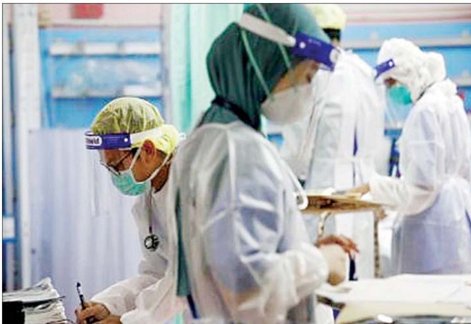
မလေးရှားနိုင်ငံတွင် ကိုဗစ်-၁၉ တိုက်ဖျက်ရေးလုပ်ဆောင်နေကြသည့် ကျန်းမာရေးဝန်ထမ်းများကို တွေ့ရစဉ်။

ရောက်ရှိလာသည်။ ကိုဗစ်-၁၉ တစ်နိုင်ငံလုံးအနှံ့ ကာကွယ်ဆေး ထိုးနှံပေးမှုများကို ဖေဖော်ဝါရီ ၂၄ ရက်တွင် စတင်မည်ဟု သိပ္ပံ၊ နည်းပညာ ဝန်ကြီး ခိုင်ရီ ဂျမာ လူဒင်က ပြောသည်။