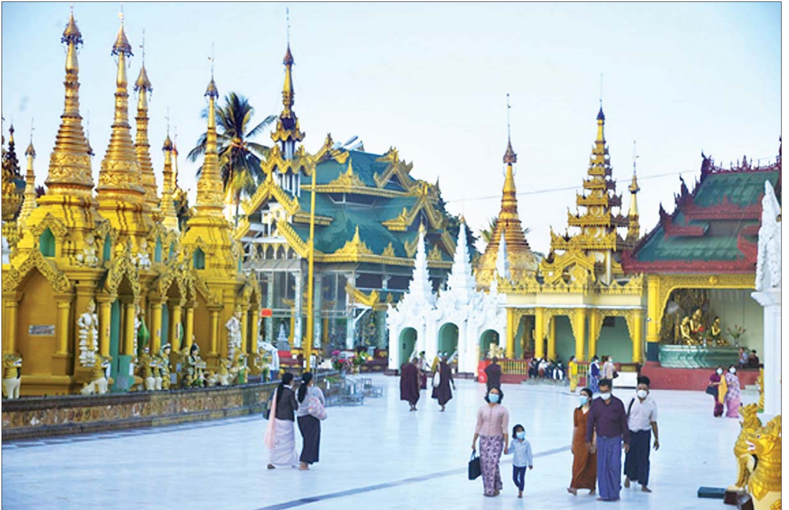
ရန်ကုန်မြို့ရှိ ရွှေတိဂုံစေတီတော်မြတ်ကြီးတွင် ပြည်သူများ စိတ်အေးချမ်းသာစွာ လာရောက်ဖူးမြော်ကြည်ညိုလျက်ရှိသည်ကို တွေ့ရစဉ်။

ထိုသို့ ပြန်လည်ဖွင့်လှစ်ထားရှိရာ ယနေ့တွင် ရန်ကုန်မြို့ရှိ ရွှေတိဂုံ စေတီတော်မြတ်ကြီး၊ မန္တလေးမြို့ရှိ မဟာမုနိရုပ်ရှင်တော်မြတ်ကြီး၊ နေပြည်တော် ကောင်စီနယ်မြေ၊ ပုဗ္ဗသီရိမြို့နယ် အတွင်းရှိ ဥပ္ပါတသန္တိစေတီတော်မြတ်ကြီးတို့အပါအဝင် ပြည်နယ်နှင့်တိုင်းဒေသကြီး အသီးသီးရှိ ဘုရား၊ စေတီပုထိုးများ၌ ဘုရားဖူးလာ သံဃာတော်များ၊ သာသနာ့နွယ်ဝင်သီလရှင်များနှင့် မိဘပြည်သူများသည် ကိုဗစ်-၁၉ စာမျက်နှာ ၃ ကော်လံ ၅ ဝ