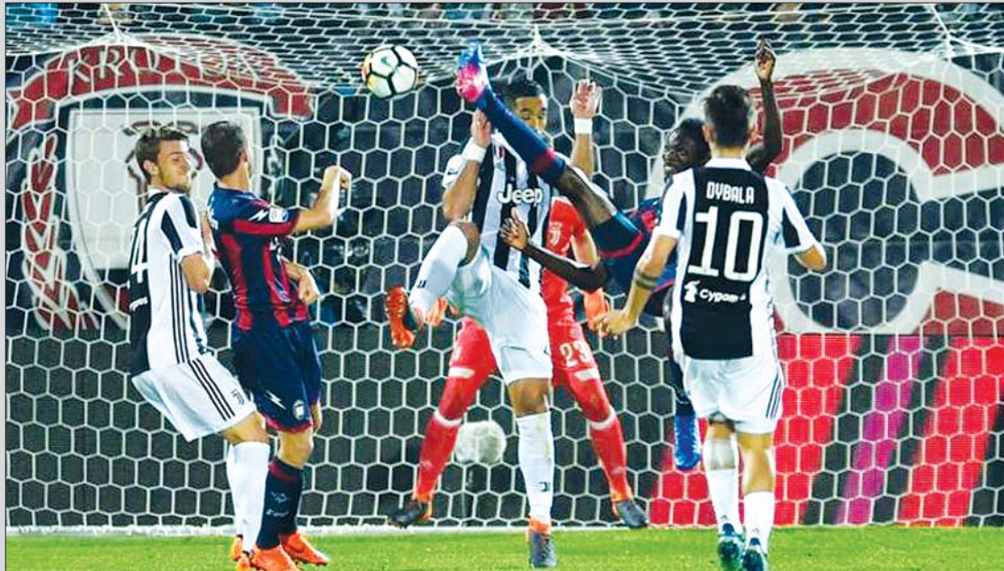
ပထမအကျော့အဖြစ် ဂျူဗင်တပ်စ်နှင့် ခရိုတုန်းအသင်းတို့ ယှဉ်ပြိုင်ကစားစဉ်။

အီတလီစီးရီးအေပွဲစဉ် (၂၃) အဖြစ် ဂျူဗင်တပ်စ်အသင်းနှင့် ခရိုတုန်းအသင်းတို့ပွဲစဉ်ကို ဖေဖော်ဝါရီ ၂၃ ရက် နံနက် ၂ နာရီ ၁၅ မိနစ်တွင် ဂျူဗင်တပ်စ်အိမ်ကွင်း၌ ယှဉ်ပြိုင်ကစားမည်