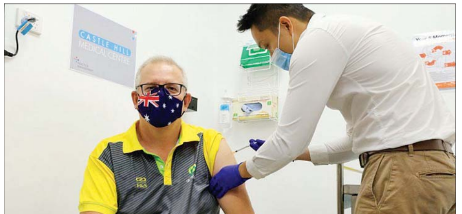
ဩစတြေးလျဝန်ကြီးချုပ် ကိုဗစ်-၁၉ ကာကွယ်ဆေး ထိုးနှံမှုခံယူနေစဉ်။

ပြည်သူများ ကိုဗစ်-၁၉ ကာကွယ်ဆေးတွင် ယုံကြည်မှုရှိစေရန်အတွက် နိုင်ငံရေးခေါင်းဆောင်များကို ဦးစွာ ကာကွယ်ဆေးထိုးပေးရန် ဆုံးဖြတ်ခဲ့ခြင်းဖြစ်သည်ဟု ဖေဖော်ဝါရီ ၂၁ ရက်အစောပိုင်းတွင် ကျန်းမာရေးဝန်ကြီး ဂရက်ဟန်းက ပြောခဲ့သည်။ အတိုက်အခံလေဘာဝါတီမှ အန်တိုနီ အယ်လ်ဘနီစ်လည်း ကိုဗစ်-၁၉ ကာကွယ်ဆေးထိုးနှံမှုခံယူမည် ဖြစ်သည်။ ကာကွယ်ဆေးနှင့်ပတ်သက်ပြီး ပြည်သူများထဲတွင် စိုးရိမ်ပူပန်မှုများ ရှိနေဆဲဖြစ်သည်။ လျင်လျင်မြန်မြန် ကာကွယ် ဆေးထိုးနှံမှုခံယူရန် အဆင်ပြေပါ့မလားဟု စိုးရိမ်နေကြသည်။ ဩစတြေးလျနိုင်ငံသားများအနေဖြင့် ကိုဗစ်-၁၉ ကာကွယ်ဆေးကို မည်သည့်အသုတ်တွင် ထိုးနှံမှုခံယူရမည်ကို စစ်ဆေးကြည့်ရှုနိုင်သည်။ ဆင်ဟွာ