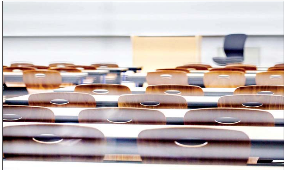
နိမ့်သည့် မိသားစုများအတွက် ပညာသင်စရိတ် ခွဲသည်။ ထောက်ပံ့မှုကိုလည်း အစိုးရက လုပ်ဆောင်ပေး

ပြီးခဲ့သည့်နှစ်ကနှင့် နှိုင်းယှဉ်လျှင် ၂၀ ရာခိုင်နှုန်း ကျဆင်းခဲ့သည်။ ကျောင်းနားသွားသည့် ဦးရေမှာ ၆၅၆၇၀ ရှိပြီး ယင်း အရေအတွက်မှာ ပြီးခဲ့သည့်နှစ်က နှင့် နှိုင်းယှဉ်လျှင် ၁၀ ရာခိုင်နှုန်း လျော့နည်းလာသည်ဟု သိရသည်။ ကပ်ရောဂါကာလအတွင်း ထောက်ပံ့ရေး ယန္တရားများကြောင့် အရေအတွက် ကျဆင်းရခြင်း ဖြစ်ကြောင်း ဝန်ကြီးဌာန အရာရှိများက ပြောသည်။ ၉၉ ရာခိုင်နှုန်းသော ကျောင်းများမှာ ဒုတိယ နှစ်ဝက် ကာလအတွက် ကျူရှင်ခပေးရမည့်အချိန်ကို ရက်ရွှေ့ပေးခဲ့သည်။ ၇၅ ရာခိုင်နှုန်းသော ကျောင်း များမှာ ဘဏ္ဍာရေးအခက်အခဲရှိသည့် ကျောင်းသား များကို ကျူရှင်ခကင်းလွတ်ခွင့်ပေးခဲ့သည်။ ဝင်ငွေ