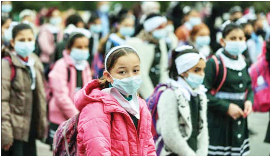
ပါးစပ်၊ နှာခေါင်းစည်းတပ်ဆင်ထားသည့် ပါလက်စတိုင်းကျောင်းသူများကို တွေ့ရစဉ်။

အစ္စရေးနှင့် ပါလက်စတိုင်းတို့ဘက်မှ အဆင့်မြင့် ကျန်းမာရေးအရာရှိကြီးများသည် နယ်မြေအတွင်း ကိုဗစ်-၁၉ ကင်းစင်ရေးအတွက် ဆွေးနွေးမှုများ ပြုလုပ်ခဲ့ကြသည်။ အစ္စရေးကျန်းမာရေးဝန်ကြီးဌာနကမူ ကာကွယ်ဆေးထောက်ပံ့ပေးမှုကို