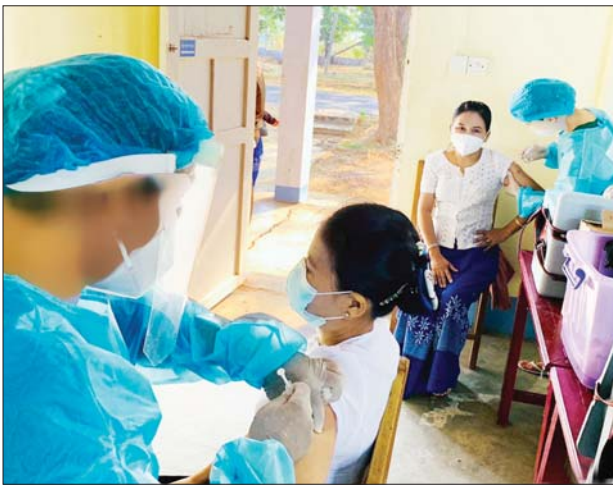
နေပြည်တော် စည်ပင်ညီညွတ်သော(၁)၌ ပြည်ထောင်စု အဆင့်ဝန်ကြီးဌာနများမှ အရာထမ်းများကို COVID-19 ရောဂါ ကာကွယ် ဆေးထိုးနှံစဉ်။

(၁၈- ၂- ၂၀၂၁) ရက်တွင် ပြည်ထောင်စုအဆင့် ဝန်ကြီးဌာန (၇)ခုမှ အရာထမ်း (၄၁၉) ဦးအား ကိုဗစ်-၁၉ ရောဂါ ကာကွယ်ဆေးထိုးနှံပြီးစီးကြောင်း သိရသည်။ သတင်းစဉ်