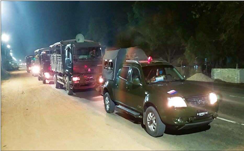
တောင်ငူ၌ တပ်မတော်နှင့် ပူးပေါင်းအဖွဲ့ဝင်များ လှည့်ကင်းဆောင်ရွက်နေစဉ်။