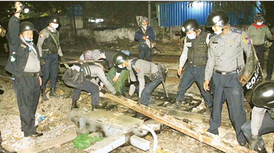
ရထားလမ်းကူးများတွင် အန္တရာယ်ဖြစ်စေရန် ပြုလုပ်ထားသော သံချောင်းများကို ရဲတပ်ဖွဲ့ဝင်များ ဖယ်ရှားရှင်းလင်းစဉ်။

ထိုသို့ပြုလုပ်ခြင်းများကြောင့် မြန်မာ့မီးရထားမှ အထက်မြန်မာပြည် အထွေထွေမန်နေဂျာ၊ မြို့နယ်အုပ်ချုပ်ရေးမှူးနှင့် တာဝန်ရှိသူများက ဆူပူလှုံ့ဆော်ဆန္ဒပြသူများအား တွေ့ဆုံ၍ အများပြည်သူများ၏ ခရီးသွားလာမှု လွယ်ကူချောမွေ့စေရေး ဆောင်ရွက်နေသည်ကို နှောင့်ယှက်ခြင်းများမပြုလုပ်ကြရန် မေတ္တာရပ်ခံခဲ့ပြီး လုံခြုံရေးတပ်ဖွဲ့ဝင်များက ၎င်းတို့ပိတ်ဆို့ထားသည့် အတားအဆီးများကို ဖယ်ရှားဆောင်ရွက်စဉ် ဆူပူလှုံ့ဆော်ဆန္ဒပြသူများက လုံခြုံရေးတပ်ဖွဲ့ဝင်များအား ရထားလမ်းဝဲ၊ ယာမှ ကျောက်ခဲများဖြင့် ပစ်ပေါက်ခြင်း၊ တုတ်၊ ဓားများဖြင့် ပစ်ပေါက် ရန်ပြုလာသောကြောင့် မြန်မာနိုင်ငံရဲတပ်ဖွဲ့ဝင်များက သတိပေးပြီး အနည်းဆုံးအင်အား၊ အနိမ့်ဆုံးအဆင့်ဖြင့် ရော်ဘာကျည်များဖြင့် ပြန်လည်ခြောက်လှန့်ပစ်ခတ်ခဲ့ရာ ည ၉ နာရီခန့်မှသာ ဆူပူလှုံ့ဆော်ဆန္ဒပြသူများအား လူစုခွဲရှင်းလင်းနိုင်ခဲ့ပြီး ဆူပူလှုံ့ဆော်ဆန္ဒပြမှုတွင် ပါဝင်ပတ်သက်သူများအား လိုအပ်သလို ဖော်ထုတ်အရေးယူနိုင်ရေး ဆက်လက်ဆောင်ရွက်လျက်ရှိ