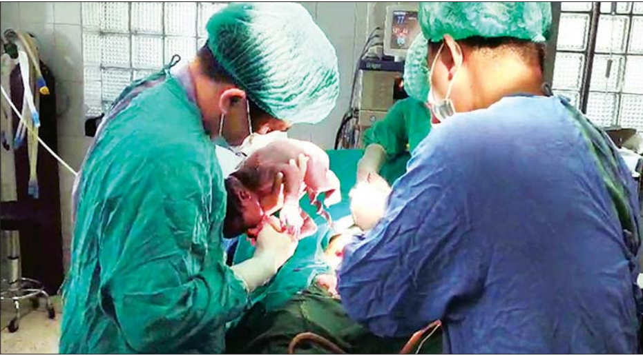
မြိတ်မြို့ တပ်မတော်ဆေးရုံတွင် မွေးလူနာတစ်ဦးကို တပ်မတော်ဆေးတပ်ဖွဲ့ဝင်များက ခွဲစိတ်၍ အောင်မြင်စွာ မွေးဖွားပေးစဉ်။

ထိုသို့ လာရောက်ကုသမှုခံယူလျက်ရှိသည့် လူနာများအနက် အကြီးစားခွဲစိတ်ကုသရန် လိုအပ်သူ ၇၀၂ ဦး၊