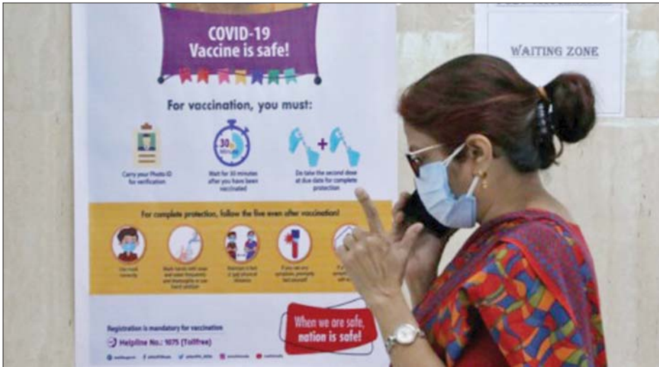
ကိုဗစ်- ၁၉ ကာကွယ်ဆေးထိုးရေး နှိုးဆော်ပန်ကြားလွှာအနီးတွင် ပါးစပ်၊ နှာခေါင်းစည်း တပ်ဆင်ပြီး ဖုန်းပြောနေသူ တစ်ဦးကို တွေ့ရစဉ်။