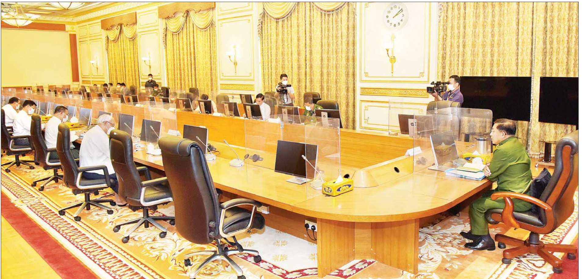
နိုင်ငံခြားရေးရာမူဝါဒကော်မတီဥက္ကဋ္ဌ၊ နိုင်ငံတော်စီမံအုပ်ချုပ်ရေးကောင်စီဥက္ကဋ္ဌ ဗိုလ်ချုပ်မှူးကြီး မင်းအောင်လှိုင် နိုင်ငံခြားရေးရာမူဝါဒကော်မတီ၏ (၁/၂၀၂၁) ကြိမ်မြောက် အစည်းအဝေးတွင် အမှာစကားပြောကြားစဉ်။