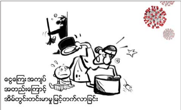
ငွေကြေးအကျပ်အတည်းကြောင့် အိမ်တွင်းတင်းမာမှု မြင့်တက်လာခြင်း

ကိုဗစ်-၁၉ ရောဂါ ကူးစက်ပြန့်ပွားနေစဉ် ကာလအတွင်းမှာ အောက်ပါအကြောင်းအချက်တွေကြောင့် အမျိုးသမီးနှင့် ကလေးငယ်တွေဟာ အိမ်တွင်းအကြမ်းဖက်မှုပုံစံအမျိုးမျိုးကို ပိုမိုတွေ့ကြုံ ခံစားရနိုင်ပါတယ်။