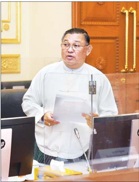
ကော်မတီအတွင်းရေးမှူး နိုင်ငံခြားရေးဝန်ကြီးဌာန ပြည်ထောင်စုဝန်ကြီး ဦးဝဏ္ဏမောင်လွင် ရှင်းလင်းတင်ပြစဉ်။

COVID-19 ကပ်ရောဂါသည် တစ်ကမ္ဘာလုံးဖြစ်ပေါ်နေသည့် ရောဂါဖြစ်ကြောင်း၊ ယင်းနှင့်ပတ်သက်၍ နိုင်ငံတကာ ပူးပေါင်းဆောင်ရွက်ရေးကိုလည်း ကျယ်ကျယ်ပြန့်ပြန့် ဆောင်ရွက်သွားရန်လိုကြောင်း၊ ကူးစက်ပြန့်ပွားမှု လျှော့ချရေး၊ ကာကွယ်ကုသရေး၊ နည်းပညာပိုင်းဆိုင်ရာတွင် ပူးပေါင်းဆောင်ရွက်ရေး၊ သတင်းအချက်အလက်ဖလှယ်ရေး ကိစ္စရပ်များသည် များစွာကျယ်ပြန့်ကြောင်း၊ ထို့ကြောင့် COVID-19 ရောဂါနှင့်ပတ်သက်၍ နိုင်ငံတကာပူးပေါင်းဆောင်ရွက်ရေးကို ထိထိရောက်ရောက် ဆောင်ရွက်ရမည်ဖြစ်ကြောင်း၊ ထို့ပြင် အခါအားလျော်စွာ ဖြစ်ပေါ်လာသည့် ကပ်ဘေးရောဂါများရှိကြောင်း၊ ယင်းကပ်ရောဂါများကိုလည်း ကျန်းမာရေးဝန်ကြီးဌာနနှင့် နိုင်ငံခြားရေးဝန်ကြီးဌာနတို့မှ ရောဂါကူးစက်မှုကာကွယ်ရေး၊ ကုသရေး၊ ထိန်းချုပ်ရေးတို့အတွက် နည်းပညာနှင့် သတင်းအချက်အလက်များ ပူးပေါင်းဆောင်ရွက်နိုင်ရေး၊ အခြားနိုင်ငံများနှင့် ဆက်သွယ်ဆောင်ရွက်၍ မိမိတို့နိုင်ငံအနေဖြင့် အမြန်ဆုံး တုံ့ပြန်ဆောင်ရွက်နိုင်ရန်အတွက် စဉ်းစား