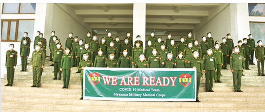
COVID-19 ရောဂါကုသရေးဌာန(ဖောင်ကြီး)တွင် တာဝန်လဲလှယ်ထမ်းဆောင်ကြမည့် ဆေးဝန်ထမ်းတပ်ဖွဲ့ဝင်များကို တွေ့ရစဉ်။

အဆိုပါ လှည်းကူးမြို့နယ် COVID-19 ရောဂါ ကုသရေးဌာန (ဖောင်ကြီး)တွင် (၁၃)ကြိမ်မြောက် အဖြစ် သွားရောက် တာဝန်ထမ်းဆောင်လျက်ရှိသည့် ဆေးဝန်ထမ်းတပ်ဖွဲ့ဝင် ပါရဂူများ၊ ဆေးမှူးဆရာဝန်များ စုစုပေါင်း ၄၀ ဦးနှင့်