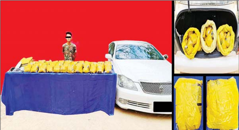
စွမ်းသီဟအား သိမ်းဆည်းရမိသည့် ဘိန်းစိမ်းများနှင့်အတူ တွေ့ရစဉ်။

ယင်း သတင်းထုတ်ပြန်ချက်၌ မူးယစ် ဝင်များပါဝင်သော ပူးပေါင်းအဖွဲ့သည် ဖေဖော်ဝါရီ ၁၇ ရက် ညနေ ၅ နာရီခွဲတွင် ကျောက်ဆည်