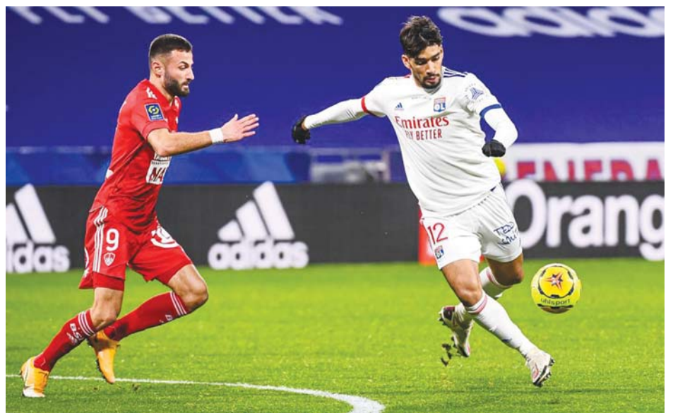
ပထမအကျော့ပွဲစဉ်မှ လိုင်ယွန်အသင်းနှင့် ဘရက်စ်အသင်းတို့ ယှဉ်ပြိုင်ကစားစဉ်

လိုင်ယွန်အသင်းက စိန့်အက်တီယန်၊ ဘော်ဒိုး၊ ဒီဗျန်၊ စထရာဘော့ဂ်၊ အေဂျက်စ်ယိုစသည့်အသင်းများကို