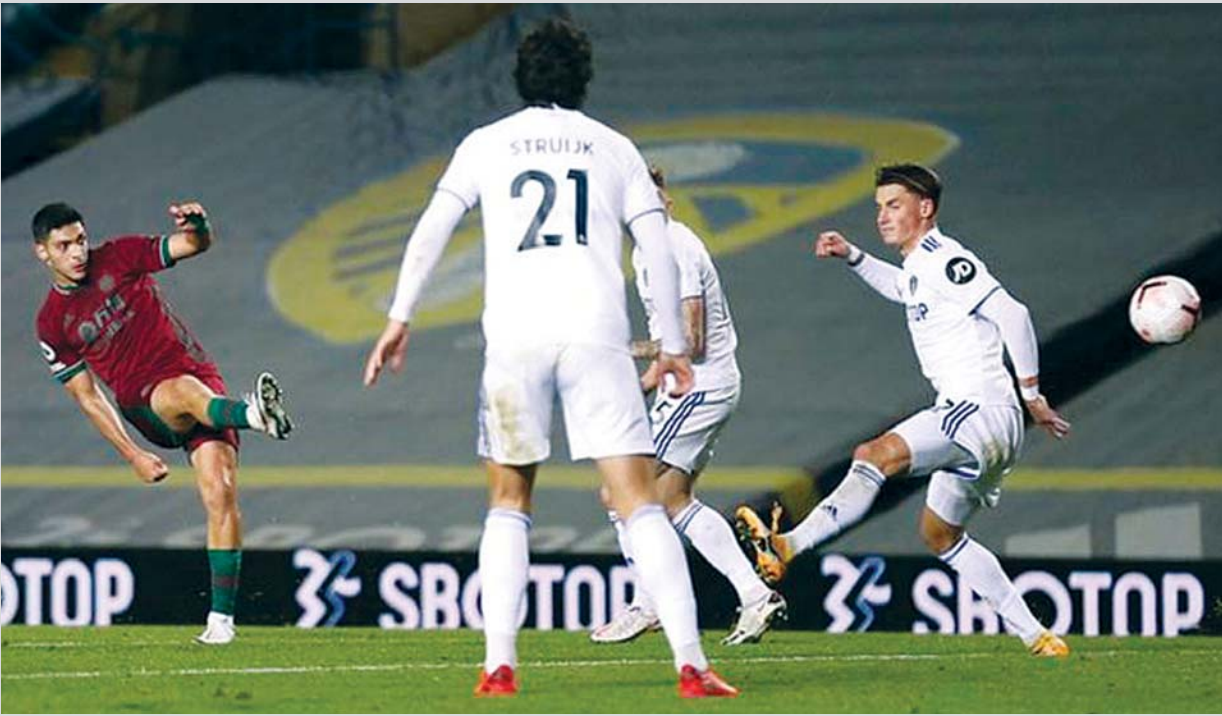
လိဒ်အသင်းနှင့် ပုလဲအသင်းတို့ ပထမအကျော့ ယှဉ်ပြိုင်ကစားခဲ့စဉ်က ပုလဲအသင်းမှ ကစားသမားတစ်ဦး လိဒ်အသင်းဘက်သို့ ဂိုးသွင်းယူရန် ကြိုးပမ်းစဉ်။

ပရီမီယာလိဂ်ပွဲစဉ် (၂၅)မှ အစောဆုံးပွဲစဉ်အဖြစ် ပုလဲအသင်းနှင့် လိဒ်အသင်းတို့ပွဲစဉ်ကို ဖေဖော်ဝါရီ ၂၀ ရက် နံနက် ၂ နာရီခွဲတွင် ပုလဲအိမ်ကွင်း၌ ယှဉ်ပြိုင် ကစားသွားမည်ဖြစ်သည်။ ပရီမီယာလိဂ် ပွဲစဉ် (၂၄)ယှဉ်ပြိုင်ကစားအပြီးတွင် မန်စီးတီးအသင်းက ရမှတ် ၅၃ မှတ်ဖြင့် အမှတ်ပေးဇယားကို ဦးဆောင်ထားသည်။