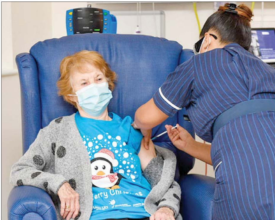
ဗြိတိန်တွင် ကိုဗစ်- ၁၉ ကာကွယ်ဆေးထိုးပေးနေသည်ကို တွေ့ရစဉ်။

မေလတွင် အသက် ၅၀ ကျော် အရွယ်များအားလုံးနှင့် စက်တင်ဘာလတွင် အရွယ်ရောက်လူဦးရေအားလုံးတို့ကို ကာကွယ်ဆေးထိုးနှံပေးနိုင်ရန် နောက်ထပ်ခြေလှမ်းတစ်ရပ် အနေဖြင့် ရည်မှန်းထားကြောင်း သိရသည်။ အေအက်ဖ်ပီ