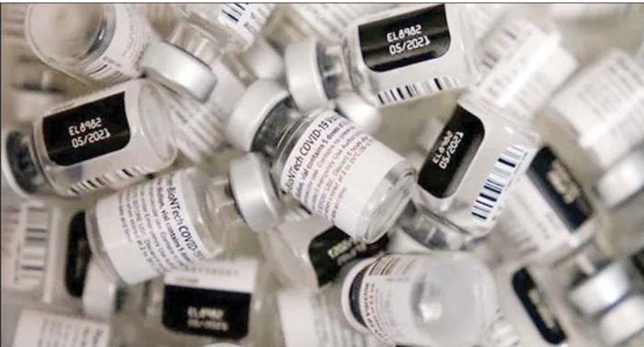
ကိုဗစ်- ၁၉ ကာကွယ်ဆေးများကို တွေ့ရစဉ်။

ဗြိတိန်နိုင်ငံမှာ ကိုဗစ်- ၁၉ ကူးစက်မှုတွေဟာ ကျဆင်းလာပြီး ကာကွယ်ဆေးထိုးနှံမှုတွေဟာ ပိုမို အင်တိုက်အားတိုက် လုပ်ဆောင်လာတဲ့အတွက် နေအိမ် အတွင်း နေထိုင်ရမယ်ဆိုတဲ့ စည်းမျဉ်းစည်းကမ်းတွေကို မတ်လအစောပိုင်းမှာ ဖယ်ရှားပေးနိုင်တော့မှာ ဖြစ်ပါ