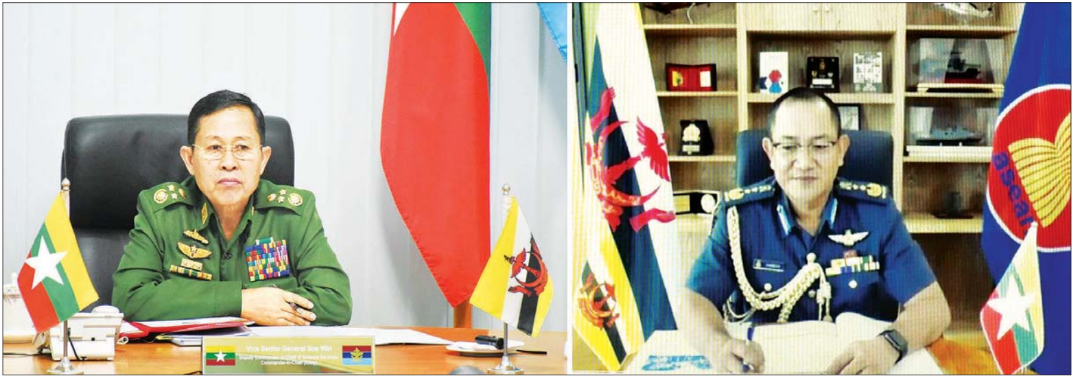
နိုင်ငံတော်စီမံအုပ်ချုပ်ရေးကောင်စီ ဒုတိယဥက္ကဋ္ဌ ဒုတိယတပ်မတော်ကာကွယ်ရေးဦးစီးချုပ် ကာကွယ်ရေးဦးစီးချုပ်(ကြည်း) ဒုတိယဗိုလ်ချုပ်မှူးကြီး စိုးဝင်းနှင့် ဘရူနိုင်ငံဘုရင့်တပ်မတော် ကာကွယ်ရေးဦးစီးချုပ် Major General Dato Seri Pahlawan Haji Hamzah bin Haji Sahat တို့ ဗီဒီယိုကွန်ဖရင့်စနစ်ဖြင့် တွေ့ဆုံဆွေးနွေးစဉ်။