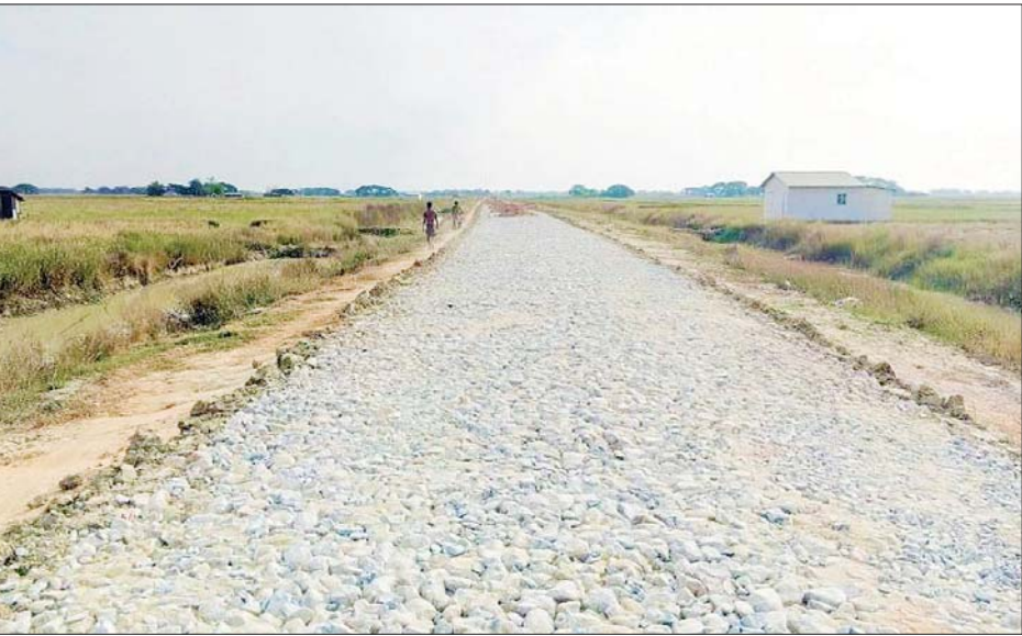
လမ်းပုံ- ရခိုင်ချောင်းကျေးရွာနှင့် ခနောင်ကျေးရွာချင်းဆက် မြို့ရှောင်လမ်းမကြီး အပိုင်း(၂) ကျောက်ချောလမ်းခင်းခြင်းကို မြင်တွေ့ရစဉ်။

“ မြို့ပြဖွံ့ဖြိုးတိုးတက်မှုနဲ့ အတူ ကျေးလက်ဒေသတွေရဲ့ လမ်းပန်းဆက်သွယ်ရေးကဏ္ဍကိုပါ အရှိန်အဟုန်မပျက် ဆောင်ရွက်နေပါတယ်။ ကျွဲလူးအိုင်ကျေးရွာ အဝင်လမ်းအရှည်ပေ ၇၂၀၀၊ အကျယ် ၁၄ ပေကို ကျောက်ချောလမ်း ခင်းပြီးပါပြီ။ ညောင်ပင်ကျေးရွာကနေ ရွှေလှေချောင်းကျေးရွာအထိ အရှည် ပေ ၁၆၅၀၀ ကျောက်ချောလမ်းအဖြစ် အဆင့်မြှင့်တင်ခဲ့ပြီးဖြစ်ပါတယ်။ ရခိုင်ချောင်ကျေးရွာနဲ့ ခနောင်ကျေးရွာတို့ကို ဆက်သွယ်တဲ့ မြို့ရှောင်လမ်းမကြီးကိုလည်း အပိုင်း(၁) အရှည် ပေ ၆၈၀၀ ကို ၂၀၁၉-၂၀၂၀ ဘဏ္ဍာနှစ်မှာ ကျောက်ချောလမ်းခင်းပြီးသွားပါပြီ။ အပိုင်း(၂) အရှည် ပေ ၈၀၀၀၊ အကျယ် ၁၆ ပေ ကျောက်ချောလမ်းခင်းခြင်း လုပ်ငန်းအနေနဲ့ ၇၅ ရာခိုင်နှုန်း ဆောင်ရွက်ပြီးစီးနေပါပြီ။ လာမယ့်