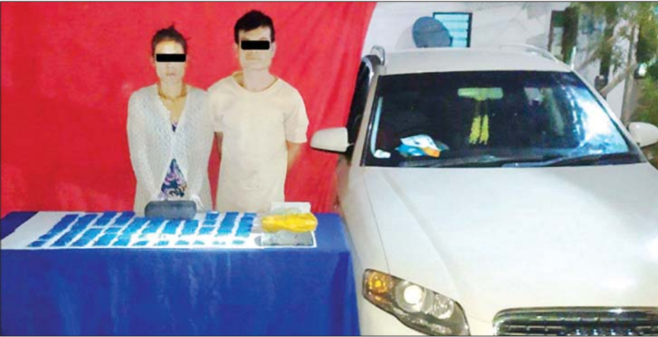
မနေ့နီဖော်(ခ)မရွှေ၊ စောဖဝေါ်တို့အား သိမ်းဆည်းရမိသည့် စိတ်ကြွေးသွပ်ဆေးပြားများနှင့်အတူ တွေ့ရစဉ်။