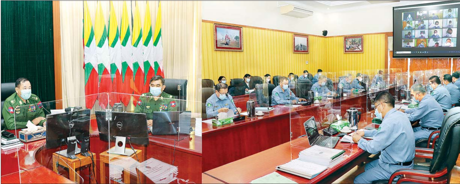
ပြည်ထောင်စုဝန်ကြီး ဒုတိယဗိုလ်ချုပ်ကြီး ထွန်းထွန်းနောင် နယ်စပ်ဒေသဖွံ့ဖြိုးရေးနှင့် လူ့စွမ်းအားအရင်းအမြစ်ဖွံ့ဖြိုးရေးဆိုင်ရာ လုပ်ငန်းညှိနှိုင်းအစည်းအဝေးတွင် အမှာစကားပြောကြားစဉ်။ သတင်းစဉ်

ချက်များနှင့်အညီ အသိ၊ သတိတို့ဖြင့် လုပ်ငန်းတာဝန်များကို ကျေပွန်စွာ ထမ်းဆောင်ကြစေလိုကြောင်း၊ ခေတ္တ ပိတ်ထားရသည့် လူ့စွမ်းအားအရင်း အမြစ်ဖွံ့ဖြိုးရေးဆိုင်ရာတက္ကသိုလ်၊ ဒီဂရီကောလိပ်၊ လူငယ်သင်တန်း ကျောင်းနှင့် သက်မွေးပညာသင်တန်း ကျောင်းများကိုလည်း ကိုဗစ်- ၁၉ အလွန်ကာလများတွင် စနစ်တကျ ပြန်လည်ဖွင့်လှစ်နိုင်ရေး၊ နည်းပြ များနှင့် ဝန်ထမ်းများ၏ စွမ်းဆောင် ရည်မြှင့်တင်ရေး Capacity Building အတွက် စဉ်ဆက်မပြတ်လေ့ကျင့် သင်ကြားမှုများ ဆောင်ရွက်ရေး၊ ၂၀၂၀-၂၀၂၁ ဘဏ္ဍာရေးနှစ်အတွင်း တိုင်းဒေသကြီးနှင့် ပြည်နယ်အလိုက် ဆောင်ရွက်လျက်ရှိသော တည် ဆောက်ရေးလုပ်ငန်းများကို သတ်မှတ် အရည်အသွေး၊ စံချိန်စံညွှန်းများနှင့် အညီ အချိန်မီပြီးစီးရေးတို့ကို သတိပြု ဆောင်ရွက်ကြရန်နှင့် လုပ်ငန်းနှင့် စပ်လျဉ်း၍ တွေ့ကြုံရသည့် စိန်ခေါ် မှုများ၊ လိုအပ်ချက်များအပေါ် ညှိနှိုင်းပေါင်းစပ် ဖြေရှင်းပေးနိုင်ရေး အတွက် လုပ်ငန်းညှိနှိုင်းအစည်း အဝေး ကျင်းပ ပြုလုပ်ရခြင်းဖြစ် ကြောင်း။ စာမျက်နှာ ၃ ကော်လံ ၁ ခု