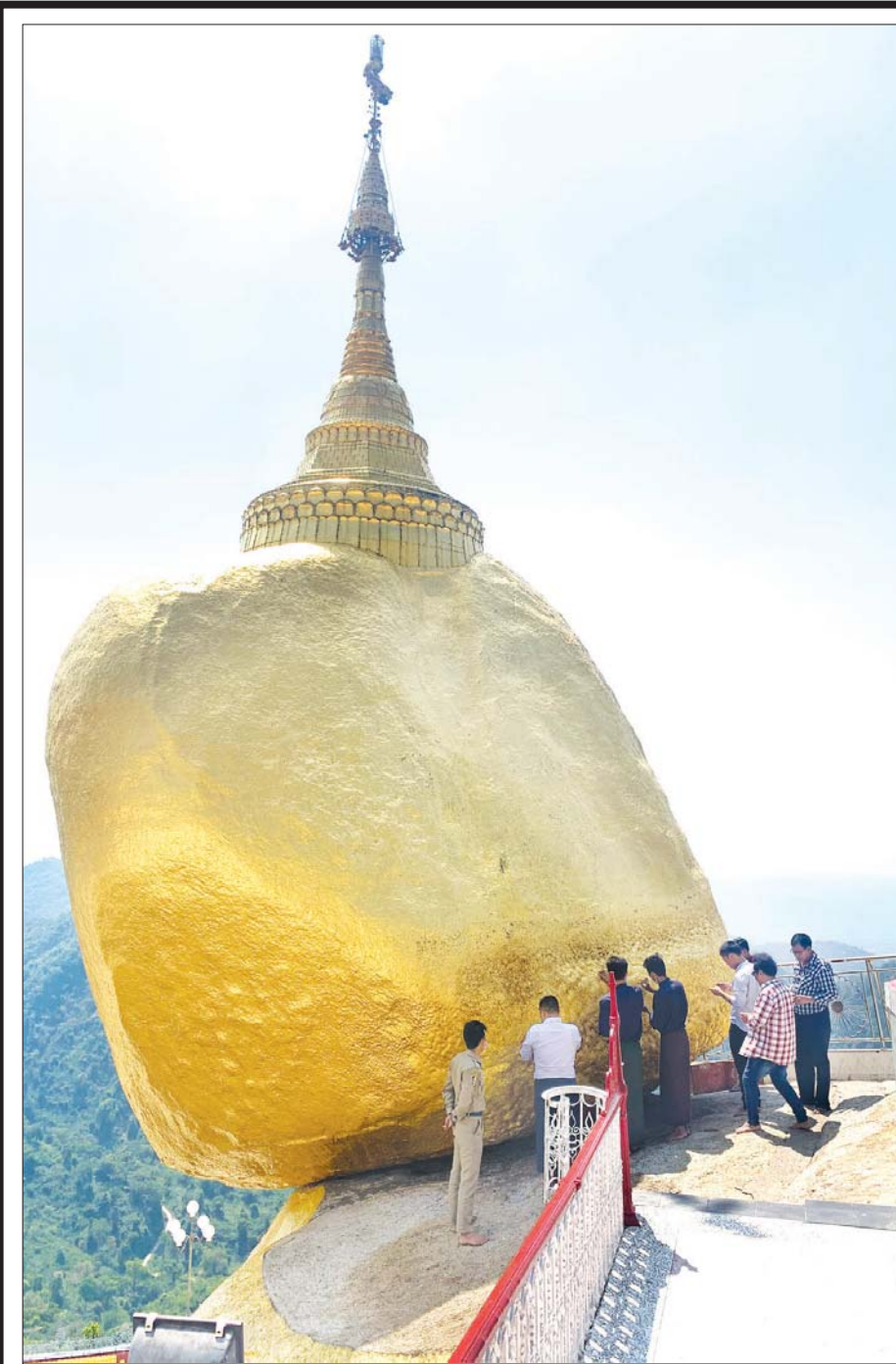
ကျိုက်တုံမြို့နယ်ရှိ ကျိုက်ထီးရိုးစေတီတော်ကြီးအား ဖူးမြော်ခွင့်ကို ဖေဖော်ဝါရီ ၈ ရက်မှစတင်ကာ ဘုရားဖူးခွင့် ပြန်လည်ခွင့်ပြုခဲ့ရာ ဘုရားဖူးလာရောက်သူများအား ဖေဖော်ဝါရီ ၁၇ ရက်က တွေ့မြင်ရစဉ်။