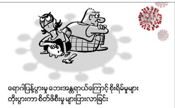
ရောဂါပြန့်ပွားမှု ဘေးအန္တရာယ်ကြောင့် စိုးရိမ်မှုများ တိုးပွားကာ စိတ်ဖိစီးမှု များပြားလာခြင်း

ငွေရေးကြေးရေးနဲ့ စီးပွားရေးအကျပ်အတည်းတွေကြောင့် အိမ်တွင်းတင်းမာမှုတွေ မြင့်တက်လာခြင်း