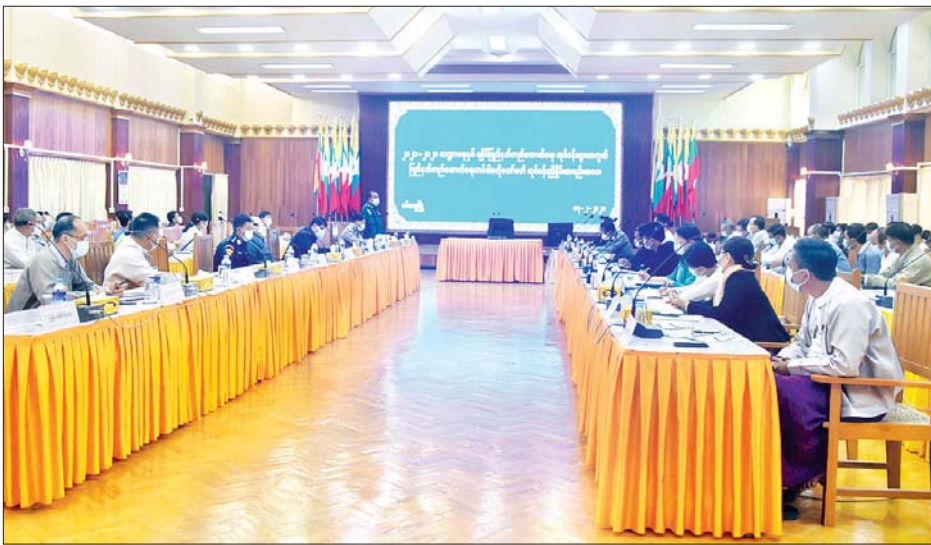
ရခိုင်ပြည်နယ် တည်ဆောက်ရေးတင်ဒါဗဟိုကော်မတီ လုပ်ငန်းညှိနှိုင်းအစည်းအဝေး ကျင်းပစဉ်။