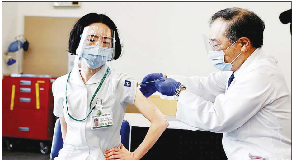
ဂျပန်နိုင်ငံတွင် ကိုဗစ်-၁၉ ကာကွယ်ဆေးထိုးပေးနေသည်ကို တွေ့ရစဉ်။

ကာကွယ်ဆေးထိုးခြင်း၏ ဘေးထွက်ဆိုးကျိုးများကို စမ်းသပ်စစ်ဆေးရန် ဒုတိယအကြိမ် ကာကွယ်ဆေးထိုးနှံမှု ခံယူပြီးသည့် ကနဦး ဦးစားပေးအုပ်စုမှ ဦးရေ ၂၀၀၀၀ ခန့်ကို သီတင်းပတ်လေးပတ်ကြာ သုတေသနဆန်းစစ် လေ့လာရန် စီစဉ်ထားကြောင်း ကျန်းမာရေးဝန်ကြီးဌာနက ပြောကြားလိုက်သည်။ ထို့နောက် ၎င်းတို့၏ တွေ့ရှိချက်များ ကို မကြာမီထုတ်ပြန်ပေးသွားမည်ဖြစ်ကြောင်း သိရသည်။ ကျန်းမာရေးဝန်ကြီးဌာနသည် မတ်လလယ်ခန့်တွင်