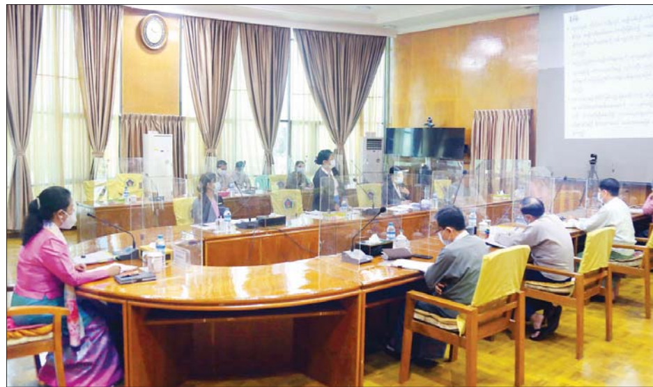
အပြည်ပြည်ဆိုင်ရာအမျိုးသမီးများနေ့ အထိမ်းအမှတ် အခမ်းအနားကျင်းပရန်နှင့် မြန်မာနိုင်ငံလုံးဆိုင်ရာ အမျိုးသမီး ကော်မတီအဆင့်ဆင့် ပြန်လည်ဖွဲ့စည်းရေး ဆွေးနွေးညှိနှိုင်းအစည်းအဝေးကျင်းပစဉ်။

နေပြည်တော် ဖေဖော်ဝါရီ ၁၇ အပြည်ပြည်ဆိုင်ရာ အမျိုးသမီးများနေ့ အထိမ်းအမှတ် အခမ်းအနားကျင်းပရန်နှင့် မြန်မာနိုင်ငံလုံးဆိုင်ရာ အမျိုးသမီးကော်မတီအဆင့်ဆင့် ပြန်လည်ဖွဲ့စည်းရေး ဆွေးနွေးညှိနှိုင်းအစည်းအဝေးကို ယနေ့နံနက်ပိုင်းတွင် လူမှုဝန်ထမ်း၊ ကယ်ဆယ်ရေးနှင့် ပြန်လည်နေရာချထားရေး ဝန်ကြီးဌာန ဝန်ကြီးရုံးအစည်းအဝေးခန်းမ၌ ကျင်းပ သည်။