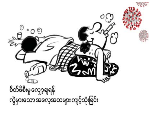
စိတ်ဖိစီးမှု လျော့ချရန် လွှဲမှားသော အလေ့အထများ ကျင့်သုံးခြင်း

ရောဂါပြန့်ပွားမှု ဘေးအန္တရာယ်ကြောင့် စိုးရိမ်ပူပန်မှုတွေ တိုးပွားလာပြီး စိတ်ဖိစီးမှု များပြားလာခြင်း