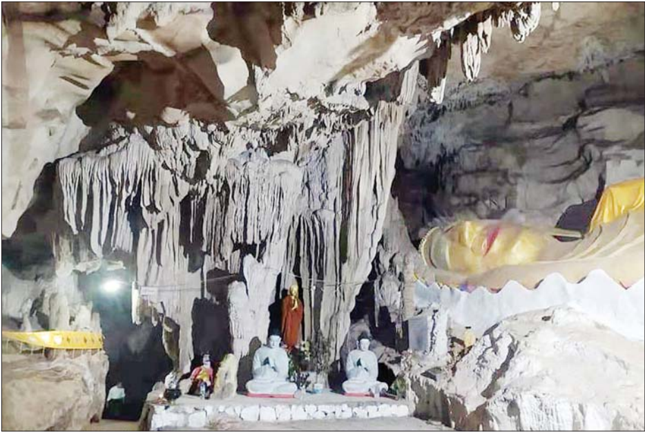
ဓမ္မဂန္ထီရသာသနာ့လိုဏ်ဂူ

ဌာနေဒေသခံ ညီနောင်တိုင်းရင်းသားများဖြစ်သည့် အာခါလားဟု၊ လွယ်၊ ဗမာနှင့် အခြားလူမျိုးစုများ စုပေါင်း မှီတင်းနေထိုင်လျက်ရှိကြပြီး လွတ်လပ်ခြင်းနှင့် ညီမျှခြင်းများကိုလည်း လေးစားမြတ်နိုး တန်ဖိုးထားခဲ့ကြသည်။ ထို့အပြင် ဗုဒ္ဓမြတ်စွာဘုရား၏ ဓာတ်တော်၊ ဓမ္မတော်များ ဌာပနာထားရာ စေတီပုထိုးများကို မျက်စိတဆုံး သပ္ပာယ်စွာ ဖူးမြော်ရမည်ဖြစ်ပြီး သန့်ရှင်းစင်ကြယ်သည့် ထေရဝါဒဗုဒ္ဓသာသနာတော်ကြီး ထွန်းလင်းတောက်ပနေသည်ကိုလည်း တွေ့မြင်နိုင်မည်ဖြစ်သည်။