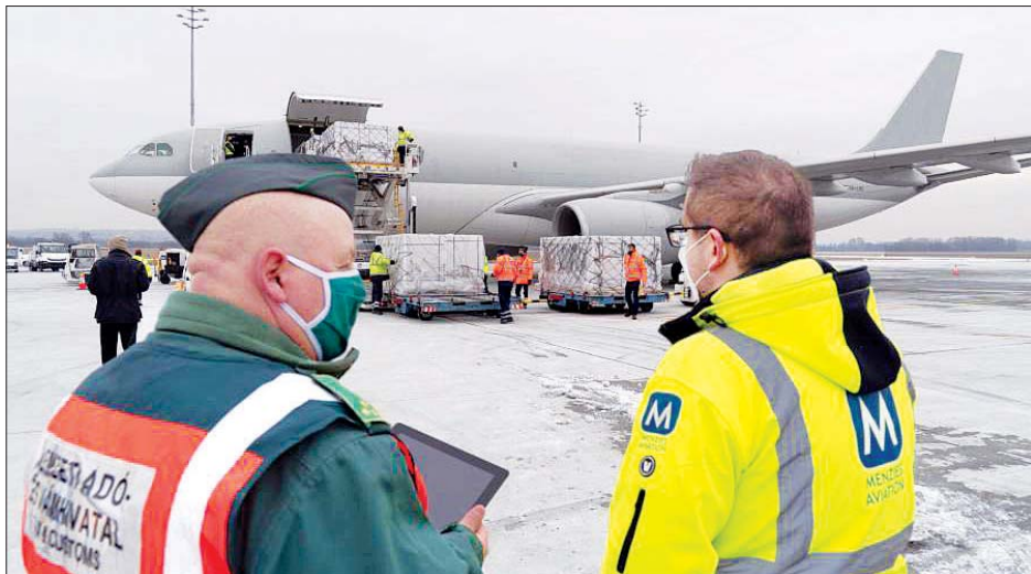
ဟန်ဂေရီနိုင်ငံသို့ရောက်ရှိလာသော တရုတ်နိုင်ငံထုတ် ဆီနီဖမ်း ကိုဗစ်-၁၉ ကာကွယ်ဆေးများ လေယာဉ်ပေါ်မှ သယ်ဆောင်နေသည်ကို တွေ့ရစဉ်။

အက်စ်ထရာဇနီကာ ကိုဗစ်-၁၉ ကာကွယ်ဆေးများကိုလည်း မေလ နှောင်းပိုင်းနှင့် ဇွန်လအစောပိုင်း တွင် အသုံးပြုနိုင်မည်ဖြစ်ကြောင်း ဆက်လက်ပြောကြားလိုက်သည်။ ဘိုင်အိုဆိုင်းရင့် ကုမ္ပဏီက ထုတ်လုပ်လျက်ရှိသော အက်စ်ထရာ ဇနီကာ ကာကွယ်ဆေးကို နိုင်ငံပေါင်း ၆၀ သို့ ပေးပို့သွားမည်ဖြစ်ကြောင်း နှင့် အထူးသဖြင့် အရှေ့တောင်အာရှ နိုင်ငံများသို့ ပေးပို့သွားမည်ဖြစ် ကြောင်း အနုတင်က ပြောကြားလိုက် သည်။ ဆင်ဟွာ