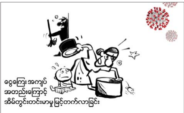
ငွေကြေးအကျပ်အတည်းကြောင့် အိမ်တွင်းတင်းမာမှု မြင့်တက်လာခြင်း

ကိုဗစ်-၁၉ ရောဂါ ကူးစက်ပြန့်ပွားနေစဉ် ကာလအတွင်းမှာ အောက်ပါအကြောင်းအချက်တွေကြောင့် အမျိုးသမီးနှင့် ကလေးငယ်တွေဟာ အိမ်တွင်းအကြမ်းဖက်မှုပုံစံအမျိုးမျိုးကို ပိုမိုတွေ့ကြုံ ခံစားရနိုင်ပါတယ်။