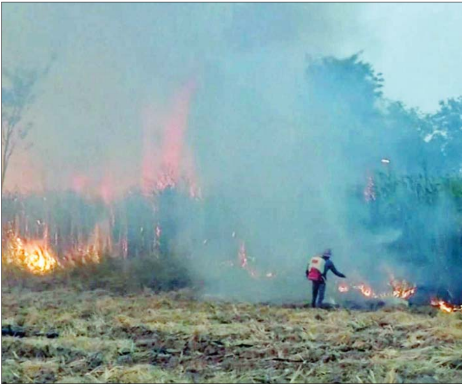
ကြိတ်သိမ်းရန် ကြိတ်ခင်းများကို မီးရှို့ခြင်းနည်းလမ်းဖြင့် လုပ်ဆောင်နေစဉ်။

စက်ဖြင့်ကြိတ်များ ရိတ်သိမ်းခြင်းမှာ လုပ်သားသုံး၍ ကြိတ်ခင်းထက် အဆ ၁၀၀ပို၍ မြန်ဆန်သည်။ သို့သော်လည်း ကုန်ကျစရိတ်မှာ များပြားလွန်းသည်။ တစ်ပိုင်တစ်နိုင် စီးပွားရေးလုပ်ကိုင်သူများအတွက်မူ လက်လှမ်းမီနိုင်သည့် အနေအထားထက် ကျော်လွန်နေသည်။ ရင်းနှီးမြှုပ်နှံလိုသူများအတွက် အစိုးရက အတိုးနှုန်း