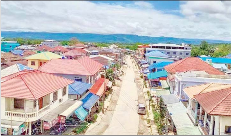
မိုင်းယောင်းမြို့

“တစ်ဖူးရလို့ တစ်ပဲလှူ တိုရမ်းတောင်သူ တူနိုင်ရိုးလား” ဆိုသည့် ဆိုရိုးစကားအတိုင်း စေတနာရက်ရောလွန်းလှသည့် တိုင်းရင်းသားတို့၏ လှူဒါန်းမှုအစုစုမှလည်းမြင်ရကြားရသူတိုင်း မုဒိတာပွား ဝမ်းသာပီတိ ဖြစ်စရာပင်ဖြစ်သည်။ ရိုးစင်းပြီး ယဉ်ကျေးလှသည့် ရှမ်းရိုးရာဝတ်စုံများနှင့် မိုင်းယောင်းသူ ရှမ်းမျိုးဖြူလေးများ၏ နေထိုင်မှု ဓလေ့များသည်လည်း ယဉ်ကျေးမှုအဆင့်မြင့်လွန်းလှသည်။ မိုင်းယောင်းတွင် ရှမ်းတိုင်းရင်းသားများနှင့်အတူ