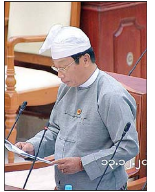
ဒုတိယဝန်ကြီး ဦးလှကျော်

သွားမည်ဖြစ်ပါကြောင်း ရှင်းလင်းဖြေကြားသည်။