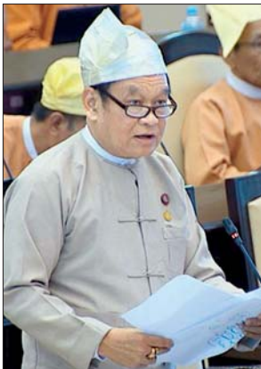
ပြည်ထောင်စုဝန်ကြီး ဒေါက်တာမြင့်ထွေး

မကွေးတိုင်းဒေသကြီး မဲဆန္ဒနယ် အမှတ်(၈)မှ ဦးဝင်းမြင့်၏ ကျေးလက်လယ်ယာမြေလုပ်ငန်းခွင်တွင် ကြုံတွေ့ရလေ့ရှိသော မြေဆိုးအက်ကိရ်ရမှုကြောင့် အသက်ဆုံးရှုံးနိုင်မှုကို ကာကွယ်နိုင်သည့် မြေဆိပ်ဖြေဆေးကို အချိန်စောနိုင်သမျှ စောစောထိုးနှံကုသမှု ရရှိနိုင်ရေးအတွက် စီမံထားရှိမှုကို သိရှိလိုခြင်းမေးခွန်းနှင့် စပ်လျဉ်း၍ ကျန်းမာရေးနှင့် အားကစားဝန်ကြီးဌာန ပြည်ထောင်စုဝန်ကြီး ဒေါက်တာမြင့်ထွေးက မြေဆိပ်ဖြေဆေး ပြတ်လပ်မှုမရှိစေရေးအတွက် ၂၀၁၈ - ၂၀၁၉ဘဏ္ဍာရေးနှစ်တွင် မြေဟောက် မြေဆိပ်ဖြေဆေးပေါင်း ၂၂၀၀၇ လုံးနှင့် မြေပွေး မြေဆိပ်ဖြေဆေးပေါင်း ၁၇၇၄၂၀ ကို ဖြန့်ဝေထားပါကြောင်း၊ ထို့ပြင် ကျေးလက်ကျန်းမာရေးဌာနများ၌ မြွေကိုက်လူနာကုသရန် စမ်းသပ်စစ်ဆေးခြင်းလမ်းညွှန်ကို ရက်ပိုင်းအတွင်း ထုတ်ဝေမည်ဖြစ်ပါကြောင်း၊ ယင်းလမ်းညွှန်ကို ကျေးလက်ကျန်းမာရေးဌာနနှင့် ဖြစ်နိုင်ပါက ဌာနခွဲအထိ အားလုံးဖြန့်ဝေရန် အစီအစဉ်ရှိပါကြောင်း၊ ထိုသို့လုပ်ဆောင်