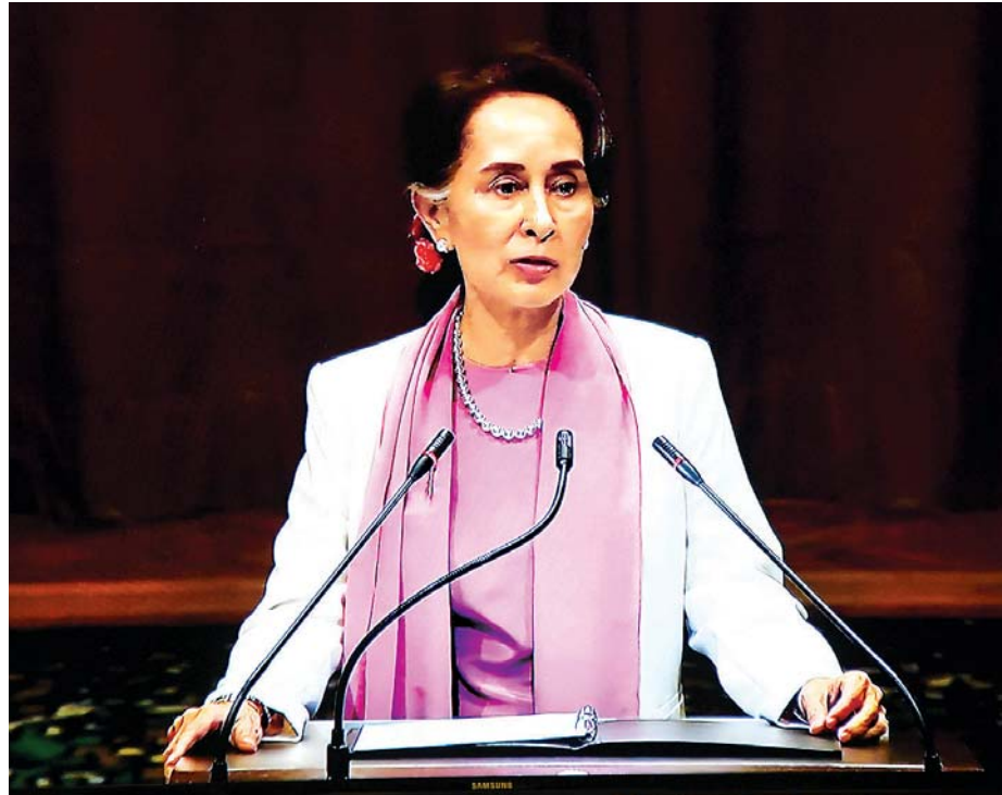
နိုင်ငံတော်၏အတိုင်ပင်ခံပုဂ္ဂိုလ် ဒေါ်အောင်ဆန်းစုကြည် အပြည်ပြည်ဆိုင်ရာတရားရုံး(ICJ)၌ ဂမ်ဘီယာနိုင်ငံက တင်သွင်းသည့်ကိစ္စအပေါ် ဒုတိယအကြိမ် တက်ရောက်ရှင်းလင်းပြောကြားစဉ်။ သတင်းစဉ်

နေပြည်တော် ဒီဇင်ဘာ ၁၃ နိုင်ငံတော်ဓာတ်အားစနစ်မှ လျှပ်စစ်ဓာတ်အားသုံးစွဲမှု တစ်နိုင်ငံလုံး၏ ၅၀ ရာခိုင်နှုန်း ပြည့်မြောက်သည့် အထိမ်းအမှတ်အခမ်းအနားကို ယနေ့နံနက်ပိုင်းတွင် နေပြည်တော်ရှိ လျှပ်စစ်နှင့် စွမ်းအင်ဝန်ကြီးဌာန၌ ကျင်းပရာ နိုင်ငံတော်သမ္မတ ဦးဝင်းမြင့် တက်ရောက်၍ ဂုဏ်ပြုအမှာစကားပြောကြားသည်။ အခမ်းအနားသို့ ပြည်သူ့လွှတ်တော်ဥက္ကဋ္ဌ ဦးတိ ခွန်မြတ်၊ အမျိုးသားလွှတ်တော်ဥက္ကဋ္ဌ မနန်းဝင်းခိုင်သန်း၊ ပြည်ထောင်စုဝန်ကြီးများ၊ ပြည်ထောင်စုရှေ့နေချုပ်၊ နေပြည်တော်ကောင်စီဥက္ကဋ္ဌ၊ ပြည်သူ့လွှတ်တော် လျှပ်စစ် နှင့်စွမ်းအင်ဖွံ့ဖြိုးတိုးတက်ရေးကော်မတီဥက္ကဋ္ဌ၊ အမျိုးသား လွှတ်တော်ဆောက်လုပ်ရေး၊ စက်မှု၊ လျှပ်စစ်နှင့်စွမ်းအင် ဆိုင်ရာကော်မတီဥက္ကဋ္ဌ၊ ဒုတိယဝန်ကြီးများ၊ တိုင်းဒေသ ကြီးနှင့် ပြည်နယ်အစိုးရအဖွဲ့ဝင် ဝန်ကြီးများ၊ အမြဲတမ်း အတွင်းဝန်များ၊ ဌာနဆိုင်ရာအကြီးအကဲများ၊ ကော်ပို ရေးရှင်းဥက္ကဋ္ဌများ၊ အမှုဆောင်အရာရှိချုပ်များ၊ ဒါရိုက်တာ အဖွဲ့ဝင်များ၊ အကြံပေးပုဂ္ဂိုလ်များ၊ မိတ်ဖက်အဖွဲ့အစည်း များနှင့် ကုမ္ပဏီများမှ ကိုယ်စားလှယ်များ၊ တာဝန်ရှိသူ များနှင့် စာမျက်နှာ ၃ ကော်လံ ၁ *