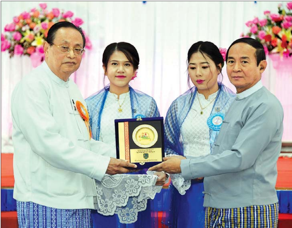
နိုင်ငံတော်သမ္မတ ဦးဝင်းမြင့်ထံ ပြည်ထောင်စုဝန်ကြီး ဦးဝင်းခိုင်က နိုင်ငံတော်ဓာတ်အားစနစ်မှ လျှပ်စစ်ဓာတ်အား သုံးစွဲမှု တစ်နိုင်ငံလုံး၏ ၅၀ ရာခိုင်နှုန်းပြည့်မြောက်သည့် အထိမ်းအမှတ် ဂုဏ်ပြုလက်ဆောင်ပေးအပ်စဉ်။ သတင်းစဉ်

၁၃၈၁ ခုနှစ်၊ နတ်တော်လပြည့်ကျော် ၃ ရက် ၂၀၁၉ ခုနှစ်၊ ဒီဇင်ဘာ ၁၄ ရက်၊ စနေနေ့ အတွဲ (၅၉)၊ အမှတ်(၀၇၅)