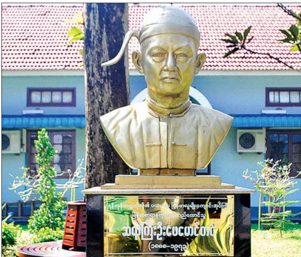
ရန်ကုန်တက္ကသိုလ်၏ ပထမဆုံး မြန်မာလူမျိုးကျောင်းအုပ်ကြီး၊ မြန်မာစာ ဌာနကို တည်ထောင်သူ ဆရာကြီး ဦးဖေမောင်တင်ရုပ်တု။

ဂျပန်ဘုရင့်မျိုးနွယ် မင်းသမီး Yoko Mikasa ဦးဆောင်သည့် ကိုယ်စားလှယ်အဖွဲ့သည် ပုဂံရှေးဟောင်းအမွေအနှစ် နယ်မြေရှိ ဘုရားများအား သွားရောက်ဖူးမြော်ကြည့်ညိကြစဉ်။