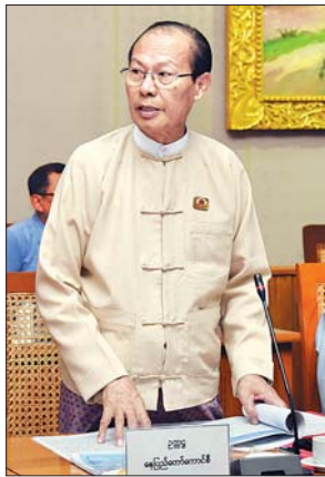
နေပြည်တော်ကောင်စီဥက္ကဋ္ဌ ဒေါက်တာ မျိုးအောင် ရှင်းလင်းတင်ပြစဉ်။

ဆက်လက်၍ လုံခြုံရေးဆပ်ကော်မတီ၏ ဆောင်ရွက်ထားရှိမှုအခြေအနေများကို ပြည်ထဲရေးဝန်ကြီးဌာန၊ ဒုတိယဝန်ကြီး ဗိုလ်ချုပ်အောင်သူကလည်းကောင်း၊ ကြိုဆိုနေရာချထားရေး၊ ပို့ဆောင်ရေးနှင့် ဆက်သွယ်ရေး ဆပ်ကော်မတီ၏ ဆောင်ရွက်ထားရှိမှု အခြေအနေများကို ပို့ဆောင်ရေးနှင့် ဆက်သွယ်ရေး ဦးထွန်းအုံတို့က လည်းကောင်း၊