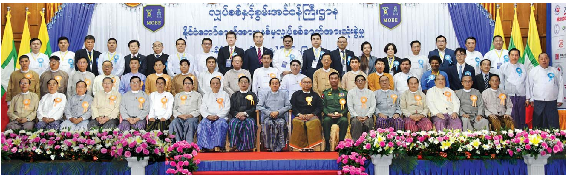
နိုင်ငံတော်သမ္မတ ဦးဝင်းမြင့်၊ ပြည်သူ့လွှတ်တော်ဥက္ကဋ္ဌ ဦးတီခွန်မြတ်၊ အမျိုးသားလွှတ်တော်ဥက္ကဋ္ဌ မန်းဝင်းခိုင်သန်း၊ ပြည်ထောင်စုဝန်ကြီးများ၊ ပြည်ထောင်စုရှေ့နေချုပ်၊ နေပြည်တော်ကောင်စီဥက္ကဋ္ဌနှင့် တာဝန်ရှိသူများ နိုင်ငံတော်ဓာတ်အားစနစ်မှ လျှပ်စစ်ဓာတ်အားသုံးစွဲမှု တစ်နိုင်ငံလုံး၏ ၅၀ ရာခိုင်နှုန်း ပြည့်မြောက်ခြင်း အထိမ်းအမှတ်အခမ်းအနားသို့ တက်ရောက်လာကြသူများနှင့်အတူ စုပေါင်းမှတ်တမ်းတင်ဓာတ်ပုံရိုက်စဉ်။