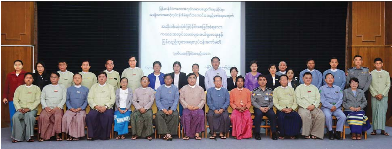
ပြည်ထောင်စုဝန်ကြီး ဒေါက်တာဝင်းမြတ်အေးနှင့် တာဝန်ရှိသူများ အဆိုးရွားဆုံးပုံစံဖြင့် ခိုင်းစေခြင်းခံရသော ကလေးအလုပ်သမားများဖယ်ရှားရေးနှင့် ပြန်လည်ကုစားရေး လုပ်ငန်းကော်မတီအစည်းအဝေးသို့ တက်ရောက်လာသူများနှင့်အတူ စုပေါင်းမှတ်တမ်းတင် ဓာတ်ပုံရိုက်စဉ်။ သတင်းစဉ်