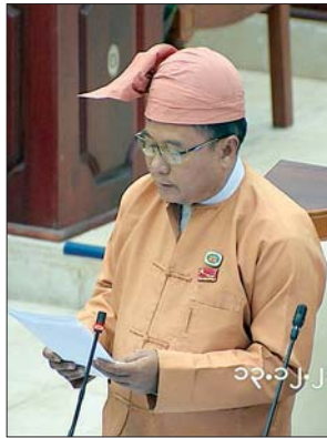
ဒဂုံမြို့သစ်(တောင်ပိုင်း) မဲဆန္ဒနယ်မှ ဦးအေးနိုင်

တန့်ယန်းမဲဆန္ဒနယ်မှ ဦးစိုင်းမောင်ပွင့်၏ တန့်ယန်းမြို့နယ်၊ မန်ကတ်ကျေးရွာအုပ်စု၊ မန်ကောင်းကျေးရွာအနီးရှိ နမ့်မိုက်ဆည်ကို RC ကွန်ကရစ်ဖြင့် အပြီးသတ်တည်ဆောက်ရန် စီစဉ်ဆောင်ရွက်ပေးနိုင်ခြင်းရှိ၊ မရှိ သိလိုခြင်း မေးခွန်းနှင့်စပ်လျဉ်း၍ ဒုတိယဝန်ကြီး ဦးလှကျော်က အခိုင်အမာရေလွှဲဆည်အဖြစ် တည်ဆောက်ပေးနိုင်ရန်အတွက် လိုအပ်သည့်ကွင်းဆင်းစူးစမ်းတိုင်းတာမှုလုပ်ငန်းများကို စီမံဆောင်ရွက်ရမည်ဖြစ်ပါကြောင်း၊ လက်ရှိအခြေအနေတွင် ကွင်းဆင်းတိုင်းတာခြင်းလုပ်ငန်းများ ဆောင်ရွက်ရမည့် ဧရိယာသည် နယ်မြေလုံခြုံရေးထိန်းသိမ်းဆောင်ရွက်နေရသည့် ဒေသဖြစ်သည့်အတွက် လတ်တလောအားဖြင့် ဆောင်ရွက်ပေးနိုင်မည့် အခြေအနေမရှိသေးပါကြောင်း၊ နယ်မြေလုံခြုံရေးအခြေအနေ ကောင်းမွန်လာပါက ကွင်းဆင်းတိုင်းတာခြင်းလုပ်ငန်းများဆောင်ရွက်ပြီး လုပ်ငန်းများအကောင်အထည်ဖော် ဆောင်ရွက်