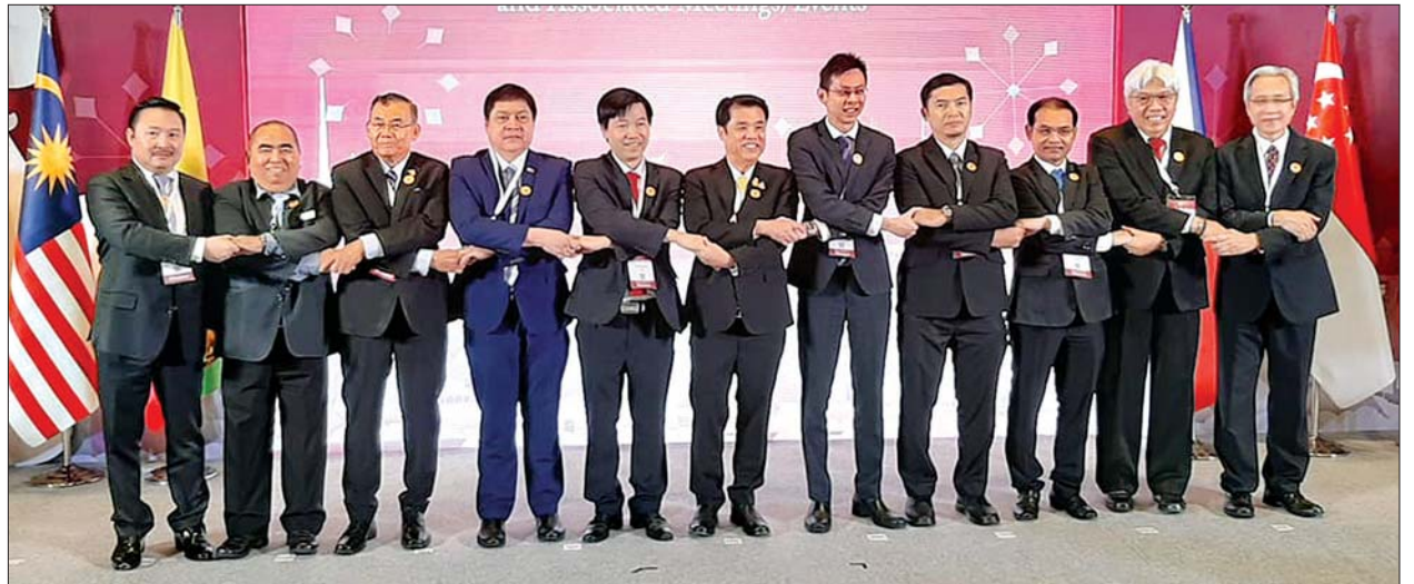
ပြည်ထောင်စုဝန်ကြီး ဦးအုန်းဝင်း (၇)ကြိမ်မြောက် အာဆီယံသတ္တုကဏ္ဍ ဝန်ကြီးများအဆင့် အစည်းအဝေးတက်ရောက်ကြသူများနှင့် စုပေါင်းမှတ်တမ်းတင် ဓာတ်ပုံရိုက်စဉ်။