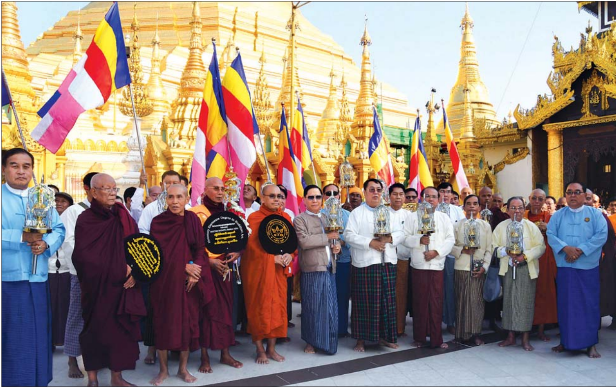
ပြည်ထောင်စု ဝန်ကြီးသူရဦးအောင်ကို၊ ရွှေတိဂုံစေတီတော်ဂေါပကအဖွဲ့ တာဝန်ရှိသူများ၊ မြန်မာနိုင်ငံလုံးဆိုင်ရာ ထေရဝါဒဗုဒ္ဓဘာသာအဖွဲ့ချုပ်နှင့် နယ်စပ် တောင်တန်းဒေသ သာသနာ့ကုဏ္ဍဟအသင်း(ဗဟို)ဥက္ကဋ္ဌ ဒေါက်တာခင်ရွှေနှင့် အလှူရှင်များက ရတနာစိန်ဖူးတော်၊ ငှက်မြတ်နားတော်၊ မကိုဋ်(၃)ဆင့် ရွှေထီးတော်များအား ပင့်ဆောင်ပူဇော်ကြစဉ်။

ရတနာငှက်မြတ်နားတော်၊ မကိုဋ် (၃)ဆင့် ရွှေထီးတော်များအား ရွှေတိဂုံ စေတီတော် ရင်ပြင်တော်ပေါ်ရှိ ချမ်းသာကြီးတန်ဆောင်းတွင် ယနေ့ ညနေပိုင်းမှ စတင်ကာ ဒီဇင်ဘာ ၁၅ ရက် နံနက်ပိုင်းအထိ သုံးရက်တာ အပူဇော်ခံထားရှိသွားမည်ဖြစ်သည်။ စန္ဒကူးနံ့သာကျောင်းတော်ရာ စေတီတော်ပရဝဏ်အတွင်း၌ ဒီဇင် ဘာ ၂၂ ရက်မှ ၂၄ ရက်အထိ ကျင်းပ မည့် ရွှေထီးတော်တင်လှူပွဲနှင့်အတူ ရဟန်း၊ ရှင်သာမဏေအပါး ၅၂၀၀ အား သာသနာ့ဘောင်သို့ သွတ်သွင်း ချီးမြှင့်ခြင်း၊ ဆွမ်းဆန်စိမ်းလောင်းလှူ ခြင်းပူဇော်ပွဲများကိုစည်ကားသိုက်မြိုက် စွာ ကျင်းပသွားမည်ဖြစ်ကြောင်း သိရသည်။ သတင်းစဉ်