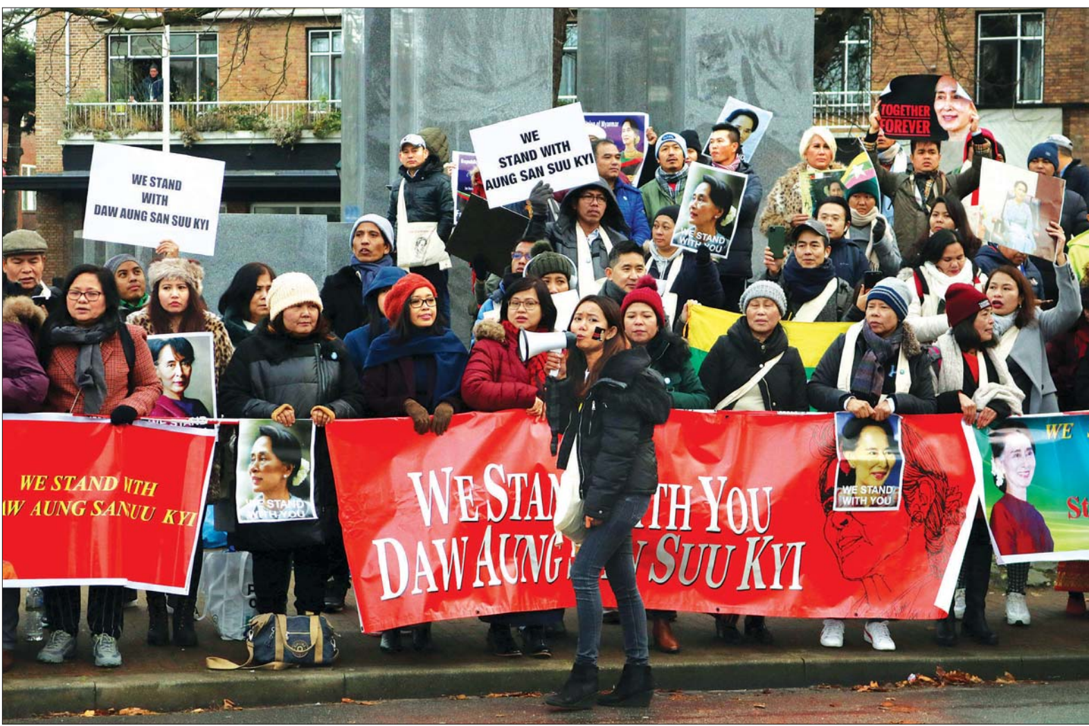
နိုင်ငံတော်၏အတိုင်ပင်ခံပုဂ္ဂိုလ် ဒေါ်အောင်ဆန်းစုကြည်၏ ဆောင်ရွက်မှုကို မြန်မာနိုင်ငံမှလာရောက်ကြသော ပြည်သူများနှင့် နယ်သာလန်နိုင်ငံနှင့် အခြားပြည်ပနိုင်ငံများမှ လာရောက်ကြသည့် မြန်မာနိုင်ငံသားများက အပြည်ပြည်ဆိုင်ရာတရားရုံး (ICJ)ရှေ့၌ လာရောက်ထောက်ခံအားပေးဝန်းရံကြသည်။ သတင်းစဉ်