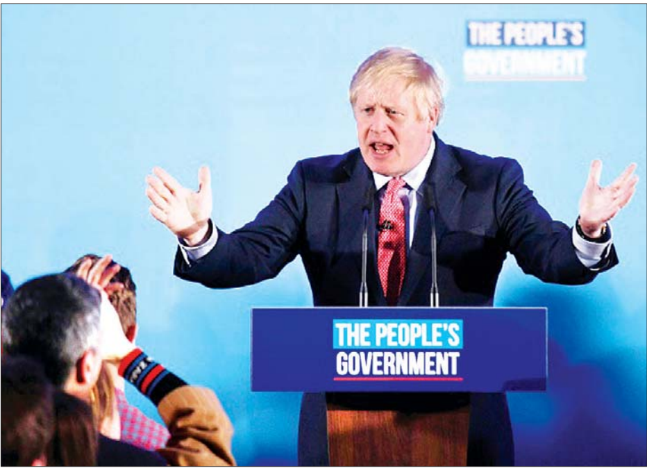
ရွေးကောက်ပွဲအနိုင်ရရှိခဲ့သည့် ဗြိတိန်ဝန်ကြီးချုပ် ဘောရစ်ဂျွန်ဆင်။

ဘောရစ်ဂျွန်ဆင်သည် ၎င်း၏ ကတိအတိုင်း ဗြိတိန်၏ အနာဂတ်ကို မသေချာမှုများဖြစ်စေခဲ့သည့် ဘရက်ဆစ်အရေးကို ပြီးဆုံးအောင်လုပ်မည်ဟု ပြောခဲ့သည်။ အေအက်ဖ်ပီ