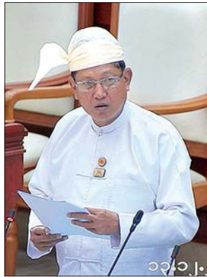
နေပြည်တော်ကောင်စီဝင် ဦးညီထွန်း