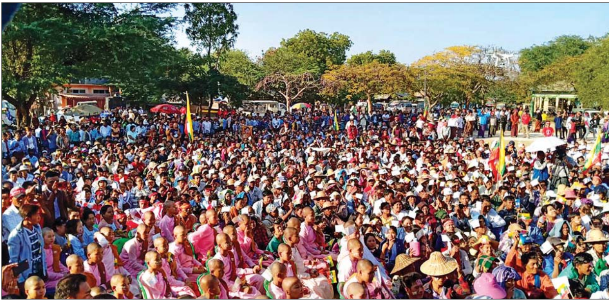
မန္တလေးတိုင်းဒေသကြီး မိတ္ထီလာခရိုင် မလှိုင်မြို့နယ်တွင် နိုင်ငံတော်၏အတိုင်ပင်ခံပုဂ္ဂိုလ် ဒေါ်အောင်ဆန်းစုကြည်နှင့်အတူ ရပ်တည်ကြောင်းလူထုထောက်ခံပွဲကို ဒီဇင်ဘာ ၁၃ ရက် မွန်းလွဲ ၂ နာရီတွင် မလှိုင်မြို့နယ် အားကစားကွင်း၌ ပြုလုပ်စဉ်။ (သတင်း - စာ ၆)