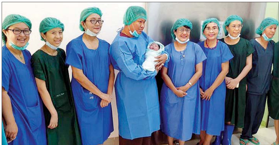
ဖန်ပြန်သန္ဓေသားအား တတိယအကြိမ်မြောက် အောင်မြင်စွာမွေးဖွားပေးနိုင်ခဲ့သည့် ခွဲစိတ်ဆရာဝန်ကြီးများ၊ ဆရာမ များအား ဖန်ပြန်သန္ဓေသား ကလေးငယ်နှင့်အတူ တွေ့ရစဉ်။