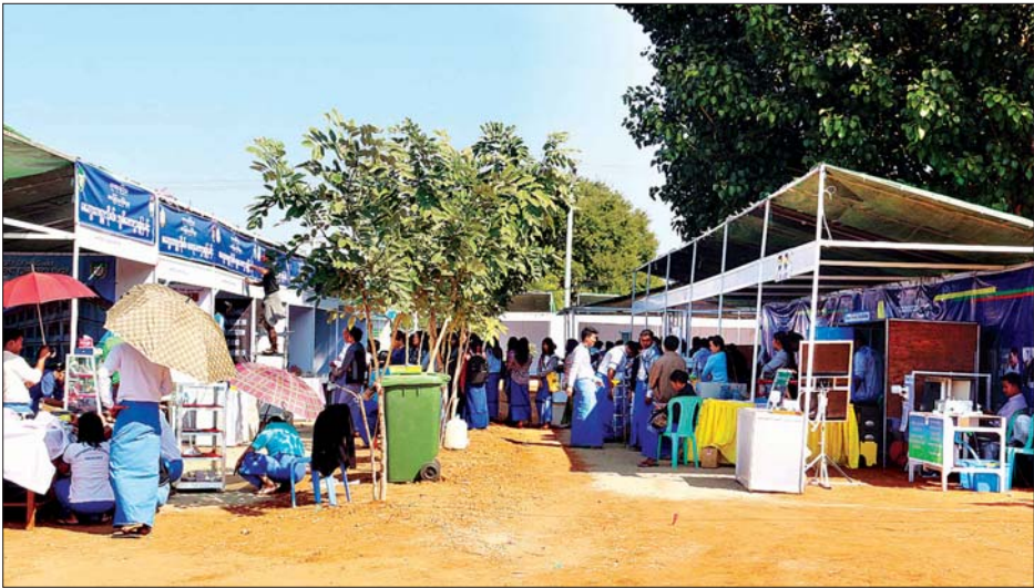
လူငယ်ဘက်စုံဖွံ့ဖြိုးရေးပွဲတော် (မကွေး) ၌ ပြခန်းများ ကြိုတင်ပြင်ဆင် ဆောင်ရွက်နေမှုကို တွေ့ရစဉ်။

အဆိုပါပြခန်းများတွင် ပွဲတော်၏ရည်ရွယ်ချက်ဖြစ်သည့် ဘက်စုံဖွံ့ဖြိုးတိုးတက်ဖို့ လူငယ်ပွဲတော် နှစ်ပျော်စို့ဆောင်ပုဒ်နှင့်အညီ တက္ကသိုလ်၊ ကောလိပ်နှင့် အခြေခံပညာကျောင်းများမှ ဘာသာရပ်အလိုက်ပြခန်းများ၊ ဝန်ကြီးဌာနပြခန်းများ၊ မူးယစ်ဆေးဝါးနှင့် မသန်စွမ်းသူများဆိုင်ရာပြခန်းများ၊ သဘာဝဘေးဆိုင်ရာပြခန်းများ၊ မြန်မာနိုင်ငံလုံးဆိုင်ရာ အမျိုးသမီးကော်မတီနှင့် ကော်မတီဝင်အမျိုးသမီးရေးရာအဖွဲ့ ခုနစ်ဖွဲ့ပြခန်းများအပြင် မကွေးတိုင်းဒေသကြီး