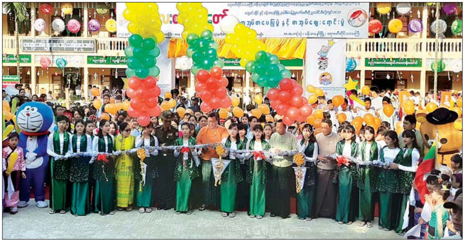
ဧရာဝတီတိုင်းဒေသကြီး ဝန်ကြီးချုပ် ဦးလှစိုးအောင်၊ အစိုးရအဖွဲ့ဝန်ကြီးများနှင့် တာဝန်ရှိသူများ ကလေးစာပေပွဲတော် (ပန်းတနော်) အား ဖဲကြိုးဖြတ်ဖွင့်လှစ်ပေးစဉ်။

ပွဲတော်တွင်ပြသထားသည့် ထူးချွန်ထင်ရှား ဧရာဝတီ တိုင်းသားများပြခန်း၊ ဦးသန်းပြခန်း၊ ရဲတပ်ဖွဲ့၊ မီးသတ်တပ်ဖွဲ့၊ ကျန်းမာရေး၊ ကွန်ပျူတာနည်းပညာပြခန်း၊ ဒေသထွက်