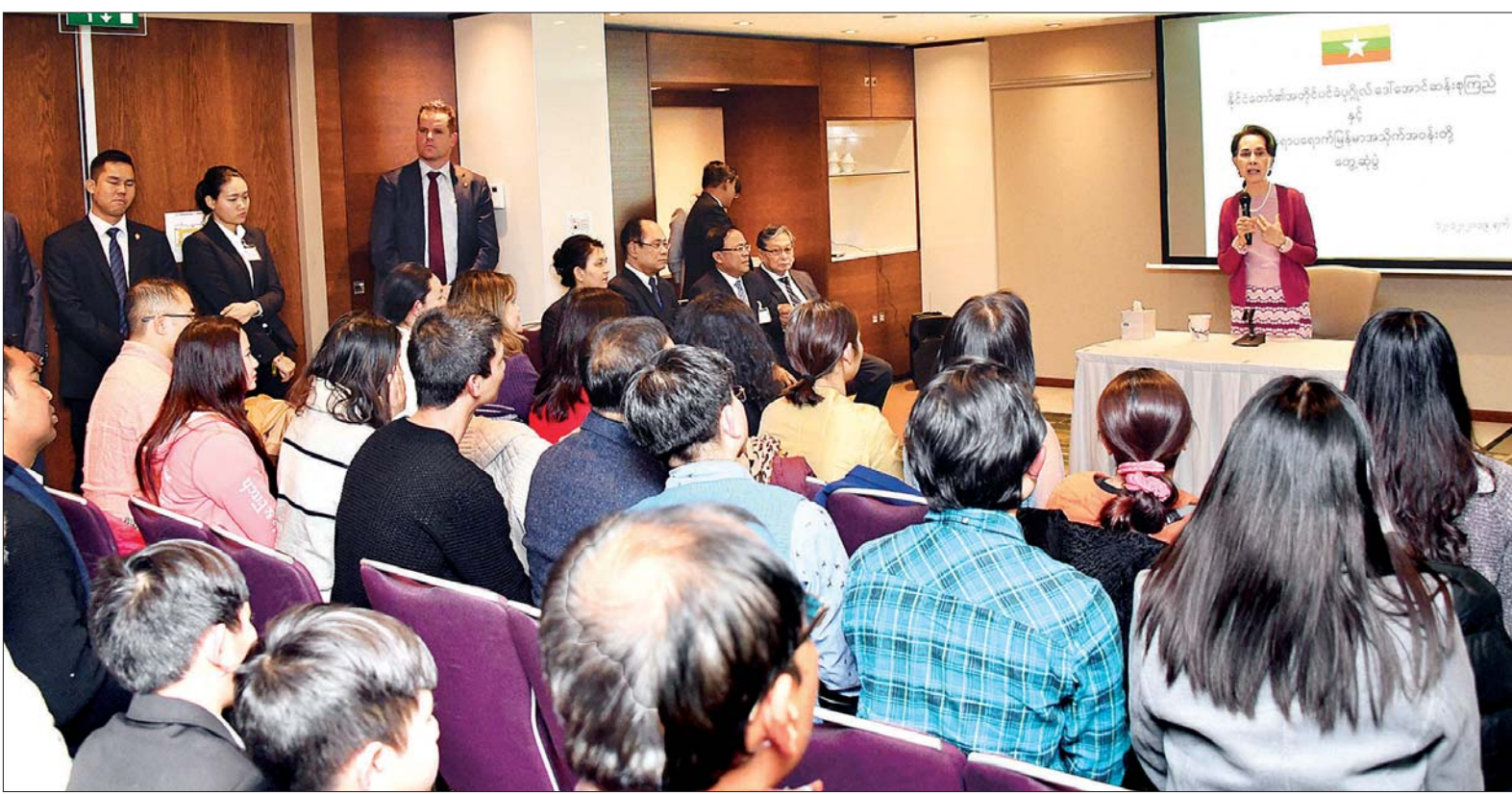
နိုင်ငံတော်၏အတိုင်ပင်ခံပုဂ္ဂိုလ် ဒေါ်အောင်ဆန်းစုကြည် နယ်သာလန်နိုင်ငံနှင့် ပြည်ပနိုင်ငံများမှ လာရောက်ထောက်ခံဝန်းရံကြသည့် မြန်မာနိုင်ငံသားများနှင့် ရင်းရင်းနှီးနှီး တွေ့ဆုံသည်။ သတင်းစဉ်

သည့်ဟိတ်ဂ် ဒီဇင်ဘာ ၁၃ နယ်သာလန်နိုင်ငံ သည့်ဟိတ်ဂ်မြို့တွင် ရောက်ရှိနေသည့် နိုင်ငံတော်၏ အတိုင်ပင်ခံပုဂ္ဂိုလ် ဒေါ်အောင်ဆန်းစုကြည်သည် ယမန်နေ့ ညပိုင်းနှင့် ယနေ့နံနက်ပိုင်းတို့တွင် ခေတ္တတည်းခို သည့်နေရာ၌ နယ်သာလန်နိုင်ငံနှင့် ပြည်ပနိုင်ငံများမှ နယ်သာလန်နိုင်ငံသို့ လာရောက်ထောက်ခံဝန်းရံကြသည့် မြန်မာနိုင်ငံသားများနှင့် ရင်းရင်းနှီးနှီး တွေ့ဆုံသည်။