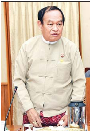
ပြည်ထောင်စုဝန်ကြီး ဒေါက်တာ မြင့်ထွေး ရှင်းလင်းတင်ပြစဉ်။

၂၀၂၀ ပြည့်နှစ်၊ (၇၃) နှစ်မြောက် ပြည်ထောင်စုနေ့ကို အခမ်းအနားအစီအစဉ် အပိုင်း (၂) ပိုင်းနှင့် ကျင်းပသွားမည်ဖြစ်ရာ ပထမပိုင်းအနေဖြင့် နံနက်ပိုင်းတွင် အလံတင် အခမ်း