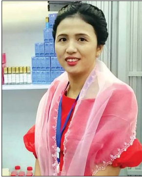
ဒေါ်ယဉ်ဝိနွယ်