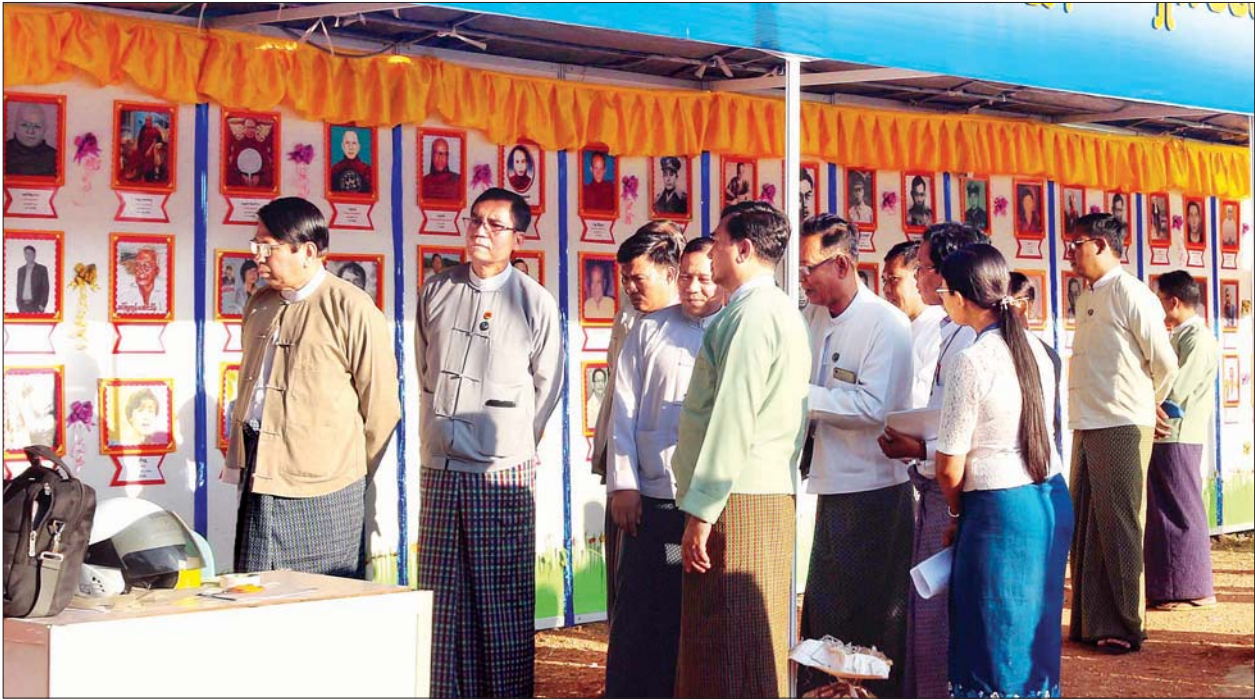
ပြည်ထောင်စုဝန်ကြီး ဒေါက်တာဖေမြင့် လူငယ်ဘက်စုံဖွံ့ဖြိုးရေးပွဲတော် (မကွေး) ကျင်းပရန် ပြခန်းများ ခင်းကျင်းပြင်ဆင်ထားရှိမှုများကို ကြည့်ရှုစစ်ဆေးစဉ်။ သတင်းစဉ်

အစမ်းလေ့ကျင့်နံနက်ပိုင်းကလည်း လူငယ်ဘက်စုံဖွံ့ဖြိုးရေးပွဲတော်(မကွေး) ဖွင့်ပွဲအခမ်းအနား အစမ်းလေ့ကျင့်နေမှုများကို မကွေးတက္ကသိုလ် ဘွဲ့နှင်းသဘင်ခန်းမရှေ့၌ ကျင်းပရာ မကွေးတိုင်းဒေသကြီးဝန်ကြီးချုပ် ဒေါက်တာအောင်မိုးညို၊ ပြန်ကြားရေးဝန်ကြီးဌာန ဒုတိယဝန်ကြီး ဦးအောင်လှထွန်း၊ တိုင်းဒေသကြီးဝန်ကြီးများနှင့် တာဝန်ရှိသူများ ကြည့်ရှုစစ်ဆေးကြသည်။ တိုင်းဒေသကြီး ဝန်ကြီးချုပ် ဒေါက်တာအောင်မိုးညို၊ ဒုတိယဝန်ကြီး ဦးအောင်လှထွန်း၊ တိုင်းဒေသကြီးဝန်ကြီးများနှင့် တာဝန်ရှိသူများသည် ဘွဲ့နှင်းသဘင်ခန်းမရှေ့၌ ပြုလုပ်မည့် ဖွင့်ပွဲအခမ်းအနားအတွက် ဖဲကြိုးဖြတ်ရန် အစမ်းလေ့ကျင့်နေ