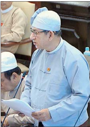
ဒုတိယဝန်ကြီး ဒေါက်တာရဲမြင့်ဆွေ