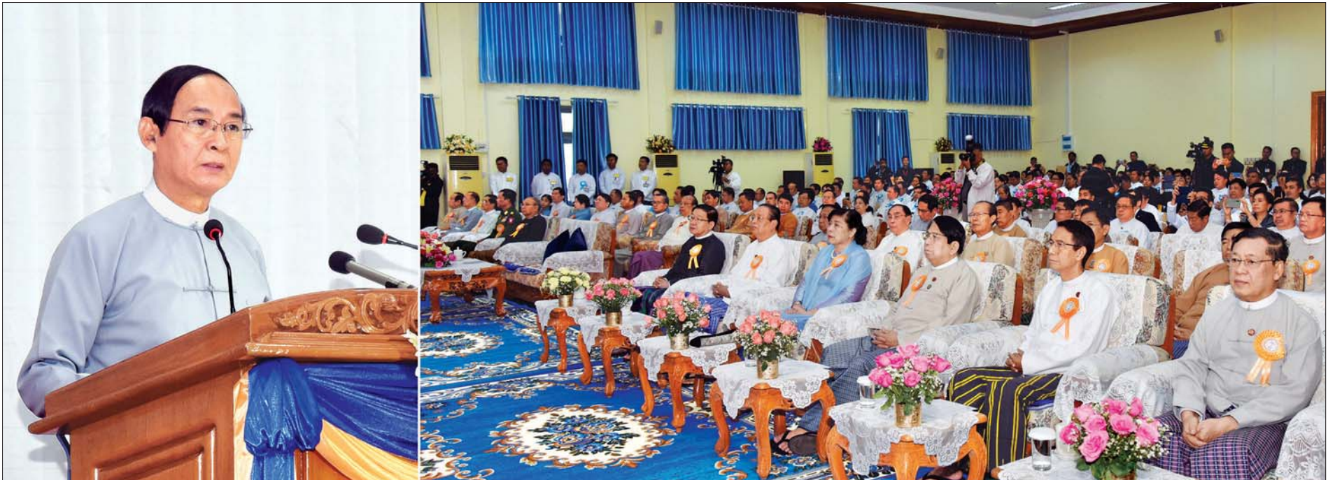
နိုင်ငံတော်သမ္မတ ဦးဝင်းမြင့် နိုင်ငံတော်ဓာတ်အားစနစ်မှ လျှပ်စစ်ဓာတ်အားသုံးစွဲမှု တစ်နိုင်ငံလုံး၏ ၅၀ ရာခိုင်နှုန်း ပြည့်မြောက်သည့် အထိမ်းအမှတ်အခမ်းအနားတွင် ဂုဏ်ပြုအမှာစကားပြောကြားစဉ်။