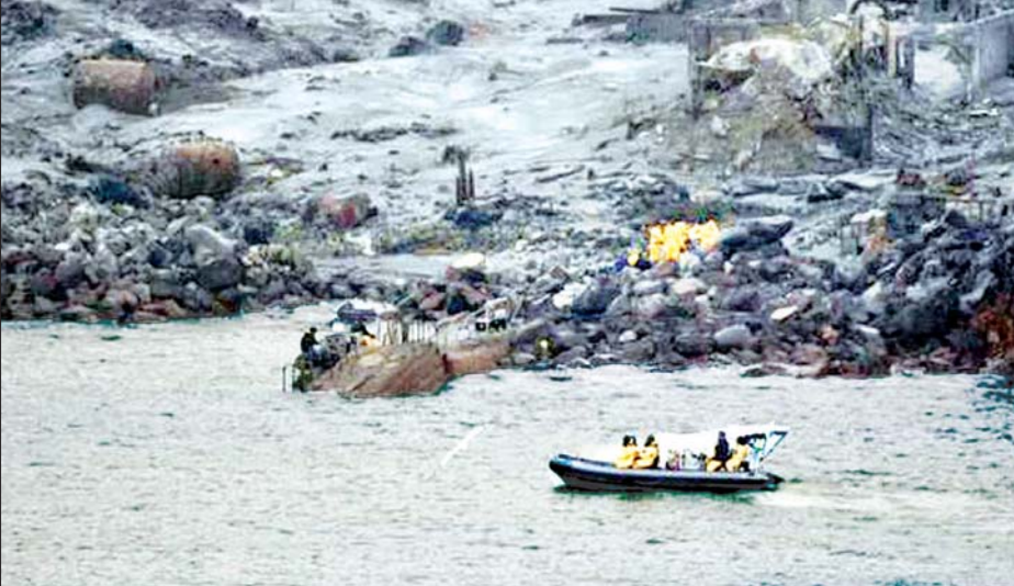
ကျွန်းဖြူကျွန်းအနီးတစ်ဝိုက်တွင် ရှာဖွေရေးလုပ်ငန်းများ လုပ်ဆောင်နေစဉ်။

၁၄ ရက် နံနက်ပိုင်းအထိ ဆက်လက်လုပ်ဆောင်သွားမည်ဟု နယူးဇီလန်ရဲများက ပြောသည်။ အလောင်းရှာဖွေရေးလုပ်ငန်းများ နှောင့်နှေးရခြင်းမှာ ကယ်ဆယ်ရေးသမားများအတွက် အသက်အန္တရာယ်စိုးရိမ်ရသည့်အတွက်ကြောင့်လည်း ဖြစ်သည်။ နယူးဇီလန်ကာကွယ်ရေးတပ်မှ အထူးတပ်ဖွဲ့ဝင်ရှစ်ဦးသည် ရဟတ်ယာဉ်ဖြင့် အဆိုပါကျွန်းပေါ်သို့ သွားရောက်ခဲ့ပြီး အလောင်းရှာဖွေရေးလုပ်ငန်းများကို နာရီပေါင်းများစွာကြာအောင် လုပ်ဆောင်ခဲ့သည်။ ၎င်းတို့သည် ရေတပ်မှ ကင်းလှည့်ယာဉ်များကို အသုံးပြု၍ ရှာဖွေရေးလုပ်ငန်းများ လုပ်ဆောင်ခဲ့ပြီး ရှာဖွေတွေ့ရှိခဲ့သည့် အလောင်းများကို ကုန်းပေါ်သို့ ပြန်လည်ပို့ဆောင်ပေးခဲ့သည်။ အကယ်၍ မီးတောင် နောက်တစ်ကြိမ်ပေါက်ကွဲမှု ဖြစ်ပေါ်ခဲ့ပါက ရှာဖွေရေးအဖွဲ့သားများအတွက် ကျောက်ရည်ပျံများစဉ်ခြင်း၊ ပြင်းထန်သည့်အပူလှိုင်းဒဏ်ခံရခြင်း၊ ပြာနှင့် ကျောက်တုံးများ လွင့်စဉ်လာနိုင်ခြင်း အစရှိသည့် အန္တရာယ်များနှင့် ကြုံတွေ့လာနိုင်ဖွယ်ရှိကြောင်း မီးတောင်ပညာရှင်များက သတိပေးခဲ့သည်။ ဘီဘီစီ