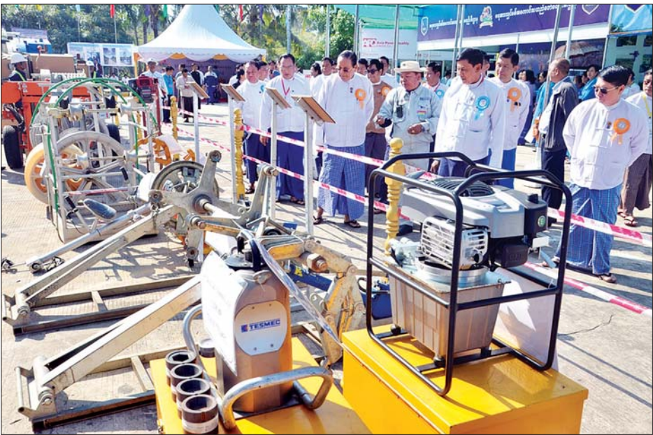
ပြည်ထောင်စုဝန်ကြီး ဦးဝင်းခိုင် နိုင်ငံတော်ဓာတ်အားစနစ်မှ လျှပ်စစ်ဓာတ်အားသုံးစွဲမှု တစ်နိုင်ငံလုံး၏ ၅၀ ရာခိုင်နှုန်း ပြည့်မြောက်သည့် အထိမ်းအမှတ်ပြခန်းများအား လှည့်လည်ကြည့်ရှုစဉ်။ သတင်းစဉ်

ယင်းနောက် ညနေပိုင်းတွင် ဂုဏ်ပြုဆုနှင့် ဂုဏ်ပြု မှတ်တမ်းလွှာချီးမြှင့်ခြင်းနှင့် ညစာစားပွဲအခမ်းအနားအား ဆက်လက်ကျင်းပရာ ပြည်ထောင်စုဝန်ကြီး ဦးဝင်းခိုင်က နိုင်ငံတော်ဓာတ်အားစနစ်မှ လျှပ်စစ်ဓာတ်အားသုံးစွဲမှု တစ်နိုင်ငံလုံး၏ ၅၀ ရာခိုင်နှုန်း ပြည့်မြောက်သည့် အထိမ်းအမှတ်အခမ်းအနား Logos ပြိုင်ပွဲတွင် ဆုရရှိခဲ့သော ဝန်ထမ်းနှစ်ဦးအား လည်းကောင်း၊ အထိမ်းအမှတ် သီချင်းစာသားရေးစပ်သီဆိုသူ ဝန်ထမ်းတစ်ဦးအား လည်းကောင်း၊ ၂၀၁၈ ခုနှစ် မတ် ၃၁ ရက်တွင် ပြည်ထောင်စု နယ်မြေ နေပြည်တော်၌ လေပြင်းမုန်တိုင်း တိုက်ခတ်ခြင်း ကြောင့် ပျက်စီးသွားသော ဓာတ်အားလိုင်းများအား အချိန်တိုအတွင်း ထိန်းသိမ်းပြုပြင်ခြင်းလုပ်ငန်းများ ဆောင်ရွက်ခဲ့သည့် ဝန်ထမ်းများအား လည်းကောင်း၊ ၂၃၀ ကေစီ ရွေလီ-မန်နစ် ဓာတ်အားလိုင်းနှင့် ၆၆ ကေစီ ပုဏ္ဏားကျွန်း - ကျောက်တော် ဓာတ်အားလိုင်းတို့တွင် Conductor (C-Phase) ကြိုးပျက်ကျခြင်းနှင့် ကြိုးလွန်း