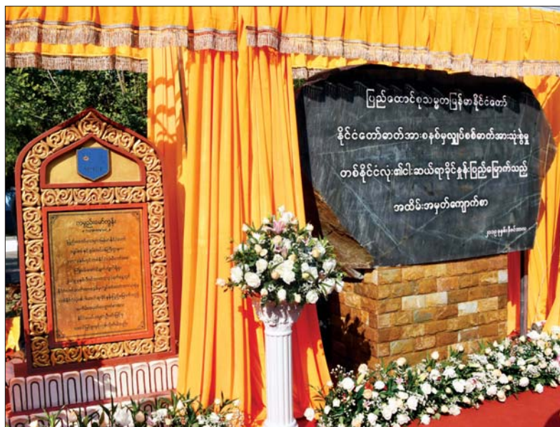
နိုင်ငံတော်သမ္မတ ဦးဝင်းမြင့်၊ ပြည်သူ့လွှတ်တော်ဥက္ကဋ္ဌ ဦးတီခွန်မြတ်၊ အမျိုးသားလွှတ်တော်ဥက္ကဋ္ဌ မန်းဝင်းခိုင်သန်းနှင့် ပြည်ထောင်စုဝန်ကြီး ဦးဝင်းခိုင်တို့က နိုင်ငံတော်ဓာတ်အားစနစ်မှ လျှပ်စစ်ဓာတ်အားသုံးစွဲမှု တစ်နိုင်ငံလုံး၏ ၅၀ ရာခိုင်နှုန်း ပြည့်မြောက်ခြင်း အထိမ်းအမှတ်ကျောက်စာနှင့် ကမ္ဘည်းမော်ကွန်းကျောက်စာတိုင်တို့ကို စက်ခလုတ်နှိပ်ဖွင့်လှစ်ပေးစဉ်။

ထို့နောက် လျှပ်စစ်နှင့်စွမ်းအင် ဝန်ကြီးဌာနမှ ဝန်ထမ်းများနှင့် ဝန်ထမ်းများ၏ သားငယ်သမီးငယ်များက နိုင်ငံတော်ဓာတ်အားစနစ်မှ လျှပ်စစ်ဓာတ်အားသုံးစွဲမှု တစ်နိုင်ငံ