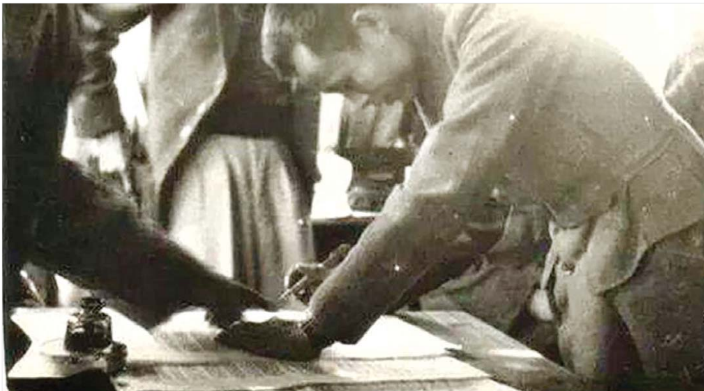
ဗိုလ်ချုပ်အောင်ဆန်း ပင်လုံစာချုပ်တွင် ပါဝင်လက်မှတ်ရေးထိုးစဉ်။

တိုင်းရင်းသားစည်းလုံးညီညွတ်မှု အခြေခံကြောင့် သာလျှင် မြန်မာ့လွတ်လပ်ရေးကို အရယူနိုင်ခဲ့ခြင်းဖြစ် သည်။ တစ်နည်းဆိုရလျှင် ပြည်ထောင်စုစိတ်ဓာတ်ရှိခြင်း ပင်ဖြစ်သည်။ ပြည်ထောင်စုအားသည် ပြည်ထောင်စု အတွင်းရှိ ပြည်နယ်၊ တိုင်းအားလုံးတို့၏ စုပေါင်းအား ဖြစ်သည်။ ထိုစုပေါင်းအားသည် ပြည်ထောင်စုသား