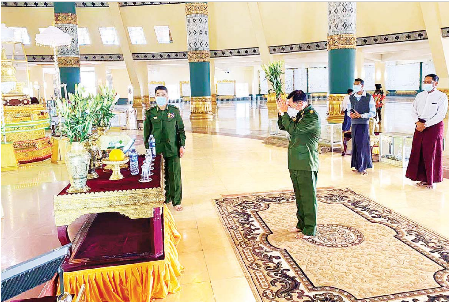
နိုင်ငံတော်စီမံအုပ်ချုပ်ရေးကောင်စီ ဥက္ကဋ္ဌ၊ တပ်မတော်ကာကွယ်ရေးဦးစီးချုပ် ဗိုလ်ချုပ်မှူးကြီး မင်းအောင်လှိုင် ဥပုတသန္တိစေတီတော်မြတ်ကြီးအတွင်းရှိ ဗုဒ္ဓရုပ်ပွားတော်မြတ်အား ပန်း၊ ရေချမ်းများ ကပ်လှူပူဇော်စဉ်။