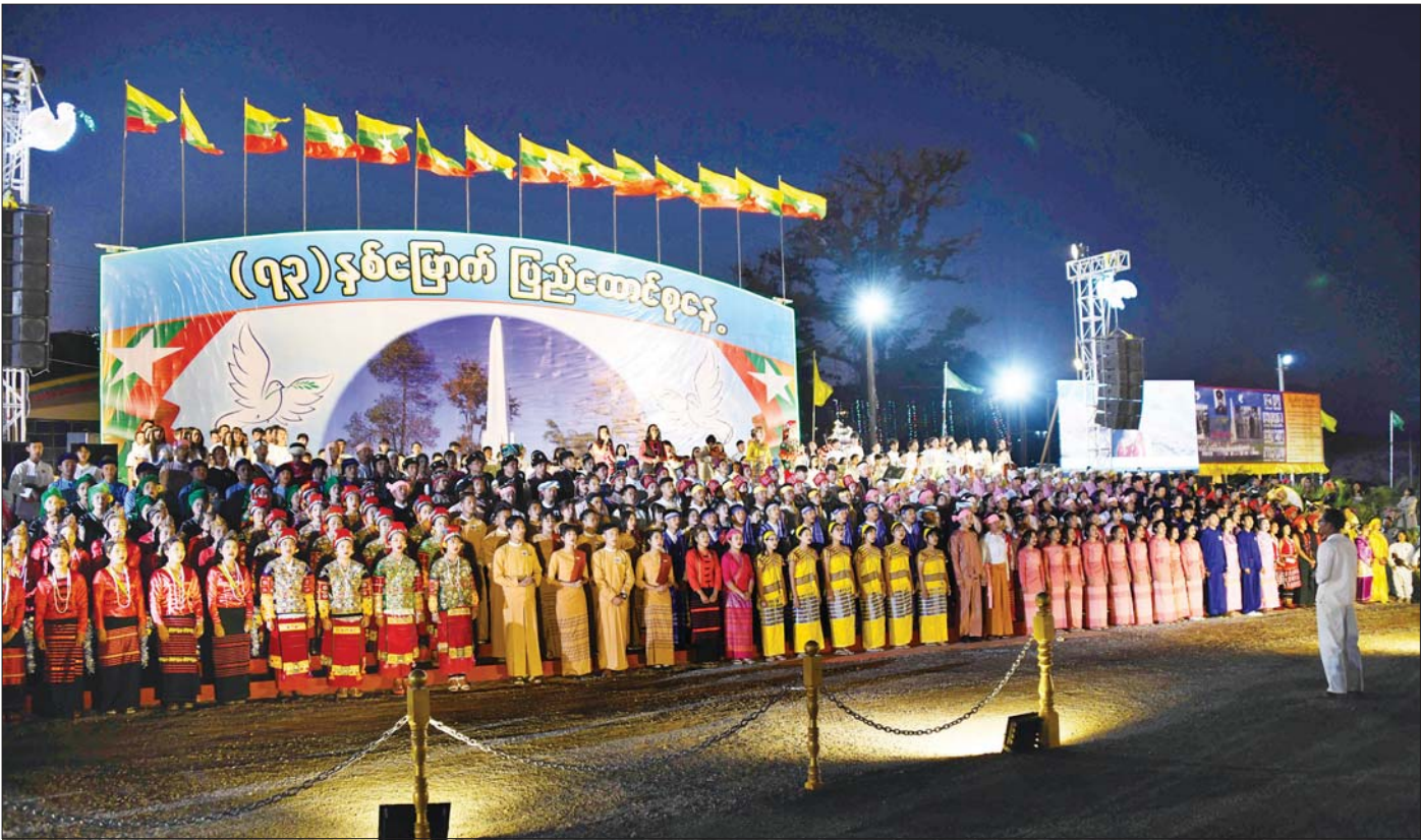
ပင်လုံမြို့၌ ကျင်းပခဲ့သည့် (၇၄)နှစ်မြောက် ပြည်ထောင်စုနေ့အခမ်းအနားတွင် တိုင်းရင်းသား တိုင်းရင်းသူများ၏ စုပေါင်းဖျော်ဖြေမှု။

သို့သော် မြန်မာတို့၏ အမျိုးသားရေးစိတ်ဓာတ်နှင့် သူ့ကျွန်မခံလိုစိတ်များမှာ ပြင်းထန်စွာ နိုးကြားလာ ခဲ့သည်။ ဗြိတိသျှတို့၏ သဘောထားကို သိရှိပြီးဖြစ် သော မြန်မာတိုင်းရင်းသားတို့ကလည်း လွတ်လပ်ရေး ကို စောနိုင်သမျှ အစောဆုံး ရယူလိုကြသည်။ ထို့ကြောင့် ဗိုလ်ချုပ်အောင်ဆန်း ဦးဆောင်သော ဖဆပလ (ဖက်ဆစ်