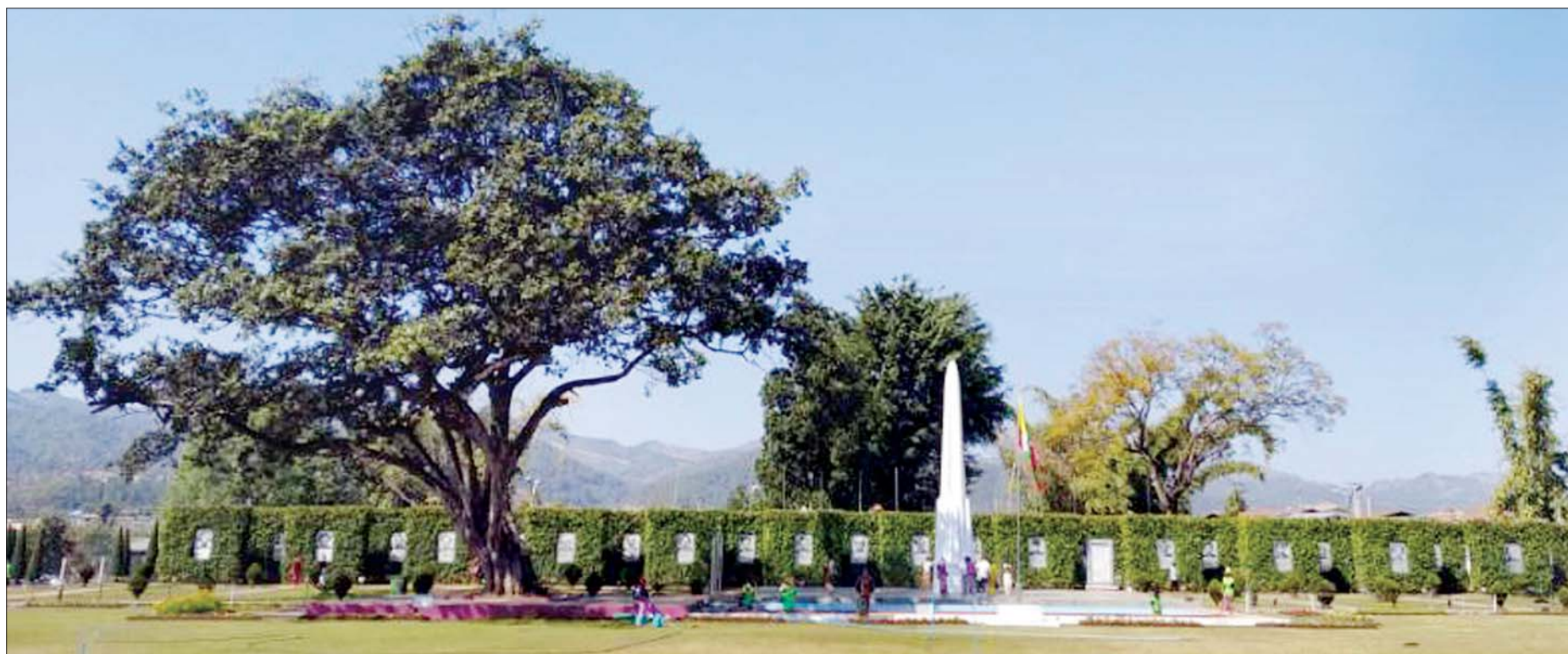
ပင်လုံစာချုပ်ချုပ်ဆိုခဲ့သည့် ရှမ်းပြည်နယ် ပင်လုံမြို့ရှိ ပင်လုံကျောက်တိုင်ကွင်း။

“မြန်မာတိုင်းရင်းသားများ စည်းလုံးညီညွတ်ကာ ၎င်းတို့အား ဆန့်ကျင်တော်လှန်မှု မပြုနိုင် ရေးအတွက် မြန်မာတိုင်းရင်းသားအချင်းချင်း စည်းလုံးမှုပျက်ပြားစေရန် ရည်ရွယ်ချက်ရှိရှိ၊ သွေးခွဲ နည်းအမျိုးမျိုးတို့ကို ဖန်တီးလုပ်ဆောင်ခဲ့ကြသည်။ ၎င်းတို့အပေါ် ဆန့်ကျင် တော်လှန်လိုသည့် တိုင်းချစ် ပြည်ချစ်စိတ်ဓာတ်များ၊ ဇာတိသွေးဇာတိမာန်များကို ရိုက်ချိုးဖျက်ဆီး၍ မြန်မာနိုင်ငံအား နှစ်ပေါင်းကြာရှည်စွာ ကျွန်ုပ်တို့အုပ်ချုပ်နိုင်ရေးအတွက် မသမာသောနည်းများဖြင့် စီမံဆောင်ရွက်ခဲ့”