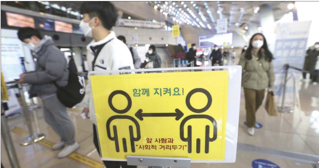
တောင်ကိုရီးယားနိုင်ငံရှိ အများပြည်သူသွားလာသည့်နေရာများတွင် တစ်ဦးနှင့်တစ်ဦး ခပ်ခွာခွာနေရန် သတိပေးဆိုင်းဘုတ်စိုက်ထောင်ထားသည်ကို တွေ့ရစဉ်။