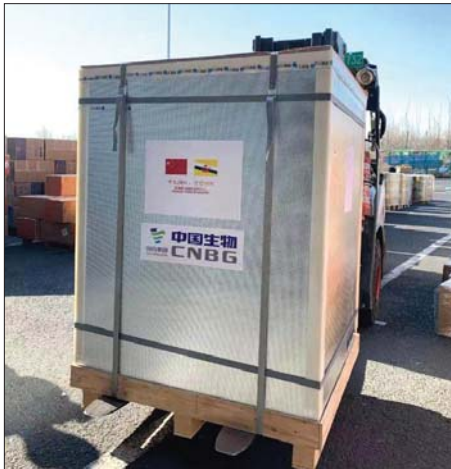
တရုတ်နိုင်ငံမှပေးပို့လိုက်သော ကိုဗစ်-၁၉ ကာကွယ်ဆေးများကို တွေ့ရစဉ်။