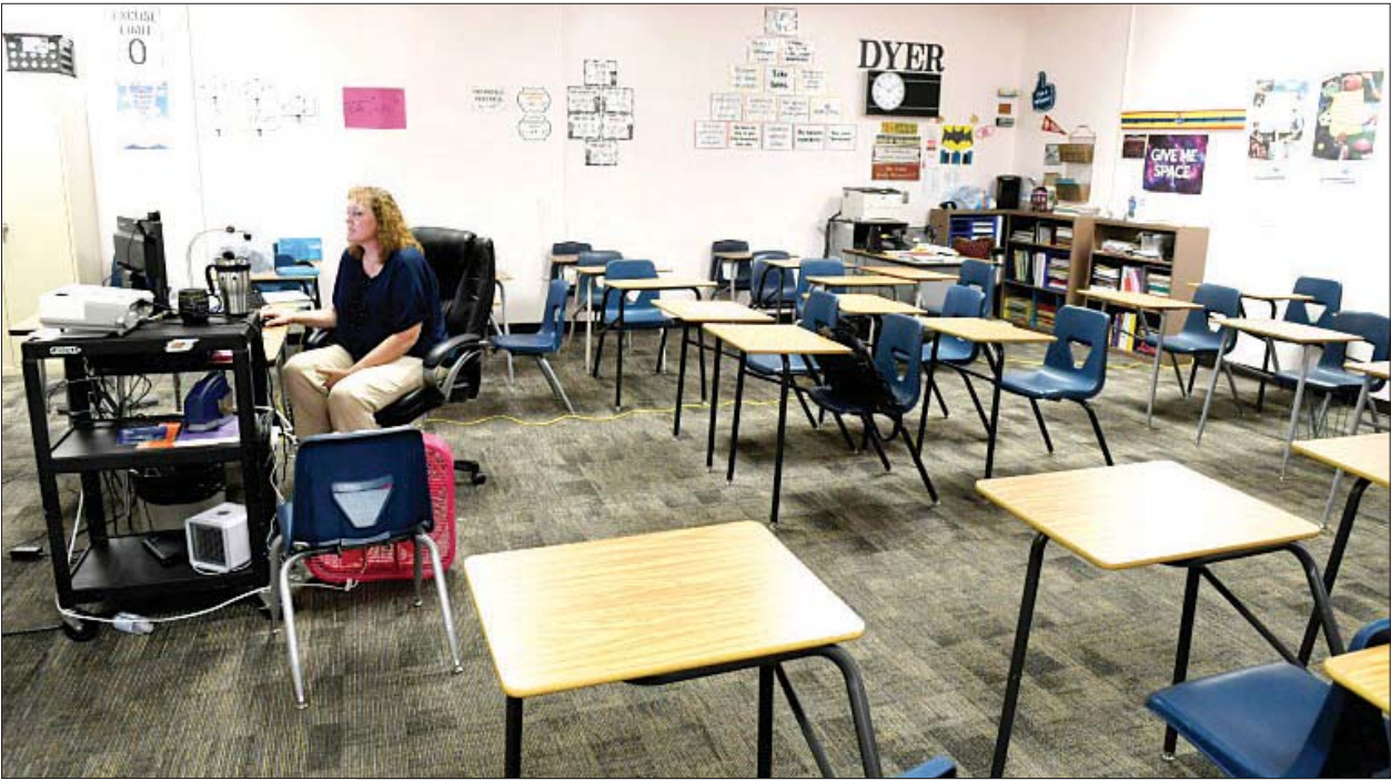
အမေရိကန်ရှိ စာသင်ခန်းတစ်ခန်းကို တွေ့ရစဉ်။

စိတ်ဆိုး၊ စိတ်ပြောင်းလွယ်ဖြစ်နေ သူက မနက်ပိုင်းအိပ်ရာထပြီး တွဲနောက်ပိုင်းမှာ မွန်းလွဲတဲ့အထိ ပြန်အိပ်တယ်။ စိတ်ဆိုးလွယ်၊ စိတ်ပြောင်းလွယ် ဖြစ်နေတယ်။ သူဟာ မကြာခဏဆိုသလို ကျွန်တော် စမတ်မကျတော့ဘူး။ ကျွန်တော် မတော်တော့ဘူးဆိုတဲ့ အဲဒီလိုမျိုးစကားတွေကို စတင်ပြောကြားလာပါပြီလို့ ကာပူတိုက ပြောကြားလိုက်ပါတယ်။ သူက တခြားကလေးတွေလည်း အဲဒီ