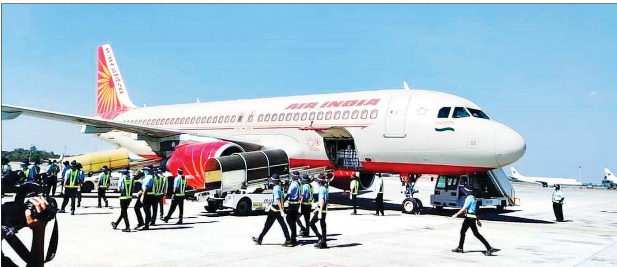
ကိုဗစ်-၁၉ ကာကွယ်ဆေးများ တင်ဆောင်လာသည့် အိန္ဒိယလေကြောင်းလိုင်း ကယ်ဆယ်ရေးလေယာဉ် ရန်ကုန်အပြည်ပြည်ဆိုင်ရာလေဆိပ်သို့ ရောက်ရှိစဉ်။