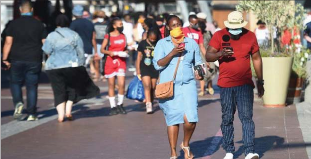
ကီရီမီတောင်မြို့တွင် အများပြည်သူများ နှာခေါင်းစည်းတပ်ဆင်သွားလာနေသည်ကို တွေ့ရစဉ်။