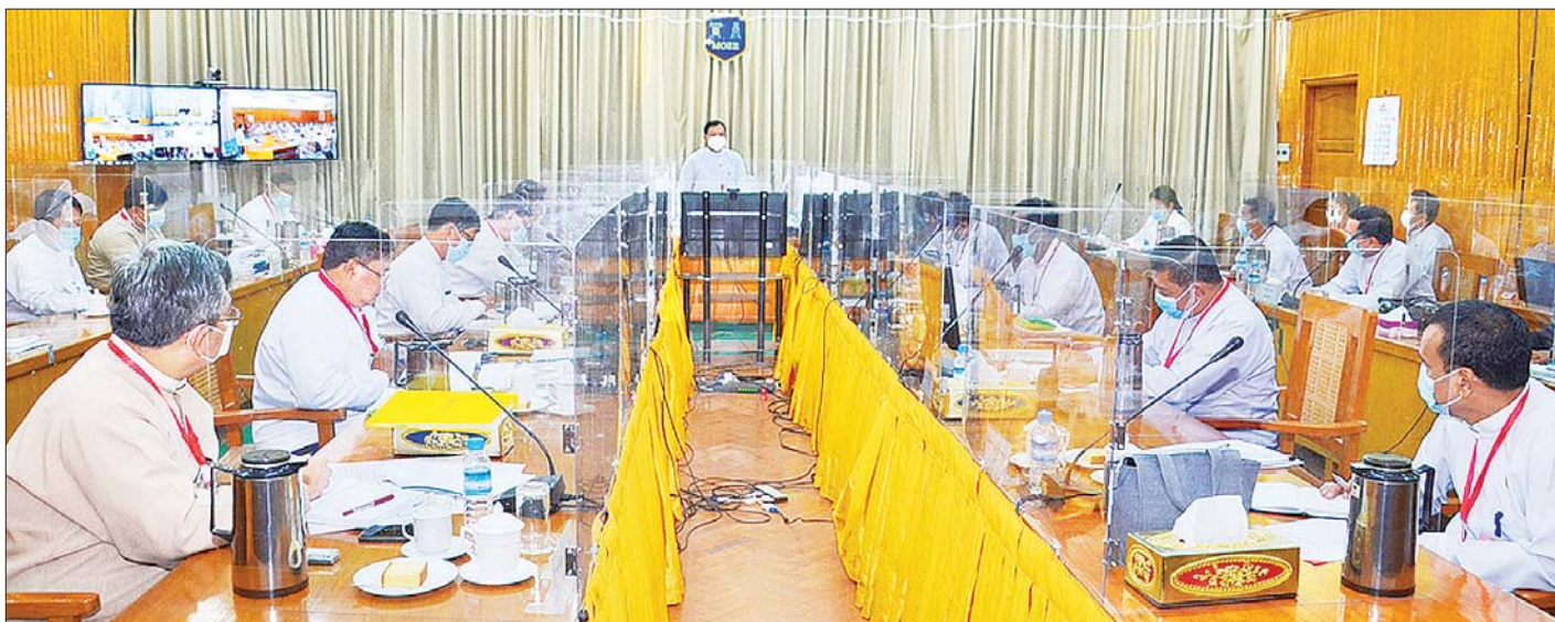
ပြည်ထောင်စုဝန်ကြီး ဦးအောင်သန်းဦး၊ လျှပ်စစ်နှင့် စွမ်းအင်ဝန်ကြီးဌာန၏ လက်ရှိလုပ်ငန်းဆောင်ရွက်နေမှုအခြေအနေများနှင့် ပတ်သက်သည့် လုပ်ငန်းညှိနှိုင်းအစည်းအဝေး တွင် အမှာစကားပြောကြားစဉ်။