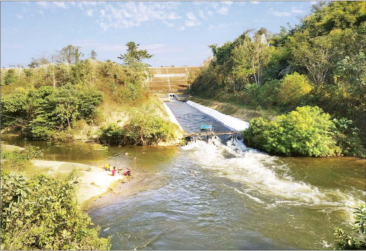
တဘူးလှဆည် သဘာဝအလှနှင့် ရေပေးမြောင်းကို တွေ့ရစဉ်။