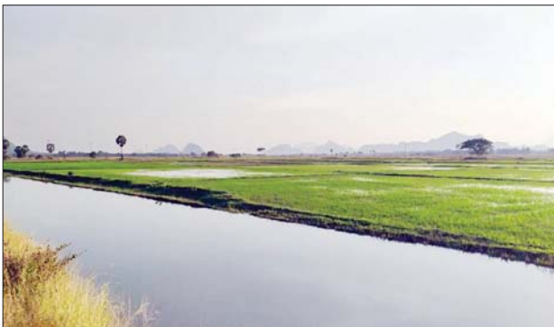
ရေသွင်းရေနုတ်မြောင်းတူးဖော်ထားပြီး ရေသွင်းပေးနိုင်မှု အခြေအနေကို တွေ့ရစဉ်။