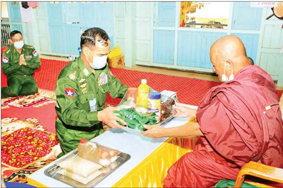
နေပြည်တော် ဖေဖော်ဝါရီ ၁၀

COVID-19 ကူးစက်ရောဂါ ကာကွယ်ထိန်းချုပ်ရေးကာလတွင် ဘုန်းတော်ကြီးကျောင်းများနှင့် သီလရှင်ကျောင်းများတွင် ဆွမ်းကိစ္စများ အဆင်ပြေစေရန်အတွက် တိုင်းစစ်ဌာနချုပ်များအလိုက် လှူဒါန်းလျက်ရှိသည်။