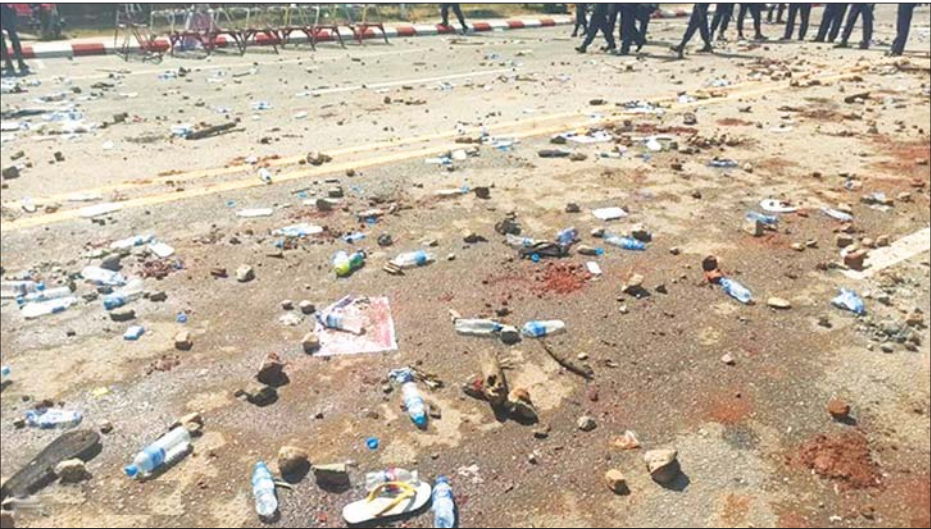
ဆူပူဆန္ဒပြသူများ အသုံးပြုပစ်ပေါက်ခဲ့သော အုတ်ခဲ၊ ကျောက်ခဲများကို တွေ့ရစဉ်။

ရာဇဝတ်ကျင့်ထုံး ဥပဒေပုဒ်မ-၁၄၄ ကြေညာထားရှိသဖြင့်ဥပဒေကို လေးစားလိုက်နာရန်အကြိမ်ကြိမ်ပြောကြားခဲ့သော်လည်း ဆူပူဆန္ဒပြသူများသည် မွန်းလွဲပိုင်းအထိ လူစုခွဲခြင်းမရှိသည့်အပြင် ပိုမိုအရှိန်ဖြင့်၍ ဆူပူမှုအသွင် ဖန်တီးလာသဖြင့် မြန်မာနိုင်ငံရဲတပ်ဖွဲ့ဝင်များက ဆူပူ