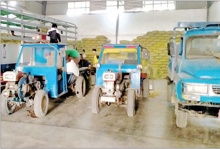
ပဲတီစိမ်းများ ဈေးကွက်ဝင်ရောက်မှုကို တွေ့ရစဉ်။

ပဲတီစိမ်းကို နိုဝင်ဘာလ ဒုတိယပတ်တွင် စတင်ထွန်ယက် စိုက်ပျိုးကြပြီး တောင်သူတစ်ဦးနှင့်