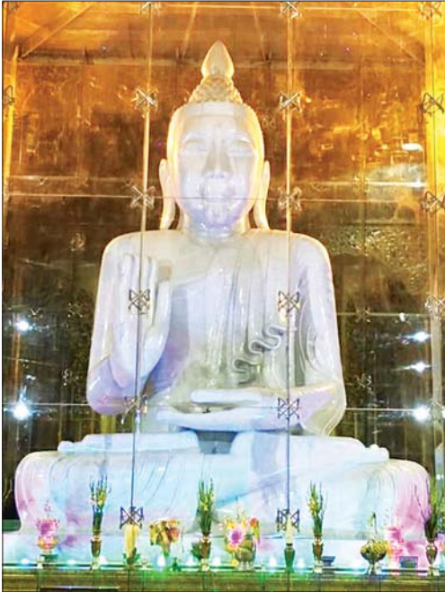
အင်းစိန်မြို့နယ် မင်းဓမ္မကုန်းတော်ပေါ်ရှိ လောကချမ်းသာ အဘယလာဘမုနိ (စကျင်) ဗုဒ္ဓရုပ်ပွားတော်မြတ်ကြီးကို ဖူးတွေ့ရစဉ်။

ရန်ကုန် ဖေဖော်ဝါရီ ၁၀ ရန်ကုန်တိုင်းဒေသကြီး အင်းစိန်မြို့နယ်ရှိ မင်းဓမ္မ ကုန်းတော်ပေါ်တွင် တည်ထားကိုးကွယ်ပူဇော်တော်မူ သော လောကချမ်းသာ အဘယလာဘမုနိ (စကျင်) ဗုဒ္ဓရုပ်ပွားတော်မြတ်ကြီးကို ဖေဖော်ဝါရီ ၉ ရက်က မြို့နယ် သံဃနာယကအဖွဲ့၏ ဩဝါဒခံယူကာ ဆရာတော် သံဃာတော် အရှင်သူမြတ်များက အနေကဇာတင်ပြီး ရဟန်းရှင်လူ ပြည်သူအများ ကြည်ညိုဖူးမြော်ပူဇော်နိုင်ရန် ပြန်လည်ဖွင့်လှစ်သည်။ ဂေါပကအဖွဲ့ဝင်များက ကျန်းမာရေးဆိုင်ရာ စည်းကမ်းချက်များနှင့်အညီ နံနက် ၆ နာရီမှ မွန်းလွဲ ၁ နာရီအထိနှင့် ညနေ ၃ နာရီမှ ၆ နာရီအထိ အချိန် နှစ်ပိုင်းခွဲ၍ ရဟန်းရှင်လူ ပြည်သူများအား ကြည်ညို ဖူးမြော် ပူဇော်ခွင့်ပေးထားကြောင်း သိရသည်။ လောကချမ်းသာ အဘယလာဘမုနိ (ကျောက် တော်ကြီး) ဗုဒ္ဓရုပ်ပွားတော်မြတ်ကြီး ရင်ပြင်၌ ကျန်းမာရေးနှင့် အားကစားဝန်ကြီးဌာန၏ စည်းကမ်း ချက်များအတိုင်း ဂေါပကအဖွဲ့ဝင်များက အတက်/ အဆင်းလမ်းများ သတ်မှတ်ထားပြီး လက်ဆေးရန် လက်ဆေးဘေစင်၊ ဆပ်ပြာရည်များ နေရာမလပ် စီစဉ်ဆောင်ရွက်ပေးထားကြောင်း သိရသည်။ ရွှေမြိုင်မောင်ဖုန်း