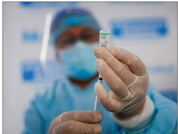
ကိုဗစ်-၁၉ ကာကွယ်ဆေးထိုးပေးရန် လုပ်ဆောင်နေသည်ကို တွေ့ရစဉ်။