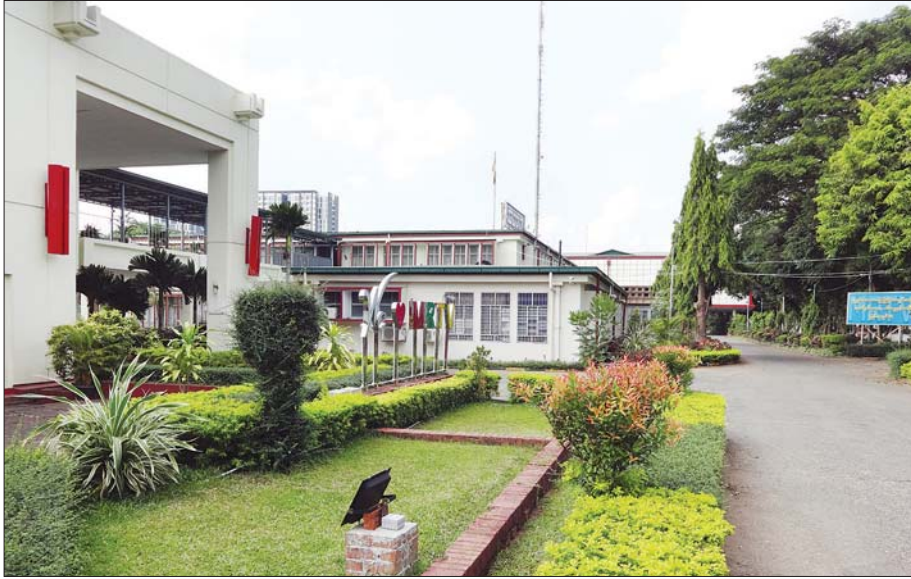
ရန်ကုန်မြို့ရှိ မြန်မာ့အသံနှင့် ရုပ်မြင်သံကြား။

“ကမ္ဘာတစ်ဝန်းမှာ ကူးစက်ပျံ့နှံ့ဖြစ်ပွားခဲ့တဲ့ ကိုဗစ်- ၁၉ ကပ်ရောဂါဟာ မြန်မာနိုင်ငံမှာလည်း