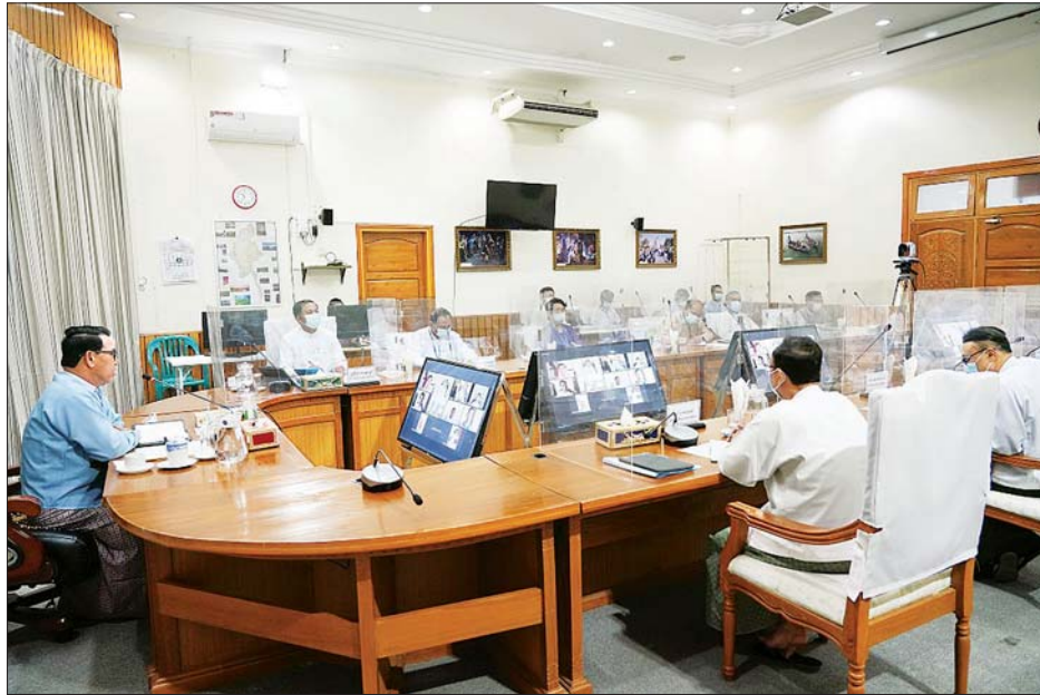
ပြည်ထောင်စုဝန်ကြီး ဦးမောင်မောင်အုန်း မြန်မာနိုင်ငံ ခရီးသွားလုပ်ငန်းအဖွဲ့ချုပ်နှင့် ညီနောင်အသင်းများမှ ဥက္ကဋ္ဌများနှင့် အတွင်းရေးမှူးများအား ဗီဒီယိုကွန်ဖရင့်စနစ်ဖြင့် တွေ့ဆုံစဉ်။