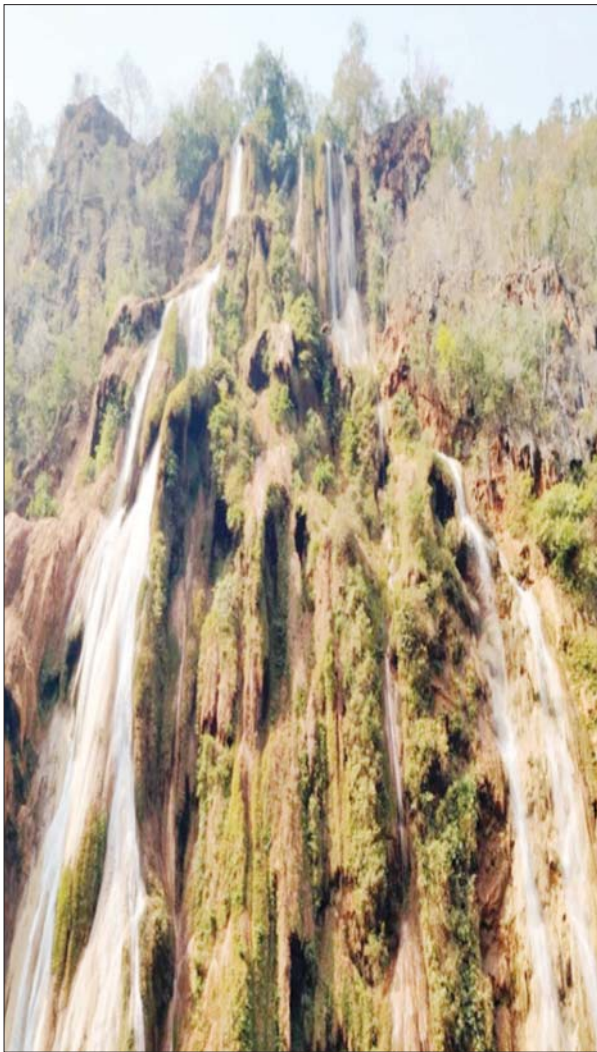
လွဲပုတ်ရေတံခွန်။

လွဲပုတ်ရေတံခွန်ဟာ တောင်ခြေကနေပြီးအပေါ်ကို မိနစ်အနည်းငယ်ခန့်