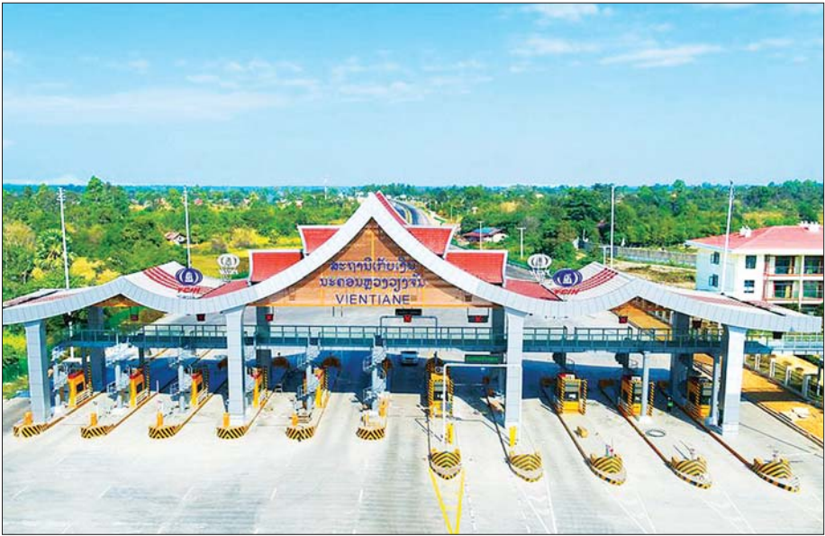
လာအိုနိုင်ငံရှိ ဗီယန်ကျင်းတိုးတက်တစ်ခုကို တွေ့ရစဉ်။

လာအိုနိုင်ငံတွင် ဖေဖော်ဝါရီ ၉ ရက်က ၁၀၆၇၂၂ ဦးအား ကိုရိုနာဗိုင်းရပ်စ် စစ်ဆေးပေးနိုင်ခဲ့ပြီး ၎င်းတို့အနက် ၄၅ ဦး ကိုရိုနာဗိုင်းရပ်စ်ကူးစက်ခံထားရကြောင်း စစ်ဆေးတွေ့ရှိခဲ့သည်။ ထို့နောက် ၄၁ ဦးမှာ ကိုရိုနာဗိုင်းရပ်စ်ကပ်ရောဂါမှ ပြန်လည်ကောင်းမွန်လာပြီဖြစ်ကြောင်း၊ လာအိုနိုင်ငံတွင် မတ် ၂၄ ရက်က ပထမဆုံး ကိုဗစ်-၁၉ ကူးစက်ခံရသူ နှစ်ဦးရှိကြောင်း အတည်ပြုဖော်ပြခဲ့သည်။ ဆင်ဟွာ