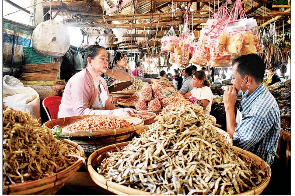
များနှင့် စက်ရုံ အလုပ်ရုံများ ပြန်လည် လည်ပတ်လာကြောင်း သိရသည်။ ထိုကဲ့သို့ ခရီးသွားလုပ်ငန်းများ ဖွင့်လှစ်လာခြင်း ကြောင့် စစ်တွေမြို့နယ်၌ ငါးခြောက်၊ ပုစွန်ခြောက်နှင့် ရေထွက်ပစ္စည်းများ ရောင်းချနေသူများမှာလည်း ရောင်းအားကောင်းလာကာ ဝင်ငွေတိုးလာကြောင်း သိရသည်။ တင်ထွန်း (ပြန်/ဆက်)

ကိုဗစ်-၁၉ ရောဂါဖြစ်ပွားမှု ကျဆင်းလာသည့်အခါ ခရီးသွားလုပ်ငန်းများ ဖွင့်လှစ်လာချိန်တွင် ခရီးသွား လုပ်ငန်းကို အဓိပြုလုပ်ကိုင်နေကြသော အခြေခံ ပြည်သူ