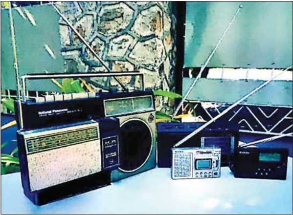
နေရှင်နယ်ပန်နာဆိုးနပ် R 207 ထရန်စစ္စတာရေဒီယို၊ 543 ရေဒီယိုကက်ဆက်နှင့် ခေတ်ပေါ်ဒစ်ဂျစ်တယ်ရေဒီယိုလေးများ

“ ရွာမှာနေရတာဆိုတော့ ဖတ်စရာသတင်းစာမရှိ၊ လေ့လာစရာစာအုပ်က မစုံဆိုတော့ မြန်မာ့အသံကိုပဲ အားကိုးခဲ့ရပါတယ်။ ဒါကြောင့်မို့လည်း ရတဲ့လစာထဲကနေ ခြစ်ခြတ်စုထားတဲ့ငွေကလေးနဲ့ ဆင်သမားတစ်ယောက်ပြန်ရောင်းတဲ့ ဂျပန်လုပ် နေရှင်နယ်ပန်နာဆိုးနပ် R 207 ထရန်စစ္စတာရေဒီယိုအဟောင်းလေးဝယ်ဖြစ်ခဲ့ပါတယ်။ ကျောင်းချိန်မရှိတဲ့အခါဆိုရင် အချိန်ပြည့်လိုလို ရေဒီယိုလေးကိုပဲ အဖော်ပြုနေမိခဲ့ပါတယ်”