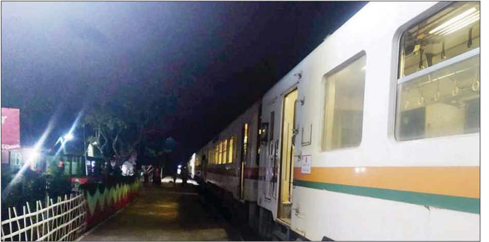
ရန်ကုန်ဘူတာကြီးမှ ဥက္ကံဘူတာသို့ ဖေဖော်ဝါရီ ၇ ရက် ည ၈ နာရီတွင် ဝင်ရောက်လာသော ခေါက်တိုရထားကို တွေ့ရစဉ်။

ရန်ကုန်ဘူတာကြီးမှ ဥက္ကံဘူတာသို့ ရထားလမ်း အတိုင်း အတာဖြင့် ၅၆ မိုင် ၅ ဖာလုံရှိပြီး ဘူတာစဉ် ပေါင်း၂၆ ဘူတာတွင် ခရီးသွားအများဆုံး စီးနင်းသော ဘူတာမှာ ရန်ကုန်ဘူတာကြီး၊ လှော်ကား၊ မှော်ဘီနှင့် တိုက်ကြီးဘူတာတို့ဖြစ်ကြောင်း၊ ခရီးစဉ်အစ၊ အဆုံးစီးနင်း ချိန် ၃ နာရီခွဲရှိပြီး အဆိုပါခေါက်တိုရထားမှာ ရုံးတက်၊