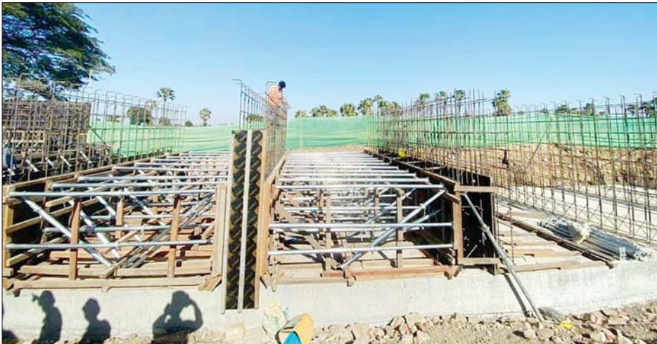
တာဝန်ယူ တည်ဆောက်လျက်ရှိပြီး ကွန်ကရစ် ရေကျော်တံတားများကို ပြီးခဲ့သည့် ဩဂုတ်လက စတင်

ဘုတလင် ဖေဖော်ဝါရီ ၉ စစ်ကိုင်းတိုင်းဒေသကြီး ဘုတလင် မြို့နယ်၌ ဘုတလင်- မောင်းထောင် ကားလမ်းပေါ်တွင် JICA ၏ ချေးငွေ ဖြင့် ကွန်ကရစ်ရေကျော်တံတားနှစ်စင်း တည်ဆောက်လျက်ရှိကြောင်း မြို့နယ် ကျေးလက်လမ်း ဖွံ့ဖြိုးရေးဦးစီးဌာနမှ သိရသည်။ အဆိုပါ ကားလမ်းပေါ်တွင် ၇၂ ပေအရှည်ရှိ ကွန်ကရစ်ရေကျော်တံ တားတစ်စင်းနှင့် ၃၆ ပေအရှည်ရှိ ကွန်ကရစ် ရေကျော်တံတားတစ်စင်း တည်ဆောက်ခြင်း လုပ်ငန်းများကို ခွင့်ပြုရန်ပုံငွေ ၂၁၄ ဒသမ ၈၇ သန်း ဖြင့် တင်ဒါအောင်မြင်သည့်ကုမ္ပဏီက