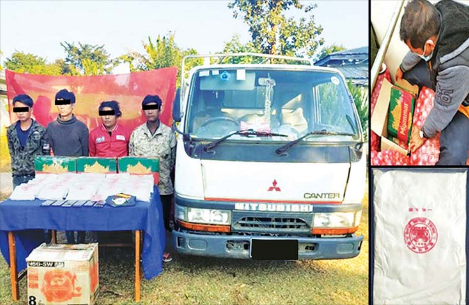
သိမ်းဆည်းရမိသည့် ဘိန်းဖြူများနှင့် ပြစ်မှုကျူးလွန်သူများကို တွေ့ရစဉ်။