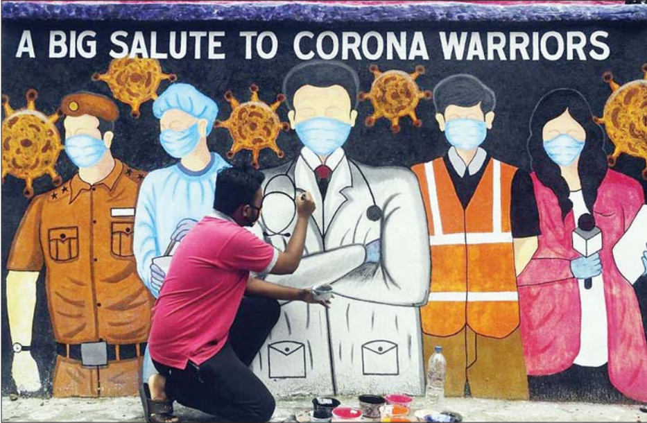
ကိုဗစ်- ၁၉ အတွက် တိုက်ပွဲဝင်ခဲ့ကြသူများကို လေးစားဂုဏ်ပြုဖော်ပြရေးဆွဲထားတဲ့ နံရံဆေးရေးပန်းချီတစ်ခုကို တွေ့ရစဉ်။

ကန့်သတ်ပိတ်ဆို့မှုတွေကို ဖယ်ရှားလိုက်ပြီးနောက်မှာ ဆိုင်ပြန်လည်ဖွင့်လှစ်လိုက်တဲ့ ဆံသဆရာများထံမှ တစ်ဦးပဲ ဖြစ်ပါတယ်။