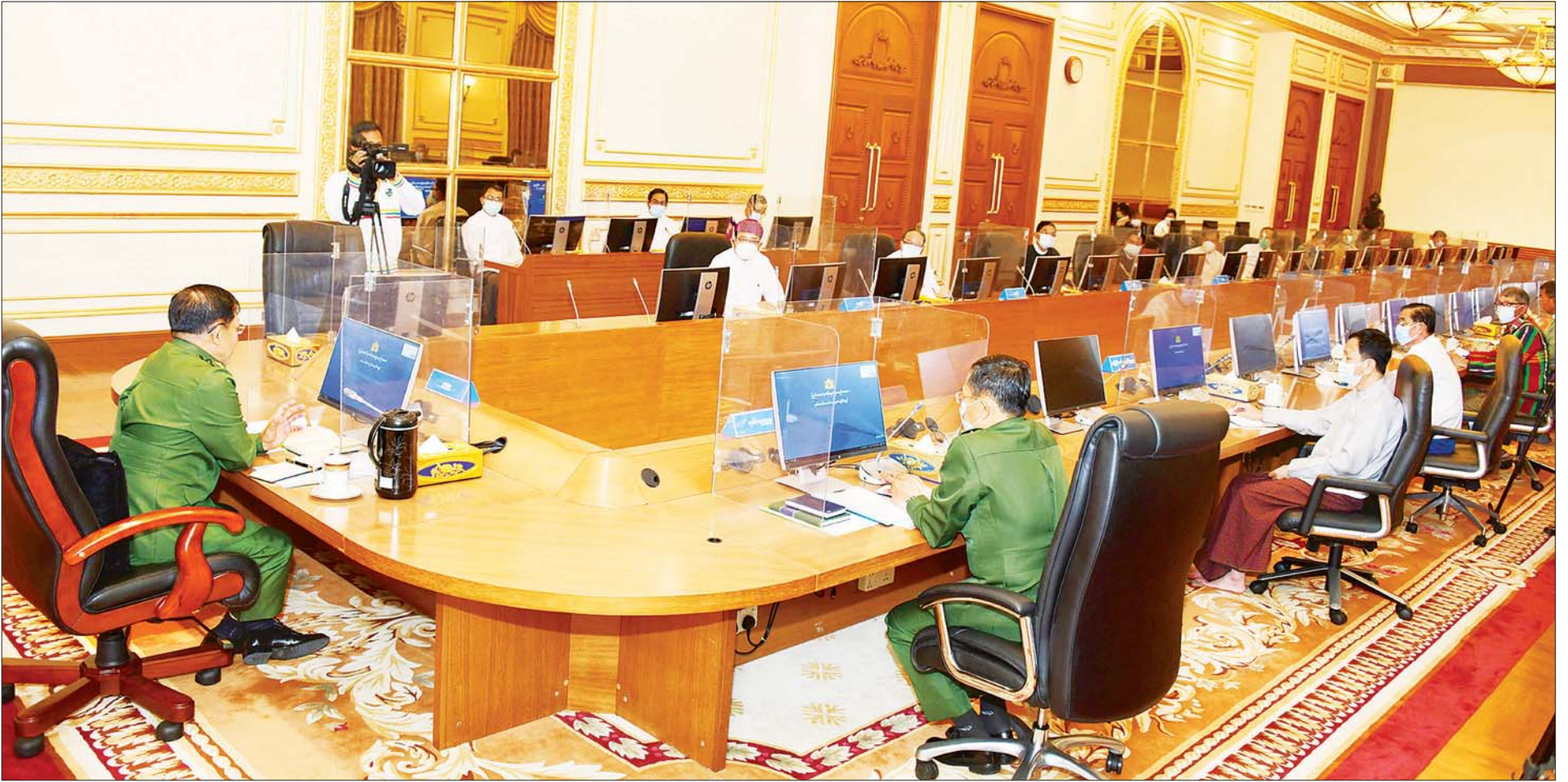
နိုင်ငံတော်စီမံအုပ်ချုပ်ရေးကောင်စီဥက္ကဋ္ဌ၊ တပ်မတော်ကာကွယ်ရေးဦးစီးချုပ် ဗိုလ်ချုပ်မှူးကြီး မင်းအောင်လှိုင် နိုင်ငံတော်စီမံအုပ်ချုပ်ရေးကောင်စီနှင့် နေပြည်တော်ကောင်စီ၊ တိုင်းဒေသကြီး (သို့မဟုတ်) ပြည်နယ်အုပ်ချုပ်ရေးကောင်စီ၊ ကိုယ်ပိုင်အုပ်ချုပ်ခွင့်ရတိုင်း (သို့မဟုတ်) ဒေသစီမံအုပ်ချုပ်ရေးအဖွဲ့ ညှိနှိုင်းအစည်းအဝေးသို့ အမှာစကားပြောကြားစဉ်။ သတင်းစဉ်