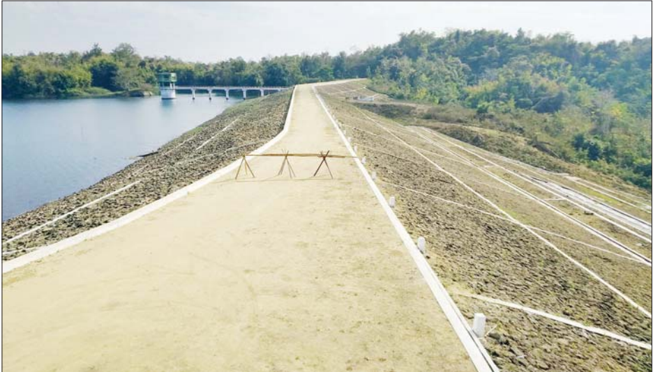
ရန်ကုန်တိုင်းဒေသကြီး ဥက္ကံမြို့နယ်ရှိ တဘူးလှဆည်။