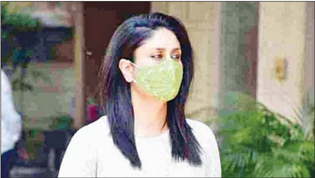
ဘောလိဝုဒ်မင်းသမီး ကရီနာကပူး