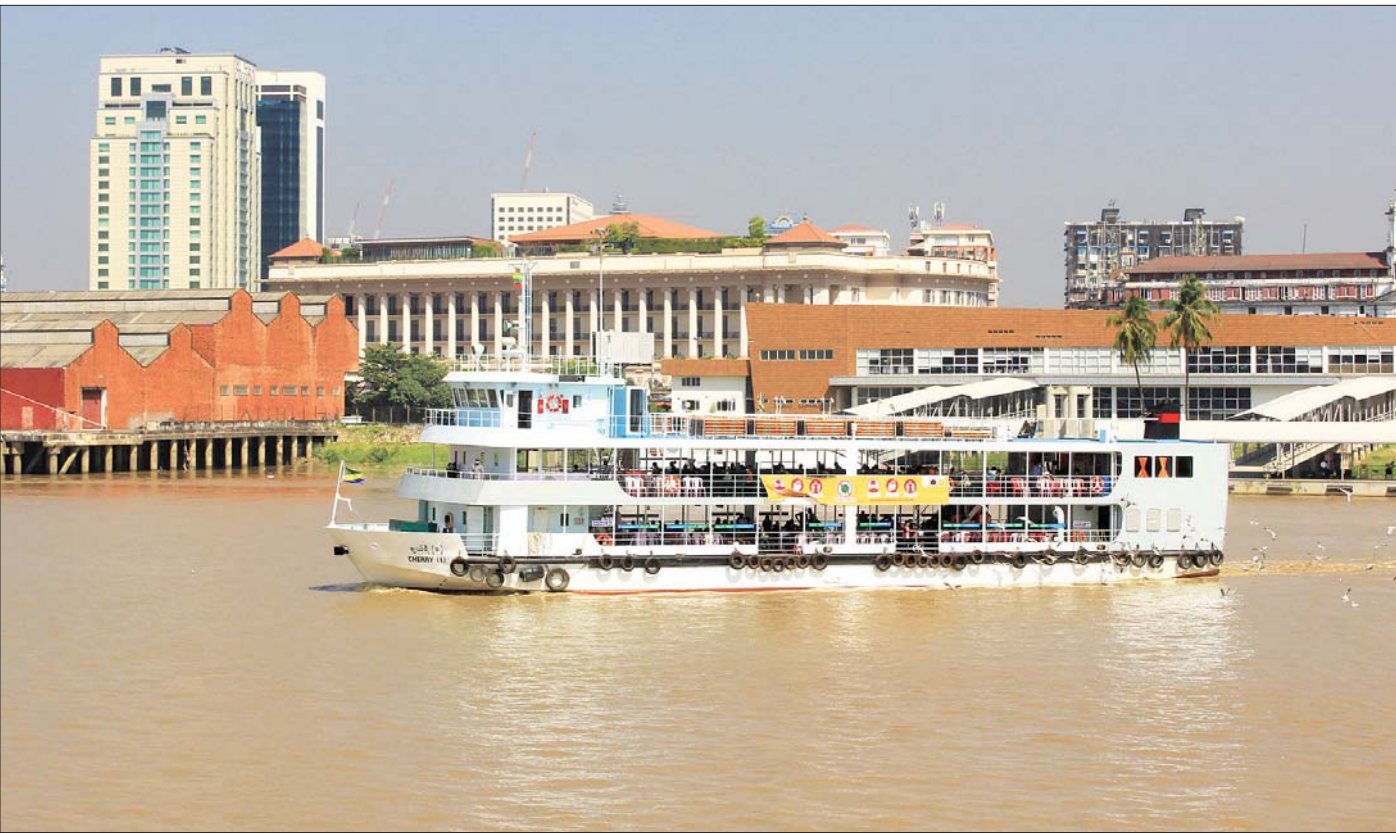
ရန်ကုန်(ပန်းဆိုးတန်း/ဒလ) ပြေးဆွဲသည့် ချယ်ရီသင်္ဘောတစ်စင်းကို တွေ့ရစဉ်။

“ ဒီနေ့ကစတင်ပြီးတော့ သင်္ဘောပြေးဆွဲမယ့် အချိန် အနေနဲ့ ဒလဘက်က နံနက် ၅ နာရီခွဲမှစပြီး ညနေ ၆ နာရီ မိနစ် ၄၀ က နောက်ဆုံးအခေါက်ဖြစ်သွားမယ်။ ပန်းဆိုးတန်း ဘက်က နံနက် ၆ နာရီမှ စပြီး ည ၇ နာရီအထိ နောက်ဆုံး အခေါက် ဖြစ်သွားမယ်။ အဲဒီအချိန်နဲ့ ပြောင်းလဲပြေးဆွဲ ပေးသွားမှာပါ။ မူလပြေးဆွဲနေတဲ့ သင်္ဘောခရီးစဉ် အသွား ၃၈ ခေါက် ၊ အပြန် ၃၈ ခေါက်ကနေ အသွား ၃၅ ခေါက်၊ အပြန် ၃၅ ခေါက်နုန်းနဲ့ ပြေးဆွဲမှာပါ။ ညမထွက်ရ အမိန့် ထုတ်ပြန်ထားတာကြောင့် ခရီးစဉ်ကို အချိန်လျှော့ပြီးတော့ စာမျက်နှာ ၁၀ ကော်လံ ၄ *