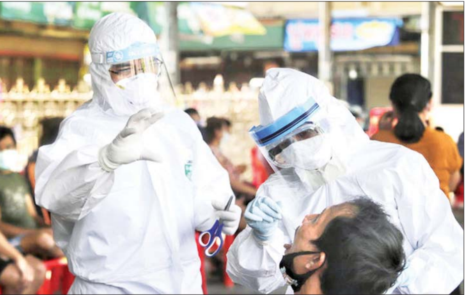
ထိုင်းနိုင်ငံ ပညာနိသာနီတွင် ကျန်းမာရေးဝန်ထမ်းများက ကိုရိုနာဗိုင်းရပ်စ်စစ်ဆေးရန် လုပ်ဆောင်နေသည်ကို တွေ့ရစဉ်။

ခရီးသွားလုပ်ငန်းစတင်ဖို့ “ခရီးသွားလုပ်ငန်းစတင်ဖို့” ဟူသည့် လှုပ်ရှားမှုကို အရေးပေါ်ကာလပြီးနောက် ပြန်လည်စတင်လျှင်ကောင်းမည်လားဆိုသည့် မေးခွန်းအပေါ် ငါးရာခိုင်နှုန်းက ချက်ချင်းစတင်သင့်ကြောင်း၊ ၅၁ ရာခိုင်နှုန်းက ကိုရိုနာဗိုင်းရပ်စ်အခြေအနေပေါ် မူတည်ကာ ပြန်လည်စတင်သင့်ကြောင်းနှင့် ၃၈ ရာခိုင်နှုန်းက ပြန်လည်မစတင်သင့်ကြောင်း ဖြေကြားခဲ့သည်။ အင်န်အိတ်ချ်ကေ