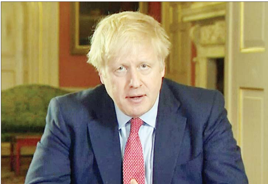
ဗြိတိန်ဝန်ကြီးချုပ် ဘောရစ်ဂျွန်ဆင်