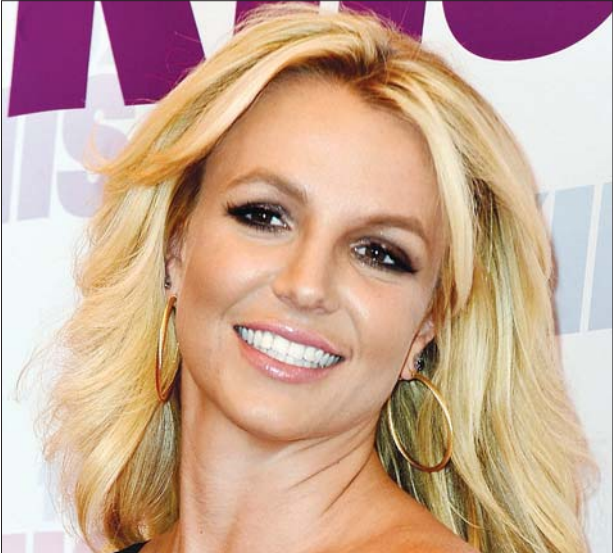
အဆိုတော် ဘရစ်တနီစပီးယား