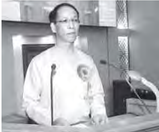
ဒုတိယသမ္မတ ဖေါက်တာ ဦးမောင်ခမ်း ၂၀၁၁ ခုနှစ် ကမ္ဘာ့ဆရာများနေ့ အထိမ်းအမှတ် အခမ်းအနားတွင် ပြောကြားစဉ် (သတင်းစဉ်)

နေပြည်တော် အောက်တိုဘာ ၅ ၂၀၁၁ ခုနှစ် ကမ္ဘာ့ဆရာများနေ့အထိမ်းအမှတ်အခမ်းအနားကို ယနေ့နံနက် ၁၀ နာရီတွင် နေပြည်တော်ရှိ မြန်မာအပြည်ပြည်ဆိုင်ရာ ကွန်ဗင်းရှင်းဗဟိုဌာန (MICC) ၌ ကျင်းပရာ ပြည်ထောင်စုသမ္မတမြန်မာနိုင်ငံတော် ဒုတိယသမ္မတ ဖေါက်တာဦးမောင်ခမ်း တက်ရောက်၍ မိန့်ခွန်းပြောကြားသည်။