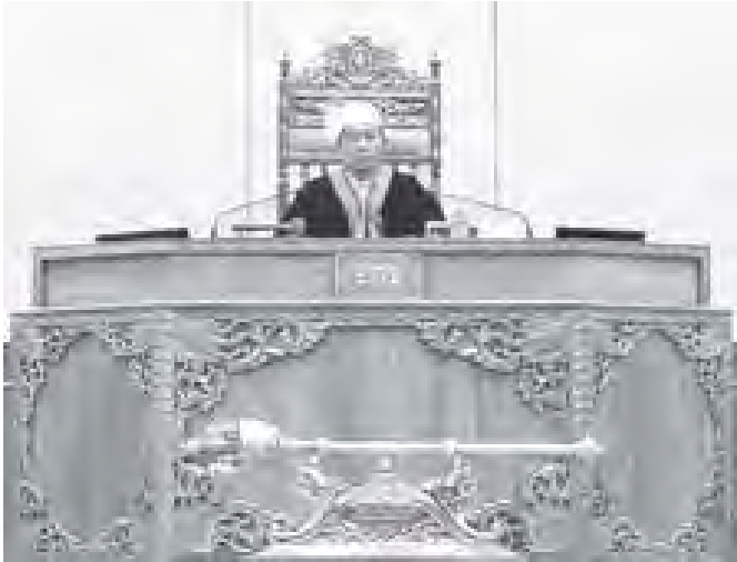
ပြည်သူ့လွှတ်တော်ဥက္ကဋ္ဌ သုဇဉ်ရွှေမန်း ပထမအကြိမ် ပြည်သူ့လွှတ်တော် ဒုတိယပုံမှန်အစည်းအဝေး(၃၂)ရက်မြောက် နေ့သို့ တက်ရောက်စဉ်။

နေပြည်တော် အောက်တိုဘာ ၂၊ နေပြည်တော်ရှိ လွှတ်တော်အဆောက်အအုံ၊ ပြည်သူ့လွှတ်တော်ခန်းမ၌ ဆက်လက်ကျင်းပရာ ပြည်သူ့လွှတ်တော်ဥက္ကဋ္ဌ သုဇဉ်ရွှေမန်းနှင့် ပြည်သူ့လွှတ်တော်ကိုယ်စားလှယ်(၃၈၄)ဦးတို့ တက်ရောက်ကြသည်။