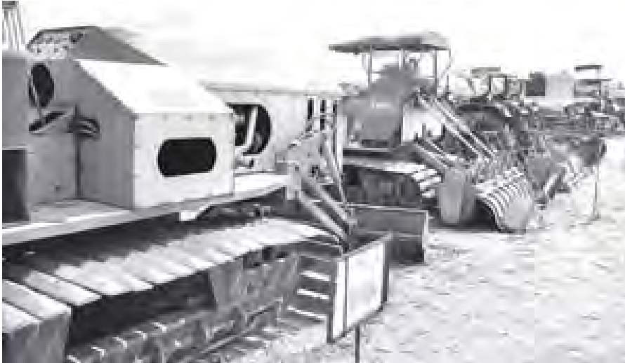
ပုပ္ဖသိရိမြို့နယ် ခေတ်မီစက်မှုလယ်ယာစနစ် ၈၈ ၅၀၀ စိုက်ကွင်းအတွင်း ခင်းကျင်းပြသထားသော ခေတ်မီစက်မှုလယ်ယာစနစ်ထူထောင်ရာ၌ လိုအပ်သည့် မြေယာမြေပြင်ကိရိယာများ၊ ရိတ်သိမ်းခြွေလှေ့စက်များနှင့် ကောက်စိုက်စက်များကို တွေ့ရစဉ်။ (သတင်းစဉ်)

ယင်းနောက် ပြည်ထောင်စုဝန်ကြီး ဦးမြင့်လှိုင်က လာမည့် ဆောင်းသီးနှံနှင့် နွေစပါးရာသီတွင် ပုပ္ဖသိရိမြို့နယ် စက်မှု လယ်ယာစနစ် ၈၈ ၅၀၀ အတွင်း သီးနှံ များ စိုက်ပျိုးမည့် အစီအမံများ၊ နေပြည်တော်ကောင်စီနယ်မြေအတွင်း ဆည်ရေသောက် လယ်ဧက ၁၂၀၀၀ ကို သိပ္ပံနည်းကျစိုက်ပျိုးမှု (G.A.P) စနစ်ဖြင့် ရာနှုန်းပြည့် ကူးပြောင်း အကောင်အထည် ဖော်မည့် အစီအမံနှင့် နေပြည်တော်၏