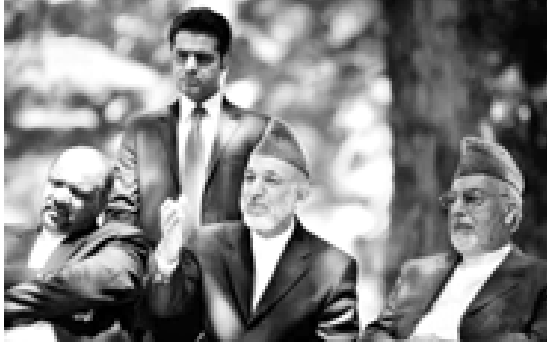
တာလီဘန် စစ်သွေးကြွအုပ်စုနှင့် ဆွေးနွေးမှုထပ်မံ မပြုလုပ်တော့ဟု အာဖဂန်သမ္မတ ဟာမိဒ်တာဇိုင်က သတင်းစာရှင်းလင်းပွဲတွင် တွေ့ရသည်။ (ဇာတ်ပုံ-အင်တာနက်)

မိမိ၏အစိုးရအဖွဲ့သည် တာလီဘန်စစ်သွေးကြွအုပ်စုနှင့် နောက်ထပ် လုံးဝဆွေးနွေးတော့မည် မဟုတ်ကြောင်း အာဖဂန်နစ္စတန်သမ္မတ ဟာမိဒ်တာဇိုင်က အောက်တိုဘာ ၁ ရက်တွင် ပြောကြားသည်။