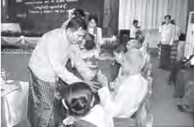
အလုပ်သမားဝန်ကြီးဌာနနှင့် လူမှုဝန်ထမ်း၊ ကယ်ဆယ်ရေးနှင့် ပြန်လည်နေရာချထားရေး ဝန်ကြီးဌာန ပြည်ထောင်စုဝန်ကြီး ဦးအောင်ကြည် အဘိုးအဘွားများအား ဆေးဝါးပစ္စည်းများနှင့် အလှူငွေများကို ဖော်ပြလျှမ်းစဉ်း (သတင်းစဉ်)

ထို့နောက် UNFPA မှ ဌာနကိုယ်စားလှယ် Mr. Mohamed S. Abdel-Ahah က နှုတ်ခွန်းဆက်တောင်း ပြောကြားသည်။