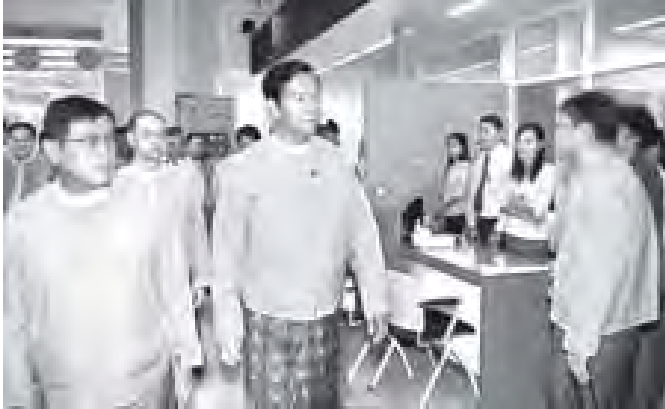
နိုင်ငံခြားငွေ ရောင်းဝယ်လဲလှယ်ခြင်းလုပ်ငန်းများ ဆောင်ရွက်မည့် Money Changer ကောင်တာများ ပွင့်လှစ်ပြီး လုပ်ငန်းစတင်ဆောင်ရွက်နေမှုကို ကြည့်ရှုစစ်ဆေးစဉ်။ (သတင်းစဉ်)

ထို့နောက် အစည်းအဝေးခန်းမ၌ မြန်မာနိုင်ငံတော် ဗဟိုဘဏ်ဒုတိယဥက္ကဋ္ဌ ဦးမောင်မောင်ဝင်းနှင့် နိုင်ငံခြားငွေများ ရောင်းဝယ်လဲလှယ်ရေးလုပ်ငန်း ကြီးကြပ်မှုအဖွဲ့ဝင်များဖြစ်ကြ သော ဘဏ်အသီးသီးမှ ဥက္ကဋ္ဌများ၊ ဦးဆောင်ညွှန်ကြားရေးမှူး များက လုပ်ငန်းစတင်ဆောင်ရွက်နေမှုများနှင့် ရေရှည်ဆောင်ရွက် မည့် အစီအမံများကို ရှင်းလင်းတင်ပြကြရာ ပြည်ထောင်စုဝန်ကြီး က ဖွေးကွတ်တည်ငြိမ်ခိုင်မာမှုရှိစေရေး ဘဏ်များ၏ ယှဉ်ပြိုင်