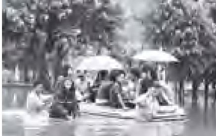
ကရုဏ်နိုင်ငံတောင်ပိုင်း ကွမ်မီကျွန်းဒေသ၌ တိုင်းပုန်းမုန်တိုင်း နီဆက်တိုက်ခတ် ဖြစ်ပွားခဲ့ပြီး နယ်လွှတ်တော်နှင့် နယ်အုပ်ချုပ်စုတို့တွင် ပျက်စီးမှုများ ရှိနေသည်။

နန်နင်း အောက်တိုဘာ ၁ ကွမ်မီကျွန်းကိုယ်ပိုင် အုပ်ချုပ်ခွင့်ရဒေသ၏ တောင်ပိုင်းတွင် နီဆက်တိုက်ခတ် ဖြစ်ပွားခဲ့ပြီး နယ်လွှတ်တော်နှင့် နယ်အုပ်ချုပ်စုတို့တွင် ပျက်စီးမှုများ ရှိနေသည်။