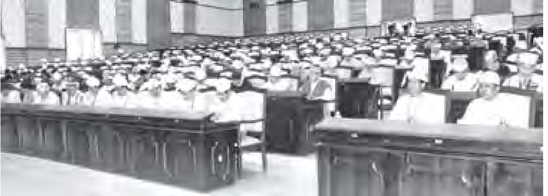
ပထမအကြိမ် အမျိုးသားလွှတ်တော် ဒုတိယပုံမှန်အစည်းအဝေး (၂၈)ရက်မြောက်နေ့သို့ တက်ရောက်လာကြသူများအား တွေ့ရစဉ်။

အစည်းအဝေးသို့ အမျိုးသား လွှတ်တော်ဥက္ကဋ္ဌ ဦးခင်အောင်မြင် နှင့် အမျိုးသားလွှတ်တော် ကိုယ်စားလှယ် (၂၁၀)တို့ တက်ရောက်ကြသည်။ အစည်းအဝေးတွင် ပြည်ထောင်စု သမ္မတမြန်မာနိုင်ငံတော် နိုင်ငံတော် သမ္မတ ဦးသိန်းစိန်က အမျိုးသား လွှတ်တော်ဥက္ကဋ္ဌထံသို့ စက်တင်ဘာ (၂၉) ရက်ခွဲဖြင့် ပေးပို့သော သဝဏ်လွှာကို အမျိုးသား လွှတ်တော်ဥက္ကဋ္ဌက ဖတ်ကြားသည်။ ရှမ်းပြည်နယ် မဲဆန္ဒနယ်အမှတ် (၈)မှ ဦးရွှေမောင်က "အမျိုးသား အကျိုးစီးပွားအတွက် ကျင့်သုံး ဆောင်ရွက်နေကြသည့် ကိစ္စရပ် စာမျက်နှာ ၈ ကော်လံ ၁ သို့