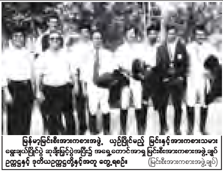
မြန်မာ့မြင်းစီးအားကစားအဖွဲ့၊ ယဉ်ပြိုင်ပွဲ မြင်းစီးအားကစားသမားအဖွဲ့အား ယဉ်ပြိုင်ပွဲ ဆုချီးမြှင့်ပွဲအဖြစ် အရှေ့တောင်အာရှ မြင်းစီးအားကစားအဖွဲ့အုပ်စု ဥက္ကဋ္ဌနှင့် ဒုတိယဥက္ကဋ္ဌတို့နှင့်အတူ တွေ့ရပုံ။

ရန်ကုန် စက်တင်ဘာ ၃၀ (၁၅)ကြိမ်မြောက် ဆေးပညာအထူးပြုဘာသာရပ်များဆိုင်ရာ နီးနောဖလှယ်ပွဲကို အောက်တိုဘာ ၆ ရက်မှ ၉ ရက်အထိ ရန်ကုန်မြို့၊ ဆိမ်းနားဟိုတယ်၌ ကျင်းပမည် ဖြစ်ကြောင်းနှင့် သက်ဆိုင်ရာ ဘာသာရပ်များဆိုင်ရာအဖွဲ့များမှတစ်ဆင့် မှတ်ပုံတင် နိုင်သည်။ (သတင်းစဉ်)