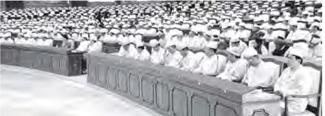
ပထမအကြိမ် ပြည်သူ့လွှတ်တော် ဒုတိယပုံမှန်အစည်းအဝေး (၂၉)ရက်မြောက်နေ့သို့ တက်ရောက်လာကြသူများအား တွေ့ရစဉ်။

ယနေ့လွှတ်တော်အစည်းအဝေး၌ နိုင်ငံတော်သမ္မတ၏သဝဏ်လွှာအား မှတ်တမ်းတင် အတည်ပြုခြင်း၊ မေးခွန်း(၉)ခု မေးမြန်းခြင်းနှင့် မြေကြားခြင်း၊ အဆိုအသစ်(၁)ခု တင်သွင်းခြင်း၊ အရေးကြီးအဆို(၁)ခု အတည်ပြု ထောက်ခံမှတ်တမ်းတင် ခြင်းနှင့် အဆို(၂)ခု ဆွေးနွေးခြင်း တို့ကို ဆောင်ရွက်ကြသည်။ ပြည်ထောင်စုသမ္မတ မြန်မာ နိုင်ငံတော် နိုင်ငံတော်သမ္မတက ပြည်သူ့လွှတ်တော် ဥက္ကဋ္ဌထံသို့ စက်တင်ဘာ (၂၉) ရက်ခွဲဖြင့် ပေးပို့သောသဝဏ်လွှာကို ပြည်သူ့ လွှတ်တော်ဥက္ကဋ္ဌက လွှတ်တော်သို့ ဖတ်ကြား ရှင်းလင်းတင်ပြပြီး စာမျက်နှာ ၆ ကော်လံ ၁ သို့