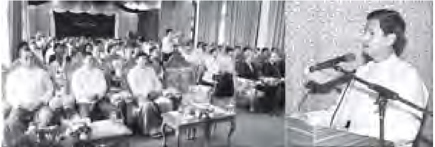
ဆောက်လုပ်ရေးဝန်ကြီးဌာန ပြည်ထောင်စုဝန်ကြီး ဦးခင်မောင်မြင့် Seminar of Forum Expert Network for Southeast Asia; Sustainable Urban Future ဖွင့်ပွဲအခမ်းအနားတွင် အမှုခင်းကော်မရှင်ကြီးစဉ်း