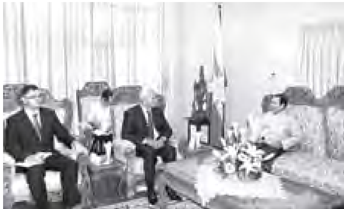
သိပ္ပံနှင့်နည်းပညာဝန်ကြီးဌာန ပြည်ထောင်စုဝန်ကြီး ဦးအေးမြင့်အား ပြည်ထောင်စုသမ္မတမြန်မာနိုင်ငံတော်ဆိုင်ရာ ဘယ်လားနစ်သံအမတ်ကြီး ဒေါက်တာ ဗယ်လာနစ် ဆာဒိုဒို လာရောက်တွေ့ဆုံစဉ်။ (သတင်းစဉ်)

ထိုသို့ တွေ့ဆုံရာတွင် သိပ္ပံနှင့် နည်းပညာဝန်ကြီးဌာန ဒုတိယဝန်ကြီး ဒေါက်တာကိုကိုဦး၊ စက်မှုနှင့် သစ်မွေး ပညာဦးစီးဌာန ညွှန်ကြားရေးမှူးချုပ် ဒေါက်တာ ဇော်မင်းအောင်နှင့် မန္တလေး ကွန်ပျူတာတက္ကသိုလ် ပါမောက္ခချုပ် ဒေါက်တာခင်မိုးသက်တို့ တက်ရောက် ခဲ့ကြသည်။ (သတင်းစဉ်)