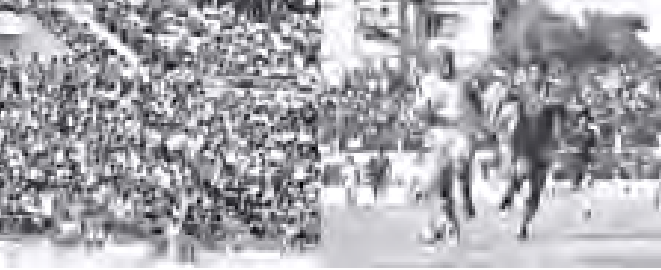
မြန်မာနေ့ရှင်နယ်လိပ်ပြိုင်ပွဲတွင် မြန်မာ့ဘောလုံးပရိသတ်များ စည်တားသိုက်မြိုက်စွာ အားပေးနေကြသည်ကို တွေ့ရစဉ်။