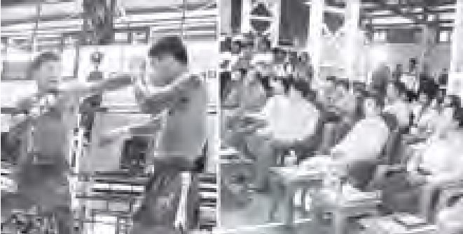
မြန်မာနိုင်ငံ အမျိုးသားအားကစားကော်မတီဥက္ကဋ္ဌ အားကစားဝန်ကြီးဌာန ပြည်ထောင်စုဝန်ကြီး ဦးတင်ဆန်း ၂၀၁၀ ခုနှစ် ပထမအကြိမ် Champion Challenge Cup Tournament တတိယအသုတ် အားကစားပြိုင်ပွဲ ဖွင့်ပွဲအခမ်းအနားတွင် လက်ဝှေ့လက်ရွေးစင်များ သရုပ်ပြယှဉ်ပြိုင်တိုးသတ်မှုကို ကြည့်ရှုအားပေးစဉ်။ (သတင်းစင်)