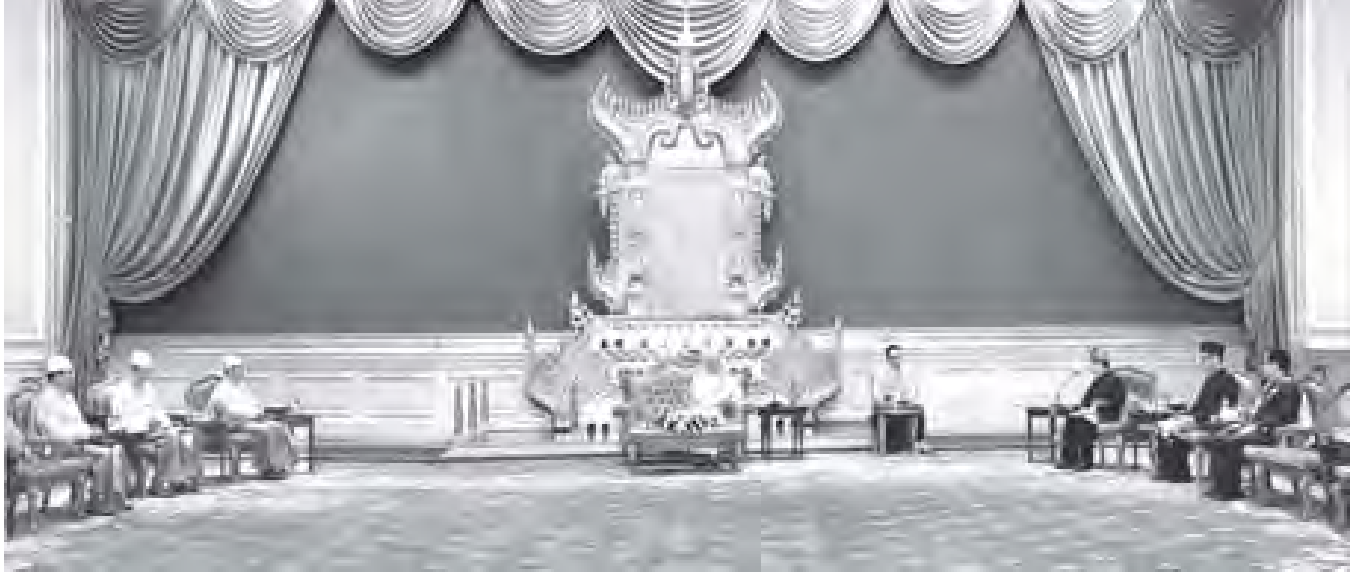
နိုင်ငံတော်သမ္မတ ဦးသိန်းစိန် ပြည်ထောင်စုသမ္မတမြန်မာနိုင်ငံတော်ဆိုင်ရာ မလေးရှားနိုင်ငံ သံအမတ်ကြီး ဒေါက်တာ အာမတ် ဖိုင်ဆဲလ် ဘင် ဗိုဟာမက်အား နေပြည်တော်ရှိ နိုင်ငံတော်သမ္မတရုံး၌ လက်ခံတွေ့ဆုံစဉ်။ (သတင်းစဉ်)

ပြည်ထောင်စုသမ္မတမြန်မာနိုင်ငံတော် နိုင်ငံတော်သမ္မတ ဦးသိန်းစိန်ထံ ပြည်ထောင်စုသမ္မတမြန်မာနိုင်ငံတော်ဆိုင်ရာ မလေးရှားနိုင်ငံ သံအမတ်ကြီးအဖြစ် ခန့်အပ်ရန် သဘောတူညီပြီးဖြစ်သော သံအမတ်ကြီး ဒေါက်တာ အာမတ် ဖိုင်ဆဲလ် ဘင် ဗိုဟာမက်သည် ယနေ့နံနက် ၁၁ နာရီတွင် နေပြည်တော်ရှိ နိုင်ငံတော်သမ္မတရုံးသို့ သွားရောက်၍ ၎င်း၏သံအမတ်ခန့်အပ်လွှာကို ပေးအပ်သည်။ အဆိုပါ သံအမတ်ခန့်အပ်လွှာပေးအပ်ပွဲ အခမ်းအနားသို့ သမ္မတရုံးဝန်ကြီးဌာန ပြည်ထောင်စုဝန်ကြီး ဦးစိုးမောင်၊ နိုင်ငံခြားရေးဝန်ကြီးဌာန ဒုတိယဝန်ကြီး ဦးမောင်မြင့်နှင့် သံတမန်ရေးရာဦးစီးဌာန ညွှန်ကြားရေးမှူးချုပ် ဦးကျော်ကျော်တို့ တက်ရောက်ကြသည်။ (သတင်းစဉ်)