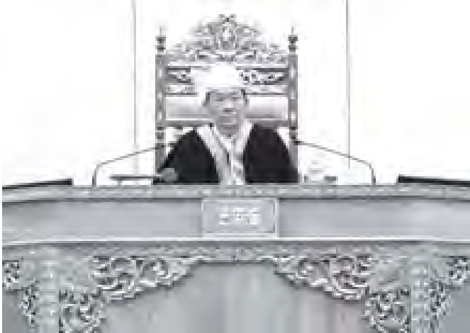
ပြည်သူ့လွှတ်တော်ဥက္ကဋ္ဌ သုရဦးရွှေမန်း ပထမအကြိမ် ပြည်သူ့လွှတ်တော် ဒုတိယပုံမှန်အစည်းအဝေး (၂၇)ရက် မြောက်နေ့သို့ တက်ရောက်စဉ်။

ပထမအကြိမ် ပြည်သူ့လွှတ်တော် ဒုတိယပုံမှန်အစည်းအဝေး (၂၇)ရက်မြောက်နေ့သို့ ယနေ့နံနက် ၁၀ နာရီခွဲတွင် နေပြည်တော်ရှိ လွှတ်တော်အဆောက်အအုံ ပြည်သူ့လွှတ်တော်ခန်းမ၌ ဆက်လက်ကွင်းပရာ ပြည်သူ့လွှတ်တော်ဥက္ကဋ္ဌ သုရ ဦးရွှေမန်းနှင့် ပြည်သူ့လွှတ်တော်ကိုယ်စားလှယ် (၃၈၀)ဦးတို့ တက်ရောက်ကြသည်။