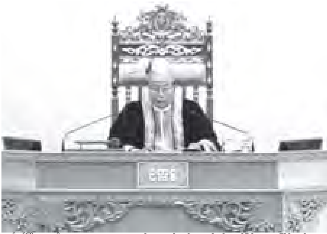
အမျိုးသားလွှတ်တော် ဥက္ကဋ္ဌ ဦးခင်အောင်မြင့် ပထမအကြိမ် အမျိုးသား လွှတ်တော် ဒုတိယပုံမှန်အစည်းအဝေး (၂၇) ရက်မြောက်နေ့သို့ တက်ရောက်စဉ် (သတင်းစဉ်)

အစည်းအဝေးသို့ အမျိုးသား လွှတ်တော်ဥက္ကဋ္ဌ ဦးခင်အောင်မြင့်နှင့် အမျိုးသားလွှတ်တော် ကိုယ်စားလှယ် (၂၀၄)ဦးတို့ တက်ရောက်ကြသည်။ အစည်းအဝေးတွင် ချင်းပြည်နယ် မဲဆန္ဒနယ်အမှတ်(၂)မှ ဦးရန်လွယ်ထန်းက ဖြန့်ဖြူးချိန်လုပ် လမ်းစဉ်ပါတီခေတ် ဂွီကယ်အကြိမ် ပြည်သူ့လွှတ်တော် သက်တမ်းကာလတွင် ဖြန့်ဖြူးချိန် တစ်ခုတည်းသော ခရိုမီကန်သတ္တုထွက်ကို ချင်းပြည်နယ် မြေတောင်ဒေသတွင် တွေ့ရှိပြီး ခရိုမီကန် သတ္တုတန်ချိန် သန်းပေါင်း(၈၀၀၀)နှင့် နီကယ်တန်ချိန် သန်းပေါင်း(၁၀၀)ရှိသည်ဟု နိုင်ငံတော် အစိုးရက ကြေညာခဲ့ကြောင်းနှင့် ယင်း သတ္တုသိုက်ကို လက်ရှိတွင် ဖော်မူ အခြေအနေနှင့် အလားအလာများကို သိရှိလိုပါကြောင်း။ မေးမြန်းရာ သတ္တု တွင်းဝန်ကြီးဌာန ပြည်ထောင်စုဝန်ကြီး ဦးသိန်းထွန်းက သတ္တုတွင်းဝန်ကြီးဌာန မြန်မာ့ဓာတ်သတ္တု ထိုးချဲ့လုပ်ကိုင်ရေး ကော်မရှင်းရင်းသည့် ချင်းပြည်နယ်၊ တိုင်းရင်းမြို့နယ် မြေတောင်ဒေသတွင် ၁၉၈၅-၁၉၈၆ ခုနှစ်တွင်လည်းကောင်း၊ သတ္တုတွင်းဝန်ကြီးဌာန ဘွဲ့ပေးလေ့လာရေး နှင့် ဓာတ်သတ္တုရှာဖွေရေးစီမံဌာနသည် ၁၉၇၂၊ ၁၉၈၂ နှင့် ၁၉၉၉ ခုနှစ်များတွင် လည်းကောင်း၊ ခရိုမီကန်မီးသစ်တိုင်းတာရေးလုပ်ငန်းများဆောင်ရွက်ခဲ့ရာ မြေတောင် ဒေသတွင် နီကယ်သတ္တုရိုင်းကို ကျယ်ပြန့်စွာတွေ့ ရသော်လည်း ခရိုမီကန်ကိုမူ အကွက် လိုက်သာ ဖြစ်ထွန်းမှုရှိသည်ကို တွေ့ရှိခဲ့ရပါကြောင်း။