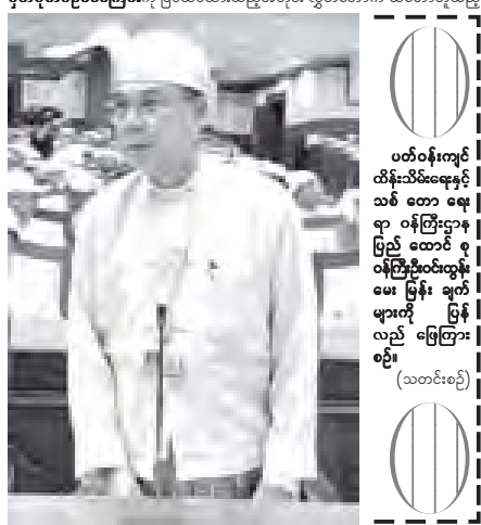
အတွက် ပြည်သူလွှတ်တော်က အထက်ပါ ပြင်ဆင်ချက်များဖြင့် သဘောတူကြောင်း ဆုံးဖြတ်သည်။

အမျိုးသားလွှတ်တော်က အတည်ပြုချက်ဖြင့်ပေးပို့သော ကိုယ်ပိုင်ကျောင်း မှတ်ပုံတင်ဥပဒေကြမ်းကို ပြင်ဆင်ထားသည့်အတိုင်း လွှတ်တော်က သဘောတူသည့်