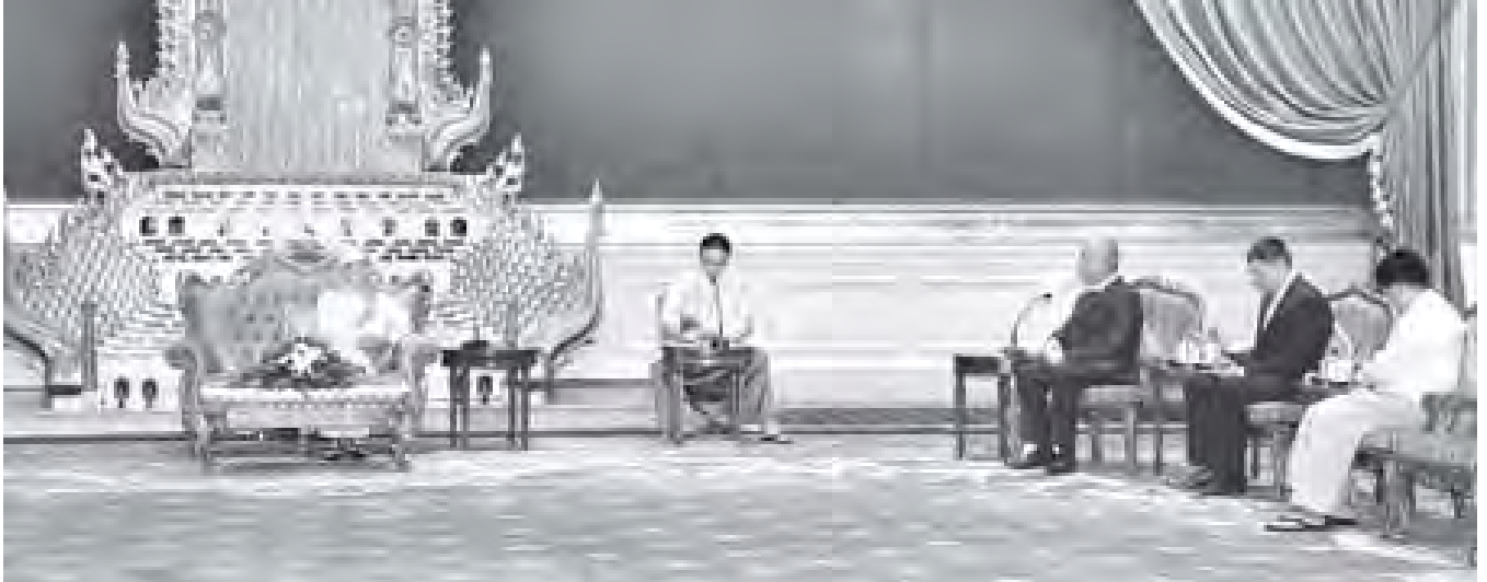
နိုင်ငံတော်သမ္မတ ဦးသိန်းစိန် ပြည်ထောင်စုသမ္မတမြန်မာနိုင်ငံတော်ဆိုင်ရာ ဘယ်လာရစ်သမ္မတနိုင်ငံ သံအမတ်ကြီး ဒေါက်တာ ဗယ်လာရီ ဆာဒိုဒိုအား နေပြည်တော်ရှိ နိုင်ငံတော်သမ္မတရုံး၌ လက်ခံတွေ့ဆုံစဉ်။ (သတင်းစဉ်)