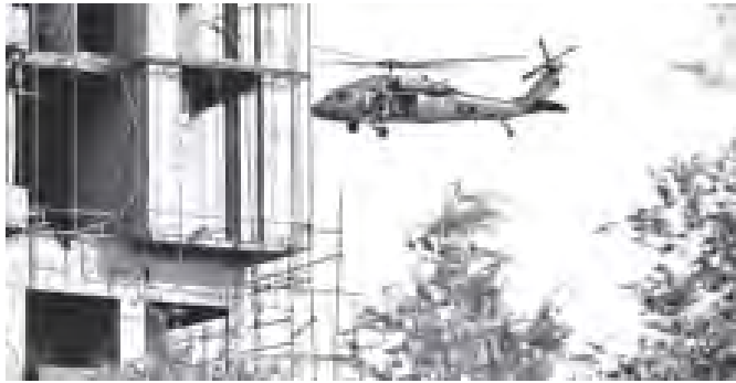
တပ်မတော်တို့၏သွေးကြွေးများ ခံတက်ရရှိသည့်အခါ အဆောက်အအုံတစ်လုံးကို လုံခြုံရေးတပ်ဖွဲ့များ စက်တင်ဘာ ၁၃ ရက်တွင် ဖွင့်လှစ်ခဲ့သည်။