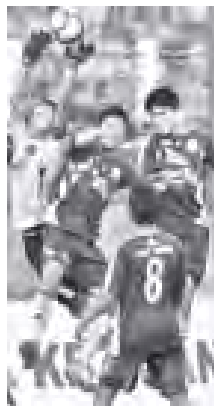
ရတနာပုံတိုက်စစ်ကို ဧရာဝတီရိုးသမား သီလာစည်သူကတူလှစဉ်။

မန္တလေး စက်တင်ဘာ ၁၅ MNL Grand Royal 2011 အမှတ်ပေးဘောလုံးပြိုင်ပွဲ ဒုတိယအကြိမ်ပွဲစဉ် (၁၉)ကို ယနေ့ညနေ ၄ နာရီက ဝဏ္ဏကျွန်း ကျင်းပရာ ဧရာဝတီယူနိုက်တက်အသင်းက လက်ရှိချန်ပီယံရတနာပုံကို နှစ်ရိုး-ရိုးမရှိဖြင့် အနိုင်ရသွားသည်။ ဧရာဝတီယူနိုက်တက် - နှစ်ရိုး (သောမက်၊ အိုက်) ရတနာပုံ - ရိုးမရှိ လက်ရှိချန်ပီယံရတနာပုံ နှစ်ပွဲဆက် နေ့ခိုပြီး အနိုင်ရရှိခဲ့သော ဧရာဝတီအသင်းမှာ ချန်ပီယံပြုလေကြောင်းပေါ်တွင် ဆက်လက်ရပ်တည်နိုင်ခဲ့သည်။ [၁၇-၉-၂၀၁၁] YUSC ကွင်း ရန်ကုန်ယူနိုက်တက်-ဥသယာယူနိုက်တက်