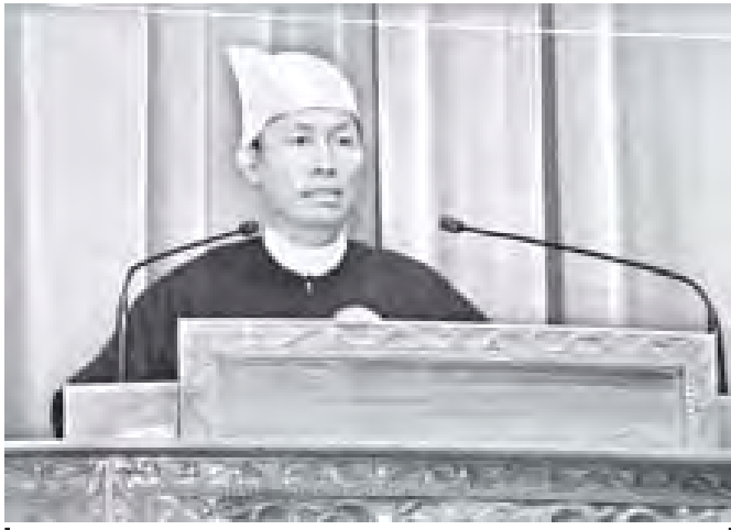
ပြည်သူ့လွှတ်တော်ဥက္ကဋ္ဌ သုရဦးရွှေမန်း အပြည်ပြည်ဆိုင်ရာ ဒီမိုကရေစီနေ့ ၂၀၁၁ ၊ အထိမ်းအမှတ်အခမ်းအနားနှင့်စပ်လျဉ်း၍ ဆွေးနွေးပြောကြားစဉ်။ (သတင်းစဉ်)

ဒီမိုကရေစီအရေးနှင့် လူ့အခွင့်အရေးများရရှိရေး ဖော်ဆောင်ရန်အတွက် ဥပဒေများ ပြဋ္ဌာန်းပြီး ပြည်သူတိုင်း၊ အဖွဲ့အစည်းတိုင်းက ဥပဒေနှင့်အညီ စနစ်တကျ ကျင့်သုံးလိုက်နာ ဆောင်ရွက်နေကြရမည်