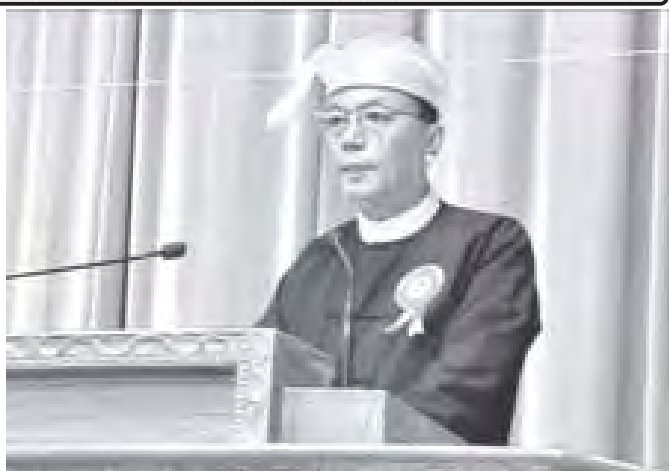
ပြည်ထောင်စုလွှတ်တော် နာယက ဦးခင်အောင်မြင့် အပြည်ပြည်ဆိုင်ရာ ဒီမိုကရေစီနေ့ ၂၀၁၁ အထိမ်းအမှတ်အခမ်းအနားတွင် မိန့်ခွန်းပြောကြားစဉ်။

လွှတ်တော်နှင့် အမျိုးသား လွှတ်တော်တို့မှ လွှတ်တော် ကိုယ်စားလှယ်များ၊ တိုင်းဒေသ ကြီး/ ပြည်နယ်လွှတ်တော် ဥက္ကဋ္ဌများ၊ ပြည်ထောင်စု သမ္မတမြန်မာနိုင်ငံတော်ဆိုင်ရာ သံတမန်များအဖွဲ့၊ နာယကနှင့် သံတမန်များ၊ ကုလသမဂ္ဂ လက်အောက်ခံ အဖွဲ့အစည်း များမှ ပုဂ္ဂိုလ်များ ၊ အစိုးရ မဟုတ်သော အဖွဲ့အစည်းများ၊