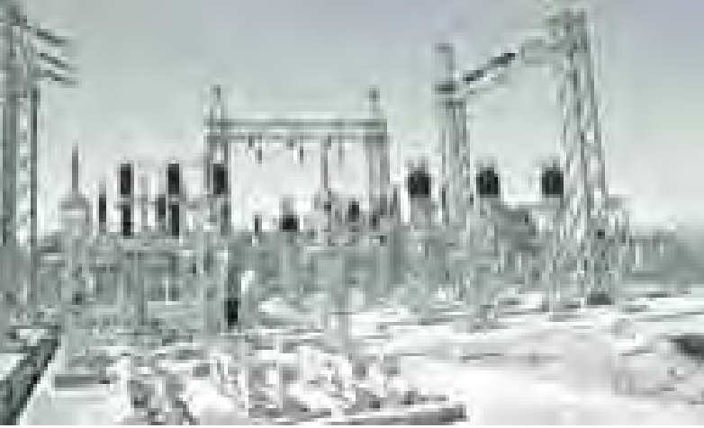
လူမှုရေး/စီးပွားရေးကြော်ငြာ

အတွက်လည်း ၂၄ နာရီ လျှပ်စစ်မီးရရှိရန် ဓာတ်တိုင်များ စိုက်ထူနိုင်ရန်နှင့် မီးကြိုး သွယ်တန်းမည့် လမ်းကြောင်းကို ဆောင်ရွက်နိုင် ရန်အတွက် ရှေ့ပြေးတိုင်းတာခြင်းလုပ်ငန်းများ ကို အောက်တိုဘာလအတွင်း ဆောင်ရွက်လျက်