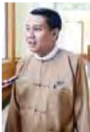
အမျိုးသားလွှတ်တော်ကိုယ်စား လှယ် ဒေါက်တာမြတ်ဉာစိုး။

ရေးဆွဲရန် ပြည်ထောင်စုအစိုးရ အား တိုက်တွန်းကြောင်း အဆို တင်သွင်းခဲ့သည်။ အဆိုကို အမျိုးသား လွှတ်တော်က လက်ခံဆွေးနွေးရန် သင့်တော်ကြောင်း ဆုံးဖြတ်ခဲ့သည်။