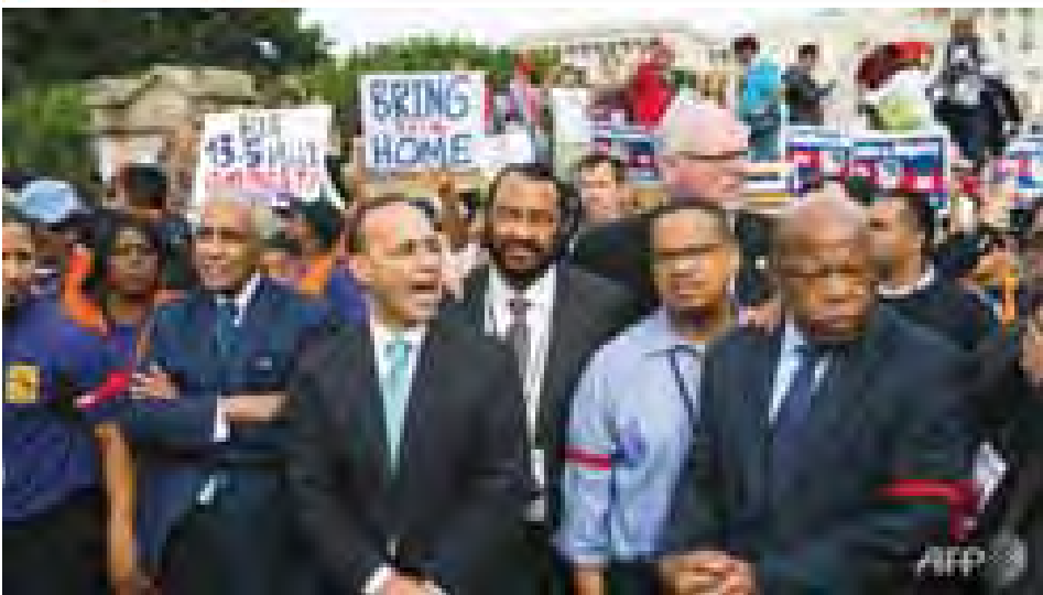
လူဝင်မှုကြီးကြပ်ရေးဥပဒေများအား ပြင်ဆင်ပြောင်းလဲရန် တောင်းဆိုသည့် ပြည်သူများနှင့်အတူ အမတ်များအား တွေ့ရစဉ်။