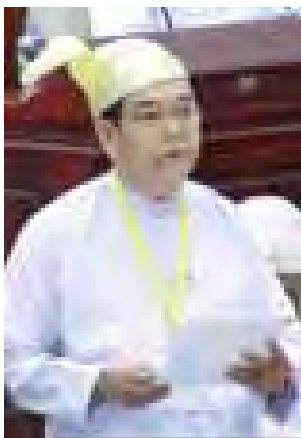
ဒုတိယဝန်ကြီး ဦးအုန်းသန်း ရှင်းလင်းဖြေကြားစဉ်။

နေပြည်တော် အောက်တိုဘာ ၉ ပြည်သူ့လွှတ်တော် အဌမပုံမှန် အစည်းအဝေးဆဌမနေ့ကို ယနေ့ နံနက်ပိုင်းကကျင်းပရာ ဟုမ္မလင်း မဲဆန္ဒနယ်မှ ဦးအေး၏ မြို့နယ် အဆင့်တာဝန်ရှိသူများက နည်းဥပဒေ အတိုင်း ဆောင်ရွက်ပေးနိုင်ရန် မြေလွတ်မြေရိုင်းစီမံခန့်ခွဲမှု ဗဟို ကော်မတီက မည်သို့ဆောင်ရွက်ပေး မည်ကို သိရှိလိုကြောင်း မေးခွန်းနှင့် စပ်လျဉ်း၍ လယ်ယာစိုက်ပျိုးရေးနှင့် ဆည်မြောင်းဝန်ကြီးဌာန ဒုတိယ ဝန်ကြီး ဦးအုန်းသန်းက နိုင်ငံတော် စီးပွား ဖွံ့ဖြိုးတိုးတက်ရေးအတွက် မြေလွတ်၊ မြေလပ်နှင့်မြေရိုင်းများကို ထိရောက်မှန်ကန်စွာ အသုံးချစီမံ ဆောင်ရွက်နိုင်ရန် လုပ်ပိုင်ခွင့်၊ အသုံး ပြုခွင့်နှင့်စပ်လျဉ်း၍ တင်ပြလာသည့် ကိစ္စရပ်များအတွက် စိစစ်သုံးသပ်ခြင်း