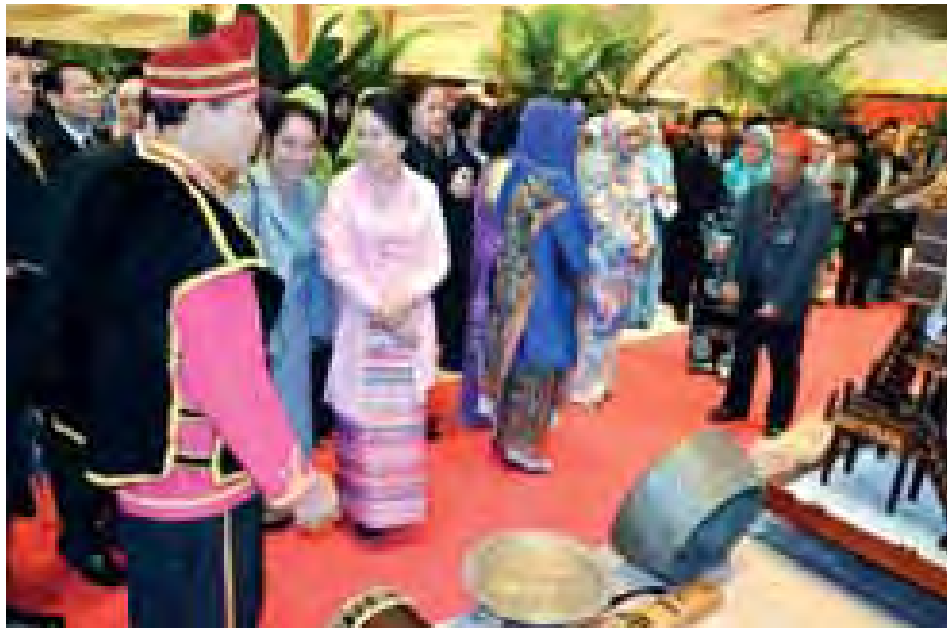
နိုင်ငံတော်သမ္မတ ဦးသိန်းစိန်၏ ဇနီး ဒေါ်ခင်ခင်ဝင်း ဘုရားခံဒါနုဆလမ်နိုင်ငံဆိုင်ရာ မြန်မာသံအမတ်ကြီးနှင့် သံရုံးဝန်ထမ်းများအား တွေ့ဆုံအမှာစကားပြောကြားရာတွင် ဇနီးကလေးကလေးတို့က ယာပုံများကို လှူဒါန်းကြည့်ရှုလေ့လာစဉ်။ (သတင်းစဉ်)