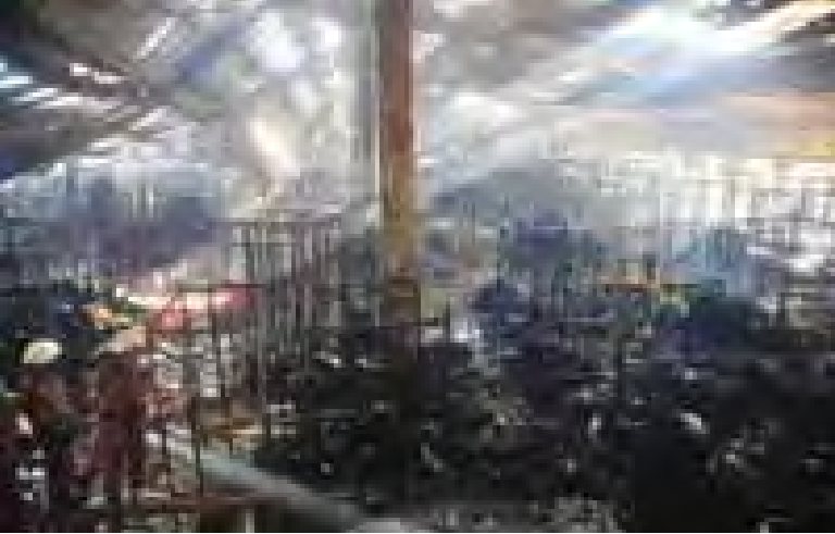
မီးလောင်မှုဖြစ်ပွားသော အထည်ချုပ်စက်ရုံ၏ အပျက်အစီးများကို တွေ့ရစဉ်။