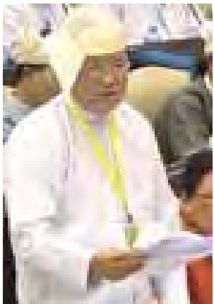
ဒုတိယဝန်ကြီး ဦးတင်ငွေ ရှင်းလင်းဖြေကြားစဉ်။

နေပြည်တော် အောက်တိုဘာ ၉ ပထမအကြိမ်အမျိုးသားလွှတ်တော် အဌမပုံမှန်အစည်းအဝေး ဆဌမနေ့ကို