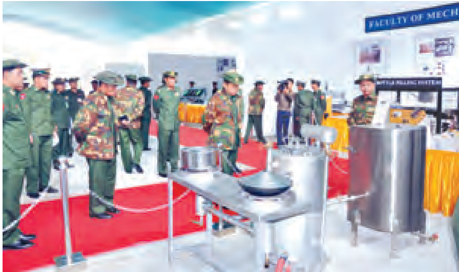
ခင်းကျင်းထားရှိမှု၊ Novelty Shoot သရုပ်ပြပစ်ခတ်မှုနှင့် ဆုချီးမြှင့်မည့် အစီအစဉ်များ၊ မိတာ ၁၀၀ ပစ္စုတိ

မွန်းလွဲပိုင်းတွင် ဒုတိယ တပ်မတော်ကာကွယ်ရေးဦးစီးချုပ် သည် တပ်မတော်စက်ပစ်ကွင်း (ပြင်ဦးလွင်) ၌ VIP Lounge