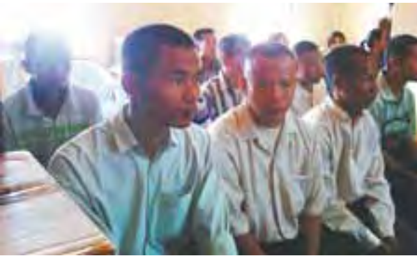
လားရှိုးအကျဉ်းထောင်မှ လွတ်ငြိမ်းခွင့်ရ အကျဉ်းသားများကို တွေ့ရစဉ်။

မသိကြသေးဘူး။ ကျွန်တော် ကိုယ်တိုင် ဒီနံနက်မှသိတာလေ။ ဘယ်သူမှ လာမကြိုပေမယ့်လည်း အိမ်ပြန်ဖို့ အတွက် စီစဉ်ပေးတဲ့ ထောင်မှူးကြီးနဲ့ ထောင်ကတာဝန်ရှိသူတွေက ပြန်နိုင်အောင် စီစဉ်ပေးမယ်လို့ ပြောထား