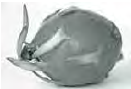
နဂါးမောက်သီး

နဂါးမောက်သီးကဲ့သို့ပင် အရသာရှိစွဲစားသုံးနိုင်ပြီး ကျန်းမာရေးအတွက် အထောက်အကူပြုသော သီးနှံနောက်ထပ်တစ်မျိုးမှာ ကြက်မောက်သီးဖြစ်သည်။ ကြက်မောက်သီးတစ်လုံးတွင် ပျမ်းမျှအားဖြင့် ကယ်လိုရီ ၆၀ ခန့် ပါဝင်ကြောင်း သိရှိရသည်။ ဗီတာမင်များစွာပါဝင်ပြီး