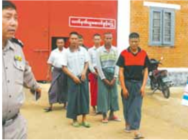
လားရှိုး အောက်တိုဘာ ၈

ပြည်ထောင်စုသမ္မတမြန်မာနိုင်ငံတော် နိုင်ငံတော်သမ္မတရုံး၏ အမိန့်အရ လားရှိုးအကျဉ်းထောင်မှ ပြစ်ဒဏ်ကျခံနေရသူ ၁၄ ဦးကို ကျင့်ထုံးဥပဒေပုဒ်မ ၄၀၁ အပိုဒ်ခွဲ(၁)အရ ယနေ့နံနက်ပိုင်းက လွတ်ငြိမ်းခွင့်ပြုလိုက်ကြောင်း အကျဉ်းဦးစီးဌာနမှ သိရသည်။ (အပေါ်ပုံ)