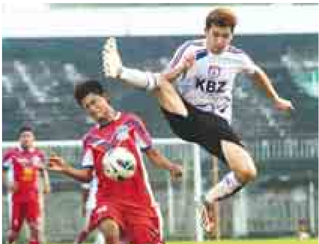
ကမ္ဘောဇအသင်းနှင့် ရတနာပုံအသင်းတို့ ယှဉ်ပြိုင်နေစဉ်။

၂၀၁၃ MNL Cup ဘောလုံးပြိုင်ပွဲ ပထမဆုံးပိုင်းပွဲစဉ်ကို ယနေ့ညနေ ၃ နာရီခွဲက အောင်ဆန်းကွင်း၌ ယှဉ်ပြိုင်ကစားရာ ကမ္ဘောဇအသင်းက ရတနာပုံအသင်းကို နှစ်ဂိုးပြတ်ဖြင့်အနိုင်ရရှိပြီး ဗိုလ်လုပွဲသို့တက်ရောက်သွားသည်။