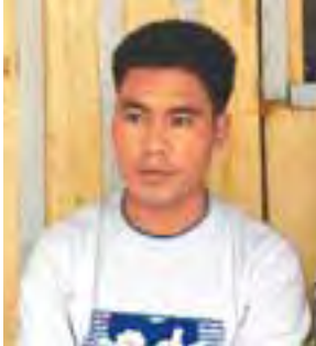
ထောင်းခေါင်

ဖြေ။ ။ ကျွန်တော် ဝမ်းလည်းဝမ်းသာပါတယ်။ မမျှော်လင့်ဘဲနဲ့ လွတ်ငြိမ်းခွင့်ရလို့ ဝမ်းသာပါတယ်။