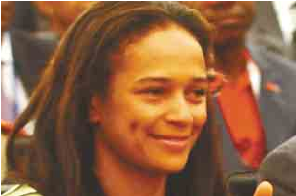
အင်ဂိုလာသမ္မတ၏ သမီး အစွဘယ် ဒေါ်ဆန်တို့စ်

ငှားထိုးဆေးကို ဘီလီယံနှင့်မလင် ဒါဂိတ်ဖောင်ဒေးရှင်း၏ ရန်ပုံငွေဖြင့် အကျိုးအမြတ်မယူဘဲ ထုတ်လုပ် လျက်ရှိသည်။ (ဘီဘီစီ)