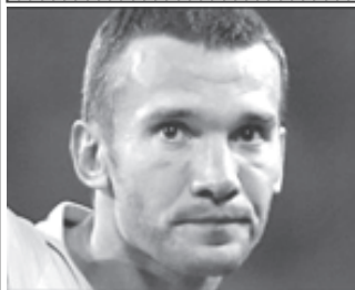
ချယ်လ်ဆီးတိုက်စစ်မှူး ရှက်မိချင်ကို။

ဝေလအသင်းသည် အောက်တိုဘာ ၇ရက်တွင် ဆလို ဗားကီးယားအသင်းနှင့် လည်းကောင်း၊ အောက်တိုဘာ ၁၁ရက်တွင် ဆိုက်ပရပ်စ်အသင်းနှင့်လည်းကောင်း ယှဉ်ပြိုင် ကစားရမည် ဖြစ်သည်။ (အင်တာနက်)