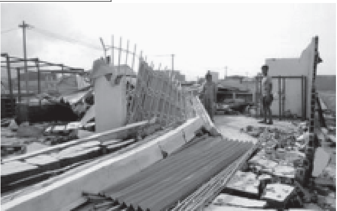
ဗီယက်နမ်တွင် ရန်ကုန်မြို့တိုင်းဝင်ရောက်တိုက်ခတ်မှုကြောင့် ပျက်စီးဆုံးရှုံးမှုများကို အောက်တိုဘာ ၁ ရက်က ဆွေ့ရစဉ်။ (စာတိုက်-အင်တာနက်)

ဂျပန်နိုင်ငံ ချီဘာမြို့တွင် ကျင်းပသည့် စက်ရုပ်ပြပွဲတွင် စက်ဘီးစီးနိုင်သည့် စက်ရုပ်တစ်ရုပ်အား အောက်တိုဘာ ၃ ရက်က ဆွေ့ရစဉ်။ (စာတိုက်-အင်တာနက်)