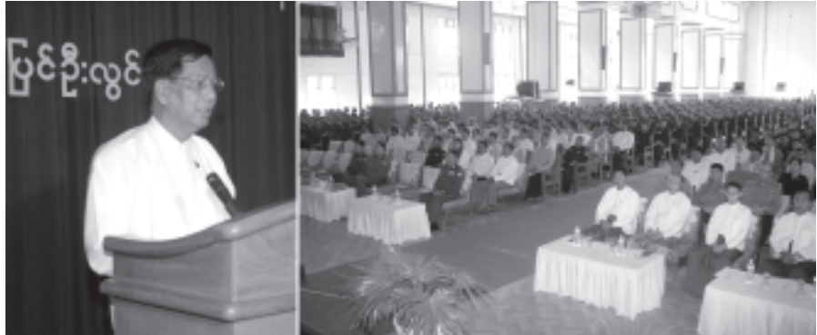
ပြင်ဦးလွင်

ချေဆက်လျှောက်လှမ်းရမည့် ခရီးလမ်းတစ်လျှောက်တွင် ယနေ့ဖြစ်ထွန်းနေသည့် အစဉ်အလာကောင်းနှင့်အညီ