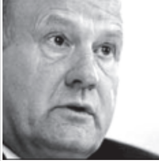
ဖြိုတော်ရုံမင်းကြီးဟောင်း လော့စတီဗင်။

ပရိယာလိဂ်ဘောလုံးသမားများ အပြောင်းအရွှေ့နှင့် ပတ်သက်ပြီး မသမာမှုများဖြစ်ပေါ်ခဲ့၍ ကစားသမား ၃၉ ဦးကို ပစ်မှတ်ထားလျက် စုံစမ်းစစ်ဆေးလျက်ရှိကြောင်း ဖြိုတော်ရုံမင်း ကြီးဟောင်း လော့စတီဗင်က ပြောကြား လိုက်သည်။