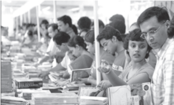
အိန္ဒိယနိုင်ငံ နယူးဒေလီမြို့တွင် ကျင်းပလျက်ရှိသည့် စာအုပ်ပွဲတော်တွင် စာပေဝါသနာရှင်များ လာရောက်ကြည့်ရှုနေသည်ကို စက်တင်ဘာ ၂၉ ရက်က ဆွေ့ရစဉ်။ (စာတိုက်-အင်တာနက်)