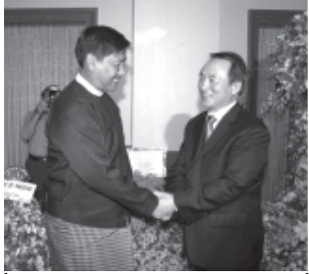
အောက်တိုဘာ ၃ ရက်က ကိုရီးယားသမ္မတနိုင်ငံ၏ အမျိုးသားနေ့နှင့် တပ်မတော်နေ့ အထိမ်းအမှတ် စည်ပင်ပွဲသို့ တက်ရောက်လာသော နိုင်ငံခြား ရေး ဝန်ကြီးဌာနမှ ဒုတိယဗိုလ်ကြီး ဦးကျော်သူအား ပြည်ထောင်စုမြန်မာ နိုင်ငံတော်ဆိုင်ရာ ကိုရီးယားသမ္မတနိုင်ငံ သံအမတ်ကြီး H.E Mr. Lee Ju-Heum က ကြိုဆိုနှုတ်ဆက်စဉ်။ (သတင်းစဉ်)

ဆက်သွယ်နိုင် သတင်းနှင့်စာမူများ ပေးပို့လိုလျှင် ရန်ကုန်မြို့ သိမ်ဖြူလမ်းရှိ ပုံနှိပ်ရေးနှင့် စာအုပ်ထုတ်ဝေရေးလုပ်ငန်း စိမ်းလဲ့ ရွှေပြည်ကုန်သွယ် ဖုန်း-၃၈၂၀၇၀ သို့ ဆက်သွယ်နိုင်ကြောင်း သတင်းရရှိ သည်။ (သတင်းစဉ်)