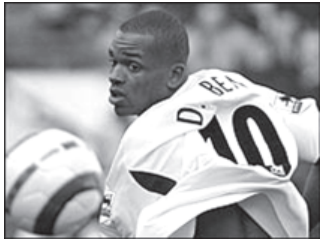
ချာလ်တန် တိုက်စစ်မှူး ဒါရင်ဘင်။

ယခင်က ဒါရင်ဘင်ကို အင်္ဂလန်ယူ ၂၁အောက် အသင်း၌ကစားရန် ခေါ်ယူထားသော်လည်း ယခုအခါ အသင်းကြီးတွင် လိုအပ်နေ၍ ပြန်ခေါ်ခြင်းဖြစ်သည်ဟု မက်ကလာရင်က ပြောကြားသည်။ အင်ဒရူးဂျွန်ဆင်သည် လက်ရှိအချိန်၌ ပရိယာလိဂ်