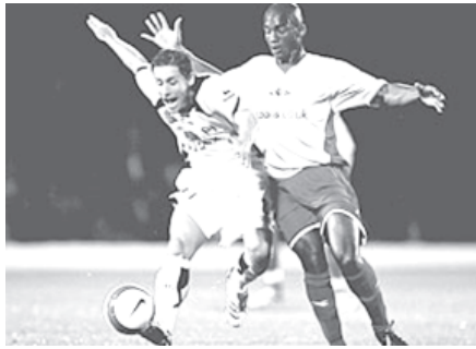
ဝက်ဖီးဒ်နှင့် ဖူလ်ဟမ်တို့ပွဲတွင် ဝက်ဖီးဒ်မှ ဖရင်စစ် (ယာ) ဟန့်တား စဉ်။

သို့သော်လည်း ပွဲချိန် ၈၉မိနစ်၌ ဝက်ဖီးဒ် ကွင်းလယ်ကစားသမား အက်ရီလေယောင်းက ချေပွဲကိုသွင်းယူနိုင်ခဲ့ သဖြင့် သုံးဂိုးစီ သရေပွဲဖြစ်ခဲ့ရခြင်းဖြစ်သည်။ ဖူလ်ဟမ်သည် ယခုပွဲ သရေပွဲဖြစ်ခဲ့သဖြင့် ခုနစ်ပွဲကစား နှစ်ပွဲနိုင်၊ သုံးပွဲရသေ၊ နှစ်ပွဲရှုံးဖြင့် ကိုးမှတ်ရရှိကာ တန်းစီဇယားအဆင့် ၁၁၌ ရှိနေသည်။ ဝက်ဖီးဒ်မှာ တန်းစီဇယားအဆင့် ၁၁၌ ရှိနေသည်။ (အင်တာနက်)