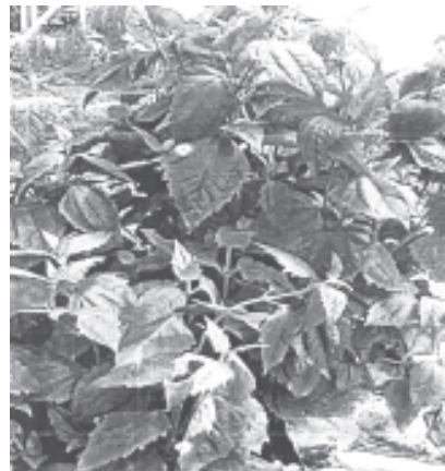
ပိစပ်ပင်(တောပိစပ်) ( Eupatorium odoratum Linn.)

ခြင်းမရှိပါ။ တိုင်းရင်းဆေးသမားတော်များအနေဖြင့် ယခုတင်ပြသော ပိစပ်ပင်ကိုလည်း တစ်မျိုးတည်းတိုက်ကျွေး အသုံးပြုခြင်းမှ ရောင်ကြည့်ကြပါသည်။ ပြင်ပလိမ်းဆေး၊ အနာကျက်ဆေးအဖြစ်သာ အသုံးပြုကြပါသည်။ သို့ဖြစ်၍ ပိစပ်ပင်သာမက မည်သည့်ဆေးပင်၊ ဆေးဝါးမဆို အများသူငါ ပြောရုံမျှဖြင့် သုံးစွဲခြင်းမပြုဘဲ ဆေးပင်ကို တစ်မျိုးတည်းသုံးစွဲမည်ဆိုပါက တတ်ကျွမ်းနားလည်သော တိုင်းရင်းဆေးသမားတော်များနှင့် တိုင်ပင်သုံးစွဲသင့်ပါကြောင်း အကြံပြုရသေးသလိုက်ရပါသည်။