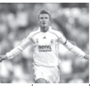
ရိုးရဲပက်ဒရစ်မှ ဒေးပစ်ဘက်ဂမ်း။

ဘက်ဂမ်းသည် ရိုးရဲပက်ဒရစ်သို့ ၂၀၀၃ ခုနှစ်က မန်ယူမှ ပြောင်းရွှေ့လာခဲ့သည်။ ၎င်းရောက်ရှိပြီးနောက် ရိုးရဲပက် ဒရစ်အသင်းသည် ဖလားတစ်လုံးမျှ ဆွတ်ခူးနိုင်ခြင်း မရှိချေ။ (အင်တာနက်)