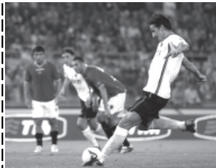
အင်တာမီလန်မှ အီဘရာဟင်မိုဗစ် ရိုးမားဘက်သို့ ရိုးသွင်းရန် ကြိုးစားခဲ့ပုံ။

တန်းတက်အသင်း အင်တာမီလန်အား အေစီမီလန်တို့ အိမ်ကွင်း၌ပင် ခက်ကဲခဲခဲ အနိုင်ယူခဲ့ရသည်။ အဆေး ကွင်းပြန်သော်လည်း အင်တာမီလန်တို့က ၃-၅-၂ ပုံစံဖြင့် ကစားခဲ့မှုကြောင့် အေစီမီလန်တိုက်စစ်ကို ကွင်းလယ်မှ ဟန့်တားနိုင်ခဲ့ရာ ပထမပိုင်းပွဲချိန်အတွင်း အေစီမီလန် တိုက်စစ်မှူးများဖြစ်သည့် အင်တာမီလန် ဘောလေဂိုတို့ ရိုးသွင်းခွင့်မရရှိခဲ့ချေ။