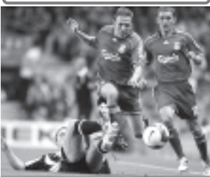
လီဇာမူးမှ ဘယ်လ်ဂျီယံ (လယ်) ၏ ထိုးဖောက် ကစားမှု။

နယူးကာဆယ် တိုက်စစ်မှ စာတင်နှင့် အမီယိုဘီတိုက လီဇာမူးနောက်တန်းကို ကျော်ဖြတ်ကာ ဂိုးသွင်းခွင့် ခြောက် ကြိမ်ခန့် ရရှိခဲ့သော်လည်း ဂိုးအဖြစ် မဖန်တီးနိုင်ခဲ့ချေ။ လီဇာမူး ယခုပွဲ အနိုင်ရရှိခဲ့သဖြင့် ငါးပွဲကစားနစ်ပွဲနိုင်၊ တစ်ပွဲသေချာနှစ်ပွဲပွဲဖြင့် တန်းစီယာအဆင့်ကိုးပွဲ ရပ်တည် နေသည်။ (အင်တာနက်)