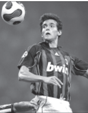
အေစီမီလန်မှ ကာတာနီ ကစားဟန်။

လန်ဒန် စက်တင်ဘာ ၂၁ ဖူလ်ဟမ်တိုက်စစ်မှူး လူးဝစ်ဘိုအာမော်တောသည် ကစားဖော် ဟယ်ဂျဆင်နှင့် ခေါင်းချင်းဆတ်မိ၍ ပါးရီးအက် သွားသဖြင့် ခြောက်ပတ် အနားယူရလိမ့်မည် ဖြစ်ကြောင်း ဖူလ်ဟမ်အသင်းက ပြောကြားလိုက်သည်။