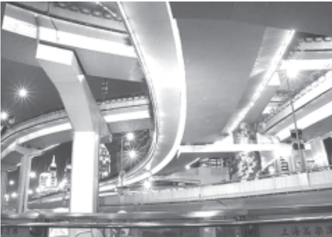
တရုတ်နိုင်ငံ ရှန်ဟိုင်းမြို့ရှိ တံတားတစ်စင်းကို စက်တင်ဘာ ၁၆ ရက်က တွေ့ရစဉ်။