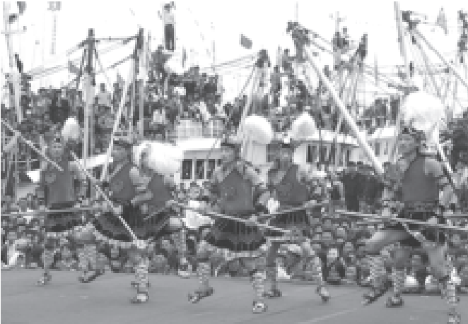
တရုတ်နိုင်ငံ ကျန်စုပြည်နယ်အရှေ့ဘက်ရှိ ရန်ကုန်ဆိပ်ကမ်း၌ ငါးဖမ်းခြင်း အထိမ်းအမှတ်ပွဲတော်တစ်ခု ကျင်းပနေသည်ကို စက်တင်ဘာ ၁၈ ရက်က တွေ့ရစဉ်။