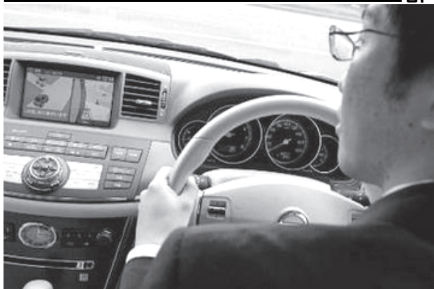
ဂျပန်နိုင်ငံ ယိုကိုဟားမားမြို့ရှိ နှစ်ဆန်းကုမ္ပဏီက ထုတ်လုပ်သည့် ယာဉ်အန္တရာယ်သိမြင်နိုင်သော ကိရိယာလေးတစ်ခု ဖော်တော်ဟာဉ်တွင် တပ်ဆင်ထားသည်ကို စက်တင်ဘာ ၁၅ရက်က တွေ့ရစဉ်။