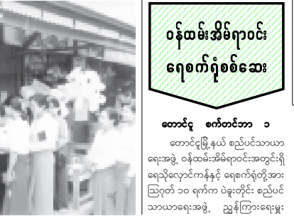
တောင်ငူ စက်တင်ဘာ ၁ တောင်ငူမြို့နယ် စည်ပင်သာယာရေးအဖွဲ့ ဝန်ထမ်းအိမ်ရာဝင်းအတွင်းရှိ ရေသိုလှောင်ကန်နှင့် ရေစက်ရုံတို့အား ဩဂုတ် ၁၀ ရက်က ပဲခူးတိုင်း စည်ပင်သာယာရေးအဖွဲ့ ညွှန်ကြားရေးမှူး