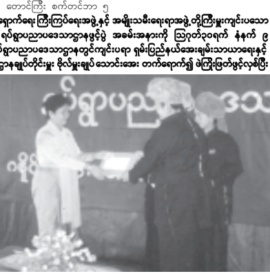
ရှမ်းပြည်နယ် မိခင်နှင့်ကလေးစောင့်ရှောက်ရေးကြီးကြပ်ရေးအဖွဲ့နှင့် အမျိုးသမီးရေးရာအဖွဲ့တို့ကြီးမှူးကျင်းပသော ကျောင်းကြီးရပ်ရွာကွက် ဂနိုင်းရေကျေးရွာ ရပ်ရွာပညာပဒေသာဌာနမှင့်ပွဲ အခမ်းအနားကို ဩဂုတ်၃၀ရက် နံနက် ၉ နာရီက တောင်ကြီးမြို့ ဂနိုင်းရေကျေးရွာ ရပ်ရွာပညာပဒေသာဌာနတွင်ကျင်းပရာ ရှမ်းပြည်နယ်အေးချမ်းသာယာရေးနှင့် ဖွံ့ဖြိုးရေး ကောင်စီဥက္ကဋ္ဌ အရှေ့ပိုင်းတိုင်းစစ်ဌာနချုပ်တိုင်းမှူး ဦးလှိုင်အောင်၊ ဝန်ကြီးရုံးချုပ်သောင်းအေး တက်ရောက်၍ ဖွင့်လှစ်ပွဲအမှာစကားပြောကြားသည်။