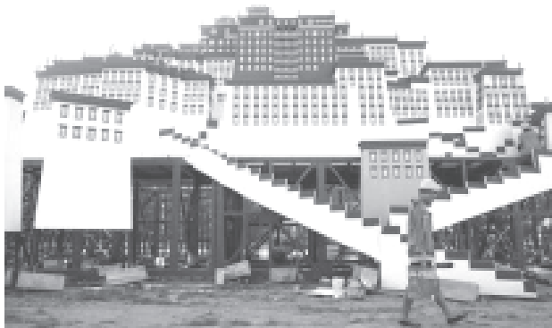
အောက်တိုဘာ ၁ ရက်နေ့၌ ကုရောက်မည့် တရုတ်နိုင်ငံ အမျိုးသားနေ့ အခမ်းအနားကျင်းပမည့် အဆောက်အအုံကို ပေးကမ်း၍ တိုင်အန်မင်ရင်မြို့တွင် ဆောက်လုပ်နေသည့်ကို စက်တင်ဘာ ၁၄ ရက်ကတွေ့ရပုံ။