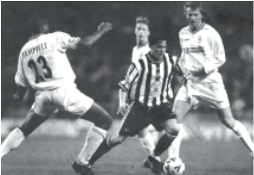
နယူးကာဆယ်နှင့်အက်စ်စီလီစာဒီရာတို့ ပွဲစဉ်၌ ဤလို အကြိတ်အနယ် ယှဉ်ပြိုင် ခဲ့ကြသည်။

ဝက်စ်ဟမ်းတို့ အိမ်ကွင်း၌ ပါလာမိုတို့ အနိုင်ရရှိရေး အစွမ်းကုန် ကြိုးစားခဲ့သော်လည်း အရာမထင်ခဲ့ချေ။