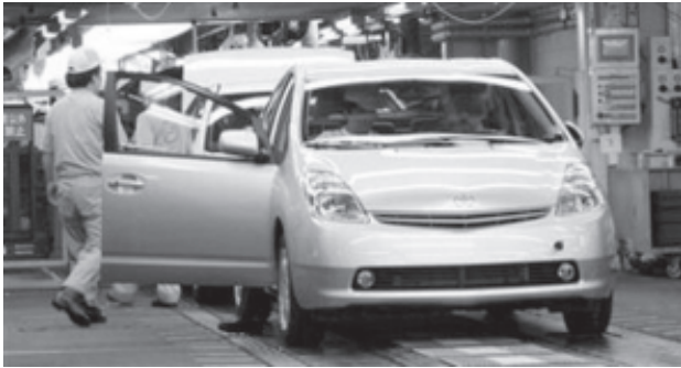
တက်ဆီဆွန်ဒီစယ်ဇောကြီးမြို့နယ်မြေကြောင့် ဂျပန်နိုင်ငံ တီဆွဆွမီကားထုတ်လုပ်ရေးစက်ရုံ၌ အခြားလောင်းစာ ခွမ်းအင်သုံး ဆီခင်ကားများ တိုးမြှင့်ထုတ်လုပ်နေသည်ကို စက်တင်ဘာ ၁၃ရက်က တွေ့ရစဉ်။