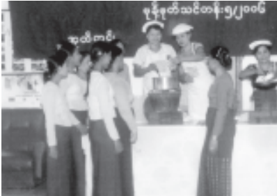
ပန်းအလှပြင်သင်တန်းဖွင့်ပွဲ ၅/၂၀၀၆