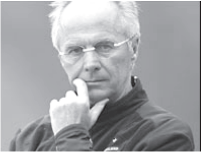
အင်္ဂလန်အသင်း နည်းပြ ဟောင်း အရပ်ဆင်။

အင်္ဂလန်အသင်းသည် အရပ်ဆင် နည်းပြအဖြစ် ဆောင်ရွက်ခဲ့စဉ်အတွင်း ကမ္ဘာ့လားနှင့် ယူရိုပြိုင်ပွဲများတွင် ကွာတားမိုင်နယ်ထက် ကျော်လွန်ခြင်းမရှိ ခဲ့ပေ။ မိမိအင်္ဂလန်အသင်းကို နည်းပြအဖြစ် တာဝန်ယူခဲ့စဉ်က ထောက်ခံအား ပေးမှု ကံမကောင်းခဲ့ကြောင်း အရပ်ဆင်က ပြောကြားသည်။ (အင်တာနက်)