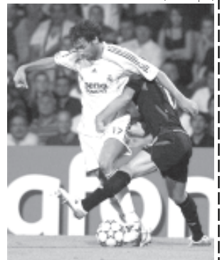
ရိုးရဲမကံဒရစ်တိုက်စစ်မှ နစ္စတယ်ရှိုင်း (၁) ၏ လိုင်ယွန်အသင်းဘက်သို့ ထိုးဖောက်ကစားမှုကို တွေ့ရစဉ်။