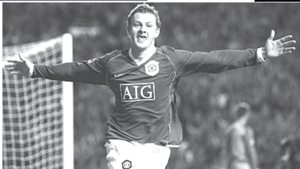
မန်ယူမှ ဆိုးလ်ရှား ဆဲလ်တစ်ဘက်သို့ ဂိုးသွင်းပြီးနောက် ဤသို့အောင်ပွဲခံခဲ့ရသည်။

ချန်ပီယံလိဂ်အုပ်စု(၄)၌ ပြင်သစ်ကလပ် လိုင်ယွန် က စပိန်ကလပ် ရိုးရဲမကံဒရစ်ကို အိမ်ကွင်း၌ နှစ်ဂိုး ပြတ်သွင်း အနိုင်ယူခဲ့သဖြင့် နားညံကြီး ရိုးရဲမကံဒရစ်တို့ ချန်ပီယံလိဂ်ကထွက်ခဲ့ပင် အဆုံးနိုင်ကြွေခဲ့ ကြောင်းလည်း သိရသည်။