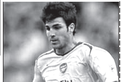
အာဆင်နယ်ကွင်းလယ်ကစားသမား ဟာရီဂတ်စ်။