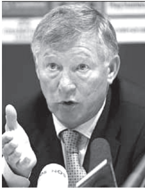
မန်ယူမန်နော့ ဆာအလက်ဇာက ဆဲလ်တစ်အသင်း နှင့် မကစားမီ သတင်းထောက်များအား ရှင်းလင်း ပြောကြားခဲ့စဉ်။

၂၀၀၄-၂၀၀၅ ရာသီက အေစီမီလန်ကို ရှုံးပြီး နောက်ဆုံး ၁၆ သင်းကိုပင် မကျော်နိုင်ဘဲရသည်။ မန်ယူတို့ ၂၀၀၂-၂၀၀၃ ရာသီမှစ၍ ကွာတားပိုင်နယ်သို့လည်း တက်ရောက်နိုင်ခြင်း မရှိခဲ့ပေ။ အထူးသဖြင့် ဂိုးများများ မသွင်းပေးနိုင်ခြင်းဖြစ်သည်။ သို့သော်လည်းမန်ယူတို့ ယခုနှစ်ရာသီတွင် ယခင်နှစ်ကနှင့်မတူဘဲ ကစားပုံအနေအထား အားလုံး ပြန်ကောင်းလာသည် အနေအထားရှိနေသည်။ မန်ယူတို့ ချန်ပီယံလိဂ်ဖလားရယူခဲ့သည့် ၁၉၉၉ခုနှစ်က ရိုးရဲ မကံဒရစ်သို့ ပြောင်းရွှေ့သွားသော နစ္စတယ်ရှိုင်းက ၄၃ ပွဲ ကစားရာတွင် ၃၅ ဂိုးသွင်းပေးနိုင်ခဲ့သည်။ (အင်တာနက်)