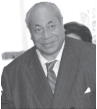
တွန်ဂါဘုရင် တော်ဖာအဟောတူပေါ