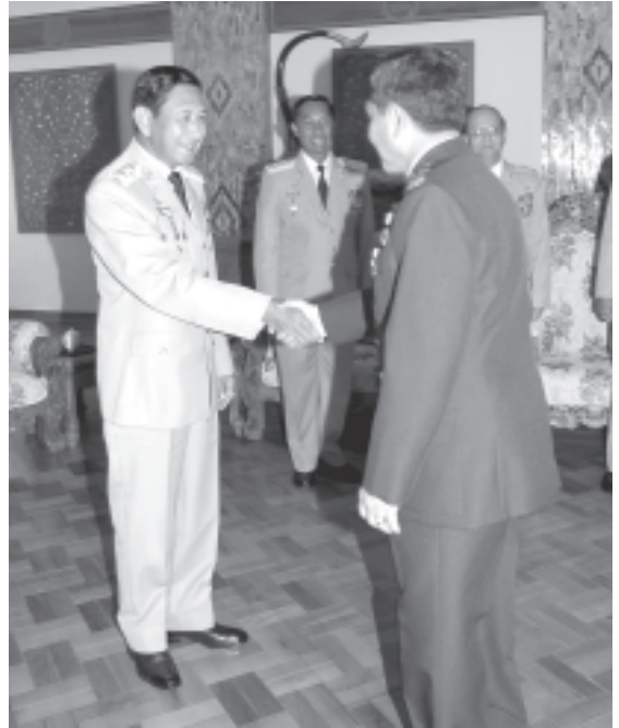
ပြည်ထောင်စုမြန်မာနိုင်ငံတော် နိုင်ငံတော်အေးချမ်းသာယာရေးနှင့် ဖွံ့ဖြိုးရေး ကောင်စီ ဒုတိယဥက္ကဋ္ဌ ဒုတိယတပ်မတော်ကာကွယ်ရေးဦးစီးချုပ် ကာကွယ်ရေးဦးစီးချုပ် (ကြည်း) ဒုတိယဗိုလ်ချုပ်မှူးကြီးမောင်အေး ထိုင်းနိုင်ငံ ထိုင်းဘုရင့်တပ်မတော် (ကြည်း)တပ် ဦးစီးချုပ် General, Sonthi Boonyaratglin အား နေပြည်တော်ရှိ ကာကွယ်ရေး ဝန်ကြီးဌာန ဘုရင့်နောင်ရိပ်သာ၌ ရင်းရင်းနှီးနှီးတိုင်ဆက်စဉ်။ (သတင်းစဉ်)

၁၃၆၈ ခုနှစ်၊ တော်သလင်းလပြည့်ကျော် ၇ ရက်၊ ၂၀၀၆ ခုနှစ်၊ စက်တင်ဘာ ၁၃ ရက်၊ ဗုဒ္ဓဟူးနေ့၊ အတွဲ(၄၅)၊ အမှတ်(၃၄၅)