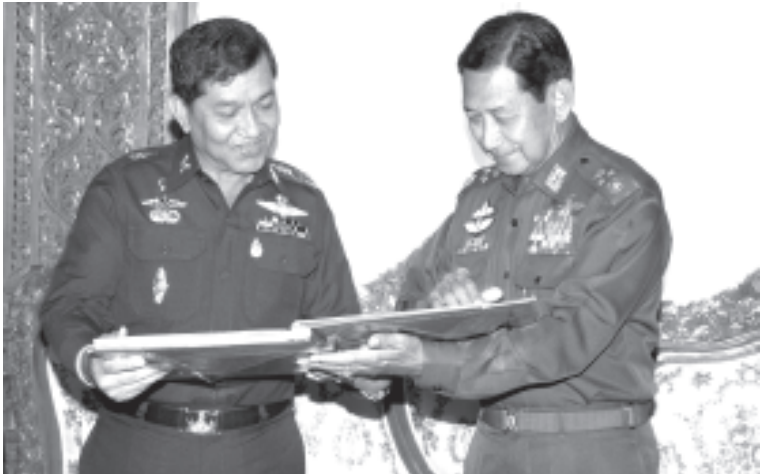
ပြည်ထောင်စုမြန်မာနိုင်ငံတော် နိုင်ငံတော်အေးချမ်းသာယာရေးနှင့် ဖွံ့ဖြိုးရေးကောင်စီဒုတိယဥက္ကဋ္ဌ ဒုတိယတပ်မတော်ကာကွယ်ရေး ဦးစီးချုပ် ကာကွယ်ရေးဦးစီးချုပ်ကြီး(ကြည်း) ဒုတိယဗိုလ်ချုပ်မှူးကြီးမောင်အေး ဧည့်သည်တော် ထိုင်းနိုင်ငံ ထိုင်းဘုရင့်တပ်မတော် ကြည်းတပ်ဦးစီးချုပ် General, Sonthi Boonyaratglin အား ချစ်ကြည်ရေးခရီးစဉ် မှတ်တမ်းတင်ဓာတ်ပုံအယ်လ်ဘမ်ကို လက်ဆောင်အဖြစ်ပေးအပ်စဉ်။ (သတင်းစဉ်)

ထို့နောက် ဧည့်သည်တော် ထိုင်းနိုင်ငံ ထိုင်းဘုရင့်တပ်မတော် ကြည်းတပ်ဦးစီးချုပ် General, Sonthi Boonyaratglin နှင့် ဇနီးတို့ဦးဆောင်သည့် ချစ်ကြည်ရေးကိုယ်စားလှယ် အဖွဲ့သည် အထူးလေယာဉ်ဖြင့် မန္တလေးမြို့သို့ ထွက်ခွာသွားကြရာ နိုင်ငံတော်အေးချမ်းသာယာရေး နှင့် ဖွံ့ဖြိုးရေးကောင်စီ ဒုတိယဥက္ကဋ္ဌ ဒုတိယတပ်မတော်ကာကွယ်ရေးဦးစီးချုပ် ကာကွယ်ရေးဦးစီးချုပ် (ကြည်း) ဒုတိယဗိုလ်ချုပ်မှူးကြီးမောင်အေးနှင့် ဇနီးတို့အား နိုင်ငံတော် အေးချမ်းသာယာရေး နှင့် ဖွံ့ဖြိုးရေးကောင်စီဝင် ကာကွယ်ရေးဝန်ကြီးဌာနမှ ဗိုလ်ချုပ်ကြီးသူရရွှေမန်းနှင့် ဇနီး ဒေါ်ခင်လေးသက်၊ ကာကွယ်ရေးဦးစီးချုပ်(ရေ) ဒုတိယဗိုလ်ချုပ်ကြီးစိုးသိန်း၊ ကာကွယ်ရေးဦးစီးချုပ် (လေ)ဒုတိယဗိုလ်ချုပ်ကြီး မြတ်ဟိန်း၊ တပ်မတော်စစ်ဘက်ရေးရာ လုံခြုံရေးအရာရှိချုပ် ဗိုလ်ချုပ်ရဲမြင့် နှင့် ၎င်းတို့၏ဇနီးများ၊ နေပြည်တော်တိုင်းစစ်ဌာနချုပ် တိုင်းမှူး ဗိုလ်မှူးချုပ်ဝေလွင်နှင့် ကာကွယ်ရေး ဝန်ကြီးဌာနမှ တပ်မတော်အရာရှိကြီးများ၊ တာဝန်ရှိသူများက နေပြည်တော်လေဆိပ်တွင် ပို့ဆောင် နှုတ်ဆက်ကြသည်။ (သတင်းစဉ်)