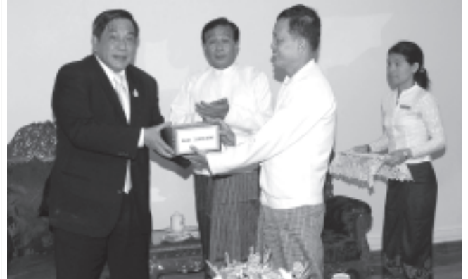
ထိုင်းနိုင်ငံသံအမတ်ကြီး H.E Mr. Suphot Dhirakaosal ပြည်ထောင်စုတိုင်းရင်းသားလူမျိုးများ ဖွံ့ဖြိုးရေးတက္ကသိုလ်သို့ ထိုင်းနိုင်ငံအစိုးရက လှူဒါန်းသည့် ထိုင်းဘတ်ငွေ သုံးသန်းကို ပါမောက္ခချုပ် ဦးစော်မင်းသိန်းထံ ပေးအပ်လှူဒါန်းစဉ်။ (သတင်းစဉ်)