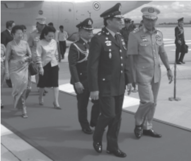
နေပြည်တော် စက်တင်ဘာ ၁၁

ပြည်ထောင်စုမြန်မာနိုင်ငံတော် နိုင်ငံတော်အေးချမ်းသာယာရေးနှင့် ဖွံ့ဖြိုးရေးကောင်စီ ဒုတိယဥက္ကဋ္ဌ ဒုတိယတပ်မတော်ကာကွယ်ရေးဦးစီးချုပ် ကာကွယ်ရေးဦးစီးချုပ်ကြည်း) ဒုတိယဗိုလ်ချုပ်မှူးကြီး မောင်အေး၏ ဖိတ်ကြားချက်အရ ထိုင်းနိုင်ငံ ထိုင်းဘုရင့်တပ်မတော် ကြည်းတပ်ဦးစီးချုပ် General, Sonthi Boonyaratglin နှင့်ဇနီးတို့ ဦးဆောင်သည့် ချစ်ကြည်ရေးကိုယ်စားလှယ်အဖွဲ့သည် ပြည်ထောင်စုမြန်မာနိုင်ငံတော်၌ ချစ်ကြည်ရေး ခရီးလည်ပတ်ရန် ယနေ့နံနက်ပိုင်းတွင် နေပြည်တော်သို့ ရောက်ရှိလာကြသည်။