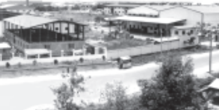
ထို့ကြောင့် ယနေ့မြန်မာ့စက်မှုလက်မှုကဏ္ဍသည် နိုင်ငံတော်၏ အားပေးမှုများကြောင့် ကိန်းဂဏန်းစာရင်းဇယားများအရရော မျက်မြင်အနေအထားအရပါရှေ့သို့ အရှိန်အဟုန်ဖြင့် တိုးတက် အောင်မြင်လျက်ရှိသည်မှာ အထင်အရှားပင် ဖြစ်သည်။

ပုဂ္ဂလိကပိုင်အပိုင်းတို့ပူးပေါင်း၍ မြန်မာ့စက်မှုကဏ္ဍ အမှန်တကယ် ဖွံ့ဖြိုးတိုးတက်အားကောင်းနေအောင် ဆက်လက် ကြိုးပမ်းသွားကြရမှာဖြစ်သည်။ နိုင်ငံတော်က အသေးစားစက်မှုလုပ်ငန်းများကို အလတ်စား၊ အလတ်စားများကို အကြီးစားအဆင့်အတိုင်း တက်လှမ်းထူထောင်ရန် ရည်မှန်းထားသည်။ အရေးအကြောင်းကြိုလျှင် ပြည်ပအပေါ် မှီခိုအားထား မနေရဘဲ မိမိခြေတောက်အပေါ် မိမိရပ်တည်နိုင်သည့် သွင်းကုန်အစားထိုး စက်မှုလုပ်ငန်းများ ပြည့်ပြည့်စုံစုံရှိရန် ဦးစားပေး ဆောင်ရွက်နေသည်ကိုသို့ နိုင်ငံခြားသုံးငွေ ရှာဖွေပေးနိုင်သည့် ပို့ကုန်စက်မှုလုပ်ငန်းများကိုလည်း အရင်းအနှီးနှင့် အတတ်ပညာအပေါ်မှီ၍ ထူထောင်လျက်ရှိသည်။ ဤသို့ဖြင့် အဆင့်မြင့်သစ်အချောထည် စက်ရုံများ၊ လုပ်ခစားအထည်ချုပ် စက်ရုံမျိုးစုံ၊ ခေတ်မီသစ်စက် ရက်ရုံများ၊ လယ်ယာသုံး စက်ကိရိယာစက်ရုံများ၊ ခေတ်မီချည်မျှင်နှင့်အထည်ချောစက်ရုံများ၊ စက္ကူစက်ရုံများ၊ ဆပ်ပြာစက်ရုံများ၊ ဆေးဝါးစက်ရုံများ၊ ဘီလပ်မြေစက်ရုံများ၊ အင်ဂျင်ဘလောက်တုံး စက်ရုံများ စသည်ဖြင့် ပေါ်ထွက်လာသည်။