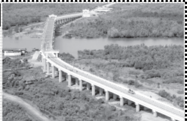
ဦးဇော်၏ နိုင်ငံတော်၏တိုင်းပြုပြည်ပြုသမိုင်းမှတ်တိုင်များ(၄) ဆောင်းပါး (စာ-၉)

❑ ပြည်ထောင်စုအရှေ့ဖျားမှ အနောက်ဖျား၊ မြောက်ဖျားမှ တောင်ဖျား ဒေါင်လိုက်ဖြစ်စေ၊ အလျား လိုက်ဖြစ်စေ သွားလမ်းသာ၍ လာလမ်းပြောင့်သည့် လမ်းပန်းဆက်သွယ်မှုကွန်ရက်ကြီး ချိတ်ဆက်ဖြစ်တည်လာ နေသည်မှာ ထင်ရှားသည့် သမိုင်းမှတ်တိုင်ပင်ဖြစ်။