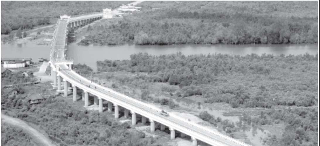
တိုင်းရင်းသားပြည်သူများအကြား ချစ်ကြည်ရင်းနှီးမှုနှင့် ကူးလူးဆက်သွယ်မှုကို တိုးတက်ဖော်ဆောင်နိုင်မည့် ရန်ကုန်-ကျောက်ဖြူလမ်းမကြီးပေါ်ရှိ မင်းကြောင်းတံတားကို ဤသို့ နံညားထည်ဝါစွာ တွေ့ရသည်။ (ဓာတ်ပုံမှတ်တမ်း-မြန်မာ့အလင်း)

ကုန်ထုတ်လုပ်မှုနှင့် ကုန်သွယ်မှုတိုးတက်မှုများပြားလာသည်နှင့်အမျှ ဒေသတစ်ခုနှင့်တစ်ခုအကြား ကူးသန်း သွားလာရောင်းဝယ်ဖောက်တားမှု အဆင်ပြေချောမွေ့အောင် စီမံခန့်ခွဲပေးလျက်ရှိသည်။