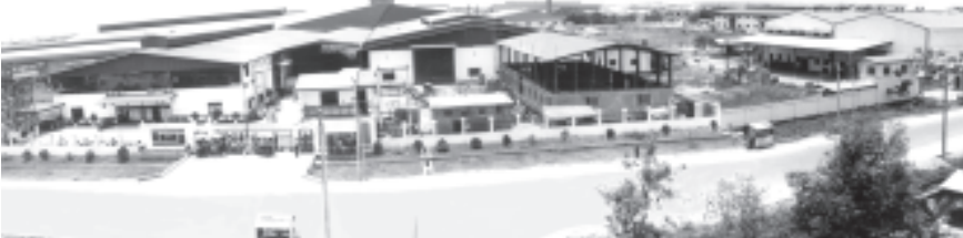
စက်မှုကဏ္ဍဖွံ့ဖြိုးတိုးတက်ရေး ဖော်ဆောင်ရာတွင် ရန်ကုန်တိုင်း လိုင်သာယာစက်မှုဇုန်လည်း တစ်တပ်တစ်အား ပါဝင်လျက်ရှိသည်။ (ဓာတ်ပုံမှတ်တမ်း-မြန်မာ့အလင်း)

နိုင်ငံတော်ကြီးကို ခေတ်မီဖွံ့ဖြိုးတိုးတက်သည့် လမ်းကြောင်း၊ အေးချမ်းတည်ငြိမ်သည့် လမ်းကြောင်းပေါ်သို့ နိုင်ငံခြားမြေရောက်ရှိအောင် အားကြီးမာနတက် လုပ်ကိုင်ဆောင်ရွက်လျက်ရှိရာ၌ ထူထောင်စရာ၊ ပြုပြင်စရာလုပ်ငန်းများသည် မကုန်ခန်းနိုင်အောင်ပင်ဖြစ်သည်။ နိုင်ငံရေး၊ စီးပွားရေး၊ စိုက်ပျိုးရေး၊ မြေယာရေး၊ စက်မှု၊ ပညာရေး၊ ကျန်းမာရေးစသည်ဖြင့် ကဏ္ဍစုံဘက်စုံ ဖွံ့ဖြိုးတိုးတက်အောင် တစ်ချိန်တည်း၊ တစ်ပြိုင်တည်း ပြုပြင်ပြောင်းလဲမှုများ ဖော်ဆောင်ပေးနေရပေသည်။ ခေတ်စနစ် ပြောင်းလဲတည်ဆောက်ရာ၌ မြေပြင်နိုင်အား၊ ဦးဆောင်နိုင်အားရှိသည့် ခေါင်းဆောင်မှုကောင်း လိုအပ်သည်မှာ မှန်သော်လည်း နိုင်ငံတော်အစိုးရ တစ်ဖွဲ့တည်းက ခိုင်ခံ့၍ အစစ ရုန်းကန်လုပ်ရားနေ၍ လည်း မဖြစ်နိုင်၊ ဦးစမ်းပုံထမ်း ခေတ်နာထားပြီး ဝိုင်းဝန်းလုပ်ကိုင်ကြရန် လိုအပ်သည်။ ညီညွတ်မှုရှိရန် လိုအပ်သည်။ တစ်ဦးနှင့်တစ်ဦးနားလည်မှု၊ စာနာမှုရှိရန် လိုအပ်သည်။ အပြန်အလှန်ပူးပေါင်းဆောင်ရွက်မှုဖြင့် သဟဇာတ ဖြစ်နေရန် အရေးကြီးသည်။