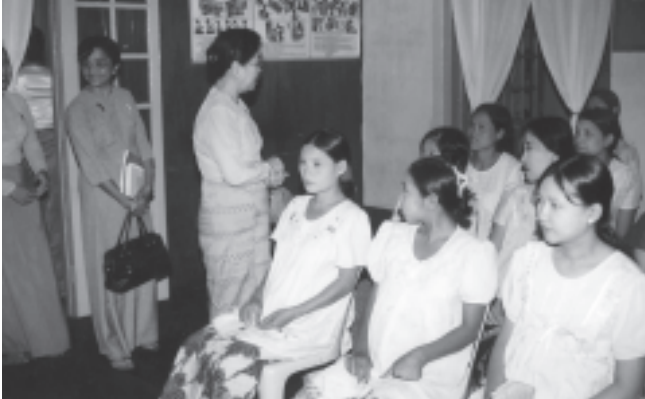
မြန်မာနိုင်ငံ မိခင်နှင့်ကလေးစောင့်ရှောက်ရေးအသင်း(ဗဟို)မှ ဒုတိယဥက္ကဋ္ဌနှင့် အဖွဲ့ဝင်များ ပုသိမ်မြို့နယ် မိခင်နှင့်ကလေးစောင့်ရှောက်ရေးအသင်းရုံးတွင် ကိုယ်ဝန်ဆောင်မိခင်များ၊ မွေးဖွားပြီး မိခင်များအား ကျန်းမာရေးဆိုင်ရာများ ဆွေးနွေးမှာကြားစဉ်။