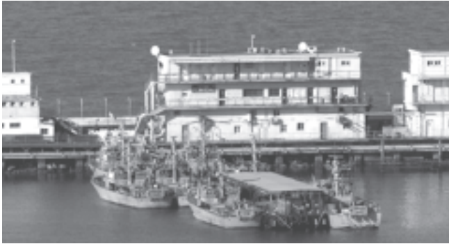
လက်ဘနွန်တောင်ပိုင်းမှ အစွရေတပ်ဖွဲ့ဝင်များ ရေကြောင်းမှ ပြန်လည်ရုပ်သိမ်းနေသည့်ကို အစွရေနိုင်ငံ မြောက်ပိုင်းရှိ ဟိုင်မာဆိပ်ကမ်း၌ စက်တင်ဘာ ၈ ရက်ကတွေ့ရစဉ်။