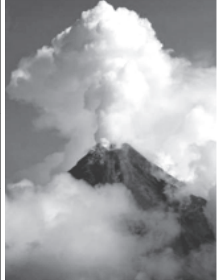
ဖိလစ်ပိုင်နိုင်ငံရှိ ပေါက်ကွဲလှန့်မှုဖြစ်ပေါ်သော မေယုနီမီးတောင်အား စက်တင်ဘာ ၉ ရက်က တွေ့ရစဉ်။