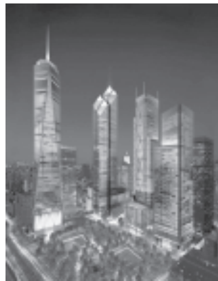
အသစ်ပြန်လည် တည်ဆောက်မည့် နယူးယောက် မြို့ရှိ ကမ္ဘာ့ကုန်သွယ်မှု အဆောက်အအုံ ပုံစံ(၁၅၆)ကို တွေ့ရစဉ်။

အဆိုရှားဆုံးမှာ အမေရိကန် အပါအဝင် ဥရောပ နိုင်ငံအများအပြား၌ အကြမ်းဖက်တိုက်ခိုက်မှုများ၊ ကြံ စည်အားထုတ်မှုများ ပိုမိုထူထပ်လာခြင်း ဖြစ်သည်။ ကမ္ဘာ တစ်ဝန်း ခရီးသွားများ လုံခြုံဘေးကင်းမှု အခြေအနေ