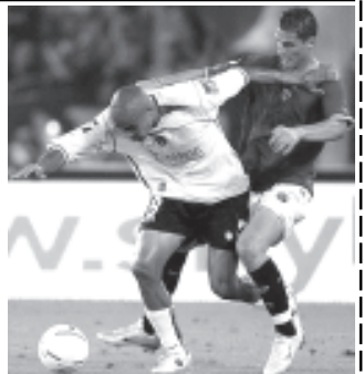
ရီးမားအတွက် ဂိုးသွင်းပေးသူ ရှိ.စီ(ယာ)နှင့် လီဗော်နိုမှ ဖီဒီယိုတို့ တောင်ပံရရှိရေး ဤသို့ ကြိုးစားခဲ့ကြသည်။

ချေပဂိုးသော ဖီအိုရင်းတီးနားကို အင်တာမီလန်တို့ သုံးဂိုးဆက်တိုက် သွင်းယူနိုင်ခဲ့ပြီးမှ ဖီအိုရင်းတီးနားတို့က နောက်မှလိုက်ကာချေပဂိုး နှစ်ဂိုးသာသွင်းယူနိုင်ခဲ့ခြင်းဖြစ်သည်။ အင်တာမီလန်အတွက် ဂိုးများကို ပွဲချိန် ၁၁ မိနစ်၊ ပွဲချိန် ၄၂ မိနစ်တို့၌ ကမ်ဘီယာဆိုကာ တစ်ဦးတည်း နှစ်ဂိုးဆက်တိုက်သွင်းယူခဲ့သည်။ တတိယပိုင်းကို အီဘရာဟင် မိုဗီဇက ပွဲချိန် ၆၁မိနစ်၌ သွင်းယူခဲ့ခြင်းဖြစ်သည်။