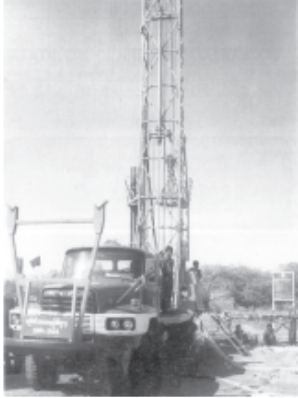
ကျေးလက်နေ ပြည်သူများ သောက်သုံးရေရရှိရေးအတွက် စည်ပင်သာယာရေးဦးစီးဌာနက မကွေးတိုင်း ချောက်မြို့နယ် ပြည်ပင်ကျေးရွာ၌ စက်ရေတွင်းတူးဖော်၍ ဤသို့ ပြည့်ဆည်းပေးခဲ့သည်။

နိုင်သော အရိပ်ရပင်ကိုရော၊ အရိပ်လည်းရ၊ ဝင်ငွေလည်း တိုးပွားနိုင်သည့် အပင်များကိုပါ ကြိုးကြိုးစားစားစိုက်ပျိုးရန် တွန်းအားပေးသည်။ ရေဝေရေလဲဒေသများနှင့် တောင်ကတိုးများ၌ သစ်ပင်များကို တာဝန်ကျေပွန်စွာ စိုက်ပေးပါက အားမလိုအားမရ ဖြစ်လေ့ရှိသည်။ စိမ်းလန်းစိုပြည်နေပါက ဝမ်းသာပီတိဖြစ်သည်။ စိမ်းလန်းစိုပြည်ရေး၊ ရေဓာတ်ရရှိရေးအတွက် စေတနာထားရှိပုံကို ပြန်လည်မြင်ယောင်မိသည်။ မြင်းခြံခရိုင် တောင်သာမြို့နယ် တောင်သာချောင်းပေါ်၌ ဆည်တည်ရန် စီစဉ်ခဲ့စဉ်က ဖြစ်သည်။ တာဝန်ရှိသူများက ဆည်တည်ပြီး ရေလောင်းပါက ဆပ်ပြာရေပေါက်ခြေရှိကြောင်း တင်ပြကြရာ နိုင်ငံတော်အကြီးအကဲက