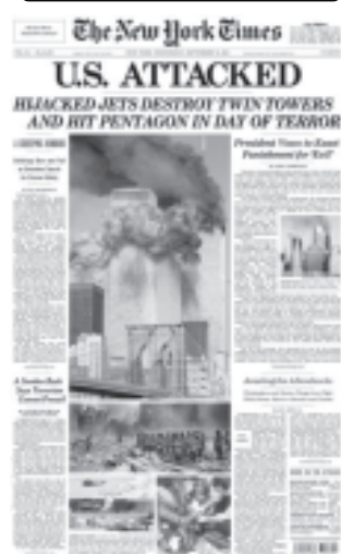
၉/၁၁ တိုက်ခိုက်ခံရမှုနှင့် ပတ်သက်၍ နယူး ယောက်မြို့ သတင်းစာတို့၌ ဤသို့ဖော်ပြခဲ့သည်။

နိမ့်ကျလျက်ရှိရာ လက်ရှိအချိန်၌ လေယာဉ်ဖြင့် ခရီးသွား ခြင်းသည် ဘေးအန္တရာယ်အရှိဆုံးဟု ခရီးသွားများက ခံယူထားကြောင်း အမေရိကန်ခရီးသွားအေဂျင်စီများ၏ လေ့လာချက်စစ်တမ်းကို အမေရိကန်မီဒီယာများက ဖော်ပြ ထားသည်။