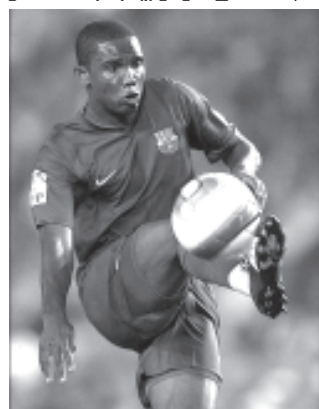
ဘာစီလိုနာအတွက် နှစ်ဂိုးသွင်းပေးသည့် တိုက်စစ်မှူး အီတိုး၏ ကစားဟန်။ (ဓာတ်ပုံ-အင်တာနက်)

အက်သလက်တီကိုတို့က အိမ်ကွင်း၌ ချေပဂိုးရရှိရေး နှင့်အနိုင်ရိုးများသွင်းယူနိုင်ရေးအတွက် တွန်းတွန်းတိုက်တိုက် တုံ့ပြန်ကစားခဲ့ရာတွင် အက်သလက်တီကို တိုက်စစ်မှူး တောရက်စ် ၇၆မိနစ်၌ အနိုင်ကံပြု အထုတ်ခံခဲ့ရသဖြင့် ၁၀ဦးတည်းနှင့် ကစားခဲ့ရသည်။ ပွဲချိန်ပြည့်သည့်အထိ အက်သလက်တီကိုတို့က ချေပဂိုးမသွင်းနိုင်သလို ပလင်စီယာတို့ကလည်းထပ်မံဂိုးမသွင်းနိုင်သဖြင့် တစ်ဂိုး-ဂိုးမရှိ ဖြစ်ပေါ်လာပြီးအနိုင်ရရှိခဲ့ခြင်းဖြစ်သည်။ (အင်တာနက်)