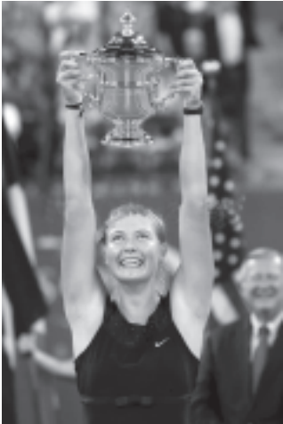
ယူအက်စ်အိုပင်းပေးလေးကို ကိုင်မြှောက်အောင်ပွဲခံနေသော မာရီယာရှာရာပိုဗာ

ရုရှားတင်းနစ်မယ် မာရီယာရှာရာပိုဗာသည် ယူအက်စ်အိုပင်း အမျိုးသမီးတင်းနစ်ပြိုင်ပွဲ တစ်ဦးချင်း ပြိုင်ပွဲဆုပေးလေးကြီးကို ဘယ်လ်ဂျီယံနိုင်ငံသို့ ဂျူစတင်