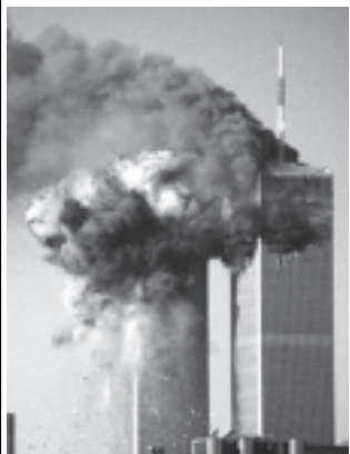
နယူးယောက်မြို့ရှိ ကမ္ဘာ့ကုန်သွယ်မှု ဗဟိုဌာန အဆောက်အအုံကို လေယာဉ်ဖြင့် ဝင်တိုက်ခဲ့ပြီး မီးလောင်နေသည့်ကို ၂၀၀၁ ခုနှစ် စက်တင်ဘာ ၁၁ရက်က တွေ့ရစဉ်။

ယခုလ စက်တင်ဘာ ၁၁ရက်မတိုင်မီ ငါးရက် အလိုကပင် အယ်ဂျစ်ရာရပ်မြင်သံကြားသတင်းဌာနက နယူးယောက်ရှိ ကမ္ဘာ့ကုန်သွယ်မှု အဆောက်အအုံကို ခရီးသည် လေယာဉ်များဖြင့် ဝင်တိုက်ခဲ့သည့် ဗီဒီယို တိပ်ခွေကို ထုတ်လွှင့်ပြသလျက် ရှိသည်။ ၎င်းဗီဒီယို တိပ်ခွေ၌ တိုက်ခိုက်မှုကို ကြိုတင်ပြင်ဆင်ခဲ့ပုံများနှင့် အကြိမ်ကြိမ်ဆွေးနွေးခဲ့ပုံများကို ချက်ချင်း အဝတ် အနက်စည်းထားသူများက ပြုလုပ်နေပုံများနှင့် ခရီး သည်လေယာဉ်များကို အပိုင်မီးဖြင့် ဝင်တိုက်ခဲ့ပုံများကို မြင်တွေ့ခဲ့ရသည်။