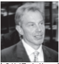
ဗြိတိန်ဝန်ကြီးချုပ် တို့နီဘလဲ

စစ်ကိုင်းတောင်ရိုး သီတဂူကမ္ဘာ့ဗုဒ္ဓတက္ကသိုလ်၏ အဓိပတိ အဂ္ဂမဟာပဏ္ဍိတ သီတဂူဆရာတော် အရှင်ဉာဏိဿရ (D.Litt, Ph.D)သည် စက်တင်ဘာ၉ရက်(ဓမ္မနေ့)ည၇နာရီ တွင် ကျောက်ပန်းတောင်းမြို့ သာသနာဗိမာန်တော်ကြီး သီတဂူ ဓမ္မပလ္လင်၌ တရားတော်များကို ဟောကြားတော်မူမည်ဖြစ် သည်။ (သတင်းစဉ်)