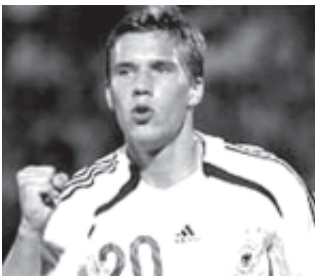
ဂျာမနီတိုက်စစ်မှူး ပိုဒေါစက်။

ဂျာမနီအသင်းသည် ဆန်မာရီနိုအသင်းကို တစ်ဖက် သတ် စိတ်ကြိုက်ကစားခဲ့ရာ ဂျာမနီတိုက်စစ်မှူး ပိုဒေါ