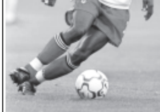
မန်ယူတိုက်စစ်မှူး လူးဝစ်ဆာဟာ

သို့သော် ပြီးခဲ့သည့်ပရီမီယာလိဂ်တွင် မန်ယူကွင်း၌ စပါးတို့တစ်ပွဲစီ သရေဖြစ်အောင် ကြိုးစားပမ်းစားကစားခဲ့သည့်ကိုလည်း မမေ့အပ်ရ။ စပါးတို့က အဆုံးကွင်း၌ ရလဒ်ကောင်းအောင် ကစားမည်သာ ဖြစ်သည်။ စပါးတွင် လီဗာပူးဆန်မှ ပြောင်းလာသော ဘာဘာ