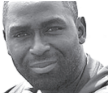
မန်စီးတီးတိုက်စစ်မှူး အင်ဒီကိုးလ်။

အင်္ဂလန်တိုက်စစ်မှူး ဟောင်း ကိုးလ်သည် ဩဂုတ်လက ပြောင်းရွှေ့ကြွေး ပေါင်ငါးသိန်းဖြင့် ပိုစီမောက်သို့ လာရောက်ဆက်သွယ်ထားသည်။