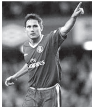
ချယ်လ်ဆီးကွင်းလယ်ကစားသမား လမ်းပတ်

သို့သော် အီဗာတန်၏ ယခုနှစ် ခြေစွမ်းကား ကောင်းနေသည်။ ဓရာချီတယ်လီပလေမှ ပေါင် ၈ ဒသမဒေသန်းဖြင့် ပြောင်းလာသည့် အန်ဒရူးဆန်က ပွဲတိုင်း