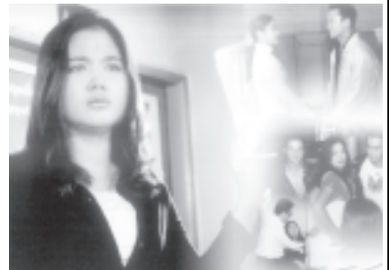
မြန်မာ့မီဒီယိုဇာတ်ကားများ

တနင်္ဂနွေ-မြင့်မြို့မရဲ့တွင် ဘော်ဘီဒီးလ်၊ အမေရိကသား၊ ကာကွယ်ရေးဝန်ထမ်း ဆင်း၊ဆေးပိတ်ဝင်ထားသော Dosti အိန္ဒိယဓာတ်ကား ရုံဝင်လာသည်။ အထူးချော့ချော့ တာလ်လ်းခါးခါး၊ ဆူဆူ၊ဇေဒေါ့ အင်္ကျီကပ်ဝတ်ထား တို့ပိတ်ဝင်ထားသော သုံးယူဆိုင်အချစ် ဓာတ်ကားမှ Hum Dill De Chuke Sanam ဓာတ်ကား ပြသနေသည်။ ရွှေရုပ်ရံမြေညီထပ်တွင် ခေါင်းသား၊ မိခင်နဲ့ချောက်ရာဇာတ် ခေါင်းဆောင် ပိတ်ဝင်တို့က လူတို့က ချောက်ကား ရွေးလွှဲတို့က လူတို့သို့ ရန်သူ တစ်ယောက်ကိုတစ်ယောက် လိုက်လံ ကန့်သတ်နေသည့် Jodidar ဓာတ် ကားပြသချော့ ဧကန်ရုံအပေါ်ထပ် တွင် Iron Eagle IIIအင်္ကျီဓာတ် ကားပြသနေသည်။