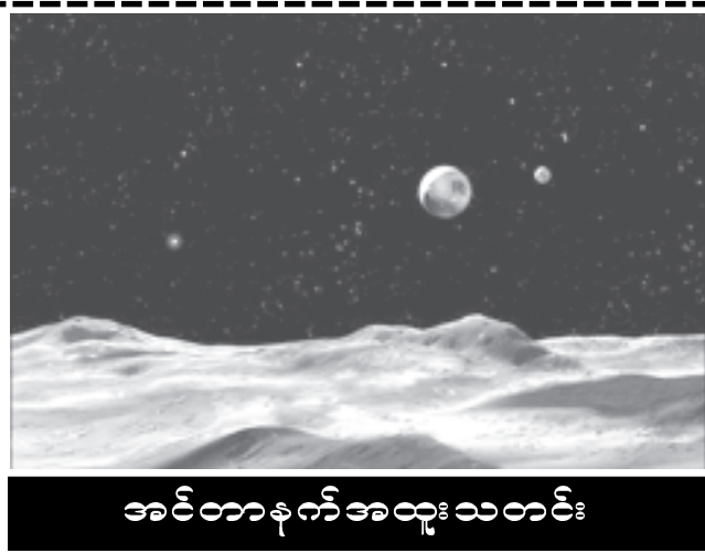
အင်တာနက် အလင်း သတင်း