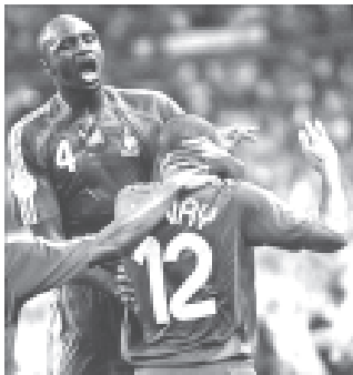
ပြင်သစ်က အီတလီကိုအနိုင်ရရှိခဲ့သဖြင့် ဗီအယ်ရာနှင့် အွန်နရီတို့ အောင်ပွဲခံနေစဉ်။

အီတလီအသင်းတွင် ဘက်ဖွန်း၊ ဇေဘရောတာ၊ ကာနောဗာဂီ၊ ဘာဇာလီ၊ ဒရီဆို၊ ဆမ်မြူလီ(မီချီလီ)၊ ပီရာဂို၊ ဂတ်တူဆို၊ ပါရောတာ၊ ကာတီဆာနို (အင်ဇာဂီ)၊ ဂီလာဒီနို (ဒီရိုစီ)စသည်တို့ ပါဝင်ကစားသွားသည်။ (အင်တာနက်)