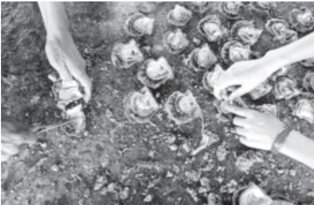
တရုတ်နိုင်ငံ ဟိုင်နန်ပြည်နယ် ဆမ်ယာမြို့တွင် မုတ်ကောင်များမှ ပုလဲထုတ်ယူနေသည်ကို စက်တင်ဘာ ၄ ရက်က တွေ့ရစဉ်။