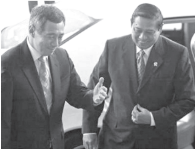
စင်ကာပူနိုင်ငံသို့ အလည်အပတ်ရောက်ရှိနေသော အင်ဒိုနီးရှားသမ္မတ ဆူဆီလိုဘန်ဘန်းယုဒိုယိုနှင့် စင်ကာပူ ဝန်ကြီးချုပ် လီရှင်လွန်းတို့အား စက်တင်ဘာ ၄ ရက်က တွေ့ရစဉ်။