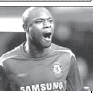
ချယ်လ်ဆီးမှ အာဆင်နယ်သို့ ရောက်လာသော ဝီလျံဂါးလက်စ်

လန်ဒန် စက်တင်ဘာ ၆ ဝီလျံဂါးလက်စ်သည် ယခုနှစ် ပရီမီယာလိဂ်အဖွင့် ချယ်လ်ဆီးနှင့် မန်စီးစီးအသင်းတို့ ယှဉ်ပြိုင်ကစားရာတွင် ချယ်လ်ဆီးက ပါဝင်ကစားရန်ရွေးချယ်ခဲ့ရာ ကိုယ့်ဂိုးကိုယ် ပြန်သွင်းရန်ကြိုးစားသူဖြစ်ခဲ့ကြောင်း ချယ်လ်ဆီးအသင်းက စွပ်စွဲပြောကြားလိုက်သည်။ ဝီလျံဂါးလက်စ်သည် အာဆင်နယ်သို့ ပြောင်းရွှေ့သွားပြီ ဖြစ်သည်။ ချယ်လ်ဆီးအသင်းအတွက် တစ်ဖန်ကစားခွင့်ရလျှင် ထိုစွပ်စွဲချက်များကို ချေဖျက်လိမ့်မည်ဖြစ်ကြောင်း အသက် ၂၉နှစ်ရှိ ပြင်သစ်နောက်တန်းကစားသမား ဂါးလက်စ်က ပြောကြားသည်။ ချယ်လ်ဆီးက ယင်းကဲ့သို့ စွပ်စွဲပြောဆိုချက်များမှာ အဓိပ္ပာယ်လွှဲလှဲမိကြောင်း ချယ်လ်ဆီးအသင်း၏ ခြေတင် ချက်ကို တုံ့ပြန်လျက် ဂါးလက်စ်က ပြောကြားသည်။ ချယ်လ်ဆီးအသင်းတွင် တစ်ဖန်ပြန်လည်ကစားခွင့်ရလျှင် မည်သည့်အခါမျှ ကိုယ့်ဂိုးကိုယ်ပြန်သွင်းလိမ့်မည် မဟုတ်ကြောင်း ၎င်းက ဆက်လက်ပြောကြားသည်။ ဂါးလက်စ်သည် ချယ်လ်ဆီးအသင်း၏ ရာသီကြို အမေရိကစာရင်းစဉ်တွင် လေ့ကျင့်ရေးကွင်းသို့ အချိန်မီပြန်လာရန် ပျက်ကွက်ခဲ့သဖြင့် နည်းပြမော်ရင်ဟို၏ အပြင်းအထန်ဝေဖန်မှုကို ခံခဲ့ရသည်။ (အင်တာနက်)