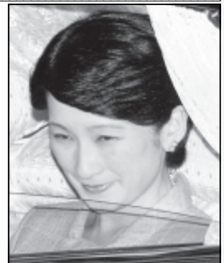
အင်တာနက်အထူးသတင်း

အသက် ၃၉ နှစ်အရွယ် မင်းသမီး ကိုကို(ယာနို)သည် သားယောက်ျားလေးကို မွက်ခွဲမွေးဖွားခဲ့ခြင်းဖြစ်ပြီး ကလေးငယ်သည် ဂျပန်ထီးနန်းကို ဆက်လက်စိုးစံနိုင်မည့်သူ ဖြစ်လာမည်ဖြစ်သည်။ (ကိုးကား-အင်တာနက်)