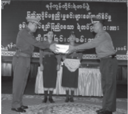
ရန်ကုန်တိုင်းရဲတပ်ဖွဲ့မှ ရဲတပ်ဖွဲ့ဝင်များကို ဂုဏ်ပြုဆုတောင်းပန်သည့်အခါ

ပစ္စည်းလေးမျိုးကို လည်းကောင်း၊ အလုံရဲစခန်း (၁) ၁၇၁/၂၀၀၆ ပြစ်မှုပုဒ်မ ၃၈၀ အမှုမှ တန်ဖိုးငွေကျပ် ၁၀ သိန်းရှိ ကောဘယ်ကြိုးပေ ၃၀ ကိုလည်းကောင်း၊ ဗဟန်းရဲစခန်း(၁)၄၁၃/၂၀၀၆ ပြစ်မှုပုဒ်မ ၃၈၀/၅၄ အမှုမှ ရေဖော်တာ ၁၁ လုံးကို လည်းကောင်း၊ မရမ်းကုန်း ရဲစခန်း (၁) ၄၂၀/၂၀၀၆ ပြည်သူပိုင်ပစ္စည်း (၆) ၁အမှုမှ တန်ဖိုးငွေကျပ် ၁၅၄၀၀၀၀ ရှိသည့် ထရပ်စပေါက်မာဆီ ၃၁၅ လီတာကိုလည်းကောင်း၊ သန်လျင်ရဲစခန်း(၁) ၅၁၆/၂၀၀၆ ပြည်သူပိုင်ပစ္စည်း (၆) ၁အမှုမှ တန်ဖိုး