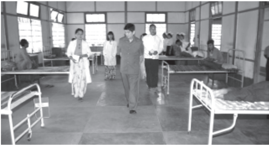
နေပြည်တော် စက်တင်ဘာ ၆

စစ်ကိုင်းတိုင်း အေးချမ်းသာယာရေးနှင့် ဖွံ့ဖြိုးရေးကောင်စီ ဥက္ကဋ္ဌ အနောက်မြောက်တိုင်းစစ်ဌာနချုပ် တိုင်းမှူး ဗိုလ်ချုပ်သာအေးသည် ဌာနဆိုင်ရာ တာဝန်ရှိသူများနှင့်အတူ ဩဂုတ် ၃၀ ရက် မွန်းလွဲပိုင်းက ဝန်းသိုမြို့ နယ်မြေခံတပ်ရင်း၌ ကျင်းပသည့် ခြံစည်းရိုးကြက်ဆူစိုက်ပျိုးပွဲသို့ တက်ရောက်၍ ခြံစည်းရိုးကြက်ဆူ စိုက်ပျိုးပေးပြီး တက်ရောက်လာကြသည့် အရာရှိ၊ စစ်သည်မိသားစုဝင်များ၏ ခြံစည်းရိုးကြက်ဆူပင် ၃၅၀ စိုက်ပျိုးနေမှုကို ကြည့်ရှုအားပေးသည်။