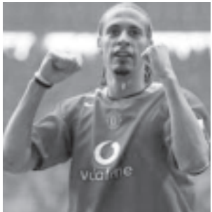
အင်္ဂလန်အသင်းခံစစ်မှူး ဟာဒီနု(မန်ယူ)

ဟာဒီနုပြန်လည်ကစားနိုင်ခြင်းသည် အင်္ဂလန်အသင်းအတွက် အားတက်ဖွယ်ရာဖြစ်ကြောင်း၊ လက်ရှိအချိန်၌ အင်္ဂလန်နောက်တန်းခံစစ်သမားအချို့ ဒဏ်ရာရရှိနေကြောင်း၊ ဟာဒီနုသည် ပုံမှန်အနေအထားဖြစ်နေသဖြင့် မက်ဆီဒိုးနီးယားနှင့်ပွဲတွင် ပါဝင်ကစားခြင်းဖြင့် အင်္ဂလန်နောက်တန်းသည် တောင့်တင်း ခိုင်မာသွားပြီဖြစ်ကြောင်း အင်္ဂလန်နည်းပြ မက်ကလာရင်က ပြောကြားသည်။