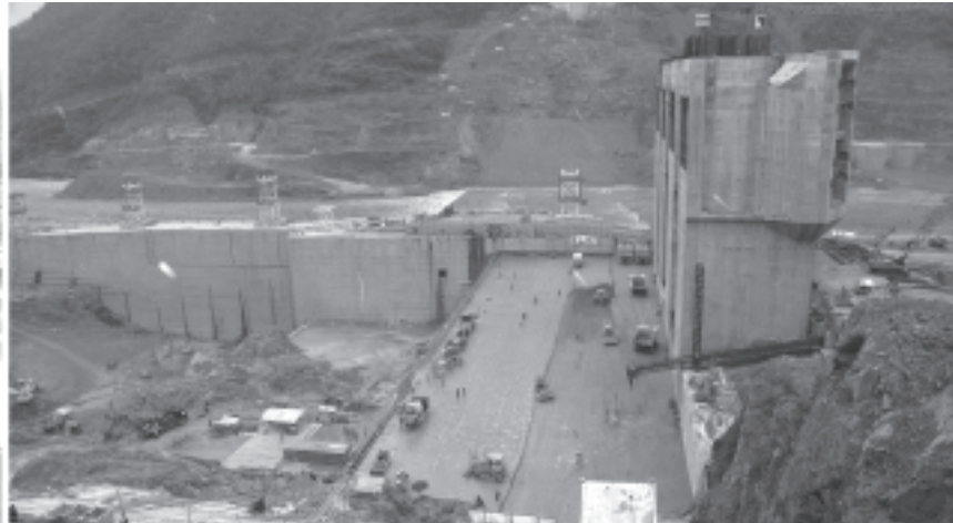
နိုင်ငံတော် အေးချမ်းသာယာရေးနှင့်ဖွံ့ဖြိုးရေးကောင်စီဝင် ကာကွယ်ရေးဝန်ကြီးဌာနမှ ဒုတိယဗိုလ်ချုပ်ကြီးရဲမြင့် ရဲရွာရေအားလျှပ်စစ် စီမံကိန်းလုပ်ငန်းခွင်ကို ကြည့်ရှုစစ်ဆေးစဉ်။ (သတင်းစဉ်)