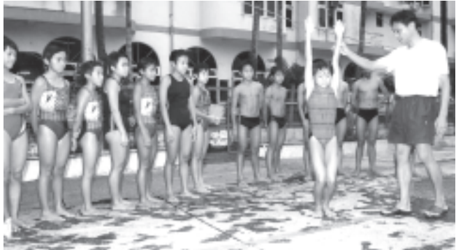
တရုတ်နည်းပြဆရာက လူငယ်မျိုးဆက်သစ်အားကစားသမားများအား ဒိုင်ဗင်နည်းစနစ်များ ဤသို့ သင်ကြားလျက်ရှိသည်။

"အဖွဲ့ချုပ်အနေဖြင့်စဉ်သက်တမ်း အလိုက်အဖွဲ့လိုက် အိတ်ပစ်နေ ပြိုင်ပွဲများ ကျင်းပသော်လည်း ကစားသမား သစ်များ မရရှိပါကြောင်း၊ ဝင်ရောက်ယှဉ်ပြိုင်ကြသော်လည်း လက်ရွေးစင်အတွက်၊ မျိုးဆက်သစ်အတွက် ရွေးချယ်ရာတွင် ကောင်းချိန်များနှင့် တိုက်ဆိုင်နေ၍ စနစ်မဝင်နိုင်၍ မိမိတို့ရေကူးအားကစားလောကအတွက် နှစ်နာမူများ ရှိကြောင်း၊ ထို့ကြောင့် မိမိတို့က ဘုန်းတော်ကြီးသင် ပညာရေးကျောင်းမှ ကလေးများ စားဖွားပြီး ပညာလည်းသင်ယေကာ လေ့ကျင့်မှုကို အဆက်မပြတ် လုပ်ဆောင်သွားမှာ ဖြစ်ကြောင်း၊ အနည်းဆုံး ရေကူးရော ဒိုင်ဗင်ပါ ကစားသမား ၂၀ စီရှိအောင် ဆောင်ရွက်သွားမည် ဖြစ်ကြောင်း၊ လက်ရှိတွင် အဖွဲ့ချုပ်၌ နိုင်ငံတကာ ပြိုင်ပွဲဝင်နိုင်သည့် ကစားသမားများမရှိသေး၍ လူငယ်မျိုးဆက်သစ်များကို ပြုစုပျိုးထောင်ပြီး ပြည်တွင်းအဆင့်မှ နိုင်ငံတကာအဆင့်အထိ ထိုးဖောက်ပြီး အောင်မြင်ဆုတံဆိပ်များ နိုင်ငံအတွက် ရယူပေးနိုင်ရန် ဥက္ကဋ္ဌ ဒေါက်တာခင်ရွှေ အပါအဝင် အဖွဲ့ချုပ်ဘဝစံရှိသူများ အားလုံး ကိုယ်စွမ်း၊ ဘဝစံစွမ်းရှိသူများ ကြိုးစားနေပါကြောင်း"ဖြင့် မြန်မာ့အလင်းသို့ ပြောကြားသွားခဲ့သည်။ (မြန်မာအလင်း)