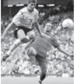
အင်ဒိုရာနှင့်ပွဲတွင် ညာတောင်ပံနေရာ ရောက်လာသော စတီဗင်ဂျရတ်၏ ကစားဟန်။

မိမိအနေဖြင့် စတီဗင်ဂျရတ်အား ညာတောင်ပံကစားသမားအဖြစ် အင်္ဂလန်အသင်းတွင် ကစားစေလိုကြောင်း၊ ယခင် အရစ်ဆင်လက်ကစားက ဂျရတ်သည် ချယ်လ်ဆီးမှ လမ်းပတ်နှင့် ကစားပုံတူနေ၍ အခက်အခဲဖြစ်စေခဲ့ကြောင်း ၎င်းနည်းပြက ပြောကြားသည်။ သို့သော်လည်း မက်ကလာရင် အင်္ဂလန်အသင်းကို စတင်ကိုင်တွယ်သည့် ဂရိန်နဲ့ ချစ်ကြည်ရေးပွဲ၊ အင်ဒိုရာနှင့် ယူဂို ၂၀၀၈ မြေစစ်ပွဲတို့တွင် ဂျရတ်အား ညာတောင်ပံနေရာတွင် ထားကစားခဲ့ရာ ပိုမိုခြေစွမ်းပြကစားနိုင်ခဲ့သည်ကို တွေ့ရသည်။ (အင်တာနက်)