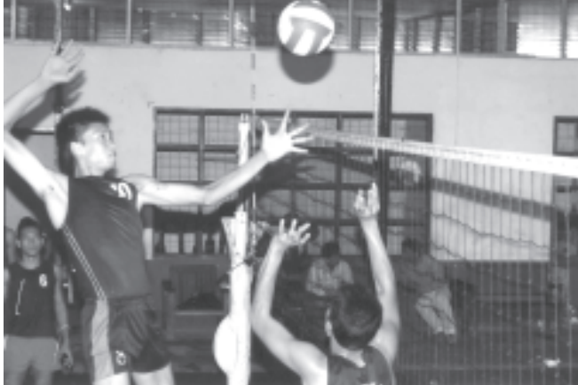
ခုနှစ်တို့တွင် သုံးကြိမ်ဆက်တိုက်ဝင်ရောက်ခဲ့ပြီး ၁၉၉၈ ခုနှစ်နှင့် ၂၀၀၄ခုနှစ် ပြိုင်ပွဲများတွင် ဒုတိယဆုများ ရရှိခဲ့သည်။ ပြိုင်ပွဲ ငါးကြိမ်အနက် ပထမဆုံးသုံးကြိမ်နှင့် ဒုတိယဆုနှစ်ကြိမ် ရရှိထားပြီး ယခု ခြောက်ကြိမ်မြောက် ပါဝင်ယှဉ်ပြိုင်ခြင်း ဖြစ်သည်။

အဆိုပါ လူငယ် ဘော်လီဘော ပြိုင်ပွဲသည် နှစ်နှစ်တစ်ကြိမ်ကျင်းပခဲ့ရာ ယခုအခါတွင် (၁၄)ကြိမ်မြောက်ပြိုင်ပွဲသို့ ချဉ်းနင်း ဝင်ရောက်လာပြီဖြစ်သည်။ မြန်မာနိုင်ငံ ဘော်လီဘောအဖွဲ့ချုပ်အနေဖြင့် လူငယ် လက်ရွေးစင် ဘော်လီဘောအသင်းကို ၁၉၉၂ခုနှစ် ခုနှစ်ကြိမ်မြောက် အရှေ့တောင်အာရှ လူငယ်ပြိုင်ပွဲမှ စတင် ယှဉ်ပြိုင်ခဲ့ရာ ၂၀၀၀ပြည့်နှစ်(၁၁)ကြိမ်မြောက်ပြိုင်ပွဲနှင့် ၂၀၀၂ပြည့်နှစ်(၁၂)ကြိမ်မြောက်ပြိုင်ပွဲများတွင်ပါဝင်ယှဉ်ပြိုင်ခဲ့ခြင်းမရှိဘဲ ကျန်ရှိနေသည့် ပြိုင်ပွဲသည်။ မြန်မာလူငယ် ဘော်လီဘောအသင်းသည် ၁၉၉၂ခုနှစ်၊ ၁၉၉၄ခုနှစ်နှင့် ၁၉၉၆