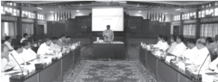
ရန်ကုန် စက်တင်ဘာ ၅

ထုတ်လုပ်အသုံးချရေးညှိနှိုင်းအစည်းအဝေးကို ယနေ့နံနက် ၉နာရီခွဲတွင် ရန်ကုန်မြို့ရှိ အမှတ်(၁) စက်မှုဝန်ကြီးဌာန ခြံစည်းရိုးကြက်ဆူဆီ စီမံကိန်းစာထုတ်လုပ်ရေး ဦးစီးဌာနရှိ သင်တန်းခန်းမဆောင်၌ ကျင်းပသည်။