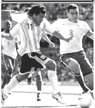
အာဂျင်တီးနားအသင်းအတွက် ချေပွဲသွင်းနိုင်ရန် တိုက်စစ်မှူး တာဗက်စ်က ဤသို့ ထိုးဖောက်ကစားခဲ့သည်။