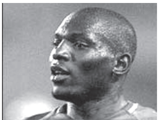
ယခုပွဲ အနိုင်ရရှိသဖြင့် ကင်မရွန်းအသင်း၏ မော်လန်နည်းပြအင်္ဂလန်က သူလူများ ကစားပုံကို ကျေနပ်ကြောင်း၊ ယခုကစားသမားဖြင့် နောက်ပွဲများတွင် ဆက်လက် ကစားသွားမည်ဖြစ်ကြောင်း ပြောကြားသွားသည်။

ပွဲချိန် ၅၅ မိနစ်ရောက်မှသာ ကင်မရွန်းအသင်းမှ ဂိုင်းရရင်းက အဖွင့်ဂိုးသွင်းယူနိုင်ခဲ့ပြီး ဖိနှိပ်ခံရသည့် ဂျာမီက ဘိုတီးသို့ သွင်းယူနိုင်ခဲ့သည်။ ဖိနှိပ်ခံရသည့် လန်ဒန်အင်ဂျင်နီယာ က တစ်ဂိုးထပ်သွင်းခဲ့သဖြင့် ကင်မရွန်းတို့ သုံးဂိုးပြတ် အနိုင်ရရှိခဲ့ခြင်းဖြစ်သည်။