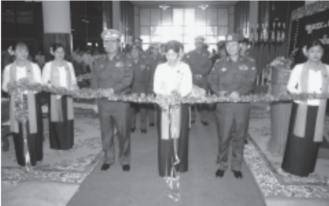
မန္တလေးတိုင်း အေးချမ်းသာယာရေးနှင့် ဖွံ့ဖြိုးရေးကောင်စီဥက္ကဋ္ဌ အလယ်ပိုင်းတိုင်းစစ်ဌာနချုပ် တိုင်းမှူး ဗိုလ်ချုပ်ခင်ဇော်နှင့် ရထားပို့ဆောင်ရေးဝန်ကြီးဌာန ဝန်ကြီး ဗိုလ်ချုပ်အောင်မင်းတို့ အထူးအမြန် လူစီးရထား စတင်ပြေးဆွဲသည့် ခရီးစဉ်ကို ဖဲကြိုးဖြတ်၍ ဖွင့်လှစ်ပေးကြောင်း (သတင်းစဉ်)

အခမ်းအနားသို့ ကျန်းမာရေး ဝန်ကြီးဌာန ဝန်ကြီး ဒေါက်တာ ကျော်မြင့်၊ သစ်တောရေးရာဝန်ကြီး ဌာန ဝန်ကြီး ဗိုလ်မှူးချုပ်သိန်းအောင်၊ မန္တလေးမြို့တော်ဝန် ဗိုလ်မှူးချုပ် ဖုန်းမီးတော်ဟန်၊ ပညာရေးဝန်ကြီးဌာန ဒုတိယဝန်ကြီး ဗိုလ်မှူးချုပ်အောင်မျိုးမင်း၊ ရထားပို့ဆောင်ရေးဝန်ကြီးဌာန ဒုတိယဝန်ကြီး သူရဦးသောင်းလွင်၊ တပ်မတော်အရာရှိကြီးများ၊ ရထား ပို့ဆောင်ရေးဝန်ကြီးဌာနမှ ဌာနဆိုင်ရာ အကြီးအကဲများနှင့် တာဝန်ရှိသူများ၊ မြန်မာ့မီးရထားမှ ဝန်ထမ်းများ၊ စည် သည်များ၊ ဒေသခံပြည်သူများနှင့် ခရီးသွားပြည်သူများ တက်ရောက်ကြ သည်။