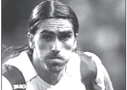
ဝီဂန်နှင့်ပွဲတွင် ပါဝင်ကစားဖွယ်ရှိသည့် ဝီဒိုမန်းဒက်စ်။