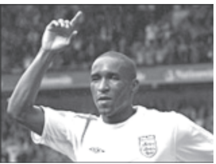
အင်ဒိုရာနွဲ့ပွဲတွင် အင်္ဂလန်အသင်းအတွက် နှစ်ဂိုးသွင်းပေးခဲ့သောဇီဝိဒ်။

အင်္ဂလန်နည်းပြ မက်ကလာရင်က ယင်းပြိုင်ပွဲ၌ နှစ်ဂိုးသွင်းပေးခဲ့သော ဝီတာစရာချီကိုလည်းချီးကျူးခဲ့သည်။ ဇီဝိဒ်သည် အင်္ဂလန်အသင်းတွင် ဝိန်းရန်နေနွဲ့ မိုက်ကယ်အိုဝင်တို့ မပါဝင်ခဲ့သဖြင့် ယူရိုခြေစစ်ပွဲတွင် ပါဝင်ကစားရန် အခွင့်အလမ်းရရှိခဲ့ခြင်းဖြစ်သည်။