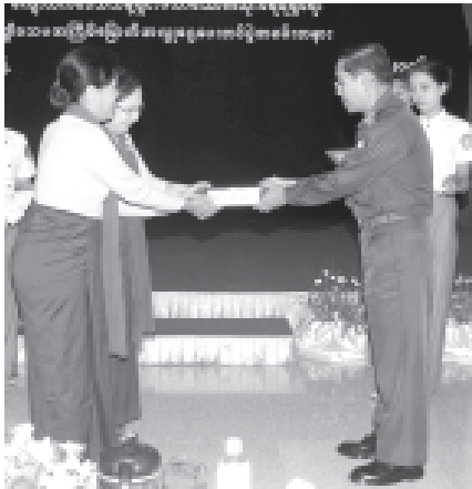
ကာကွယ်ရေးဝန်ကြီးဌာနမှ ဒုတိယဗိုလ်ချုပ်ကြီးမြင့်ဆွေ ကျေးလက်ဒေသ သန့်ရှင်းသော သောက်သုံးရေရရှိရေးအတွက် အလှူငွေတစ်ဦး၏ လှူဒါန်းနေပွဲကို လက်ခံစဉ်။

ဧကရာဇ်ပြည်သူများ၏ လူ့ဒါနုများကို တင်ပြရမည့်ဆိုလျှင် ပထမအကြိမ်မှ စတင်သမအကြိမ်အထိ စုစုပေါင်းအလှူရှင် ၁၆၄၉ ဦးမှ အလှူငွေ ၁၀၀၆၁၁၁၁၀၀ ကျပ်၊ US$ ၇၆၇၅၂၊ EURO ၇၇၀ နှင့်