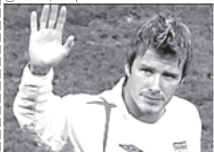
ဒေးဗစ်ဘက်ခမ်း။

ဒေးဗစ်ဘက်ခမ်း အနေဖြင့် အင်္ဂလန်ဘောလုံးအသင်း အောင်မြင်မှု ရရှိရေးအတွက် ပြန်လည်ပါဝင်သင့်ကြောင်း အင်္ဂလန် ဘောလုံးအသင်း