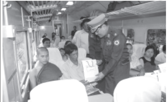
ရန်ကုန်တိုင်း အေးချမ်းသာယာရေးနှင့် ဖွံ့ဖြိုးရေးကောင်စီဥက္ကဋ္ဌ ရန်ကုန်တိုင်းစစ်ဌာနချုပ် တိုင်းမှူး ဗိုလ်မှူးချုပ်လှဌေးဝင်း အထူးအမြန် လူစီးရထား စတင်ပြေးဆွဲခြင်းအထိမ်းအမှတ် အမှတ်တရလက်ဆောင်များ ကို ခရီးသည်များအား ပေးအပ်စဉ်။ (သတင်းစဉ်)

ရန်ကုန်-မန္တလေးလမ်းပိုင်းတွင် အထူးအမြန် လူစီးရထားကို စက်တင်ဘာ ၄ ရက် မှ စတင်ပြေးဆွဲလျက်ရှိရာ ရန်ကုန်-မန္တလေးအထူးအမြန် လူစီးရထားသည် ရန်ကုန် ဘူတာကြီးမှ နေ့စဉ် ညနေ ၅ နာရီတွင်လည်းကောင်း၊ မန္တလေး-ရန်ကုန် အထူးအမြန် လူစီးရထားသည် မန္တလေးဘူတာကြီးမှ နေ့စဉ် ညနေ ၄ နာရီ ၁၅ မိနစ်တွင်လည်းကောင်း ထွက်ခွာမည်ဖြစ်ကြောင်းနှင့် လမ်းခရီးတွင် ပျဉ်းမနားဘူတာသို့သာ ရပ်တန့်မည်ဖြစ်ကြောင်း ကြေညာအပ်ပါသည်။ (မြန်မာ့မီးရထား။)