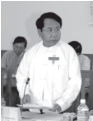
အမျိုးသား ညီလာခံကျင်းပ ရေး ကော်မရှင် အတွင်းရေးမှူး ပြန်ကြား ရေး ဝန်ကြီး ဌာန ဝန်ကြီး ဗိုလ်မှူး ချုပ်ကျော်ဆန်း ရှင်းလင်းတင်ပြ စဉ်။ (သတင်းစဉ်)

နိုင်ငံတော်အစိုးရသည် ချမှတ်ထားပြီး မူဝါဒလမ်းစဉ်များကို အကောင် အထည်ဖော်ဆောင်ရွက်ရင်း တစ်ဖက်မှလည်း ရေရှည်တည်တံ့ခိုင်မြဲမည့်