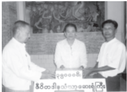
အိမ်ယာနှင့်မှ ဆရာတော်ဦးဓမ္မနန္ဒက ရန်ကုန်မြို့ ဗဟန်းမြို့နယ် မိမိတဒါနသံဃာ့အေးချမ်းသို့ လှူဒါန်းသော တာဝရရွှေခဲ၊ ဆေး၊ ငွေပ ဓဿာပင်ကွပ် သုံးသိန်းငါးသောင်းကို တပည့်ဒါယကာ၊ ဒါယိကာမများက ပေးအပ်လှူဒါန်းရာ ဆောင်ပွဲအဖြစ်အဖြစ် ဖုတ်ယ ဥက္ကဋ္ဌ(၁) ဦးညွန့် လက်ခံယူစဉ်။