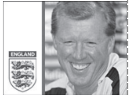
အင်္ဂလန်နည်းပြသစ် မက်ကလာရင်။

တည်ဆောက်မည်ဟုလူစာရင်း ကစားပုံနှင့် အခင်းအကျင်းများကို စိတ်တိုင်းကျ ပြုလုပ်မည်ဖြစ်သည်။ အင်္ဂလန်အသင်းသည် ယူဂို ၂၀၀၈ ပြိုင်ပွဲများနှင့် ကမ္ဘာ့လမ်းပွဲစဉ်