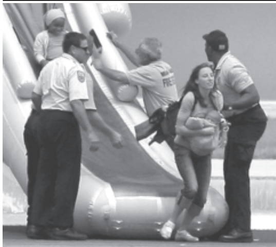
အမေရိကန်လေကြောင်းလိုင်းပိုင် ဘိုးရင်းဂျာဇနီသည်တင်လေယာဉ် မီးလောင်မှု ဖြစ်ပွားသဖြင့် လေယာဉ်အရေးပေါ်ထွက်ပေါက်မှု ဓရီးသည်များ ဆင်းသက်လာသည်ကို ဩဂုတ် ၃၁ရက်က တွေ့ရစဉ်။