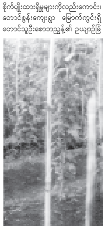
မြေ ၁၁ ဒသမ ၂၅၈၈တွင် ကျွဲကော၊ လက်ဖက်နှင့် ငရုတ်ကောင်းအောင်မြင် ဖြစ်ထွန်းထွက်ရှိမှုနှင့် ရေတံဘက်၊ ကြက် မောက်၊ ပဲစင်းငုံ၊ အခြားသီးနှံများ စိုက်ပျိုးထားရှိမှုကိုလည်းကောင်း၊ တား လမ်းဘေး/ယာဉ် မိုးစပါးစိုက်ပျိုး အောင်မြင် ဖြစ်ထွန်းမှုများကိုလည်း ကောင်း လှည့်လည်ကြည့်ရှု အားပေး သည်။