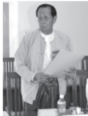
အမျိုးသား ညီလာခံကျင်းပ ရေး လုပ်ငန်း ကော်မတီဥက္ကဋ္ဌ တရားသူကြီးချုပ် ဦးအောင်တိုး ရှင်း လင်းတင်ပြစဉ်။ (သတင်းစဉ်)