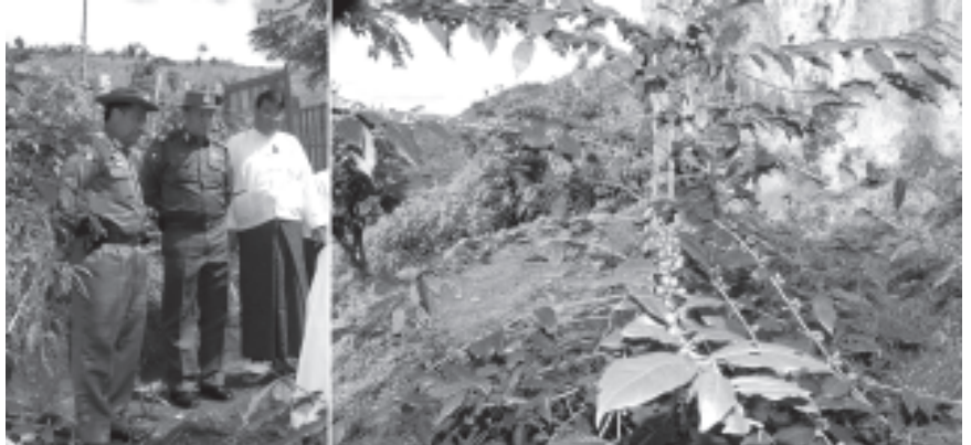
နိုင်ငံတော်အေးချမ်းသာယာရေးနှင့် ဖွံ့ဖြိုးရေးကောင်စီဝင် ကာကွယ်ရေးဝန်ကြီးဌာနမှ ဒုတိယဗိုလ်ချုပ်ကြီးရဲမြင့်၊ မိုးကုတ်မြို့နယ် ပြည်ထောင်စုကြံ့ခိုင်ရေးနှင့် ဖွံ့ဖြိုးရေးအသင်း၏ ကော်မီနီဒ်လက်ဖက်ဖိုက်ခင်းကို ကြည့်ရှုစစ်ဆေးစဉ်။