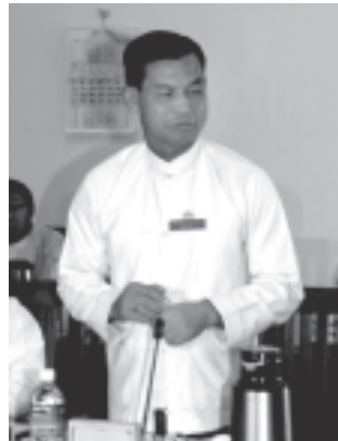
အမျိုးသား ညီ လာခံ ကျင်း ပ ရေး စီမံခန့်ခွဲမှု ကော်မတီ ဥက္ကဋ္ဌ စာ ရင် စစ် ချုပ် ဗိုလ်ချုပ်လွန်းမောင် ရှင်းလင်း တင်ပြ စဉ်။ (သတင်းစဉ်)