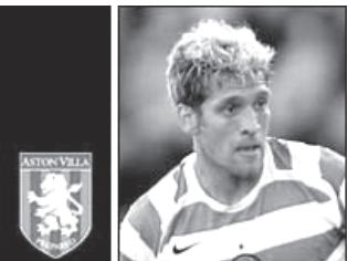
အက်စ်တွန်ဗီလာမှ ခေါ်ယူရန် ကြိုးစားနေသော ဆဲလ်တစ်ကွင်းလယ်ကစားသမား ပီထရိုဗ်

အက်စ်တွန်ဗီလာအသင်းသည် ဆဲလ်တစ်ကွင်းလယ် ကစားသမား စတီဗီယန်ပီထရိုဗ်အား ပေါင် ၆ သန်းဖြင့် ခေါ်ယူရန် နီးစပ်နေပြီဖြစ်သည်။