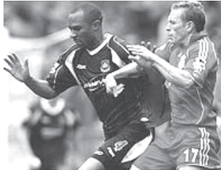
ဝေလတိုက်စစ်မှူး ဘယ်လားမီ (ယာ)

ဘယ်လားမီအပေါ် မှုတည်နေကြောင်း ဝေလအသင်း နည်းပြ ဂျွန်တိုရိုက်က ပြောကြားသည်။ (အင်တာနက်)