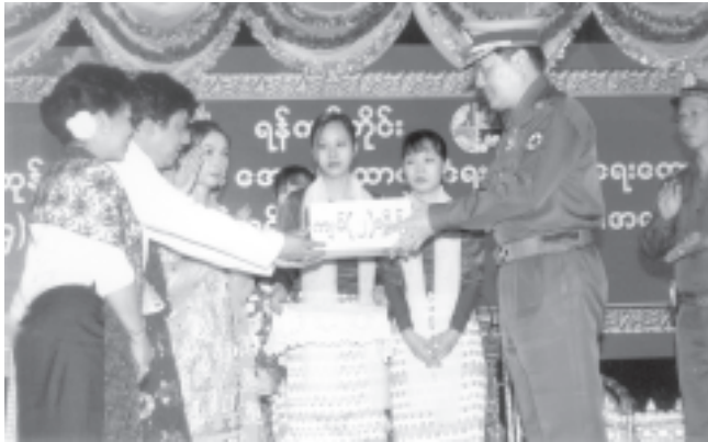
ရန်ကုန်တိုင်း အေးချမ်းသာယာရေးနှင့် ဖွံ့ဖြိုးရေးကောင်စီဥက္ကဋ္ဌ ရန်ကုန်တိုင်းစစ်ဌာနချုပ် တိုင်းမှူး ဗိုလ်မှူးချုပ် လှအေးဝင်းက ဖျော်ဖြေရေး အစီအစဉ်တွင်ပါဝင်သည့် အနုပညာရှင်များအား ဂုဏ်ပြုငွေပေးအပ်စဉ်။

မြန်မာ့ယဉ်ကျေးမှု အနုပညာ သည် မြန်မာ့သဘာဝ၊ မြန်မာ့ဓလေ့ စရိုက်ကို ဝီရိယပြင် ထင်ဟပ် ဖော်ကျူးနိုင်သောပညာရပ်ဖြစ်ကြောင်း၊ ယဉ်ကျေးမှုပညာရပ် နယ်ပယ်တိုင်းမှာ သုတ၊ရသ၊ဓမ္မတို့နှင့် ပြည့်စုံမှု၊ ပညာ ခန်း ကျယ်ဝန်းနက်ရှိုင်းမှုစသည့် ဂုဏ် အရည်အသွေးများဖြင့် ပြည့်ဝလျက် ရှိကြောင်း၊ ထို့အပြင် မြန်မာတိုင်း ရင်းသားလူမျိုးတို့၏ သိမ်မွေ့နက်နဲ