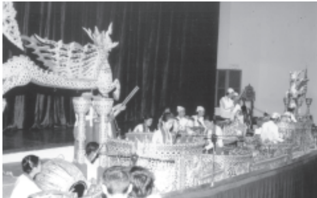
မောင်မယ်ပြိုင်နှိုင်း မြန်မာ့ဆိုင်းရိုင်း အစီအစဉ် တင်ဆက်မှုကို ဤသို့ တွေ့ရသည်။

တို့မှာ အနုပညာဝါသနာအခြေခံအရေကြီးပုံတို့ကို ပြဆိုစော်ညွှန်းထားခြင်းဖြစ်သည်။