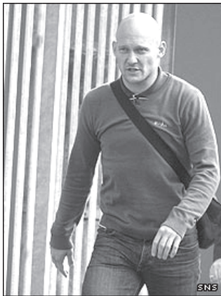
ဇိုးရဲမက်ဒရစ်မှ ကျောခိုင်းထွက်ခွာလာသော ဂရာဗီဆင်

အသက် ၃၀ အရွယ်ရှိ အဆိုပါ ဂရာဗီဆင်သည် ဩဂုတ် ၃၁ ရက်မတိုင်မီ ကလပ်အသင်းသစ်တစ်သင်းနှင့် စာချုပ်လိမ့်မည်ဟု မျှော်လင့်ရသည်။