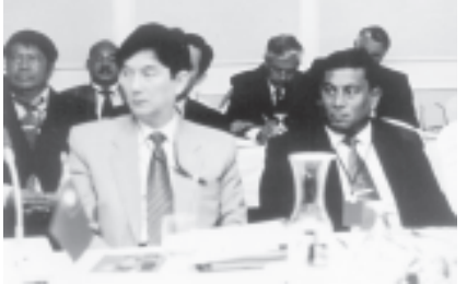
ကျန်းမာရေးဝန်ကြီးဌာန ဝန်ကြီးဒေါက်တာကျော်မြင့် ဘင်္ဂလားဒေ့ရှ် ပြည်သူ့သမ္မတနိုင်ငံ ဒါကာမြို့တွင်ကျင်းပသည့် (၂၄)ကြိမ်မြောက် ကမ္ဘာ ကျန်းမာရေးအဖွဲ့ အရှေ့တောင်အာရှဒေသဆိုင်ရာ အဖွဲ့ဝင်နိုင်ငံများ၏ ကျန်းမာရေးဝန်ကြီးများ အစည်းအဝေး တက်ရောက်စဉ်။ (ကျန်းမာရေး)

အစည်းအဝေးတွင် ဒေသတွင်း နိုင်ငံများအတွင်း ငှက်ပျားရောဂါ တိုက်ပျက်ရေးလုပ်ငန်းများကို ပိုမို ထိရောက်စွာ ဆောင်ရွက်နိုင်ရေး အတွက် နည်းဗျူဟာလုပ်ငန်းစဉ် များကို သုံးသပ်ဆွေးနွေးပြီး ပြင်ဆင်မှု များဆောင်ရွက်သွားရန်၊ ကြက်ငှက် တုပ်ကွေးရောဂါ ကြိုတင်ကာကွယ်ရေး နှင့် ထိန်းချုပ်ရေးလုပ်ငန်းများကို ပူးပေါင်းဆောင်ရွက်သွားရန်၊ အဖွဲ့ဝင် နိုင်ငံများအတွင်း အဓိက ရောဂါကြီး သုံးမျိုး ဖြစ်သော ငှက်ဖျားရောဂါ၊ တီဘီရောဂါနှင့် ခုခံအားကျဆင်းမှု ကူးစက်ရောဂါ တိုက်ပျက်ရေးလုပ် ငန်းများကို ပိုမိုတိုးမြှင့်ဆောင်ရွက်