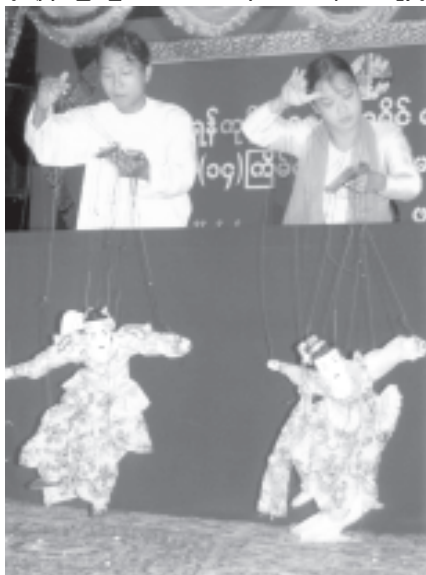
ရန်ကုန် အရှေ့ပိုင်းခရိုင်၏ (၁၄)ကြိမ်မြောက် မြန်မာ့ရိုးရာယဉ်ကျေးမှု အဆို၊ အက၊ အရေး၊ အတီးပြိုင်ပွဲ ဖွင့်ပွဲတွင် ယဉ်ကျေးမှုတက္ကသိုလ်မှ ကကြိုးစုံစွာ အရုပ်အကပေးသဖြင့် ဤလို ဖျော်ဖြေခဲ့သည်။

ယမန်နှစ်က ရန်ကုန်အရှေ့ပိုင်း ခရိုင်မှ တိုင်းအဆင့် အဆို၊ အက၊ အရေး၊ အတီးအဖွဲ့ဝင်များ ဝင်ရောက် ယှဉ်ပြိုင်ကြရာတွင် အဆိုပညာရှင် အဆင့် ကိုဦး၊ ဝါသနာရှင်အဆင့်