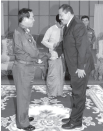
ဩဂုတ် ၃၀ ရက်က နိုင်ငံတော်ဝန်ကြီးချုပ် ဗိုလ်ချုပ်ကြီးစိုးဝင်း ဗင်နိုလားဘိုလစ်ဗေးရီးယန်းသမ္မတနိုင်ငံ သမ္မတ၏ အထူးကိုယ်စားလှယ် သံအမတ်ကြီး H.E.Mr. Vladimir Villegas အား နေပြည်တော်ရှိ ဝန်ကြီးချုပ်ရုံးစဉ်ခန်းမ၌ ရင်းရင်းနီးနီး နှုတ်ခေါ်ခဲ့သည်။ (သတင်းစဉ်)

ယင်းနောက် ဒုတိယဗိုလ်ချုပ်ကြီး ရဲမြင့်နှင့်အဖွဲ့ဝင်များသည် ဗန်းမော်မြို့ သို့ ရောက်ရှိကြသည်။ (သတင်းစဉ်)