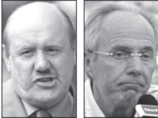
ဘရင်းဘာဝစ်စ် (ဝဲ) နှင့် အဲရစ်ဆင် (ယာ)

အဲရစ်ဆင်သည် အင်္ဂလန်အသင်းနည်းပြအဖြစ် ငါးနှစ်တာတာကာလ တာဝန်ယူခဲ့ရာတွင် ပေါင်ငွေ ၂၅ သန်းရရှိခဲ့ကြောင်း မီဒီယာများက ဖော်ပြသည်။ (အင်တာနက်)