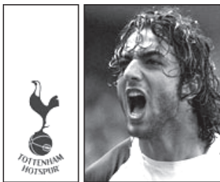
တော့တင်ဟမ်အသင်းက စာချုပ်တော့မည့် မီဒီ

နိုင်ခဲ့သည်။ ဘလက်ဘန်းနှင့် နယူးကာဆယ်တို့က ၎င်းအားခေါ်ယူရန် ကြိုးစားခဲ့သော်လည်း မီဒီအနေဖြင့် စပါးအသင်း၌သာ ပြန်ကစားရန် အလိုရှိခဲ့ကြောင်း သိရသည်။ (အင်တာနက်)