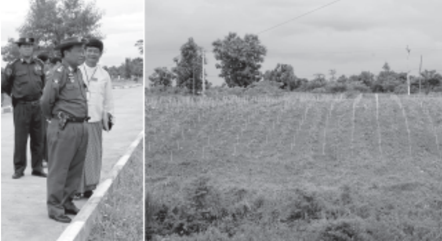
နိုင်ငံတော်အေးချမ်းသာယာရေးနှင့် ဖွံ့ဖြိုးရေးကောင်စီဝင် ကာကွယ်ရေးဝန်ကြီးဌာနမှ ဒုတိယဗိုလ်ချုပ်ကြီးရဲမြင့် ဗန်းမော်ဒီဂရီ ကောလိပ်ကျောင်းဝင်းအတွင်းရှိ ခြံစည်းရိုးကြက်ဆူပင်စိုက်ခင်းကို ကြည့်ရှုစစ်ဆေးစဉ်။ (သတင်းစဉ်)