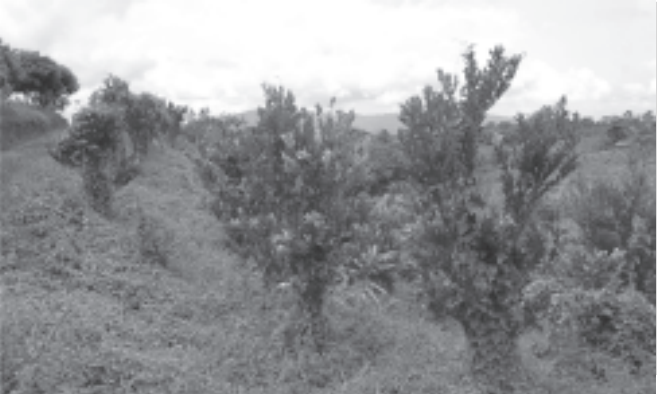
နိုင်ငံတော်အေးချမ်းသာယာရေးနှင့် ဖွံ့ဖြိုးရေးကောင်စီဝင် ကာကွယ်ရေးဝန်ကြီးဌာနမှ ဒုတိယဗိုလ်ချုပ်ကြီးရဲမြင့် ဝိုင်းမော်မြို့နယ် အောင်ဂျာစံမြို့အတွင်း စိုက်ပျိုးထားသည့် မက္ကဒေးဇီးယား၊ လိုက်ချီ၊ ပျားလီမွန်နှင့် နွဲ့ပွလီမွန်ပင်များကို ကြည့်ရှုစစ်ဆေးစဉ်။ (သတင်းစဉ်)