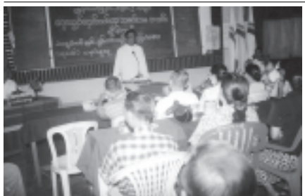
ပုဇွန်တောင်မြို့နယ် အမှတ်(၉)ရပ်ကွက် ရေကျော်စောင်းဝယ်ရေး သမဂ္ဂဗဟိုအသင်းလီမိတက် (၂၀၀၅/၂၀၀၆) နှစ်ပတ်လည်အသုံးပြုရေး၊ ရောဘာပင်များကို စီးပွားဖြစ် တိုးချဲ့ စိုက်ပျိုးရေး၊ မွေးမြူရေး လုပ်ငန်းများကို စံနမူနာပြု ဆောင်ရွက် ရေးတို့ကို မှာကြားပြီး မိသားစုဝင်များ အား ရင်းရင်းနှီးနှီး တွေ့ဆုံနည်းတူ ဆက်သွယ်ပါ။

မြန်မာ့လူ့အခွင့်အရေးအဖွဲ့မှ ဖမ်းဆီးခံရသူများကို စိုက်ပျိုးရေး၊ မွေးမြူရေး လုပ်ငန်းများကို စံနမူနာပြု ဆောင်ရွက် ရေးတို့ကို မှာကြားပြီး မိသားစုဝင်များ အား ရင်းရင်းနှီးနှီး တွေ့ဆုံနည်းတူ ဆက်သွယ်ပါ။