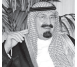
ဆော်ဒီဘုရင် အမ္မုဒူလာဘင်အဘူလ်အဓ်

ရေနံဈေးနှုန်းမြင့်တက်နေသဖြင့် အကျိုးအမြတ်များ ရရှိနေသော်လည်း ဆော်ဒီအာရေဗျ နိုင်ငံအနေဖြင့် ရေနံ ဈေးနှုန်းထိန်းချုပ်ရေးကိုဆက်လက်ပြုလုပ်မည် ဆော်ဒီအာရေဗျ နိုင်ငံပိုင် အာရုတ်အယ်အာဆတ် သတင်းစာက ဆော်ဒီ အာရေဗျဘုရင်၏ ပြောကြားချက်ကို ကိုးကားဖော်ပြသည်။ ယခုအခါ ရေနံကိုပေါများစွာ ထုတ်လုပ်နေကြောင်း၊ ရေနံထုတ်လုပ်မှု မလျော့ကျကြောင်း၊ သို့ရာတွင် ရေနံဈေးနှုန်း များကမ္ဘာ့ဈေးကွက်၌ မြင့်မားနေကြောင်း၊ ယင်းမှာ တရားနည်းလမ်း မကျကြောင်း၊ ရေနံဈေးနှုန်းမြင့်မား နေခြင်းအပေါ် မိမိပမောငြိမ်စေကြောင်း ဆော်ဒီဘုရင်က ပြောကြားသည်။