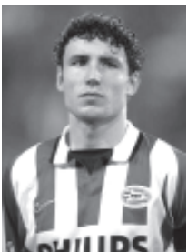
ဘွမ်မဲလ်

အဆိုပါ ဘယ်လ်ဂျီယံသို့သွားသည့် ရုရှားသူ ကွက်စီညက်ဆိုဇာအား ၆-၃၊ ၆-၃ဖြင့် အလွယ်တကူ အနိုင်ယူခဲ့ခြင်းဖြစ်သည်။ ဖော့နင်ဟောင်းသည် ဝင်ဘယ်ဒန်ပွဲ အပြီး ပထမဆုံးယှဉ်ပြိုင်ကစားသည့် ပွဲဖြစ်သည်။ ဖေဖော်ဝါရီနှင့် ဖော့နင်ဟောင်းတို့ လွန်ခဲ့သောနှစ်ကပင် ဆုံတွေ့ခဲ့ရသည့် ဒေဗစ်ပွဲ၌ ရှုံးနိမ့်ခဲ့သည်။