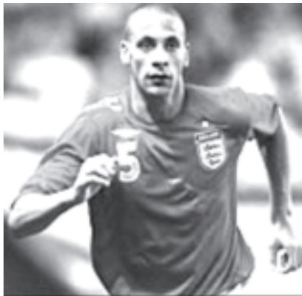
မန်ယူ နောက်တန်းသမား ဖာဒီနန်။

ဖာဒီနန်သည် မန်ယူနှင့် ဝက်ဖို့ဒ် ပွဲတွင် ငင်းဒ်ဇာရာရရှိခဲ့ခြင်းဖြစ်သည်။ ငင်းဒ်ဇာသည် တန်ခိုးနေ့တွင် ဓာတ်မှန် ရိုက်ရမည်ဖြစ်ကြောင်း၊ အင်္ဂလန် အသင်းအတွက် သံသယဖြစ်စိမ့်ကြောင်း မနုဿန်းပြောကြားသည်။