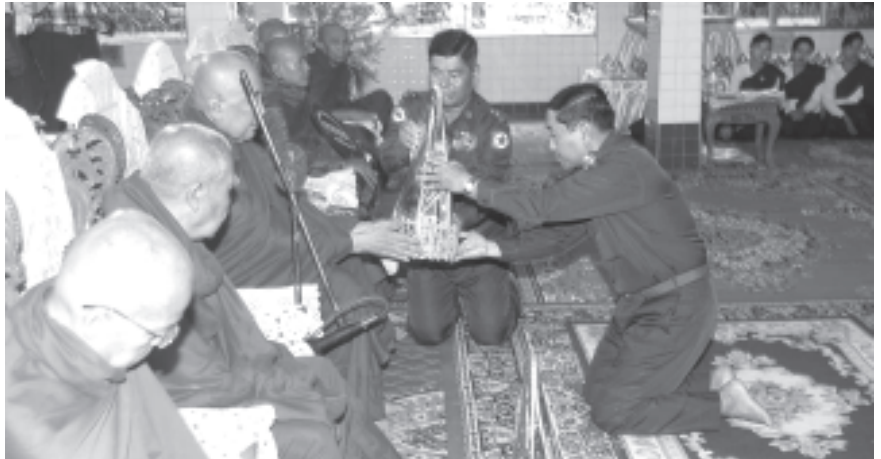
ကာကွယ်ရေးဝန်ကြီးဌာနမှ ဒုတိယဗိုလ်ချုပ်ကြီးမြင့်ဆွေ ကြည့်မြင်တိုင်မြို့နယ် ဘုန်းတော်ကြီးစာသင်တိုက် လေးတိုက်သို့ တပ်မတော် (ကြည်း၊ ရေ၊ လေ)မိသားစုများနှင့် စေတနာရှင်ပြည်သူများ၏ ဆွမ်းဆန်တော်၊ ဆီ၊ ဆား၊ ဆေး၊ ပဲနှင့် ဆွမ်းပဒေသာပင် အလှူငွေများ ပေးအပ် လှူဒါန်းပွဲတွင် ဆရာတော်ထံ လွှဲဖွယ်ပစ္စည်းများ ဆက်ကပ်လှူဒါန်းစဉ်။ (သတင်းစဉ်)

အခမ်းအနားသို့ ရန်ကုန်မြောက်ပိုင်းခရိုင် လှိုင်သာယာမြို့နယ် အတွင်းရှိ ဘုန်းတော်ကြီးစာသင်တိုက် ၁၄ တိုက်မှ ပဓာနနာယက ဆရာတော်များနှင့် ပင့်သံဃာတော်များ၊ သီလရှင်စာသင်တိုက် တစ်တိုက်မှ သီလရှင်ဆရာကြီးများ ကြွရောက်ကြပြီး စာမျက်နှာ ၈ ကော်လံ ၁ ■