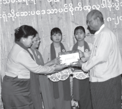
ဒလမြို့နယ် ပြည်သူ့ဆေးရုံ ဆေးပဒေသာပင်အတွက် မြန်မာနိုင်ငံအမျိုးသမီးရေးရာအဖွဲ့ချုပ်က လှူဒါန်းငွေကျပ်နှစ်သိန်းကို တာဝန်ရှိသူများက ပေးအပ်လှူဒါန်းခဲ့ခြင်း။

မိသားစုစကားရိုင်း အခမ်းအနားအပြီးတွင် ရန်ကုန်တိုင်း မိခင်နှင့် ကလေးစောင့်ရှောက်ရေး ကြီးကြပ်ရေးအဖွဲ့ ဥက္ကဋ္ဌနှင့် အဖွဲ့ဝင်များသည် မြို့နယ်အတွင်းရှိ မိခင်နှင့် ကလေးစောင့်ရှောက်ရေးအသင်းဝင်များနှင့်အတူ မိသားစုစကားရိုင်းအသွင်ဖြင့် မိခင်နှင့်ကလေး ဆိုင်ရာကိစ္စရပ်များကို ရင်းနှီးပွင့်လင်းစွာ ဆွေးနွေးကြသည်။ (သတင်းစဉ်)