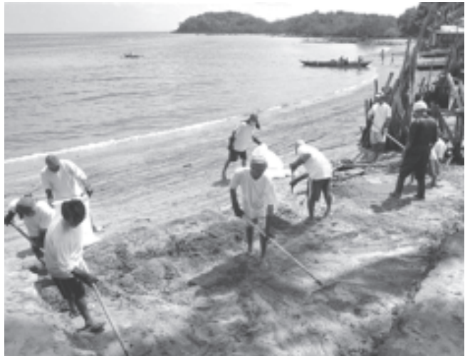
မိလစ်ပိုင်ကမ်းရိုးတန်း တစ်လျှောက်ပျံ့နှံ့နေသော ရေနံများအား ဒေသခံပြည်သူများက ရှင်းလင်းဖယ်ရှားနေသည်ကို ဩဂုတ် ၂၆ ရက်က တွေ့ရစဉ်။