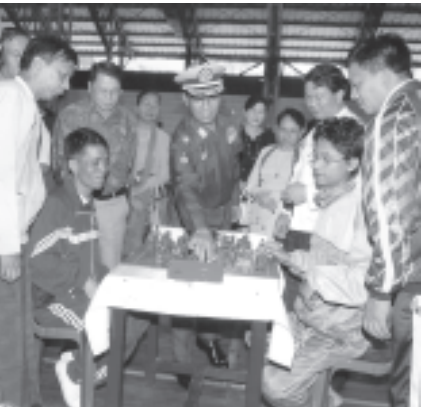
အားကစားနှင့် ကာယပညာဦးစီးဌာနနှင့် မြန်မာနိုင်ငံစစ်တပ်ရင်း အဖွဲ့ချုပ်တို့ ကြီးမှူးကျင်းပသည့် (၃၁)ကြိမ်မြောက် ပြည်နယ်နှင့်တိုင်း အပြည်ပြည်ဆိုင်ရာ စစ်တပ်ရင်းမြစ်ပွဲနှင့် မြန်မာရိုးရာ စစ်တပ်ရင်းမြစ်ပွဲ ဖွင့်ပွဲကို အောင်ဆန်းအားကစားပြိုင်ပွဲဝင်ရှိ ဖိလ်လေ့လှ်အားကစားရုံ၌ ကျင်းပရာ မြန်မာနိုင်ငံ အိုလံပစ်ကော်မတီဥက္ကဋ္ဌ အားကစားဝန်ကြီးဌာန ဝန်ကြီး ဗိုလ်မှူးချုပ်သူရအေးမြင့် စစ်တပ်ရင်းပထမရွှေကွက်ကိုရွှေ၍ ဖြင့်ပွဲ ကို ဖွင့်လှစ်ပေးစဉ်။

ထို့နောက် ဝန်ကြီးက လိုအပ် သည့်အားဖြင့် စက်တင်ဘာ ၃ ရက်က လူငယ်ဘောလုံးအဖွဲ့အား ရင်းရင်း နီးနီး နှုတ်ခွင့်ပေးသည်။