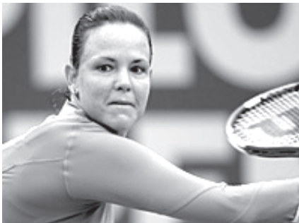
ကမ္ဘာ့တစ်တန်း တင်းနစ်ဗိုလ် လင်ဆေးဖေဖော်ဝါရီ၏ကစားဟန်။

အသက် ၃၀အရွယ် လင်ဆေးဖေဖော်ဝါရီသည် အကြိမ်လီလုပွဲ၌ ရုရှားမှ ကွက်စီညက်ဆိုဇာကိုအနိုင်ရလိုက်သည့် ဘယ်လ်ဂျီယံသို့ ဂျူလိုင်လ ဖော့နင် ဟောင်းနှင့် ဗိုလ်လုပွဲကစားကြမည်ဖြစ်သည်။