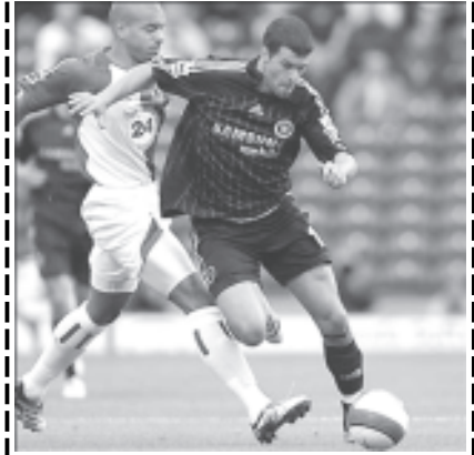
ချယ်လ်ဆီးမှ မိုက်ကယ်ဘောလက် ဘလက်ဘန်း ဘက်သို့ ဤသို့ ထိုးမောက်ကစားခဲ့သည်။

ကာကွယ်ပေးနိုင် ချယ်လ်ဆီးအသင်းအတွက် ဒုတိယမြောက်ဂိုးကို လူစားဝင်လာသူ ဒရော့ဘာက ပွဲချိန်၈၀မိနစ်တွင် သွင်းယူပေးခဲ့သည်။ ဘလက်ဘန်းတို့ ပွဲအစမှာပင် ဂိုးသွင်းခွင့်များရရှိရန် အကြိတ်အနယ်ကြိုးစားကစားခဲ့သည်။ သို့သော်လည်း တောင်အာဖရိကတိုက်စစ်မှ ဘင်နီမက်ကာသီက ဘလက်ဘန်းအတွက် ချေပွဲဂိုးသွင်းပေးရန် ကြိုးစားခဲ့သော်လည်း ချယ်လ်ဆီးဂိုးသမား ပီတာချက် ကာကွယ်ပေးနိုင်ခဲ့သည်။ ချယ်လ်ဆီးနည်းပြ မော်ရင်ဟိုက ပွဲအစမှာပင် အသစ်စာချုပ်ခေါ်ယူထားသော မိုက်ကယ်ဘောလက်နှင့် ခါလစ်တိုလာရစ်စ်တို့အား ထည့်ကစားခဲ့သည်ကို တွေ့ရသည်။ ချယ်လ်ဆီးအသင်းသည် နိုင်ပွဲပြန်စဉ်နိုင်ခဲ့သော်လည်း ဘလက်ဘန်းအသင်းမှာ ယခုနှစ် ပရီမီယာလိဂ်တွင် ဒုတိယမြောက်အဆင့်နှင့် ရင်ဆိုင်ခဲ့ရခြင်းဖြစ်သည်။ (မြန်မာ့အသံ)