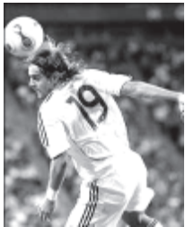
ဂျီနုသန်ဝုဒ်ဂိတ်၏ ခေါင်းတိုက်ဟန်။

လွန်ခဲ့သော ရက်ချီမက်ဒရစ်မြို့ ကာလရည် ကစားသမားအား ဂျီနုသန်ဝုဒ်ဂိတ် ခေါင်းတိုက်ခဲ့သည်။ အဆိုပါ နောက်တန်းကစားသမားအား ဂျီနုသန်ဝုဒ်ဂိတ် ခေါင်းတိုက်ခဲ့သည်။