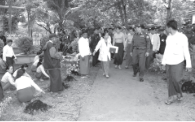
ရန်ကုန် ဩဂုတ် ၂၇

မြန်မာနိုင်ငံအမျိုးသမီးရေးရာအဖွဲ့ချုပ်က ကြီးမှူးကျင်းပသော ရန်ကုန်တောင်ပိုင်းခရိုင် ဒလမြို့နယ် ပြည်သူ့ဆေးရုံ သန့်ရှင်းရေးလုပ်ငန်းပွဲ၊ ခြံစည်းရိုးကြက်ဆူပင်စိုက်ပျိုးပွဲနှင့် ဆေးပဒေသာပင် လှူဒါန်းပွဲအခမ်းအနားကို ယနေ့နံနက် ၇နာရီက ရန်ကုန်တောင်ပိုင်းခရိုင် ဒလမြို့နယ် ပြည်သူ့ဆေးရုံ၌ကျင်းပရာ ရန်ကုန်တိုင်း အေးချမ်းသာယာရေးနှင့် ဖွံ့ဖြိုးရေးကော်မတီဥက္ကဋ္ဌ ရန်ကုန်တိုင်း စစ်ဌာနချုပ် တိုင်းမှူး ဗိုလ်မှူးချုပ်လှဝင်းက တက်ရောက်အားပေးချီးမြှင့်သည်။