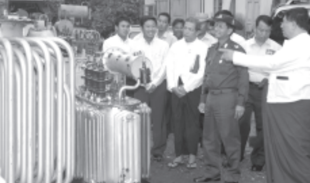
ရန်ကုန် ဩဂုတ် ၂၇

မြန်မာ့ရိုးရာယဉ်ကျေးမှု အဆို၊ အက၊ အရေး၊ အတီးဖြင့်ပွဲကြီး ဆောင်မြင်စွာကျင်းပနိုင်ရန် ပြင်ဆင်ဆောင်ရွက်ထားမှုများ၊ ဆောင်ရွက်ဆဲလုပ်ငန်းများနှင့် ပြိုင်ပွဲမတိုင်မီ ရှေ့ဆက်ပြီးဆောင်ရွက် ရမည့်လုပ်ငန်းများကို ကော်မတီအသီးသီးက မိမိတို့အခန်းကဏ္ဍအလိုက် ပူးပေါင်းညှိနှိုင်း ဆောင်ရွက်လျက် ရှိသည်။