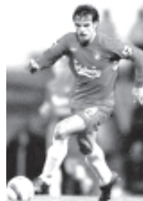
မိုရီယန်တေးစ်၏ ကစားဟန်

သု၏ပထမဆုံး သွင်းဂိုးကို သွင်းယူနိုင် ခဲ့သည်။