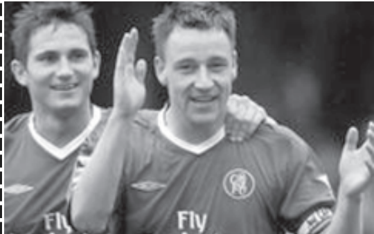
ချယ်လ်ဆီး အသင်းမှ အသင်းခေါင်းဆောင် တယ်ရီ(ယာ)နှင့် လမ်းပတ်(စ်)တို့ အား တွေ့ရစဉ်။

ပရီမီယာလိဂ်(၃)ကို ဩဂုတ် ၂၇ ရက် (ယနေ့) ဆက်လက်ကစားမည်ဖြစ်ရာ ဘလက်ဘန်းနှင့် ချယ်လ်ဆီး၊ အက်စတွန်ဗီလာနှင့် နယူးကာဆယ်တို့ ယှဉ်ပြိုင်ကစားမည် ဖြစ်သည်။