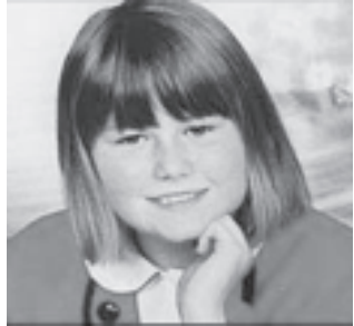
ပြန်ပေးဆွဲခံရသူ နာတာကရက်ပွတ်ချီ

သြစတြေးယား မိန်းကလေးတစ်ဦးသည် ရှစ်နှစ်အကြာ ပြေးမြောက် ငှားရမ်း ဖမ်းဆီးပိတ်လှောင်ထားခြင်း ခံရသော ကားရိုဒေါင်တစ်စုမှ မြောက် ၂၃ ရက်က ထွက်ပြေးလွတ်မြောက်လာကြောင်း၊ ထိုအတောအတွင်း