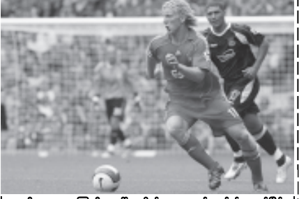
လီဟာပူးမှ မကြာမီကခေါ်ယူလိုက်သော ဒတ်ကွတ်၏ ယှဉ်ပြိုင်ထိုးဖောက်ကစားမှုကို ဤသို့တွေ့ရသည်။

ပရီမီယာလိဂ် တာဝန်ကောင်းခဲ့သော မန်ချက်စတာယူနိုက်တက်အသင်းသည် ပွဲစဉ်(၃)တွင်လည်း