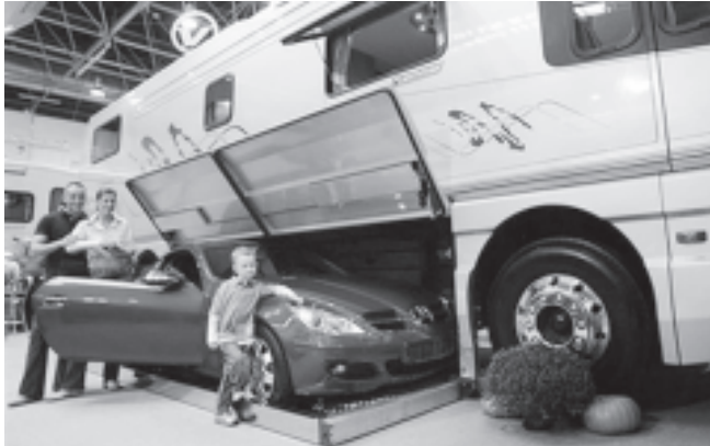
ကုမ္ပဏီနှင့်အဆောက်အအုံတို့တွင် ကျင်းပသည့် အပြည်ပြည်ဆိုင်ရာ လူနေယဉ်ပြပွဲတွင် ကားသိမ်းဆည်းရန် နေရာ ထည့်သွင်းတည်ဆောက်ထားသည့် ယာဉ်တစ်စီး ပြသထားသည်ကို မြင်ရုံ ၂၅ ရက်က တွေ့ရစဉ်။