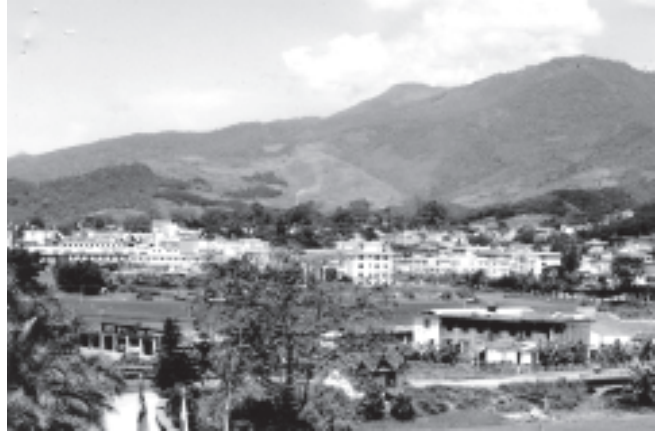
မိုင်းလားမြို့၏ ဖွံ့ဖြိုးတိုးတက်နေသော မြင်ကွင်း တစ်စိတ်တစ်ဒေသ။ (ဓာတ်ပုံမှတ်တမ်း-သောင်းဝင်းဗိုလ်)

‘ဝ’ ဒေသတွင် မွေးယဉ်းစေသော နှင့် ဘိန်းဖိုက်ဖျိုးထုတ်လုပ်မှုပပျောက်