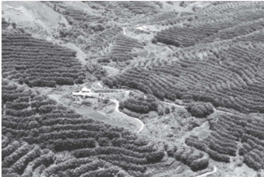
‘ဝ’ တိုင်းရင်းသားတို့နေထိုင်ရာ ဒေသတွင် အောင်မြင်ဖြစ်ထွန်းနေသော ဘိန်းအစားထိုးသီးနှံ ရော်ဘာစိုက်ခင်းများကို ဤသို့တွေ့ရသည်။ (ဓာတ်ပုံမှတ်တမ်း-သောင်းဝင်းဗိုလ်)

နိုင်ငံတော်က မွေးယဉ်းစေသော တိုက်ဖျက်ရေးကာလက ဟန်တား တိုက်ဖျက်ရေးလုပ်ငန်းများကိုသာ လုပ်ဆောင်နေခြင်းမဟုတ်ဘဲ နောက်ဆက်တွဲ ဆောင်ရွက်ပေးလျက်ရှိသည့် လုပ်ငန်းများမှာ ဘိန်းဖိုက်တောင်သူများ အစားထိုးဝင်ငွေရရှိရေး၊ လူနေမှုဘဝ ဖွံ့ဖြိုးတိုးတက်ရေး၊ လူမှုဘဝမြှင့်တင်ရေး လုပ်ငန်းများကိုပါ ဟန်ချက်ညီညီ ဆောင်ရွက်ပေးလျက်ရှိသည်။