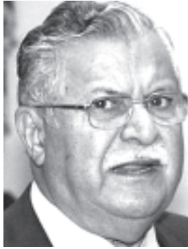
အီရတ်သမ္မတဟာဘာနီ

အီရတ်ပါလီမန်က သမ္မတ ဂျာလာလ်တာလာဘာနီအား လေးလကြာ နိုင်ငံရေးရှေ့မတိုးနောက်မဆုတ်သာအခြေအနေ ဖြစ်ခဲ့ပြီးနောက် နိုင်ငံရေးသမားများက စည်းလုံးညီညွတ်သော အမျိုးသားအစိုးရဖြစ်ရေး တိုက်တွန်းခဲ့သကဲ့သို့ စနေနေ့က ဒုတိယ သက်တမ်း တာဝန်ထမ်းဆောင်ရန် ပြန်လည်ရွေးချယ်လိုက်သည်။ တာလာဘာနီသည် အီရတ်မြောက်ပိုင်း ကာဒံများအတွက် ၎င်း၏ သက်တမ်းတစ်လျှောက်တိုက်ခိုက်ရေးဖြင့်သာ အချိန်ကုန် စေခဲ့သဖြင့်ပြီး အာရပ်နိုင်ငံ၌ အာရပ်မဟုတ်သော သမ္မတအဖြစ် ပထမဆုံးဖြစ်လာသဖြင့်ဖြစ်သည်။ အစီအစဉ်အဆင်ယူ