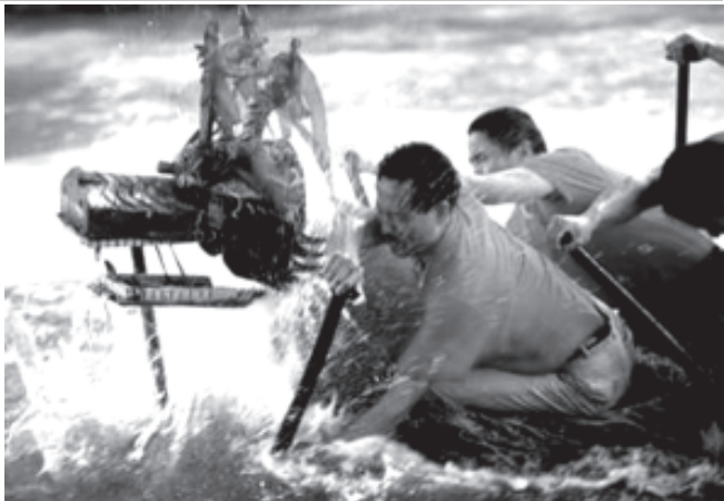
တရုတ်နိုင်ငံ ကျီကျန်ပြည်နယ် ဟန်ကျီမြို့တွင် ကျင်းပသည့် နဂါးလေ့မြိုင်ပွဲ၌ ပါဝင်ဆင်နွှဲနေသော နဂါးလေ့တစ်စင်းကို ၈၆၂၅ ရက်က တွေ့ရစဉ်။

အဆိုပါအရက်စားခိုင်ခံ့ဆော အပေါ်မေးရိုးတွင် သွားဝါးချောင်းပါရှိပြီး ၎င်းသည် သေးသွယ်ပြီးရှားပါးသည့် မြေနှစ်ချောင်းနှင့် လမ်းလျှောက်ကာ တိုသောလက်များပါရှိသည်။ အစီအစဉ်အဆင်ယူ