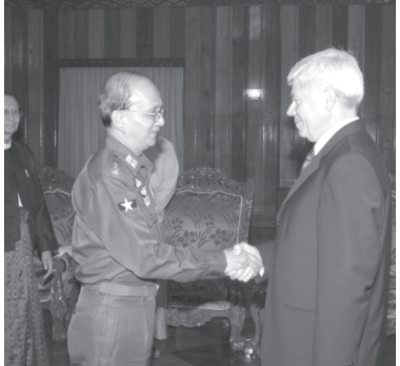
နိုင်ငံတော်အေးချမ်းသာယာရေးနှင့် ဖွံ့ဖြိုးရေးကောင်စီ အတွင်းရေးမှူး(၁) ဒုတိယဗိုလ်ချုပ်ကြီးသိန်းစိန် ရုရှားဖက်ဒရေးရှင်းနိုင်ငံ တရားရုံးချုပ်ဥက္ကဋ္ဌ H.H.Mr. Vyacheslav M. Lebedev အား ရန်ကုန်မြို့ ကုန်းမြင့်သာရှိ ဧယျာသီရိဗိမာန်ခန်းမ၌ ရင်းရင်းနှီးနှီး နှုတ်ဆက်စဉ်။ (သတင်းစဉ်)

၁၃၆၈ ခုနှစ်၊ ဦးတန်ခူးလကွယ်နေ့၊ ၂၀၀၆ ခုနှစ်၊ ဧပြီ ၂၆ ရက်၊ ဗုဒ္ဓဟူးနေ့၊ အတွဲ(၄၅)၊ အမှတ်(၂၀၅)