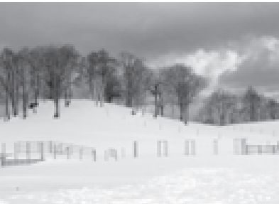
ဂျပန်နိုင်ငံ ဒေသအများအပြားတွင် ၂၀၀၆ ခုနှစ် ဇန်နဝါရီလဆန်းမှစ၍ ဆီးနှင်းများ ထူထပ်စွာ ကျဆင်းခဲ့သည်ကို ဤသို့ တွေ့ရှိရသည်။

နိုင်ငံယူနန်ပြည်နယ် ဟီကွေရိုင်းကို ဆက်သွယ်ဖောက်လုပ် မည်ဖြစ်ပြီး ၂၀၀၇ ခုနှစ်၌ တည်ဆောက်မူပြီးစီးမည်ဖြစ်သည်။ * ဘရာဇီးနိုင်ငံသား ဒုတိယပိုလ်ဗျူးပြီး မားကီဗွန်တက်စ်သည် ဘရာဇီးနိုင်ငံ၏ ပထမဆုံးသော အာကာသယာဉ်မှူးအဖြစ် မတ် ၃၀ ရက်က ကာဇော့စတန်နိုင်ငံ ဘိုင်းကိုဇော အာကာသ စခန်းမှ ရုရှားလုပ် ဆိုယုစီဒုံးပျံယာဉ်ဖြင့် အာကာသသို့ သွားရောက်နိုင်ခဲ့သည်။ ဧပြီ * အီဂျစ်နိုင်ငံ အနောက်ပိုင်းဒေသတွင် အင်အားပြင်း ငလျင်လှုပ်မှု ကြောင့် လူ ၇၀ သေဆုံးပြီး ၁၂၀၀၀ ခန့် ဒဏ်ရာရရှိခဲ့ကြောင်း ငလျင်အင်အားမှာ ရစ်ချီတာစကေး ၆.၃ သမ ၂ ရှိကြောင်း