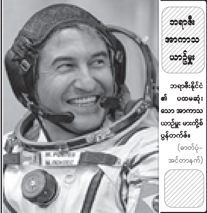
ဘရာဇီး အာကာသ ယာဉ်မှူး ဘရာဇီးနိုင်ငံ၏ ပထမဆုံး သော အာကာသ ယာဉ်မှူး ဟာ့စ်မိုး ဖွန်တက်စ်

၂၀၀၆ ခုနှစ်သည် မကြာမီအချိန်အတွင်း ကုန်ဆုံးတော့မည်။ တစ်နှစ်တာကာလအတွင်း ကမ္ဘာ့သတင်းများ အများအပြားဖြစ်ပေါ်ခဲ့သည်။ ၂၀၀၆ ခုနှစ် ပြည်ပိုးကားအမျှတွင် တစ်နှစ်အတွင်း ဖြစ်ပျက်ခဲ့သော စိတ်ဝင်စားဖွယ် ထူးခြားသတင်းအချို့တို့ကို လစဉ်အလိုက်စုစည်းပြီး မြန်မာ့အလင်း နိုင်ငံခြားသတင်း စာတည်းအဖွဲ့က စုစည်းဖော်ပြလိုက်ပါသည်။