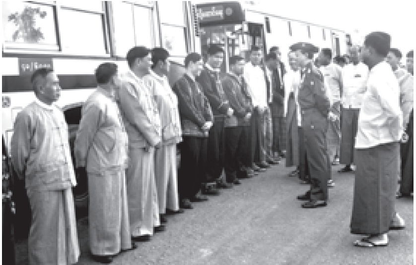
ရင်းရင်းနှီးနှီးပို့ဆောင်နှုတ်ဆက်

အမျိုးသားညီလာခံကျင်းပရေးကော်မရှင်ဥက္ကဋ္ဌ ဒုတိယဗိုလ်ချုပ်ကြီးသိန်းစိန် အမျိုးသားညီလာခံအောင်မြင်စွာကျင်းပပြီးစီး၍ ခေတ္တရပ်နားချိန်၌ ညောင်နုစံပင်စခန်းမှ မိမိတို့နေထိုင်ရာ နေရပ်များသို့ ပြန်လည်ထွက်ခွာကြမည့် ပြည်နယ်နှင့်တိုင်းများမှ အမျိုးသားညီလာခံ ကိုယ်စားလှယ်များအား ရင်းရင်းနှီးနှီးပို့ဆောင်နှုတ်ဆက်စဉ်။