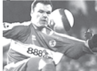
မစ်ဒယ်ဘရော့တိုက်စစ်မှူး မတ်စ်ဗီဒူကာ။ (ဓာတ်ပုံ-အင်တာနက်)

မစ်ဒယ်ဘရော့အသင်းအနေဖြင့် မတ်စ်ဗီဒူကာနှင့် စာချုပ်သစ်ချုပ်ဆိုရေးကိစ္စကို စတင်ဆွေးနွေးမည်ဖြစ်ကြောင်း အသင်းနည်းပြ ဆောက်ဂိတ်က အနိုင်အစာပြောကြားလိုက်သည်။