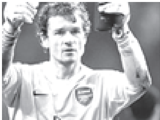
အာဆင်နယ်သို့သမား ဂျင်းစ်လေးမန်း။ (ဓာတ်ပုံ-အင်တာနက်)

အာဆင်နယ်သို့သမား ဂျင်းစ်လေးမန်းသည် အာဆင်နယ်က စာချုပ်သစ်ချုပ်ဆိုရေး ကမ်းလှမ်းလိမ့်မည် ဖြစ်ကြောင်း၊ စပိန်နှင့် ဂျာမနီကလပ်များသို့ ပြောင်းရွှေ့ရန် မရှိကြောင်း ၎င်းက ပြောကြားလိုက်သည်။