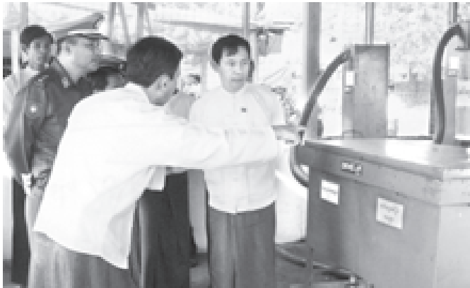
ပြည်ထောင်စုကြံ့ခိုင်ရေးနှင့် ဖွံ့ဖြိုးရေးအသင်း ဗဟိုအလုပ်အမှုဆောင် စွမ်းအင်ဝန်ကြီးဌာန ဒုတိယဝန်ကြီး ဗိုလ်မှူးချုပ်သန်းဌေးနှင့် ပဲခူးတိုင်း အေးချမ်းသာယာရေးနှင့်ဖွံ့ဖြိုးရေးကောင်စီ ဒုတိယဥက္ကဋ္ဌ ဗိုလ်မှူးကြီးစိန်မြင့်တို့ ရွှေတောင်မြို့ နားဖြူကုန်းကျေးရွာအုပ်စု စပါးခွဲလောင်စာသုံး လျှပ်စစ်ဓာတ်အားပေးစက်ရုံကို ကြည့်ရှုစစ်ဆေးစဉ်။ (စွမ်းအင်)