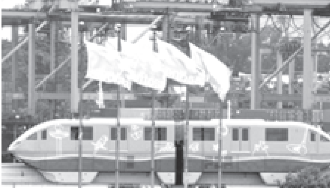
စင်ကာပူနိုင်ငံ ဆန်တိုဆာကွန်းအပန်းဖြေခရီးရှိ ကွန်တိန်နာဆိပ်ကမ်း၌ လျှပ်စစ်သံလိုက် ရထားတစ်စင်း ခုတ်မောင်းပြေးဆွဲလျက်ရှိသည်ကို ဒီဇင်ဘာ ၂၃ရက်က တွေ့ရစဉ်။