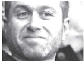
ချယ်လ်ဆီးအသင်းပိုင်ရှင် အော့ဂာမိုဗစ်ချ်။

ယူအီးအက်စ်အေအနေဖြင့် ချွမ်းသာသူများ ရင်းနှီးမြှုပ်နှံမှုကို ထိန်းချုပ်ခြင်းဖြင့် ဘောလုံးကို ဂိုဏ်းပွဲဖြင့် စေ့ရန် ပြုလုပ်ဖွယ်ရှိသည်။