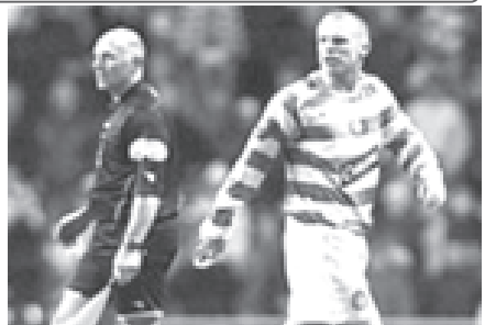
ဆဲလ်တစ်အသင်းခေါင်းဆောင် နီးလ်လီနွန်။

လီနွန်သည် ဖာလ်ကက်နှင့်ပွဲတွင် အင်တိုနီစတိုကတ်အား ကြမ်းတမ်းစွာကစားခဲ့မှုကြောင့် ပွဲပယ်ပြစ်ဒဏ်ခံရခြင်းဖြစ်ပြီး ယခုအခါ နှစ်သစ်တွင် ပြန်ကစားနိုင်မည်ဖြစ်သည်။ (အင်တာနက်)