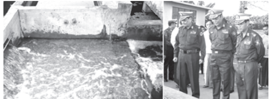
ကာကွယ်ရေးဝန်ကြီးဌာနမှ ဒုတိယဗိုလ်ချုပ်ကြီးမြင့်ဆွေနှင့် တာဝန် ရှိသူများ ရေဆိုးသန့်စင်စက်ရုံကို ကြည့်ရှုစစ်ဆေးကြစဉ်။

ရန်ကုန်မြို့တော်တွင် မိလ္လာစွန့်ပစ် စနစ်ကို ယခင်က မိရိုးဖလာနည်းဖြင့် စွန့်ပစ်နေခဲ့ရာမှ ပတ်ဝန်းကျင် ညစ်ညမ်းမှုဖြစ်သည့်အတွက် ၁၈၈၇ ခုနှစ်တွင် မိလ္လာစွန့်ပစ်စနစ်ကို စတင် တည်ဆောက်ခဲ့ပြီး ၁၈၈၈ခုနှစ်တွင်