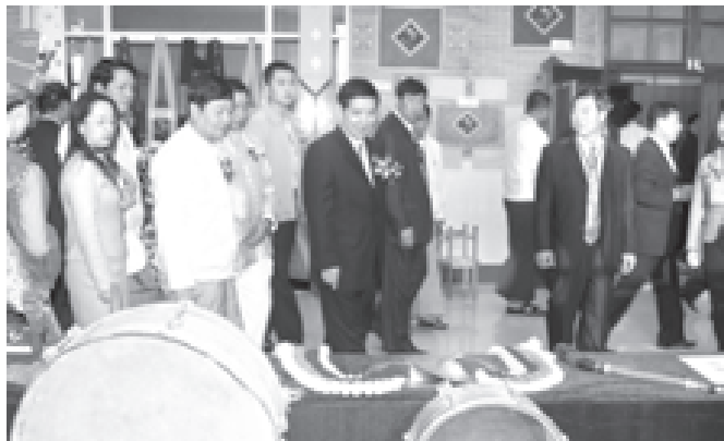
စီးပွားရေးနှင့် ကုသသုံးရောင်းဝယ်ရေးဝန်ကြီးဌာန ဝန်ကြီး ဗိုလ်မှူးချုပ်တင်နိုင်သိန်းနှင့် ချစ်ကြည်ရေး ကိုယ်စားလှယ်အဖွဲ့ဝင်များ နှစ်(၅၀)မြောက် မြန်မာ-တရုတ် တွေ့ဆုံပွဲတော်အထိမ်းအမှတ်ပြုတိုက်အတွင်း ကြည့်ရှု လေ့လာကြစဉ်။ (သတင်းစဉ်)

ဤကဲ့သို့ နှစ်ဖက်ခေါင်းဆောင် များ အပြန်အလှန် လှည့်ပတ်ခြင်းမှ