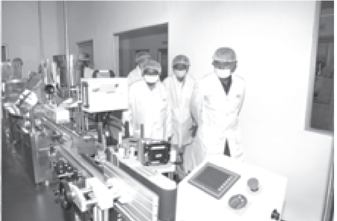
နိုင်ငံတော်အေးချမ်းသာယာရေးနှင့်ဖွံ့ဖြိုးရေးကောင်စီဝင် ဗိုလ်ချုပ်ကြီး သုရှေမန်း ပြင်ဦးလွင်ဆေးဝါးစက်ရုံတွင် ကြည့်ရှုစစ်ဆေးစဉ်။ (သတင်းစဉ်)

ထို့နောက် ဗိုလ်ချုပ်ကြီးသုရှေမန်းနှင့် အဖွဲ့ဝင်များသည် အမှတ်(၁) စက်မှုဝန်ကြီးဌာန မြန်မာ့ဆေးဝါးနှင့်အိမ်သုံးပစ္စည်းလုပ်ငန်း ပြင်ဦးလွင် ဆေးဝါး စက်ရုံ(စီမံကိန်း)သို့ ရောက်ရှိကြရာ စီမံကိန်းရင်းလင်းဆောင်၌ အမှတ်(၁) စက်မှုဝန်ကြီးဌာန ဝန်ကြီး ဦးအောင်သောင်းက နိုင်ငံတော်အကြီးအကဲ ဗိုလ်ချုပ်မှူးကြီးသန်းရွှေ ဤစီမံကိန်းသို့ လာရောက် ကြည့်ရှုစစ်ဆေးစဉ် စီမံကိန်း လုပ်ငန်းများကို ၂၀၀၆ခုနှစ် ဒီဇင်ဘာလတွင် အားလုံးပြီးစီးအောင် ဆောင်ရွက် ရန်၊ ဆေးဝါးများကို ဆေးညွှန်းများနှင့်အညီ တိကျစွာထုတ်လုပ်ရန်၊ ဆေးဝါး များ၏ အရည်အသွေးအဆင့်အတန်းမြင့်မားအောင် အလေးထားဂရုပြုရန်ဖြစ် သကဲ့သို့ ကုန်ထုတ်လုပ်မှုကုန်ကျစရိတ်ကို လျော့ကျအောင်ဆောင်ရွက်ရန်၊ ဆေးသုတေသနဦးစီးဌာန(အထက်မြန်မာပြည်)နှင့် ပူးပေါင်း၍ အစွမ်းထက်မြက် သော မြန်မာ့တိုင်းရင်းဆေးဝါးများကို အဆင့်အတန်းရှိရှိ ထုတ်လုပ်ရန်စသည့် လမ်းညွှန်ချက်များနှင့်စပ်လျဉ်း၍ အကောင်အထည်ဖော်ဆောင်ရွက်ချက်များကို ရှင်းလင်းတင်ပြသည်။