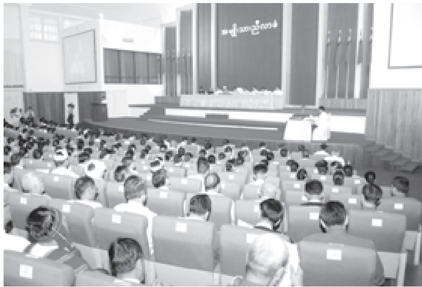
အမျိုးသားညီလာခံ စုံညီအစည်းအဝေးကို ရန်ကုန်တိုင်း မှော်ဘီမြို့နယ် ညောင်နှစ်ပင်စခန်းရှိ ပြည်ထောင်စုခန်းမ၌ ကျင်းပစဉ်။ (သတင်းစဉ်)

ရန်ကုန် ၁၁ ဇန်နဝါ ၂၀ အမျိုးသားညီလာခံ စုံညီ အစည်းအဝေးကို ယနေ့နံနက် ၉ နာရီက ရန်ကုန်တိုင်း မှော်ဘီမြို့နယ် ညောင်နှစ်ပင်စခန်းရှိ ပြည်ထောင်စုခန်းမ၌ ကျင်းပရာ နိုင်ငံတော်ဖွဲ့စည်းပုံအခြေခံဥပဒေရေးဆွဲရာတွင် ပါဝင်မည့် ဖွဲ့စည်းပုံအခြေခံဥပဒေအစည်းအဝေး နိုင်ငံတော်အလံ၊ အထိမ်းအမှတ်တံဆိပ်၊ သီချင်းနှင့် ဖြူတော်အခန်း၊ ကူးပြောင်းရေးကာလပြဋ္ဌာန်းချက်များအခန်းနှင့် အထွေထွေပြဋ္ဌာန်းချက်များ အခန်းတို့အတွက် ချမှတ်သင့်သည့် အသေးစိတ်အခြေခံရမည့်မှုများနှင့်စပ်လျဉ်း၍ နိုင်ငံရေးပါတီများမှ ကိုယ်စားလှယ်များအစုအဖွဲ့တွင် ပါဝင်သော တိုင်းရင်းသားစည်းလုံးညီညွတ်ရေးပါတီ၊ ပြည်ထောင်စုပုဒ်မအမျိုးသားအဖွဲ့ချုပ်၊ ရှမ်းပြည် ကိုးကန့် ဒီမိုကရက်တစ်ပါတီနှင့် မြို့(ခေါ်)ခမီ အမျိုးသားညီညွတ်ရေး အဖွဲ့တို့မှ အကြံပြုချက်စာတမ်းများကို ကိုယ်စားလှယ်လေးဦးတို့က ပတ်ကြားတင်ပြကြသည်။ တက်ရောက် ယနေ့ကျင်းပသည့် အမျိုးသားညီလာခံ စုံညီအစည်းအဝေးသို့ အမျိုးသားညီလာခံကျင်းပရေးကော်မရှင်ဥက္ကဋ္ဌ နိုင်ငံတော်အေးချမ်းသာယာရေးနှင့် ဖွံ့ဖြိုးရေးကောင်စီ အတွင်းရေးမှူး(၁) ဒုတိယဗိုလ်ချုပ်ကြီးသိန်းစိန်နှင့် ကော်မရှင်အဖွဲ့ဝင်များ၊ အမျိုးသားညီလာခံကျင်းပရေး လုပ်ငန်းကော်မတီဥက္ကဋ္ဌ တရားသူကြီးချုပ် ဦးအောင်တိုးနှင့် လုပ်ငန်းကော်မတီအဖွဲ့ဝင်များ၊ အမျိုးသားညီလာခံကျင်းပရေး စီမံခန့်ခွဲမှုကော်မတီဥက္ကဋ္ဌ စာရင်းစစ်ချုပ် ဗိုလ်ချုပ်လွန်းမောင်နှင့် စီမံခန့်ခွဲမှု ကော်မတီအဖွဲ့ဝင်များ၊ ဆပ်ကော်မတီ အသီးသီးတို့မှ ဥက္ကဋ္ဌများနှင့် တာဝန်ရှိသူများ၊ နိုင်ငံရေးပါတီများဖြစ်ကြသည်။ စာမျက်နှာ ၅ ကော်လံ ၁