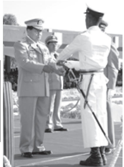
တပ်မတော်ကာကွယ်ရေးဦးစီးချုပ် ဗိုလ်ချုပ်မှူးကြီးသန်းရွှေ တပ်မတော် နည်းပညာတက္ကသိုလ် ဗိုလ်လောင်းသင်တန်း အမှတ်စဉ်(၉)မှ စာမေးပွဲထူးချွန်ဆု ရရှိသူ ဗိုလ်လောင်းမှီးဗညားအား ဆုချီးမြှင့်စဉ်။ (သတင်းစဉ်)