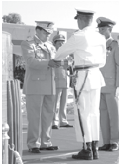
တပ်မတော်ကာကွယ်ရေးဦးစီးချုပ် ဗိုလ်ချုပ်မှူးကြီးသန်းရွှေ တပ်မတော် နည်းပညာတက္ကသိုလ် ဗိုလ်လောင်းသင်တန်း အမှတ်စဉ်(၉)မှ လေ့ကျင့်ရေး ထူးချွန်ဆုရရှိသူ ဗိုလ်လောင်းသိန်းဇော်ညီအား ဆုချီးမြှင့်စဉ်။ (သတင်းစဉ်)