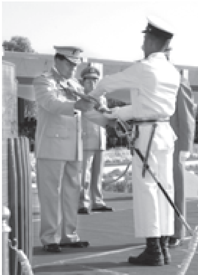
တပ်မတော်ကာကွယ်ရေးဦးစီးချုပ် ဗိုလ်ချုပ်မှူးကြီးသန်းရွှေ တပ်မတော် နည်းပညာတက္ကသိုလ် ဗိုလ်လောင်းသင်တန်း အမှတ်စဉ်(၉)မှ အကောင်းဆုံး အင်ဂျင်နီယာ ဗိုလ်လောင်းဆုရရှိသူ ဗိုလ်လောင်းမှီးဗညားအား ဆုချီးမြှင့်စဉ်။ (သတင်းစဉ်)