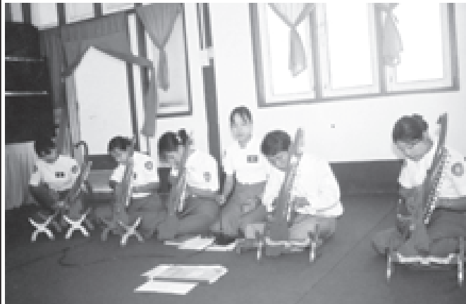
တပ်မတော် အစိုးရလက်ထက်တွင် မည်သည့်ခေတ်အခါကနှင့်မျှ မတူ နယ်စပ်ဒေသများ တည်ငြိမ်အေးချမ်းမှုရရှိလာခဲ့သည်။ တိုင်းရင်းသား လက်နက်ကိုင်အဖွဲ့အစည်းများ လက်နက်ကိုင်လမ်းစဉ်ကို စွန့်လွှတ်၍ ဥပဒေဘောင်အတွင်း ဝင်ရောက်လာကြသည်။ နိုင်ငံတော်အစိုးရ

အဆိုပါ သင်တန်းတစ်ခုချင်းစီ၌ သီးခြားရည်ရွယ်ချက်များရှိနေလင့်ကစား သင်တန်းအားလုံး၏ အနှံ့မရည်မှန်းချက်မှာ နိုင်ငံတော်အစိုးရက အမျိုးသားရေးတာဝန်အဖြစ်ယူ၍ အကောင်အထည်ဖော် ဆောင်ရွက်ပေးနေသည့် နယ်စပ်ဒေသနှင့် တိုင်းရင်းသားလူမျိုးများ ဖွံ့ဖြိုးတိုးတက်ရေး စီမံကိန်း၊ အထူးဒေသကြီး (၂၄)ခု စီမံကိန်း၊ ကျေးလက်ဒေသဖွံ့ဖြိုးရေး လုပ်ငန်းစဉ်ကြီး (၅)ရပ်စီမံကိန်းတို့တွင် ကျရာအခန်းကဏ္ဍမှ တက်ကြွစွာ ပူးပေါင်းပါဝင်ထမ်းဆောင်နိုင်ကြရေး လေ့ကျင့်ပျိုးထောင်ပေးနေခြင်းပင်တည်း။