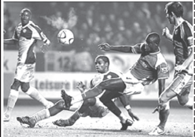
ချာလ်တန်အသင်းမှ အင်ဒီဗာရေ(အလယ်) အကောင်းဆုံးဂိုးသွင်းစွင့်ရသော်လည်း ဂိုးမဝခဲ့ပေ။