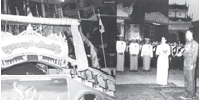
တက်ရောက်

မုခ်ဦးဖွင့်ပွဲ မော်လမြိုင်မြို့ သမိုင်းဝင်ကျက်သလ္လံစေတီတော်မြတ်ကြီး၏ ပရိသတ်အတွင်း ငွေကျပ်သိန်း ၃၀၀ကျော် အကုန်အကျခံတည်ဆောက်ပြီးစီးခဲ့သည့် ရွှေသာလျောင်းဘုရားကိန်းဝပ်စံပယ်တော်မူသော ရွှေသာလျောင်း ဝတ်တော်ကြီး မုခ်ဦးဖွင့်ပွဲ အခမ်းအနားကို ဒီဇင်ဘာ ၄ ရက်က ဘုရားပရိသတ်အတွင်း ကျင်းပရာ မုခ်ဦးဖွင့်ပွဲ အခမ်းအနားသဘာဝရေးနှင့် ဖွံ့ဖြိုးရေးကောင်စီဥက္ကဋ္ဌ အရှေ့တောင်တိုင်းစစ်ဌာနချုပ်တိုင်းမှူး ဗိုလ်မှူးချုပ်သက်နိုင်ဝင်းက စက်စလုတ်နှိပ် ဖွင့်လှစ်ပေးသည်။ (အောက်ပုံ)