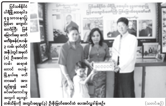
ပြင်သစ်နိုင်ငံ ပါရီမြို့ထေရဝါဒ ဗုဒ္ဓသာသနာ့မြို့ မြန်မာ ကျောင်း တော်ကြီး ဖြစ် ပြောက်ရေး ကော် မတီမှအခွင့်အလမ်း (၈) ဦးအောင်ဘာ လမ်း ဆရာမ တောင် ဗဟန်း မြို့နယ်နေ ဗဟို ရည်စူး၍ မစင် ခင်မော်ကောင်းမှု အတွက် ငွေကျပ် တစ်သိန်းကို အတွင်းရေးမှူး(၃) ဦးစိုးမြတ်အောင်ထံ ပေးအပ်လှူဒါန်းစဉ်။ (သတင်းစဉ်)

နယ်စပ်ဒေသနှင့် တိုင်းရင်းသားလူမျိုးများ ဖွံ့ဖြိုးတိုးတက်ရေးနှင့် စည်ပင်သာယာရေး ဝန်ကြီးဌာနအောက်ရှိ စည်ပင်သာယာရေးအဖွဲ့များသည် ပြည်နယ်နှင့်တိုင်းများရှိ ရေရှားပါးသည့် ကျေးလက်ဒေသများ၌ သန့်ရှင်း သော သောက်သုံးရေ ဖူလုံစွာရရှိရေးကို ဆောင်ရွက်ပေးလျက်ရှိသည်။ စက်ရေတွင်းလှူဒါန်းလိုသော စေတနာရှင်များအနေဖြင့် နှစ်လက်မ စက်ရေတွင်း အနက်ပေ ၂၀၀ တစ်တွင်း စက်ပစ္စည်းစုံ ငွေကျပ် ၅၀၀၀၀၀၊ လေးလက်မစက်ရေတွင်း အနက်ပေ ၂၀၀တစ်တွင်း စက်ပစ္စည်းစုံ ငွေကျပ် ၅၀၀၀၀၀ နှုန်းဖြင့် လှူဒါန်းနိုင်သည်။ စက်ရေတွင်းလှူဒါန်းလိုသူများသည် ညွှန်ကြားရေးမှူးချုပ် ဖုန်း-၀၆၇-၄၀၉၀၂၆၊ ဒုတိယညွှန်ကြားရေးမှူးချုပ် ဖုန်း-၀၆၇-၄၀၉၀၂၇၊ ဒုတိယ ညွှန်ကြားရေးမှူးချုပ်(အင်ဂျင်နီယာ) ဖုန်း-၀၁၁-၂၉၁၉၆၇၊ ညွှန်ကြားရေးမှူး (ဘဏ္ဍာ) ဖုန်း-၀၆၇-၄၀၉၀၂၈၊ ညွှန်ကြားရေးမှူး (စစ်ကိုင်းတိုင်း စည်ပင် သာယာရေးအဖွဲ့) ဖုန်း-၀၇၁-၂၂၇၆၀၊ ညွှန်ကြားရေးမှူး (မကွေးတိုင်း စည်ပင်သာယာရေးအဖွဲ့) ဖုန်း-၀၆၇-၂၃၁၆၄၊ ညွှန်ကြားရေးမှူး(မန္တလေးတိုင်း စည်ပင်သာယာရေးအဖွဲ့) ဖုန်း-၀၇၅-၄၄၅၇၇ တို့သို့ ဆက်သွယ်လှူဒါန်း နိုင်ကြောင်း သိရသည်။ (သတင်းစဉ်)