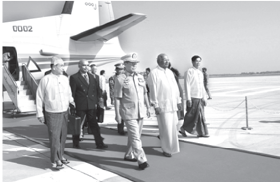
နေပြည်တော် ဒီဇင်ဘာ ၂၀

ပြည်ထောင်စုမြန်မာနိုင်ငံတော် နိုင်ငံတော်ဝန်ကြီးချုပ် ဗိုလ်ချုပ်ကြီး စိုးဝင်း၏ ဖိတ်ကြားချက်အရ ပြည်ထောင်စုမြန်မာနိုင်ငံတော်သို့ အလုပ်သဘော ခရီးလည်ပတ်ရန် သီရိလင်္ကာဒီမိုကရက်တစ် ဆိုရှယ်လစ်သမ္မတနိုင်ငံ ဝန်ကြီးချုပ် မစ္စတာ ရတနာသီရိ ဝစ်ဓရမ်မာနာရာကာ ခေါင်းဆောင်သည့် ကိုယ်စားလှယ်အဖွဲ့ဝင်များသည် ယနေ့နံနက် ၉ နာရီ မိနစ် ၂၀ တွင် အထူးလေယာဉ်ဖြင့် နေပြည်တော်သို့ရောက်ရှိလာကြရာ နိုင်ငံတော်ဝန်ကြီးချုပ် ဗိုလ်ချုပ်ကြီးစိုးဝင်းက နေပြည်တော်လေဆိပ်၌ ကြိုဆိုနှုတ်ဆက်သည်။ (ခုံ)