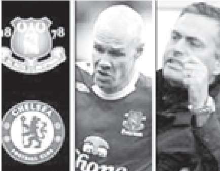
အဲဗာတန်တိုက်စစ်မှူးအား ချယ်လ်ဆီးနည်းပြ မော်ရင်ဟိုက ဤသို့ ဝေဖန်ခဲ့သည်။