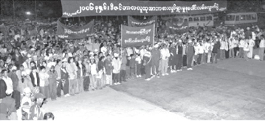
၂၀၀၆ခုနှစ် ဒီဇင်ဘာ တတိယပတ် လူထုအားကစားလှုပ်ရှားမှု စုပေါင်းလမ်းလျှောက်ပွဲကို နေပြည်တော်၌ ကျင်းပရာ မြန်မာနိုင်ငံအိုင်အိုလ်ပစ်ကော်မတီ ဥက္ကဋ္ဌ အားကစားဝန်ကြီးဌာန ဝန်ကြီး ဗိုလ်မှူးချုပ်သူရအေးမြင့်နှင့် ဝန်ကြီးဌာနများမှ ဝန်ထမ်းများ၊ ဝန်ထမ်းမိသားစုများ၊ ဒေသခံပြည်သူများ၊ ဆရာ ဆရာမများ၊ ကျောင်းသားကျောင်းသူများ တပျော်တပါး ပါဝင်ဆင်နွှဲကြသည်။