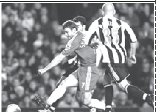
ချယ်လ်ဆီး တိုက်စစ်မှူးရှက်စ်ချင်ကို(လယ်)၏ နယူးကာဆယ်ဘက်သို့ ထိုးဖောက်ကစားမှုကို ဤလို တွေ့ရသည်။ (ဓာတ်ပုံ-အင်တာနက်)

ပွဲချိန် ၄၆မိနစ်တွင် ရိုက်ဖီးလစ်အစား ဒရောကာ၊ ကာဗယ်ဟိုအစား မက်ခီလီလီတို့အစားထိုးဝင်ရောက် ကစားခဲ့သဖြင့် နယူးကာဆယ်ဘက်သို့ ပိုမိုထိုးဖောက်ကစားနိုင်