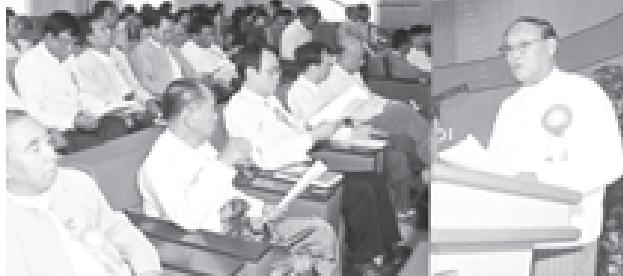
မွေးမြူရေးနှင့် ရေလုပ်ငန်းဝန်ကြီးဌာန မြန်မာနိုင်ငံ ငါးလုပ်ငန်းအဖွဲ့ချုပ်၏ ရန်ကုန်တိုင်း ငါးလုပ်ငန်းအဖွဲ့ချုပ် အဖွဲ့အကြိမ်မြောက် နှစ်ပတ်လည်အစည်းအဝေးအား တက်ရောက် ဦးဆောင်လှုပ် အမှာစကားပြောကြားစဉ်။

အမျိုးသားကန်တော်ကြီးဥယျာဉ်ကို လွန်ခဲ့သော ၁၉၁၅ခုနှစ်မှ စတင်တည်ထောင် ဖွင့်လှစ်ခဲ့ရာ ၂၀၀၆ ခုနှစ် ဒီဇင်ဘာလတွင် စိန်ရတုပွဲတော် ဖြစ်သည်။ အမျိုးသားကန်တော်ကြီးဥယျာဉ် စိန်ရတု ပွဲတော်ကြီးကို စည်ကားသိုက်မြိုက်စွာဖြင့် ဒီဇင်ဘာ ၁၄ ရက်မှ ၂၀၀၇ ခုနှစ် ဇန်နဝါရီ ၁၃ ရက်အထိ တစ်လကြာမျှ ကျင်းပလျက် ရှိသည်။ အမျိုးသားကန်တော်ကြီးဥယျာဉ် စိန်ရတုပွဲတော်နှင့်အတူ မြန်မာနိုင်ငံတစ်ဝန်းလုံးရှိ အထင်ကရ အထိမ်းအမှတ်များဖြစ်သော ရွှေတိဂုံစေတီတော်၊ သျှစ်သောင်းပုထိုးတော်၊ ကျိုက်ထီးရိုးစေတီတော်၊ ခါကာဘိုရာဇီတောင်၊ ဇွဲကပင်တောင်၊ ချောင်းသာကမ်းခြေအလှ၊ ရေနံမြေ၊ ရိဒ်ရေကန်၊ မြန်မာ့စံတံဆိပ်ရောင်းတော်၊ ကမ္ဘောဇသောဒီဇန်းတော် စသည်ဖြင့် တရုတ်စည်းတည်း တည်ဆောက်ထား၍ အမျိုးသားအထိမ်းအမှတ် ဥယျာဉ်ကြီးကိုလည်း ယှဉ်တွဲဖွင့်လှစ်မည်ဖြစ်သည်။ ထို့အပြင် ပထမအကြိမ်အဖြစ် ကျင်းပသော ပန်းပွဲတော်ကြီးကိုလည်း အဆိုပါအမျိုးသား ကန်တော်ကြီးဥယျာဉ် စိန်ရတုပွဲတော်နှင့်အတူ ခင်းကျင်းဖွင့်လှစ်ပြသရန် စီစဉ်ထားသည်။ ယင်းပန်းပွဲတော်ကြီးတွင် ပြည်တွင်း၊ ပြည်ပမှ ရှားပါးသစ်စွဲပန်းများ၊ ရာသီအလျောက် မွေးဖြူသည့် ရာသီပန်းမန်များ အပါအဝင် ပန်းပေါင်းနှစ်သန်းကျော်ကို ရုပ်လုံးရုပ်ကြွများအဖြစ် ဖန်တီး၍ ပြသထားသည်။ ယင်းပန်းပွဲတော်ကြီးနှင့်အတူ ဂီတဖျော်ဖြေ တင်ဆက်မှုများကိုလည်း အထူးခြားဆုံး ဖြစ်အောင် စီစဉ်ဆောင်ရွက်ထားသည်။ သို့ဖြစ်၍ ပြင်ဦးလွင် အမျိုးသားကန်တော်ကြီးဥယျာဉ် စိန်ရတုပွဲတော်သည် ပြည်တွင်း၊ ပြည်ပ ခရီးသွားများအတွက် လေ့လာစရာ၊ အပန်းဖြေစရာ၊ ဗဟုသုတများ တိုးပွားစရာ ပွဲတော်ကြီးအဖြစ် ရေးသားလိုက်ရပါသည်။