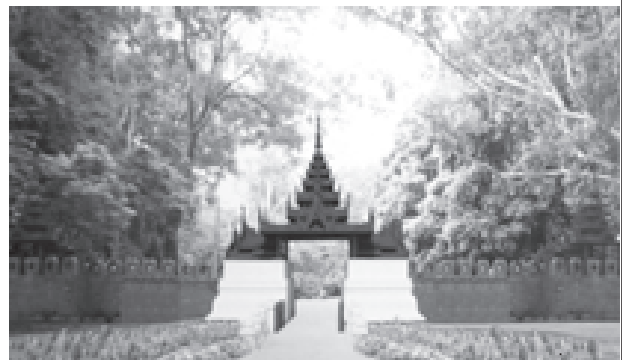
ပြင်ဦးလွင် အမျိုးသားကန်တော်ကြီးဥယျာဉ် ပန်းပွဲတော်အတွင်း တွေ့ရသော ပန်းများဖြင့် ပုံဖော်ပြုလုပ်ထားသည့် မြန်မာ့စံကျော် နန်းဖြူရိုးပုံကို ဤသို့လှပစွာ ဖော်ကျူးထားသည်။ (ဗြိတိသျှအလင်း)

ဥယျာဉ်ကြီးအတွင်း ကျောက်တောင်ပုံဥယျာဉ်အဝင်ဝတွင် ရှားပါးသော ကျောက်ဖြစ်ရုပ်ကြွင်းအကြွင်းကျောက်တိုင်ကြီးနှစ်တိုင် ဖိုက်ထူ၍ ပေအရှည် ၆၂၀ရှိ လျှောက်လမ်းအတွင်း ကျောက်ကပ်ပန်းများ၊ အပင်များ၏ ပသာဒအလှကို တစ်ဝကြီး ကြည့်ရှုခံစားနိုင်ကြသည်။ ထို့ပြင် အမျိုးသားကန်တော်ကြီး ဥယျာဉ်အတွင်း သဘာဝရေထွက် ရွှံ့နှံ့တောတွင်းလူသွားလမ်းအလျားပေ ၁၀၆၀ ရှိ စကြိုလမ်းအတိုင်း သဘာဝ ပေါက်ပင်ကြီးများ၊ နွယ်ပင်များ၊ ဆေးဖက်ဝင်ပင်များနှင့် ရွှံ့နှံ့များကို