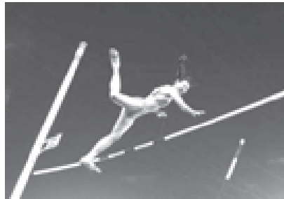
အမျိုးသမီး တုတ်ထောက်ခုန်ပြိုင်ပွဲတွင် ရွတ်ဆိပ်ဆွတ်ခူးသွားသော တရုတ်မှ ဂါအို၏ ပြိုင်ပွဲဝင်ဟန်။ (ဓာတ်ပုံ-အင်တာနက်)

အမျိုးသမီး မိတာ၁၅၀၀ မြေပွဲတွင် ဘာရိုနိုးမှ မာရစ်ယူဆွပ်ကူမားလ်သည် ရွတ်ဆိပ်ဆွတ်ခူးနိုင်ခဲ့သည်။ ၎င်းသည် လွန်ခဲ့သောနှစ်ရက်က မိတာ၈၀၀ မြေပွဲတွင်လည်း ရွတ်ဆိပ်ဆွတ်ခူးထားသည်။