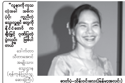
“လူနာကို ကူသည့်အခါ အဓိက ဖုံးရိုး ကူညီတဲ့ သွေးလှူရှင် တွေကို နိုင်ငံတော် က နှိုးမြှား ဂုဏ်ပြုတဲ့ ပွဲလည်း ဖြစ်ပါတယ်”

ဖြစ်သည်။ အကြိမ်(၃၀)မြောက် သွေး လှူရှင်များ ဂုဏ်ပြုပွဲအခမ်းအနားကို ရန်ကုန်မြို့၊ သုနာပြုကဏ္ဍသိုလ်ဝင်း ခန်းမဆောင်ကြီး၌ ဒီဇင်ဘာ ၁၄ ရက် က ကျင်းပရာ မြန်မာ့အသံ သတင်း အဖွဲ့က တာဝန်ရှိသူများနှင့် ဂုဏ်ပြုခံ သွေးလှူရှင် အချို့တို့အား တွေ့ဆုံ မေးမြန်းခဲ့ရာမှ ရရှိခဲ့သည်။