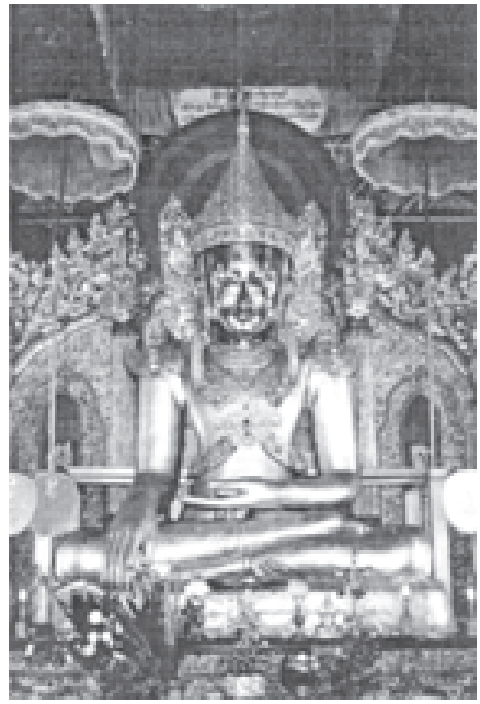
ဆုတောင်းပြည့် မဟာမြတ်မုနိဘုရားကြီး (ကျိုင်းတုံ)

မြတ်စွာဘုရားသည် စန္ဒသူရိယမင်း၏ လျှောက်ထားတောင်းပန်သဖြင့် ရုပ်ရည်တော် သွန်းလုပ်နေစဉ်ကာလတွင် သီရိဂုတိတောင်ပေါ်ရှိ မဏ္ဍပ်၌ သီတင်းသုံးတော်မူသည်။ အဓိကမင်းမြို့ရွင်းသော သက္ကရာဇ်