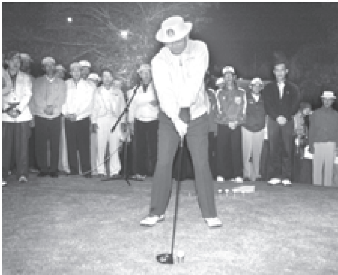
၂၀၀၆ခုနှစ် နိုင်ငံတော်အားချမ်းသာယာရေးနှင့် ဖွံ့ဖြိုးရေးကောင်စီ ဥက္ကဋ္ဌဖလား ဂေါက်သီးရိုက်ပြိုင်ပွဲကို နိုင်ငံတော်အားချမ်းသာယာရေးနှင့် ဖွံ့ဖြိုးရေးကောင်စီ အတွင်းရေးမှူး(၁) ဒုတိယဗိုလ်ချုပ်ကြီးသိန်းစိန် Tracer Ball ကို ရိုက်၍ ပြိုင်ပွဲကွက်လွှတ်ပေးစဉ်။

၂၀၀၆ခုနှစ် နိုင်ငံတော်အားချမ်းသာယာရေးနှင့် ဖွံ့ဖြိုးရေးကောင်စီ ဥက္ကဋ္ဌဖလား ဂေါက်သီးရိုက်ပြိုင်ပွဲ ဖွင့်ပွဲအခမ်းအနားကို ဒီဇင်ဘာ ၉ရက် နံနက် ၅နာရီ မိနစ် ၄၀တွင် အဆိုပါ ရေတ်ချွန်တောင်ဂေါက်ကွင်း၌ ကျင်းပရာ အစီအစဉ်အရ ဂေါက်သီးရိုက်ပြိုင်ပွဲဝင် အသင်း ၃၄ သင်းတို့မှ ဂေါက်သီးရိုက် အားကစားသမားများ သည် သတ်မှတ်နေရာ အသီးသီးတို့၌ နေရာယူကြသည်။