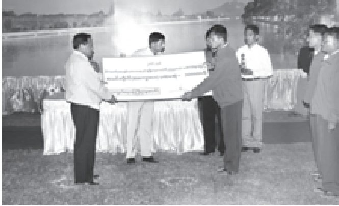
နိုင်ငံတော် အားချမ်းသာယာရေးနှင့် ဖွံ့ဖြိုးရေးကောင်စီဝင် ကာကွယ်ရေးဝန်ကြီးဌာနမှ ဒုတိယဗိုလ်ချုပ်ကြီးရဲမြင့် အသင်းလိုက် (အကျောပေး)ပြိုင်ပွဲတွင် ပထမဆုရ ကာကွယ်ရေးဝန်ကြီးဌာန အသင်းအား ဆုပေးအပ်ချီးမြှင့်စဉ်။ (သတင်းစဉ်)

အခမ်းအနားအပြီးတွင် အတွင်းရေးမှူး(၁)နှင့် အဖွဲ့ဝင်များသည် ၂၀၀၆ ခုနှစ် နိုင်ငံတော်အားချမ်းသာယာရေး