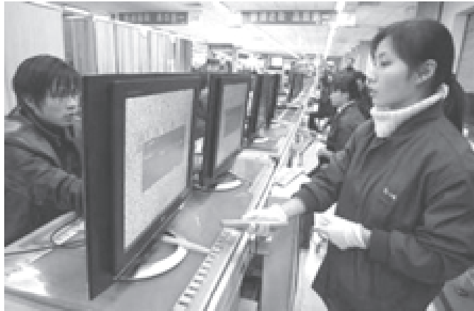
တရုတ်နိုင်ငံအရှေ့ပိုင်း ကျန်ဆုပြည်နယ်ရှိ ရုပ်မြင်သံကြားထုတ်လုပ်သည့် စက်ရုံ၏ လုပ်ငန်းရှင် တစ်ဦးက ဒီဇင်ဘာ ရက်က တွေ့ရစဉ်။