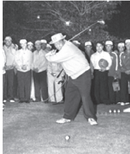
နိုင်ငံတော် အားချမ်းသာယာရေးနှင့် ဖွံ့ဖြိုးရေးကောင်စီဝင် ကာကွယ်ရေးဝန်ကြီးဌာနမှ ဒုတိယဗိုလ်ချုပ်ကြီးရဲမြင့် Tracer Ball ကို ရိုက်၍ ပြိုင်ပွဲကွက်လွှတ်ပေးစဉ်။

ယင်းနောက် နိုင်ငံတော်အားချမ်းသာယာရေးနှင့် ဖွံ့ဖြိုးရေးကောင်စီ ဥက္ကဋ္ဌ ဗိုလ်ချုပ်မှူးကြီးသန်းရွှေ ကိုယ်စား