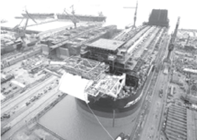
တရုတ်နိုင်ငံရှန်ဟိုင်းမြို့တွင် တန်ချိန် ၃၀၀၀၀၀ရှိ ကုန်တင်သင်္ဘောတစ်စင်းကို ဒီဇင်ဘာရက်က တွေ့ရစဉ်။