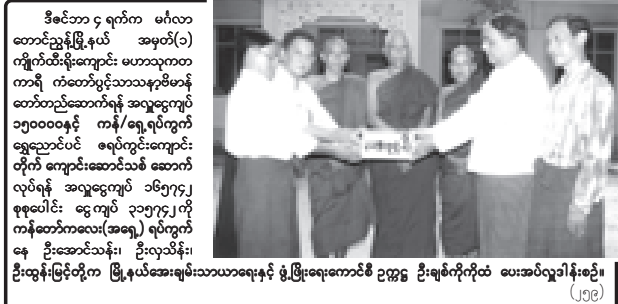
ဒီဇင်ဘာ ၉ ရက်က မြန်မာ့အသံအဖွဲ့သည် နိဗ္ဗာန်ရောက်အောင် အသံအဖွဲ့ကို ကျင်းပမည်ဖြစ်ပြီး ငွေကြေးများကို နှစ်ရက်ကြာမျှ မရရှိနိုင်ပါ။

ရန်ကုန် ဒီဇင်ဘာ ၉ ၂၀၀၆ခုနှစ် (၄၇)ကြိမ်မြောက် တပ်မတော်ကာကွယ်ရေးဦးစီးချုပ်ဖလား တပ်မတော်(ကြည်း)ရေလေ)ဘောလုံးပြိုင်ပွဲ ဒုတိယအဆင့် အုပ်စုပတ်လည်ပြိုင်ပွဲများကို သတိမှတ်ထားသည့် အားကစားကွင်းများ၌ ယနေ့ညနေပိုင်းတွင် ဆက်လက်ကျင်းပမည်ဖြစ်သည်။ ရန်ကုန်တိုင်းစစ်ဌာနချုပ် အားကစားကွင်း(မင်္ဂလာဒုံ)၌ ကျင်းပသော ပြိုင်ပွဲတွင် တပ်မတော်(ရေ)အသင်းနှင့် အမှတ်(၇၇)မြေမြန်မာတပ်မတော်အသင်းတို့ ကိုယ်စားပြုသည့် ကွင်းလမ်းအားကစားကွင်း(ကြည်း)မြေမြန်မာတပ်မတော်အသင်းနှင့် ကွင်းလမ်းအားကစားကွင်း(ကြည်း)မြေမြန်မာတပ်မတော်အသင်းတို့ ပြိုင်ပွဲတွင် ရန်ကုန်တိုင်းစစ်ဌာနချုပ်အသင်းက မြောက်ပိုင်းတိုင်း စစ်ဌာနချုပ်အသင်းကို သုံးဂိုး-မိုးဂိုးဖြင့်လည်းကောင်း အသီးသီးယှဉ်ပြိုင်ကစားသွားကြောင်း သတင်းရရှိသည်။