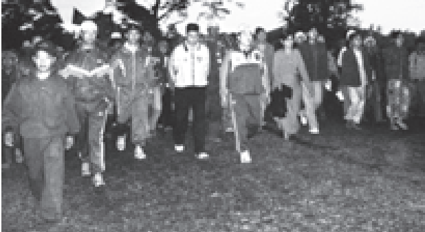
ဒီဇင်ဘာ ၉ ရက်က မြန်မာ့အသံအဖွဲ့သည် နိဗ္ဗာန်ရောက်အောင် အသံအဖွဲ့ကို ကျင်းပမည်ဖြစ်ပြီး ငွေကြေးများကို နှစ်ရက်ကြာမျှ မရရှိနိုင်ပါ။

နေပြည်တော် ဒီဇင်ဘာ ၉ ပြည်သူ့တစ်ရပ်လုံးပါဝင်လှုပ်ရှားသည့် လူထုအားကစား(Mass Sports)ကို မြှင့်တင်ဆောင်ရွက်သွားရန်ဆိုသည့် နိုင်ငံတော်၏ အားကစားဆိုင်ရာ ရွေးချယ်ခန့်မှန်းချက်အရ “ ကျန်းမာကြံ့ခိုင် ဖြည့်စုံသည့် လူထုအားကစား” ဟူသောဆောင်ပုဒ်ဖြင့်ကျင်းပသည့် ၂၀၀၆ခုနှစ် ဒီဇင်ဘာ ဒုတိယပတ် လူထုအားကစားလှုပ်ရှားမှု စုပေါင်းလမ်းလျှောက်ပွဲကို ယနေ့နံနက် ၆ နာရီက နေပြည်တော် မြို့မဈေးရပ်၊ မြန်မာပြည်လမ်းနှင့် သပြေကုန်းရပ်တိုက်ကြားလမ်းပေါ် ဝန်ထမ်းများ၊ ပြည်သူများ စုစုပေါင်းအင်အား တစ်သောင်းနှစ်သောင်းကျော်တို့ တပျော်တပါး ပါဝင်ဆင်နွှဲကြသည်။ နေရာယူ ရှေးဦးစွာ နံနက်၅ နာရီခွဲခန့်တွင် နေပြည်တော် မြို့မဈေးရပ်သို့ ပညာသိဒ္ဓိရပ်ကွက်၊ ဘောကသိဒ္ဓိရပ်ကွက်၊ မင်္ဂလာသိဒ္ဓိရပ်ကွက်တို့ရှိ အိမ်ရာများမှ ဌာနဆိုင်ရာဝန်ထမ်းများ၊ ဝန်ထမ်းမိသားစုများအခြေခံပညာကျောင်းများမှ ဆရာဆရာမများနှင့် ကျောင်းသားကျောင်းသူများ၊ ဒေသခံပြည်သူများ၊ ကုမ္ပဏီဝန်ထမ်းများသည် ၂၀၀၆ခုနှစ် ဒီဇင်ဘာ ဒုတိယပတ် လူထုအားကစားလှုပ်ရှားမှု စုပေါင်းလမ်းလျှောက်ပွဲ လမ်းဖြတ် စာသားပုံစံတောအောက်၌ နေရာယူကြသည်။ စုပေါင်းလမ်းလျှောက် ထိုနေ့က မြန်မာနိုင်ငံအိုလံပစ်