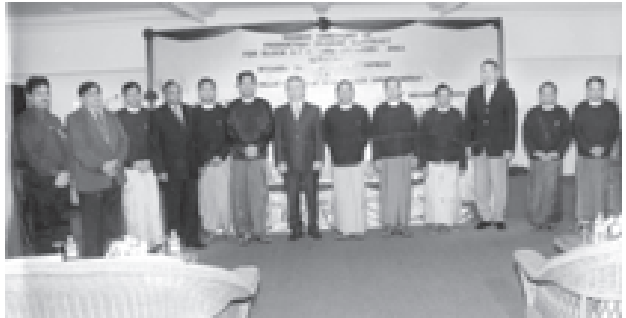
စွမ်းအင်ဝန်ကြီးဌာန မြန်မာ့ရေနံနှင့်သဘာဝဓာတ်ငွေ့လုပ်ငန်းနှင့် အိန္ဒိယနိုင်ငံ GAIL (India) Limited နှင့် စင်ကာပူနိုင်ငံ Silver Wave Energy တို့ ထုတ်လုပ်မှုအပေါ် ခွဲဝေခံစားရေးစာချုပ် လက်မှတ်ရေးထိုးပွဲတွင် တက်ရောက်လာသူများ စုပေါင်းပတ်တစ်တန်းတင်ပတ်ပုံရိပ်ကြည့်စဉ်။ (စွမ်းအင်)

အဆိုပါ ထုတ်လုပ်မှုအပေါ် ခွဲဝေ ခံစားရေးစာချုပ်သည် ရရှိသည့်လွှဲပြောင်း ခွင့်အရ လုပ်ငန်းကို အ-၇အတွင်း ရေနံနှင့် သဘာဝဓာတ်ငွေ့ ရှာဖွေ၊ တူးဖော်၊ ထုတ်လုပ်ရေးလုပ်ငန်းများကို ထုတ်လုပ်မှုအပေါ် ခွဲဝေခံစားရေး အခြေခံမြှင့် အကျိုးတူ ပူးပေါင်းဆောင် ရွက်သွားမည်ဖြစ်ကြောင်း သတင်းရရှိ သည်။ (သတင်းစဉ်)