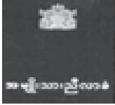
ရန်ကုန် ဒီဇင်ဘာ ၇

ရန်ကုန်တိုင်း မော်ဘိုဖြိုနယ် ညောင်နုစံပင်စခန်း၌ ၂၀၀၆ခုနှစ် ဒီဇင်ဘာ ၇ ရက်က ကျင်းပသော အမျိုးသားညီလာခံ နည်းစည်းအစည်းအဝေး၌ နိုင်ငံတော်ပွဲစဉ်ပုံအခြေခံဥပဒေဆွေးနွေးရာတွင်ပါဝင်ခဲ့သည့် ရွေးကောက်တင်မြှောက်ခြင်းအခန်း၊ နိုင်ငံရေး ပါတီများအခန်းနှင့် အရေးပေါ်ကာလဆိုင်ရာ ပြဋ္ဌာန်းချက်များအခန်းတို့အတွက် ချမှတ်သင့်သည့် အသေးစိတ်အခြေခံရမည့် မူများနှင့်စပ်လျဉ်း၍ အမျိုးသားညီလာခံ နည်းစည်းအစည်းအဝေးသို့တင်ပြသည့် အလုပ်သမားကိုယ်စားလှယ်များ အစုအဖွဲ့၏ အကြံပြုချက်စာတမ်းမှာ အောက်ပါအတိုင်းဖြစ်ပါသည်။