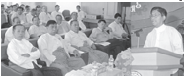
ဦးစီးချုပ်က နိုင်ငံတော်အာဏာကျင့်သုံးနေတဲ့ ကာလအတွက်ဖြစ်စေ၊ အမျိုးသားကာကွယ်ရေးနှင့် လုံခြုံရေးကောင်စီက နိုင်ငံတော်အာဏာကို ကျင့်သုံးနေတဲ့ကာလအတွက်ဖြစ်စေ၊ တာဝန်ယူဆောင်ရွက်ကြတဲ့ နယ်ဘက်ဆိုင်ရာ အာဏာပိုင်အဖွဲ့အစည်းဝင်များ၊ စစ်ဘက်ဆိုင်ရာ အဖွဲ့အစည်းဝင်များနဲ့ စစ်ဘက်၊ နယ်ဘက် ဝန်ထမ်းများရဲ့ ဥပဒေနဲ့အညီ ဆောင်ရွက်ချက်များကို တရားဝင် အတည်ပြုဖြစ်စေသင့်ပါတယ်။ သို့ပါ၍-

“၂၃။ အရေးပေါ်အခြေအနေ ထုတ်ပြန်ကြေညာထားတဲ့ ကာလအတွင်းတွင် နိုင်ငံတော်သမ္မတကိုယ်စားဖြစ်စေ၊ တပ်မတော်ကာကွယ်ရေးဦးစီးချုပ်က နိုင်ငံတော်အာဏာကို ကျင့်သုံးနေသည့် ကာလအတွင်းဖြစ်စေ၊ အမျိုးသားကာကွယ်ရေးနှင့် လုံခြုံရေးကောင်စီက နိုင်ငံတော်အာဏာကို ကျင့်သုံးနေသည့် ကာလအတွင်းဖြစ်စေ လုံခြုံရေး၊ တည်ငြိမ်ရေး၊ ရပ်ရွာအေးချမ်းသာယာရေးနှင့် တရားဥပဒေနဲ့စိုးမိုးရေးတို့ကို ဖုလအခြေအနေသို့ အမြန်ပြန်လည်ရောက်ရှိရေးနှင့် လိုအပ်သည့် အရေးယူဆောင်ရွက်မှုပြုနိုင်ရန် လုပ်ပိုင်ခွင့်နှင့် တာဝန်များ ပေးအပ်ခြင်းရသည့် အာဏာပိုင်အဖွဲ့အစည်းတစ်ရပ်ရပ်၊ ယင်းအဖွဲ့အစည်းဝင် တစ်ဦးဦး၊ နယ်ဘက် ဝန်ထမ်းအဖွဲ့အစည်းတစ်ရပ်ရပ်၊ ယင်းအဖွဲ့အစည်းဝင် တစ်ဦးဦး၊ စစ်ဘက်ဆိုင်ရာ အဖွဲ့အစည်းတစ်ရပ်ရပ်၊ ယင်းအဖွဲ့အစည်းဝင် တစ်ဦးဦး၏ တရားဝင်ဆောင်ရွက်ချက်များသည် အတည်ဖြစ်စေရမည်။ ယင်းတရားဝင်ဆောင်ရွက်ချက်များအပေါ် အကြောင်းပြုလျက် တရားခွင့်ဆိုခွင့် မရှိစေ”