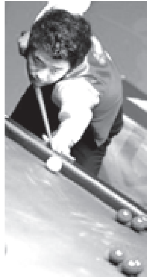
တရုတ်ဇန်နဝါရီလကစားသမား တန်ပင်ဖိုင်၏ ယှဉ်ပြိုင်မှုကို ဤသို့တွေ့ရသည်။